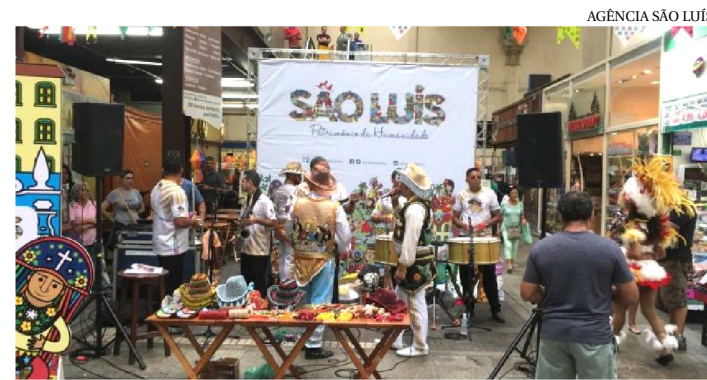
AGÊNCIA SÃO LUÍS