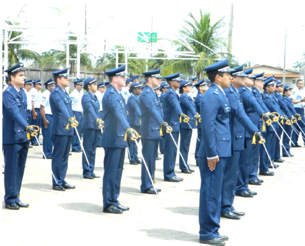
A INSCRIÇÃO PARA O SELETIVO É GRATUITA E OCORRE DE 8 DE ABRIL A 21 DE ABRIL

O processo seletivo consiste de inscrição on-line no site