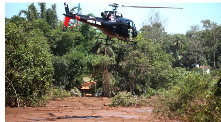
O RIO PARAÓPEBA FOI TOMADO PELA LAMA DE REJEITOS

A Defesa Civil de Minas Gerais atualizou para 224 o número de mortes confirmadas após o rompimento de uma barragem de rejeitos da mineradora Vale em Brumadinho, na região metropolitana de Belo Horizonte.