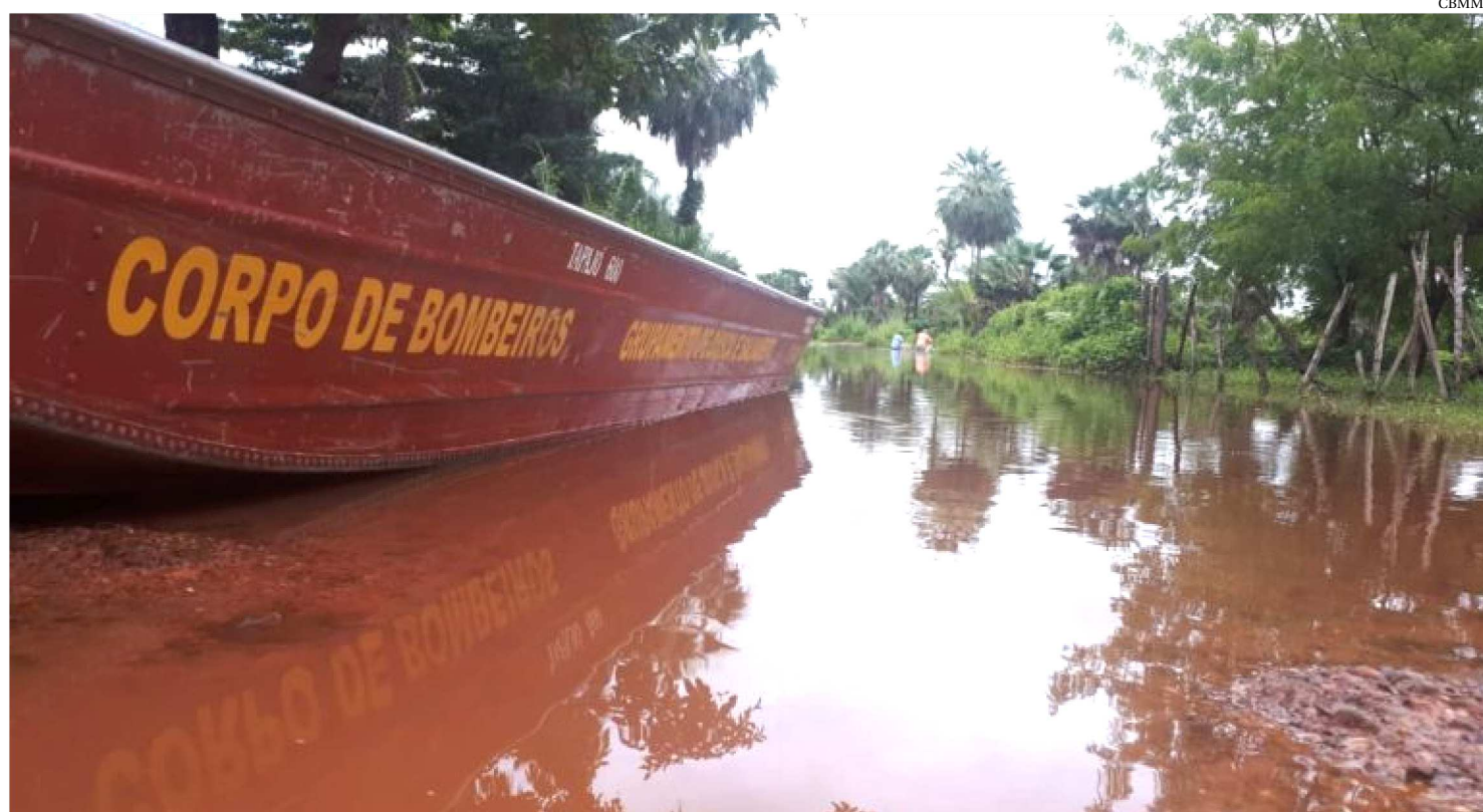
CHUVAS NO NORTE DO ESTADO DO MARANHÃO FORAM ACIMA DA MÉDIA, DE ACORDO COM INSTITUTO NACIONAL DE METEOROLOGIA

Segundo o Instituto Nacional de Meteorologia durante os primeiros meses deste ano, as chuvas sobre os estados do Ceará, Piauí, Rio Grande do Norte, parte da Paraíba e norte do Maranhão foram acima da média. Tanto que causaram muitos alagamentos e transtornos à população. "Sendo que em algumas capitais, como São Luís, Fortaleza e João Pessoa, os volumes de chuva em fevereiro ultrapassaram a média entre 100 e 200 mm. A formação de áreas de instabilidade na parte norte da Região Nordeste, foram ocasionadas pela combinação do calor com alta umidade do ar, além da atuação dos Vórtices Ciclônicos de Altos Níveis (VCAN's) e aproximação da Zona de Convergência Intertropical (ZCIT). Nas áreas mais afastadas do litoral, houve uma