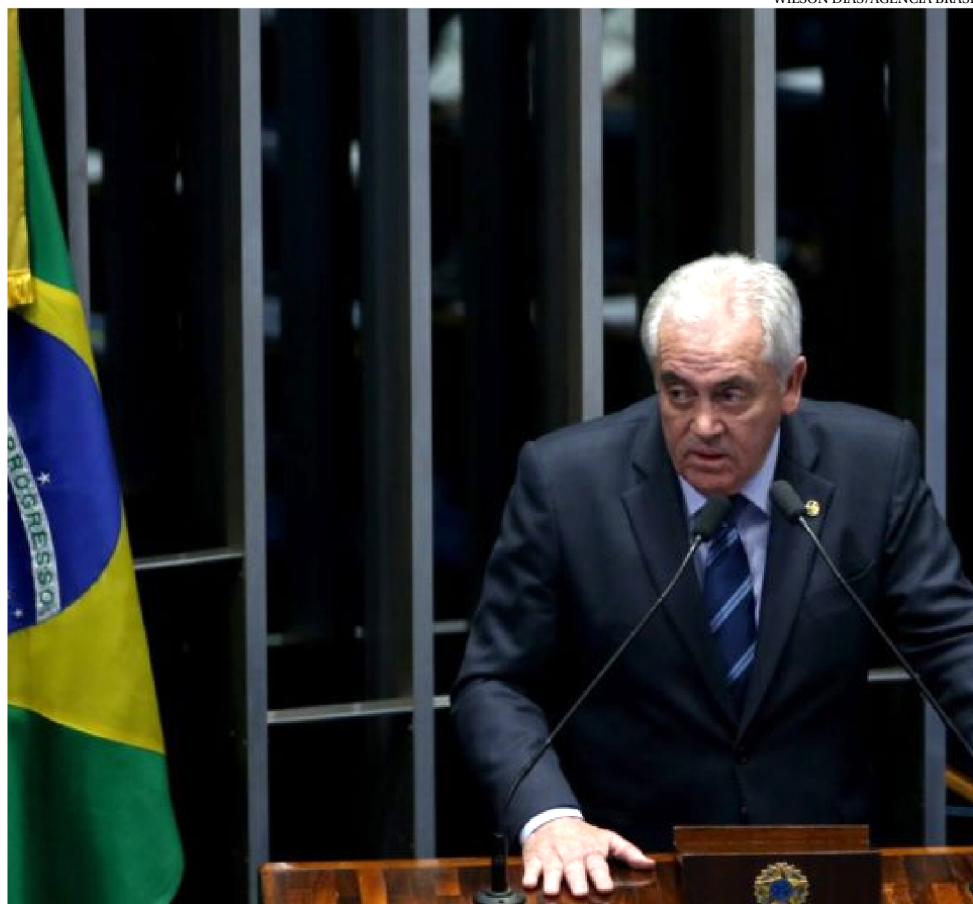
SENADOR OTTO ALENCAR (PSD-BA) É O PRESIDENTE DO COLEGIADO NA CÂMARA

Segundo Otto Alencar, o colegiado, que tem nove titulares e o mesmo número de suplentes, não foi instalado na semana passada porque os sena-