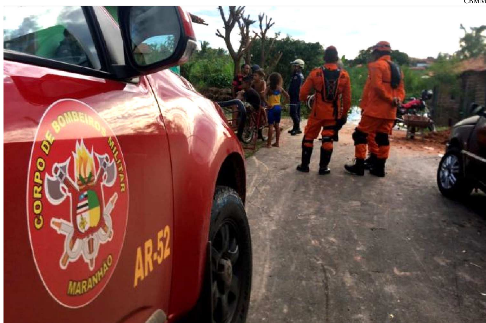
BOMBEIROS NA REGIÃO DE PEDREIRAS ONDE O RIO MEARIM ESTAVA BASTANTE CHEIO

Os municípios de Timon, Pinheiro e Pindaré também devem decretar o