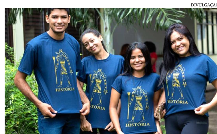
MOSTRA SERÁ REALIZADA DIAS 10 E 11, ÀS 21H, EM IMPERATRIZ

A Mostra de Profissões da Universidade Estadual da Região Tocantina (UemaSul) é um evento em que acadêmicos e professores dos cursos de graduação recebem estudantes, em especial os alunos de escolas de ensino médio, com o objetivo de tirar dúvidas e ajudar na escolha do curso da graduação. Será realizada nesta quarta (10) e quinta-feira (11), das 11h às 21h, no Imperial Shopping, em Imperatriz.