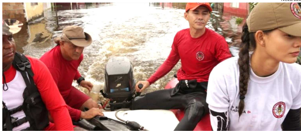
OS BOMBEIROS REALIZAM VISITAS AOS MUNICÍPIOS MAIS AFETADOS NESTA ÉPOCA

“Estamos atuando desde o início das ocorrências no município de Santa Helena e cidades da regional. O volume do rio estagnou e se manteve, mas orientamos que as famílias aguardem o retorno do nível normal