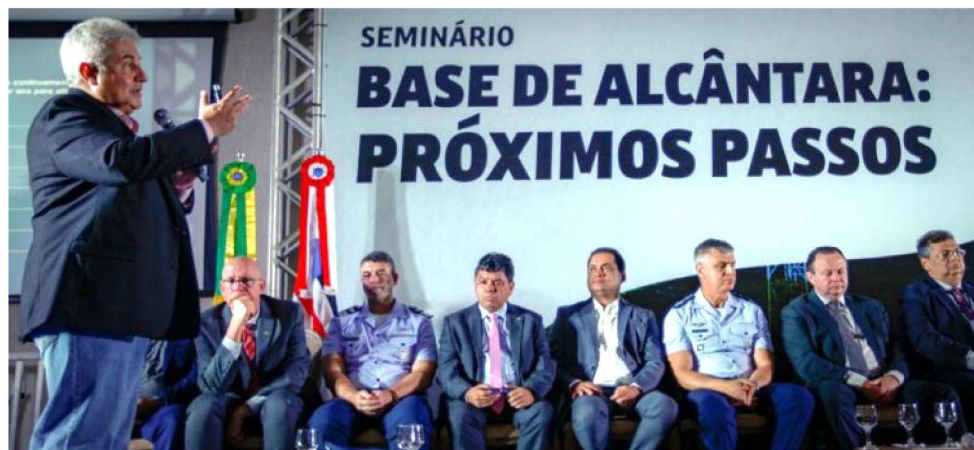
MINISTRO MARCOS PONTES ESCLARECE PRINCIPAIS PONTOS DO ACORDO DE ALCÂNTARA

Segundo o ministro, lançamentos de Alcântara colocariam o Brasil em um mercado bilionário, que movimentaria cerca de 350 bilhões de dólares – e, daqui para 2040, a tendência é aumentar para 1 trilhão. Uma das condições para a aprovação do Acordo é a garantia de uma porcentagem do lucro ao Maranhão a partir de um Fundo de Desenvolvimento Regional, proposto pelo senador Weverton. “A