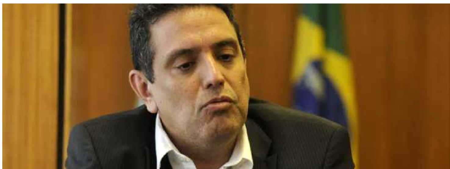
O SECRETÁRIO DE PREVIDÊNCIA SOCIAL, LEONARDO ROLIM, DIZ QUE APROVAÇÃO DEVE GERAR AUMENTO EXPRESSIVO NA DEMANDA

A proposta de reforma da Previdência que tramita no Congresso deve provocar mudanças no mercado de fundos de pensão complementar, que podem se multiplicar, caso o texto seja aprovado tal qual proposto pelo governo federal. A Proposta de Emenda à Constituição nº 6/2019 dá prazo de dois anos para que estados, municípios e Distrito Federal instituem regimes de previdência complementar para servidores públicos, para aposentadorias e pensões, além do teto do regime geral, hoje limitado a R$ 5.839,45.