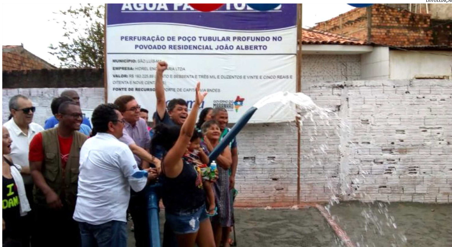
OS MORADORES DO RESIDENCIAL JOÃO ALBERTO, EM SÃO LUÍS, FORAM ATENDIDOS COM O ABASTECIMENTO DE ÁGUA EM SUAS CASAS

No último sábado (13), os moradores do Residencial João Alberto, em São Luís, foram atendidos com a regularização do abastecimento de água em suas casas. A entrega do poço que já está abastecendo a comunidade tornou-se uma grande festa com direito a bolo, aula de zumba e a certeza de uma vida menos dura com água para todos no bairro.