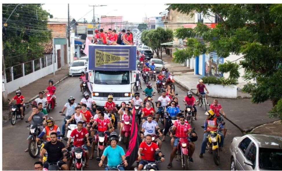
JOGADORES DO IMPERATRIZ DESFILARAM EM CARRO ABERTO COM APOIO DA TORCIDA

Foi, sem dúvida, uma conquista histórica. A maioria dos torcedores do Imperatriz já nem acreditava que o time conseguisse conquistar o título de 2019 após o empate no primeiro jogo. Quando o Moto abriu o marcador, ainda no primeiro tempo, aos 34 minutos, parecia que as chances realmente estavam ficando cada vez mais reduzidas. No entanto, quando o time