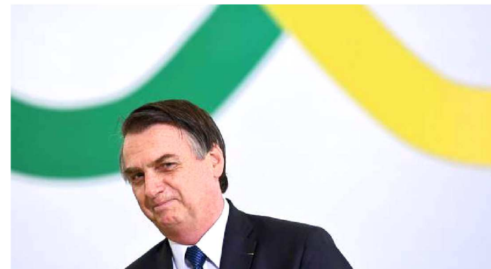
MEDIDAS DE BOLSONARO SÃO CONTESTADAS NO SUPREMO

Em três meses e meio de presidência de Jair Bolsonaro (PSL), o Supremo Tribunal Federal (STF) foi acionado ao menos 24 vezes para barrar medidas do Palácio do Planalto, aponta levantamento feito pelo jornal O Estado de S. Paulo. A "campeã" de contestações é a Medida Provisória que reforça o caráter facultativo da contribuição sindical, alvo de 12 ações.