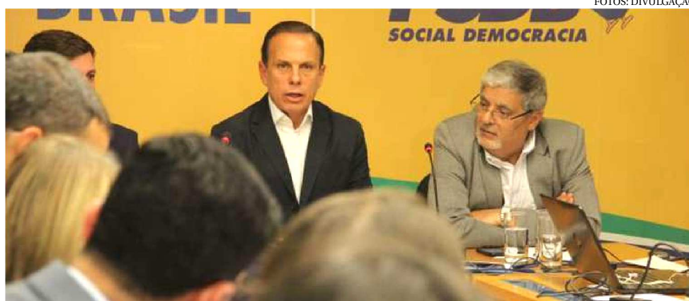
JOÃO DÓRIA (CENTRO) QUER PESQUISA SOBRE DESTINO DA SIGLA PARTIDÁRIA

"Melhor do que o achismo e o personalismo é a pesquisa, ela representa a convicção daquilo que emana da opinião pública", justificou o governador. A ousadia divide opiniões no partido. "Em relação a nome, não vejo como uma prioridade. O nome não é imutável mas é uma questão acessória", disse o ex-governador Geraldo Alckmin, presidente nacional do