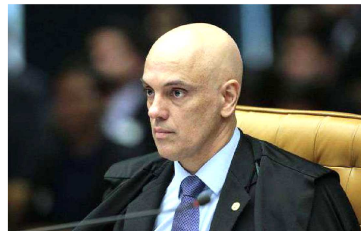
MORAES DETERMINA EXCLUSÃO DE NOTÍCIA EM 72 HORAS

O ministro Alexandre de Moraes, do Supremo Tribunal Federal (STF), determinou que o portal O Antagonista e a revista Crusoé retirem do ar uma reportagem relacionada ao presidente da Corte, Dias Toffoli. Em decisão, que está em segredo de Justiça, Moraes ainda determina que a Polícia Federal intime jornalistas para que prestem depoimento em até 72 horas.