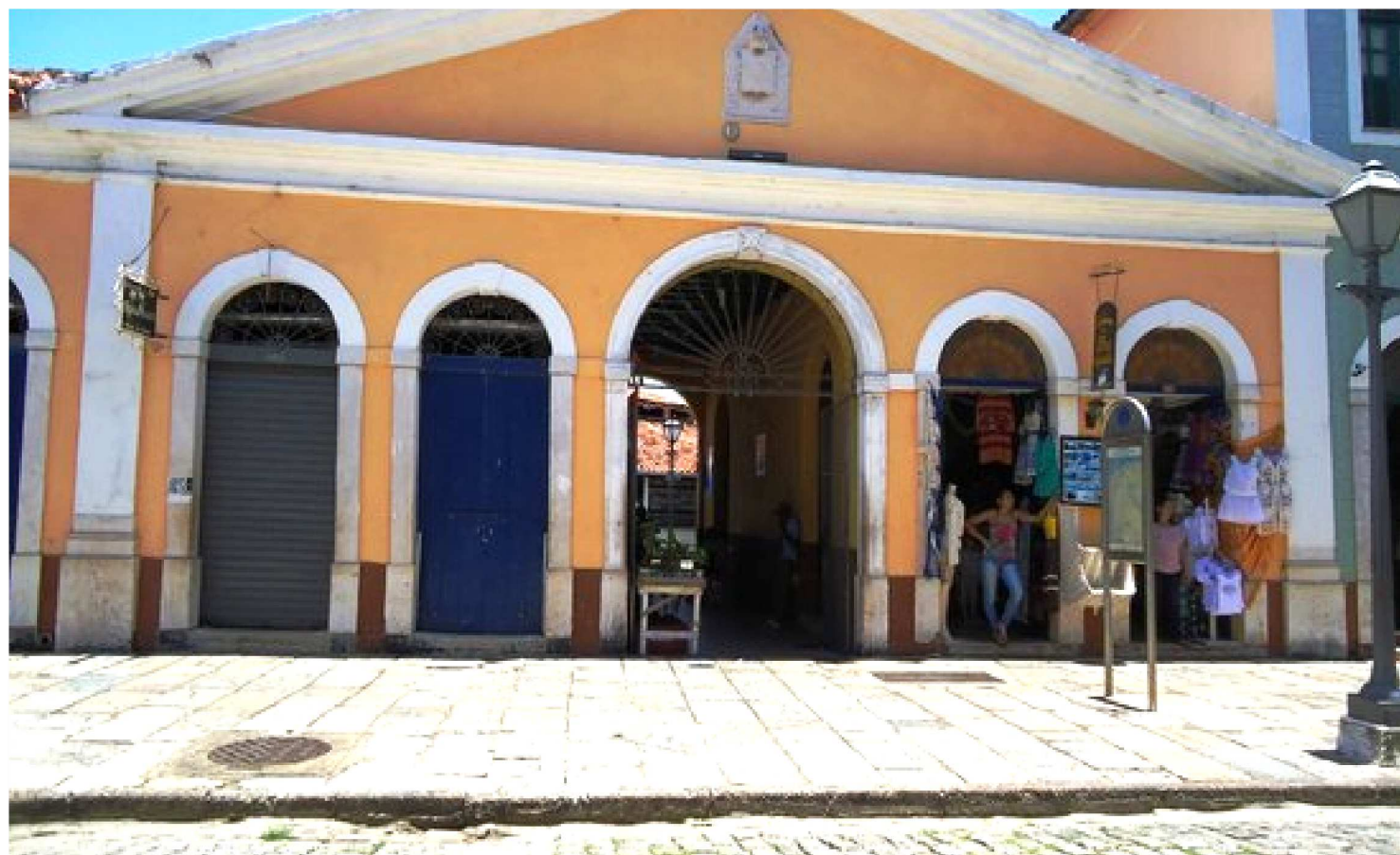
A CASA DAS TULHAS FOI CONSTRUÍDA NO SÉCULO XVIII E A IDEIA ORIGINAL DO PROJETO ERA QUE FUNCIONASSE COMO UM CELEIRO