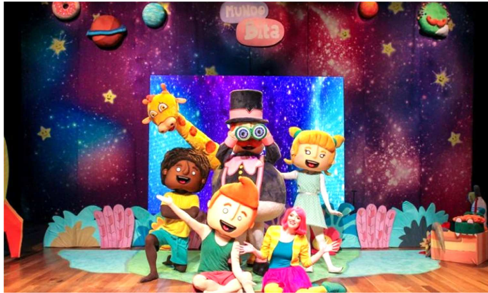
O ESPETÁCULO MUNDO BITÁ TEM DURAÇÃO DE CERCA DE UMA HORA E DEZ MINUTOS