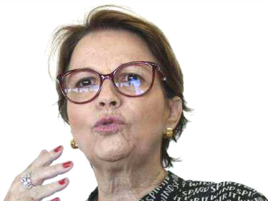
TERESA CRISTINA, MINISTRA DA AGRICULTURA, TERÁ REUNIÃO COM CAMINHONEIROS PARA TENTAR EVITAR PARALISAÇÃO

A ministra da Agricultura, Tereza Cristina, o ministro da Infraestrutura, Tarcísio de Freitas, e líderes de caminhoneiros se reúnem nesta semana para dar encaminhamento às medidas apresentadas pelo governo e debelar uma possível paralisação prevista para 29 de abril.