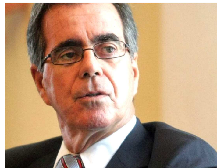
LANGONI DEFENDE ACELERAÇÃO DO PROGRAMA DE REFORMA

Um dos principais conselheiros do ministro Paulo Guedes, o ex-presidente do Banco Central, Carlos Langoni, diz que o país precisa “apressar o passo” e acelerar o cronograma de reformas desenhado pela equipe econômica, que inclui mexer na Previdência e na estrutura tributária para então promover a abertura comercial. Isso porque o processo de “desaceleração sincronizada” da economia mundial impõe mais desafios ao Brasil. “O ideal é que até o fim do ano possamos entrar na agenda pró-mercado”, diz Langoni, que é diretor do Centro de Economia Mundial da FGV.