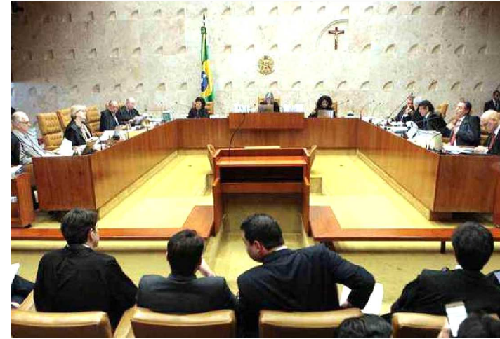
STF: CONTINUIDADE DO INQUÉRITO GERA TENSÃO NA CORTE

Mesmo com a derrubada da censura imposta a veículos de imprensa, o Supremo Tribunal Federal (STF) ainda trabalha para estancar os problemas causados pela abertura de um inquérito que se transformou na peça central de uma crise. Além de conter reações no Congresso e no Executivo, o presidente da Corte, Dias Toffoli, lida agora com um racha interno entre os ministros. Integrantes do tribunal dizem que o assunto só estará resolvido com o arquivamento total dos autos. O assunto pode ir parar no plenário, o que jogará ainda mais lenha na fogueira que se tornou as relações na mais alta instância da Justiça brasileira. Na próxima quarta-feira, durante a sessão plenária, haverá o primeiro encontro entre todos os ministros desde o auge da polêmica, e o assunto pode ganhar novos contornos.