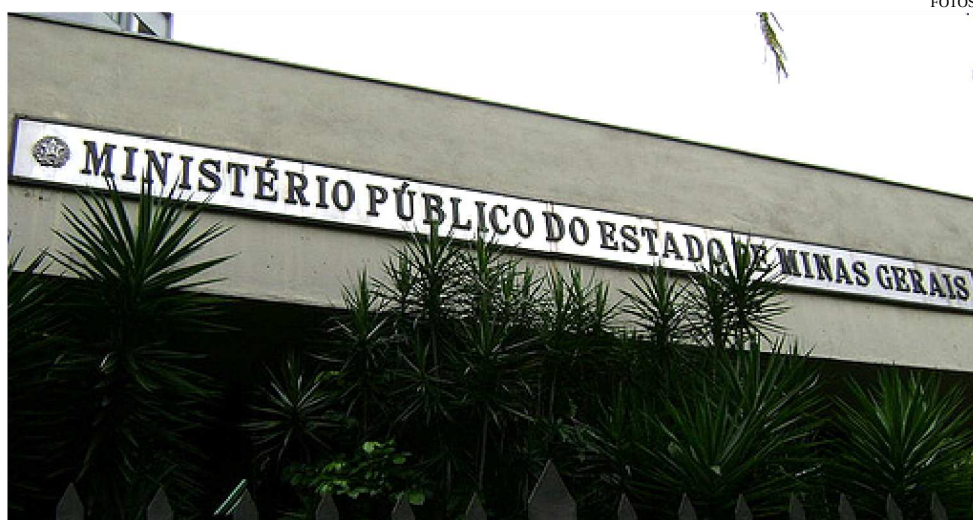
MP DE MINAS DEFENDE NEGOCIAÇÕES COLETIVAS PARA EVITAR DESIGUALDADES

O termo de compromisso estabelece que o atingido procure a Defensoria Pública caso tenha interesse na negociação extrajudicial. A partir daí, o órgão solicita a proposta da mineradora. O cálculo da indenização é feito com base em uma tabela que contém os valores relativos a cada dano sofrido. A pessoa tem três dias para decidir se aceita o acordo. Se concordar, ain-