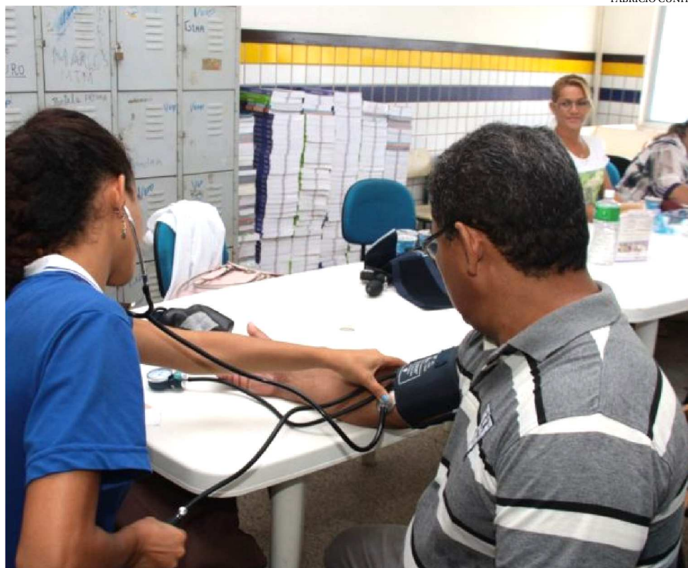
A SEMANA SERÁ DE SEGUNDA (22) A SEXTA (26), ENVOLVENDO 54 UNIDADES DA REDE

Quem estiver nas unidades e for atendido responderá a um questionário que servirá para monitoramento deste paciente após a semana. “Temos profissionais nas unidades para