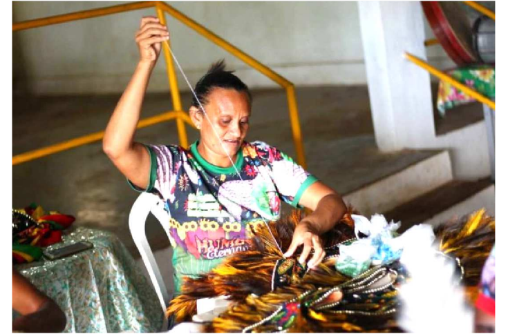
PREPARATIVOS PARA O BOI DE MARACANÃ EM RITMO FORTE