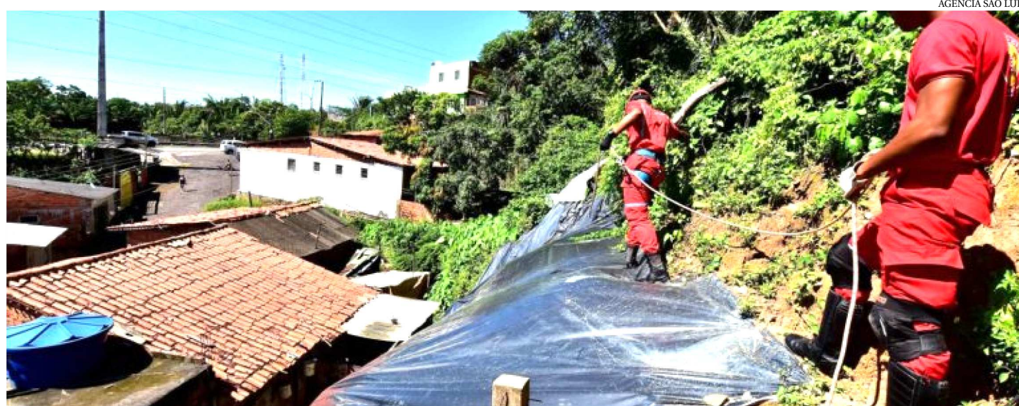
HOJE HÁ 60 ÁREAS MAPEADAS COM IDENTIFICAÇÃO DE PROBABILIDADE DE RISCOS DE DESLIZAMENTO OU ALAGAMENTO EM SÃO LUÍS

A Prefeitura de São Luís, por meio da Secretaria Municipal de Segurança com Cidadania (Semusc), via Defesa Civil do Município, trabalha em duas frentes na gestão de enfrentamento de emergências em épocas de chuvas: ações preventivas e de monitoramento e resposta a situações de risco ou desastre. Toda a atuação dos agentes de Defesa Civil é no sentido de proteger ao máximo as comunidades localizadas nas 60 áreas de riscos mapeadas e conforme estabelecido no Plano de Contingência, com ações de força-tarefa convocada pela gestão do prefeito Edivaldo Holanda Junior devido às chuvas acima da média na capital.