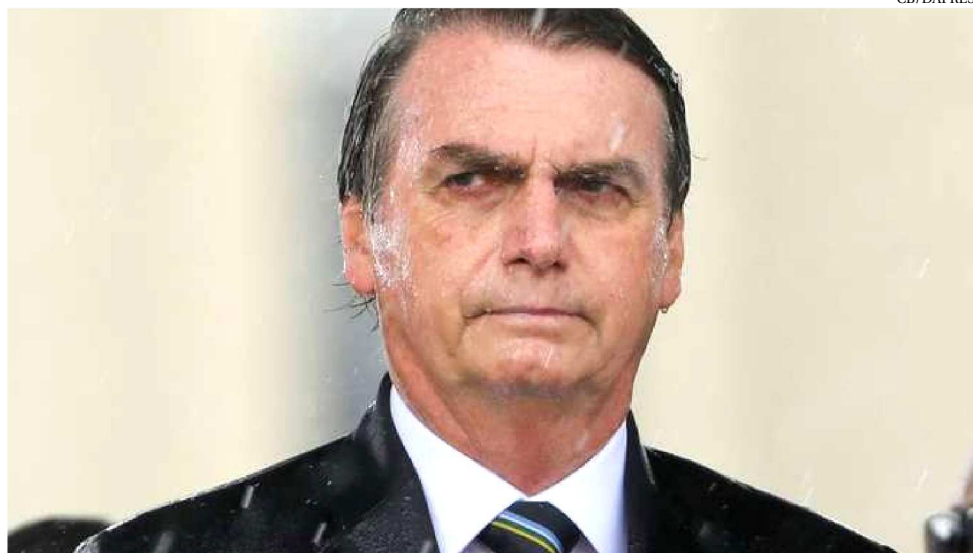
PRESIDENTE BOLSONARO JÁ ADMITE QUE É POSSÍVEL A PRIVATIZAÇÃO DA PETROBRAS

Cobrado por explicações sobre esse comentário, Guedes desconversou. “Ué, se o preço do petróleo sobe no mundo inteiro e não tem nenhum caminhoneiro parando no Trump, não tem nenhum caminhoneiro parando na Merkel, não tem nenhum caminhoneiro na porta do Macron, será