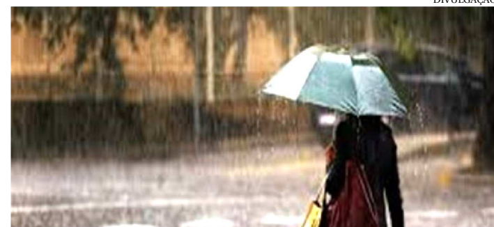
AS CHUVAS DEVEM SE ESTENDER ATÉ O MÊS DE JULHO

Somente no primeiro trimestre deste ano, o índice de chuvas em São Luís foi superior ao registrado em todo o ano de 2012. Outro dado que chama atenção é que, apenas no mês de março de 2019, na capital maranhense, choveu quase o dobro do que foi aferido no mesmo período de 2018.