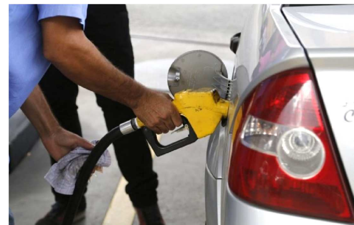
GASOLINA SOBE CADA VEZ MAIS NOS POSTOS DE TODO O PAÍS

A ameaça de greve dos caminhoneiros jogou holofotes na alta do preço do diesel este ano, mas a gasolina já acumula uma variação ainda maior. Em 2019, o reajuste promovido pela Petrobras para a gasolina vendida nas refinarias chega a quase 30%, enquanto o do diesel soma 24%.