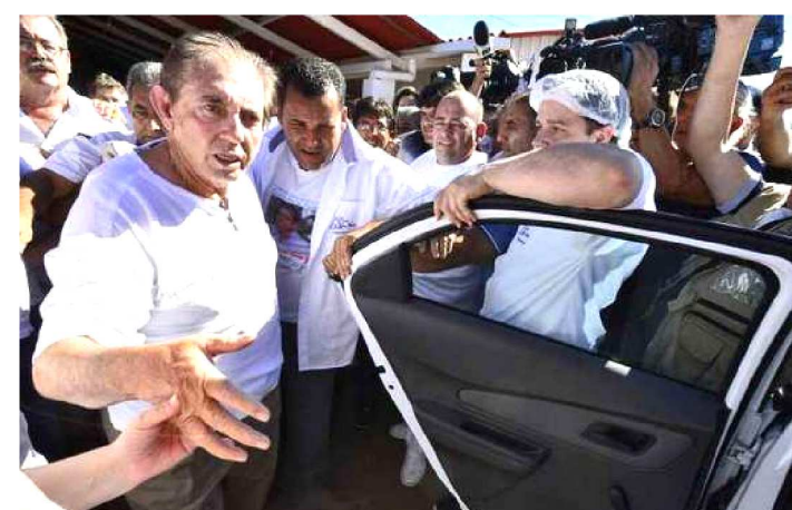
JOAO DE DEUS ESTÁ COM QUADRO DE PNEUMONIA

O Instituto de Neurologia de Goiânia anunciou no fim de semana que vai solicitar a prorrogação do período de internação de João Teixeira de Faria, o João de Deus, réu por violação sexual e estupro de vulnerável. O hospital alega que o médium está com “um quadro de pneumonia e em tratamento” e “necessita continuar internado”.