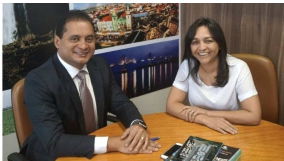
WEVERTON ROCHA E ELIZIANE GAMA DEFENDEM ACESSO AOS CÁLCULOS FEITOS

O senador Weverton Rocha foi outro que criticou o sigilo que foi decre-