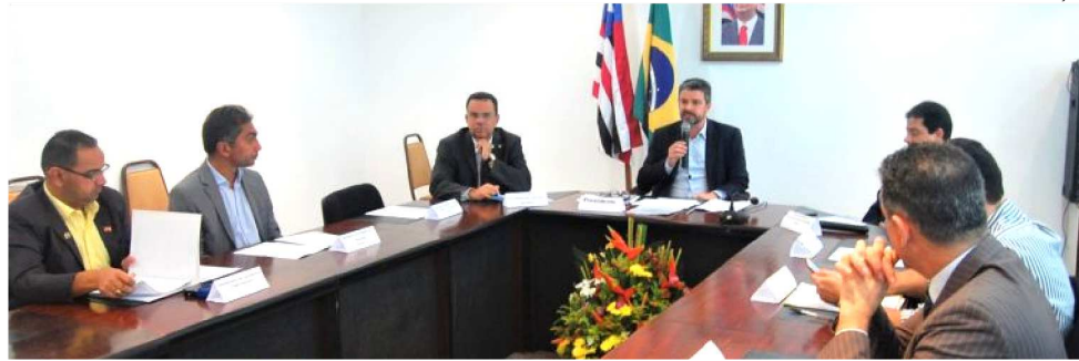
O PRIMEIRO EDITAL DIVULGADO É REFERENTE À QUADRA 30 DA AV. DOS HOLANDESES

A monetização dos ativos imobiliários foi aprovada pelo Conselho Administrativo do Fundo Estadual de Pensão e Aposentadoria (Confepa). A composição do conselho é paritária, com integrantes da estrutura de governo e representantes do quadro de servidores públicos do Executivo, Legislativo e Judiciário. Em dezembro do ano passado, o Confepa aprovou a