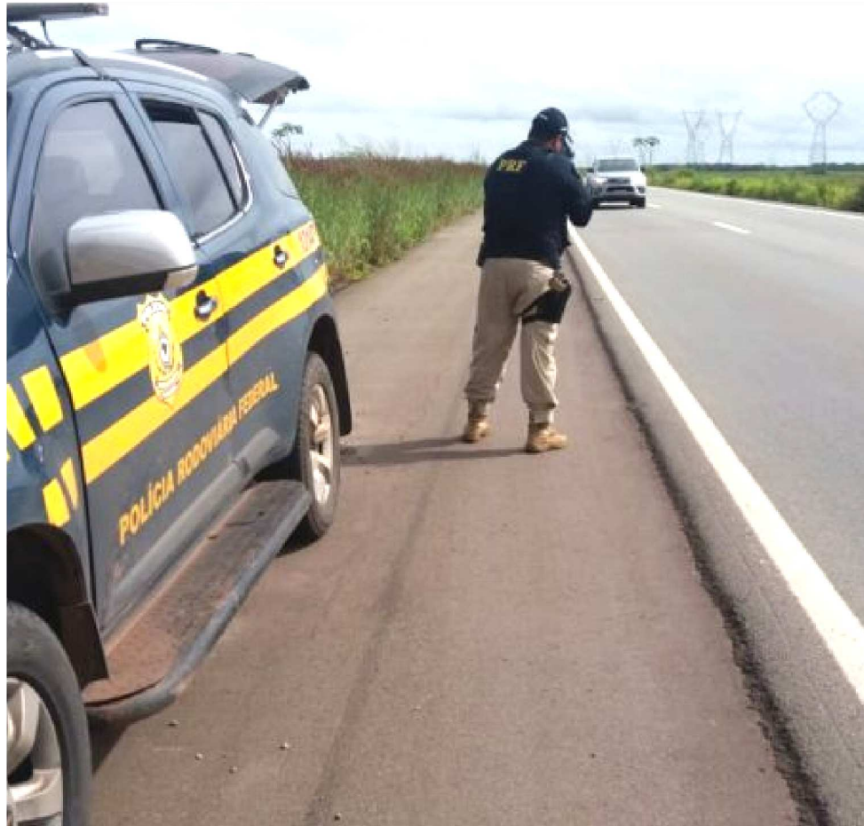
OPERAÇÃO, QUE ACONTECEU EM TODO O PAÍS, COMEÇOU NA QUINTA E FOI ATÉ DOMINGO

Na Sexta-feira Santa (19), ocorreu um acidente com um ferido. Ainda nesse dia, a PRF flagrou um veículo Toyota Corolla trafegando a 174km/h,