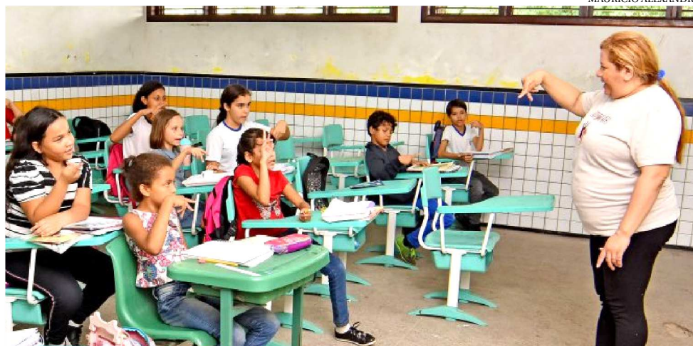
ALUNOS DA MARIA ALICE COUTINHO DURANTE AULA EM LÍNGUA BRASILEIRA DE LIBRAS