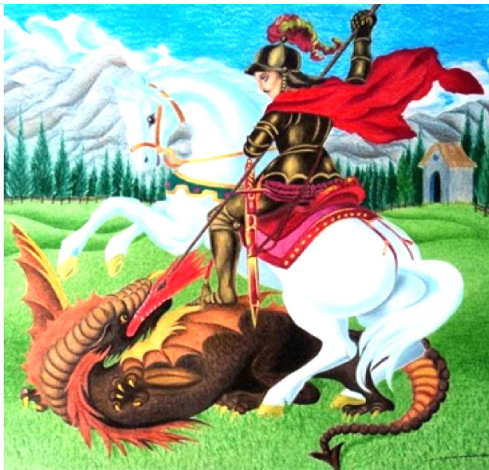
DIA DE SÃO JORGE É CELEBRADO EM PAÍSES COMO REINO UNIDO, PORTUGAL E BRASIL

O sacrifício caiu então sobre Sabra, a filha do Rei, de apenas 14 anos. A menina foi em direção à sua cruel destino e deixou a muralha da cidade, ficou ali à espera da criatura. São Jorge, ao ficar sabendo da história, decidiu