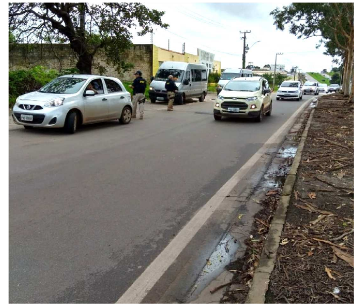
A PRF REALIZOU VÁRIAS ABORDAGENS DURANTE O FERIADÃO

Durante os quatro dias de operação, a PRF contou com atividades para conter os acidentes relacionados ao excesso de velocidade, à alcoolemia ao volante, ao uso inadequado do cinto de segurança e às ultrapassagens indevidas.