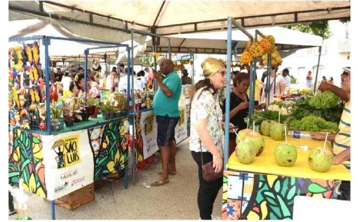
PRODUTOS REGIONAIS SÃO OFERECIDOS DURANTE O EVENTO

Gestão do prefeito Edivaldo estimula a geração de renda e a cultura local com Feirinha São Luís. Todos os domingos, a Praça Benedito Leite, local onde acontece a Feirinha São Luís, tem sido o ponto de encontro de quem procura produtos da agricultura familiar, diversão e lazer. O evento acontece sempre das 8h às 15h.