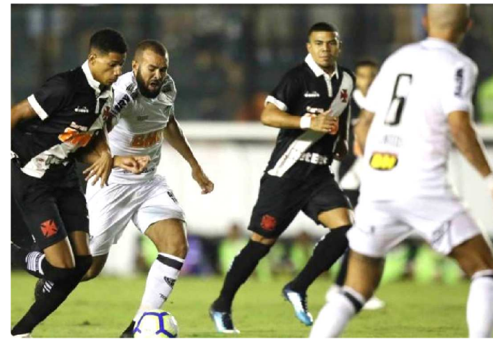
VASCO VAI TENTAR PRIMEIRA VITÓRIA NO BRASILEIRÃO

Série B: Paraná x CRB SporTV e Premiere 19h00 Série B: Cuiabá x Operário-PR Premiere 19h Campeonato Brasileiro: Palmeiras x Internacional TNT 19h Campeonato Brasileiro: Vasco x Corinthians Premiere 21h Campeonato Brasileiro: Ceará x Atlético Mineiro Premiere Campeonato Inglês: Bournemouth x Tottenham ESPN Brasil 08h35 Campeonato Chinês: Guangzhou x Beijing Guan ESPN 11h Campeonato Inglês: West Ham x Southampton ESPN Brasil 11h00 Campeonato Inglês: Wolverhampton x Fulham ESPN 11h Campeonato Inglês: West Ham x Southampton Watch ESPN 11h Campeonato Espanhol 2ª Divisão: Alcorcón x Osasuna Watch ESPN 11h00 Série B: Figueirense x São Bento SporTV e Premiere 13h30 Campeonato Espanhol: Alavés x R. Sociedad ESPN 13h30 Campeonato Inglês: Cardiff x Crystal Palace ESPN Brasil e RedeTV