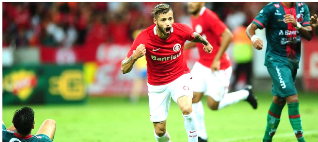
O INTERNACIONAL VEM DE BOA APRESENTAÇÃO DIANTE DO FLA E VAI PRA CIMA DO VERDÃO

Palmeiras e Internacional vão duelar neste sábado pela terceira rodada do Campeonato Brasileiro da Série A edição 2019. O encontro será realizado a partir das 19h (horário de Brasília) no Estádio Allianz Parque, em São Paulo. Embora para os dois times o torneio continental seja prioritário, ambos estão classificados para as oitavas de final de final da competição. O Palmeiras em princípio, indicou a possível escalação de um time de reservas no duelo de hoje, apesar de não mostrar um bom futebol na quarta-feira, 1º de maio, ao enfrentar o CSA. Com ela, o Palmeiras ficou no empate por 1 a 1, em Maracaná. O treinador até havia declarado que iria promover o revezamento no elenco, mas surpreendeu ao trocar todo o time.