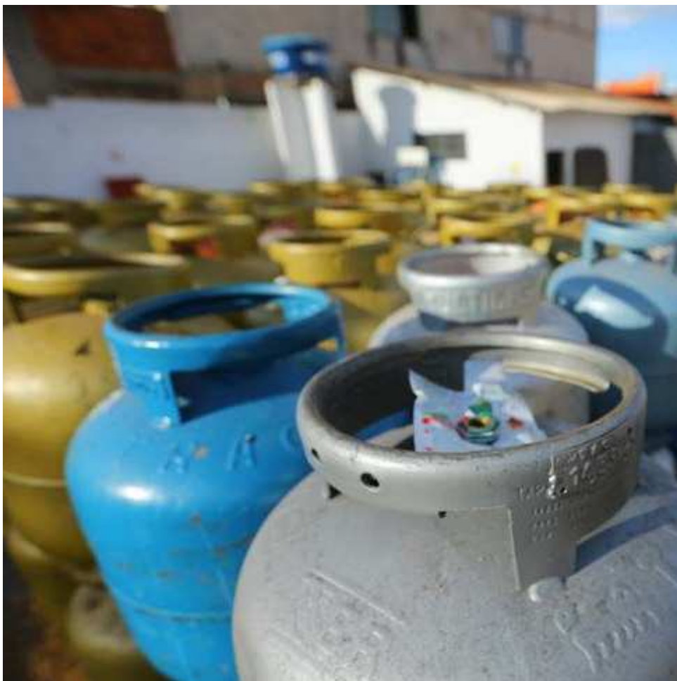
Segundo o Sindigás, que representa as distribuidoras, o reajuste oscila de 3,3% a 3,6%

Ministério da Economia no Rio onde estava ao lado do economista e consultor do governo Carlos Langoni.