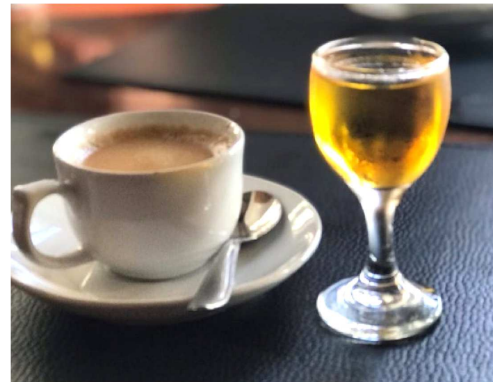
CAFÉ E LICOR UMA ÓTIMA OPÇÃO PARA DIGESTÃO