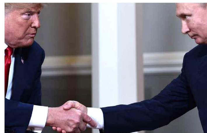
TRUMP (ESQ) E PUTIN CONVERSAM SOBRE A GRAVE SITUAÇÃO

O presidente dos Estados Unidos, Donald Trump, e seu homólogo da Rússia, Vladimir Putin, analisaram, ontem (3), a situação na Venezuela durante uma longa conversa por telefone, disse a porta-voz da Casa Branca, Sarah Sanders.