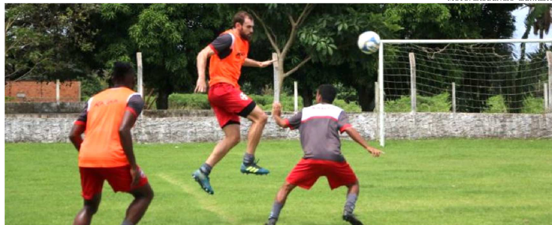
MOTO CLUB FEZ ÚLTIMO COLETIVO E ESTÁ PRONTO PARA ENFRENTAR O ATLÉTICO-RR ESTA NOITE