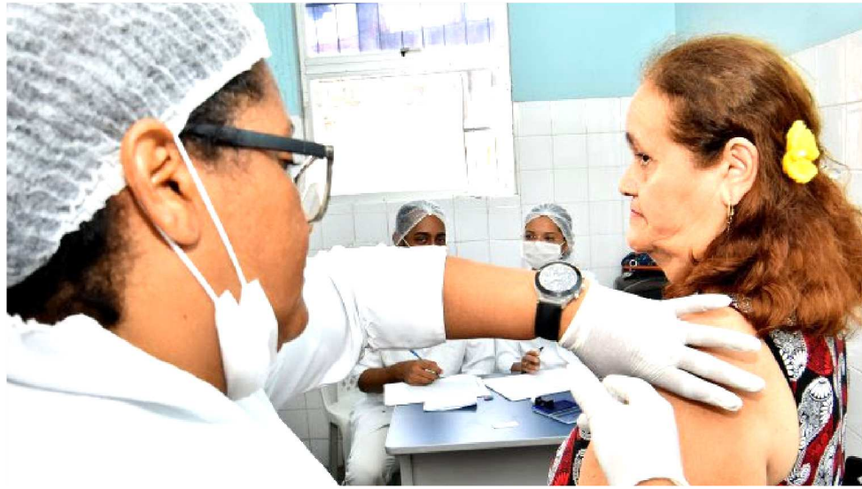
VACINAÇÃO SE ESTENDERÁ POR TODO O DIA, NESTE SÁBADO