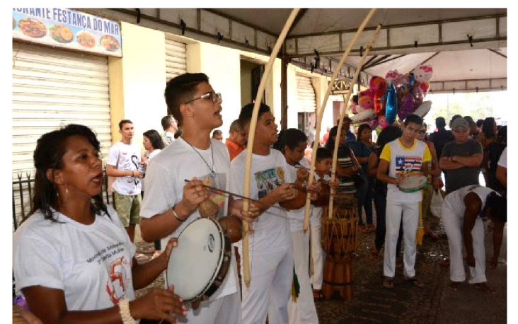
PRÁTICAS ESPORTIVAS E CULTURAIS FAZEM PARTE DO EVENTO

Neste domingo (5), a programação tem como destaque grandes composições do cantor maranhense Zeca Baleiro, ícone do cenário musical nacional. “Este domingo teremos uma programação voltada para a música nacional. Temos grandes expoentes maranhenses pelo Brasil, como Zeca Baleiro e é justo que estes sejam homenageados”, disse o titular da Semapa, Ivaldo Rodrigues.