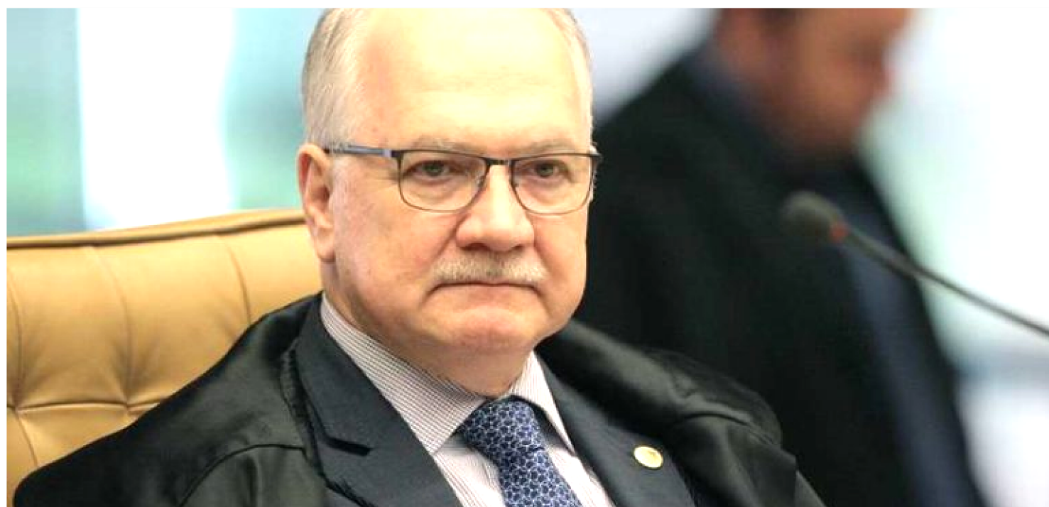
FACHIN MANDA PARA A JUSTIÇA FEDERAL PARANAENSE O INQUÉRITO SOBRE INVESTIGAÇÃO DE VITAL DO REGO E MARCO MAIA

O ministro Edson Fachin, do Supremo Tribunal Federal (STF), enviou à Justiça Federal do Paraná, responsável pela Operação Lava-Jato, investigação sobre o ministro do Tribunal de Contas da União Vital do Rêgo e o ex-deputado Marco Maia (PT) por supostas propinas da OAS de R$ 4 milhões para que, na função de presidente, e relator da CPI da Petrobras, em 2014, impedissem a convocação de dirigentes de empreiteiras investigadas. O despacho acolhe pedido da procuradora-geral, e arquiva o caso para o crime de caixa dois.