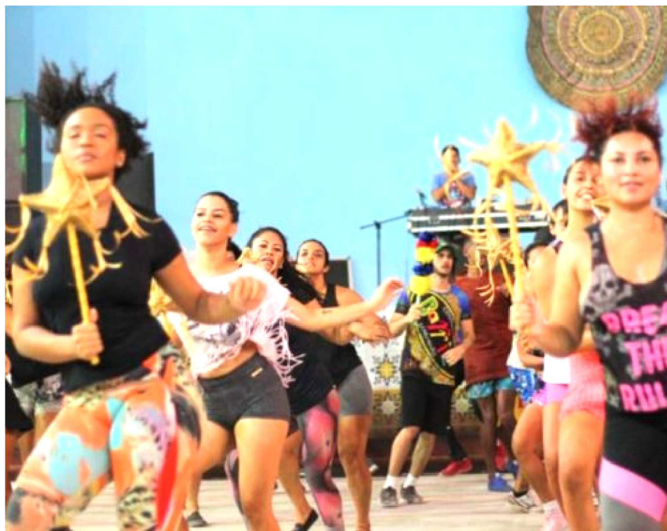
EM 2019, A COMPANHIA CELEBRA O 35º FESTEJO JUNINO DO BOIZINHO BARRICA

É justamente após o encerramento das festividades do Bicho Terra que o corpo de baile da Cia inicia os ensaios