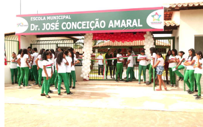
UMA ESCOLA MODERNA E CONFORTÁVEL

Mais conforto, qualidade para o aprendizado e dignidade para estudantes do Ensino Médio da cidade de Matinha, Região da Baixada maranhense. O município foi contemplado com uma nova unidade escolar entre na manhã dessa sexta-feira (10).