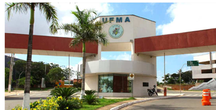
FORAM CORTADAS BOLSAS DE MESTRADO E DE DOUTORADO