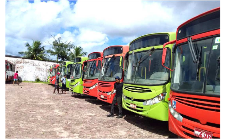
ÔNIBUS SUCATEADOS VÃO PARA OUTRAS CIDADES

Frotas que foram "aposentadas" na capital maranhense estão sendo aproveitadas em outros municípios e capitais.