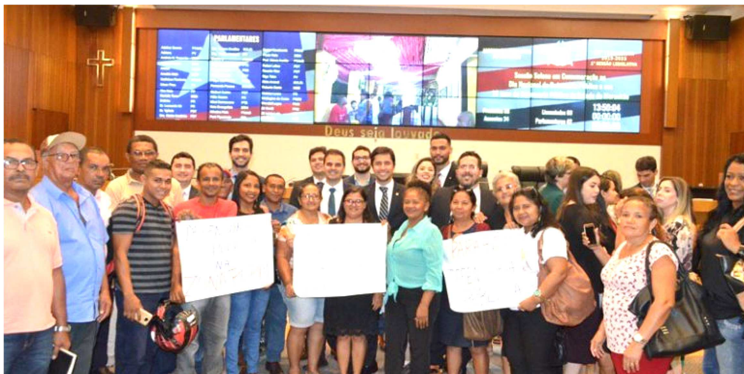
DEPUTADO DUARTE JÚNIOR FOI RESPONSÁVEL POR DESTINAR EMENDA PARA A CONSTRUÇÃO DA UNIDADE DA DPE NA ZONA RURAL

Na última quinta-feira (9), durante sessão solene na Assembleia Legislativa promovida pelo deputado Neto Evangelista em homenagem ao Dia Nacional da Defensoria Pública, comemorado em 19 de maio, o deputado estadual Duarte Jr anunciou a destinação de emenda para a construção de um núcleo fixo e sustentável da Defensoria Pública Estadual (DPE) na zona rural de São Luís.