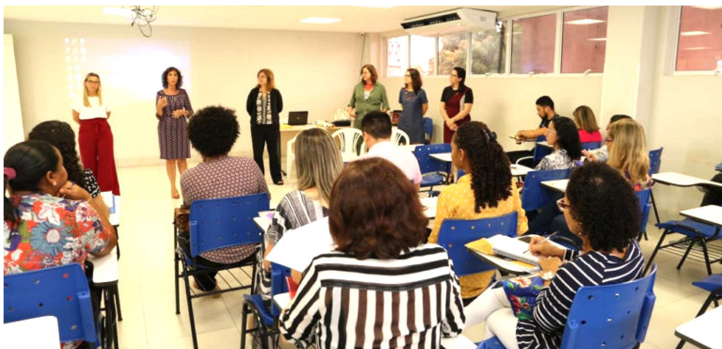
OFICINA PARA CUIDAR DE CRIANÇAS COM SÍNDROME CONGÊNITA

A Secretaria de Estado da Saúde (SES), em parceria com o Ministério da Saúde (MS), realizou, na quarta-feira (8), uma oficina para – Estratégia de Fortalecimento das Ações de Cuidado para Crianças com Síndrome congênita da Zika.