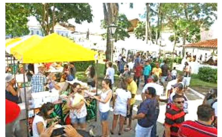
FEIRINHA DE DOMINGO

A Feirinha São Luís é uma iniciativa da gestão do prefeito Eivaldo Holanda Junior e visa incentivar a produção agrícola da cidade, o artesanato, cultura, turismo e economia criativa.