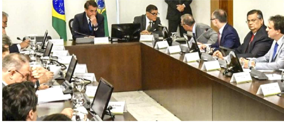
PRESIDENTE JAIR BOLSONARO COM OS GOVERNADORES DO NORDESTE

Para Flávio Dino houve duas conquistas a ser comemorada a nitidez do posicionamento de todos os governadores em defesa dos mais pobres que envolvem questões da Reforma da Previdência e a segunda foi a pauta relacionada a questões dos cortes de recursos na educação superior que vai atingir as instituições de ensino fede-