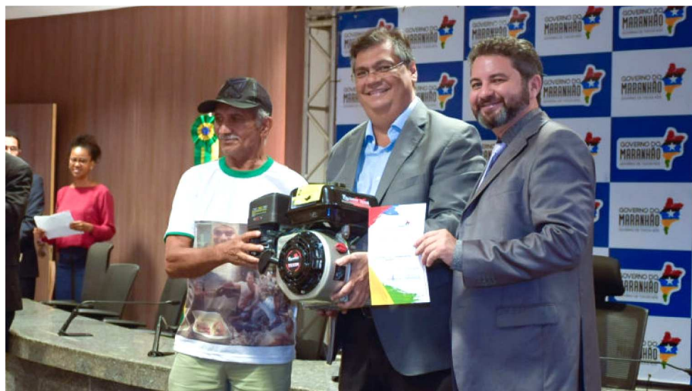
GOVERNADOR FLÁVIO DINO ENTREGA MOTOR A PESCADOR

Para Lavina Lisboa, secretária de Pesca de Raposa, os novos motores vão ajudar no trabalho das marisqueiras do Município: “Como o local de extração fica distante da costa, necessitam de uma embarcação. O marisco é pesado, então esses motores vão fa-