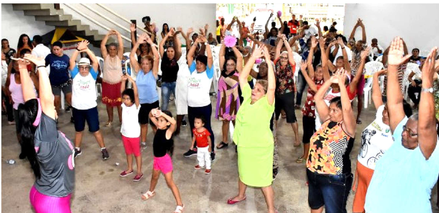
MULHERES PARTICIPARAM EFETIVAMENTE DAS ATIVIDADES NO PARQUE BOM MENINO

Gestão do prefeito Eivaldo promove ação em homenagem às mães no Parque do Bom Menino. Música, serviços de beleza, aula de zumba, cuidados com a saúde e oficinas. Assim foi a tarde de mães que frequentam as atividades desenvolvidas no Parque do Bom Menino.