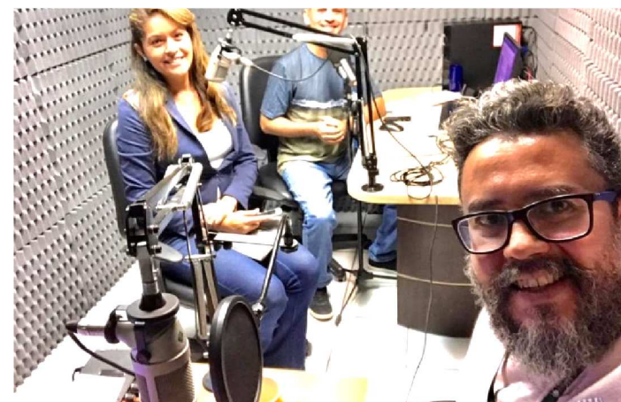
PODCAST, UMA FERRAMENTA EFETIVA

Quatro em cada dez internautas brasileiros já ouviram algum podcast, de acordo com pesquisa do Ibope. É uma onda crescente não só no Brasil, mas também no mundo. E no Maranhão igualmente, com vários lançamentos recentes. O Governo do Estado acaba de lançar um deles: é o Podcast de Todos Nós. A ideia é mostrar serviços, obras, oportunidades, informações gerais e curiosidades para os internautas. É uma ferramenta para facilitar o dia a dia da população e aproximar mais os moradores do poder público. O podcast é semanal e está na segunda edição. A primeira mostrou como se inscrever no Cheque Cesta Básica - Gestante, voltado para grávidas e baixa renda, e como participar do edital que vai investir R$ 1,65 milhão em startups.