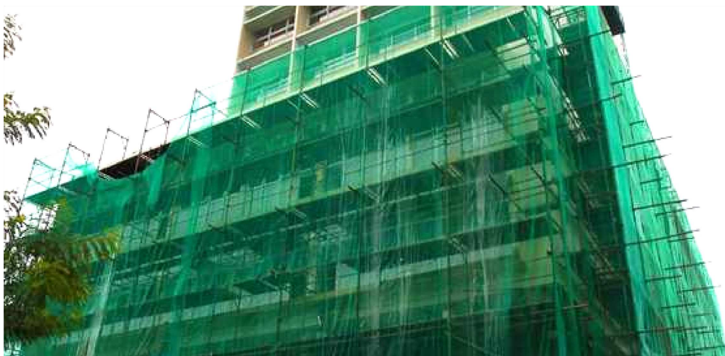
EDIFÍCIO JOÃO GOULART

Um dos primeiros exemplares da arquitetura moderna em São Luís, o Edifício João Goulart, localizado na Avenida Pedro II, no coração do Centro Histórico da capital maranhense, está prestes a ser entregue totalmente revitalizado, após mais de duas décadas de abandono.