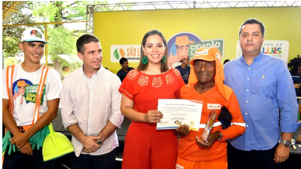
AGENTES DE LIMPEZA FORAM HOMENAGEADOS