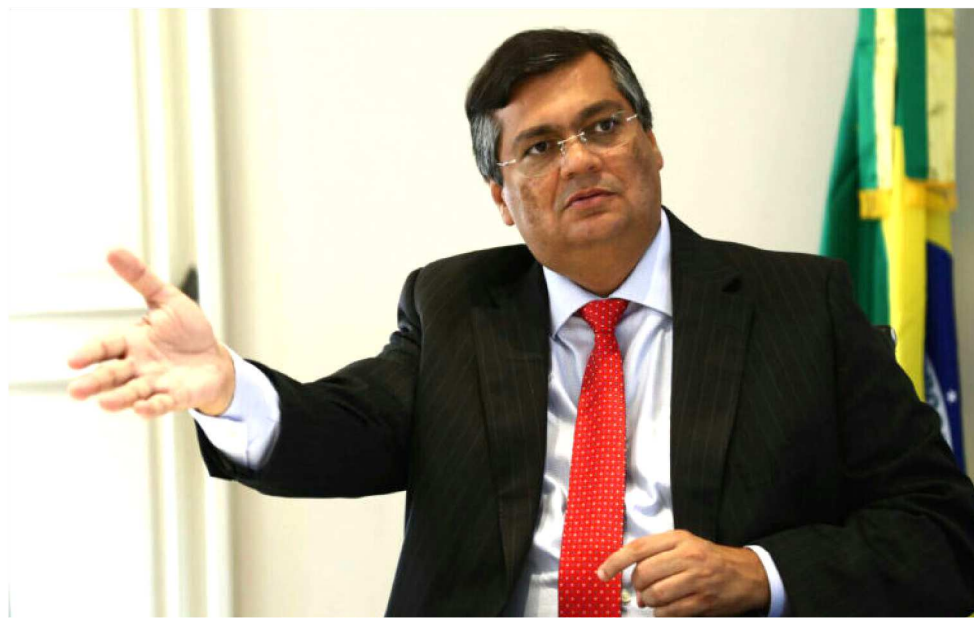
GOVERNADOR FLÁVIO DINO

Flávio Dino vai falar sobre a segurança bem sucedida no Maranhão