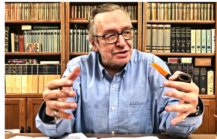
ESCRITOR OLAVO CARVALHO REVELOU QUE FICARÁ AUSENTE

O escritor Olavo de Carvalho, um dos principais influenciadores do bolsonarismo, afirmou, na quarta-feira (15/5), que vai deixar de “se meter” na política brasileira. “Eles querem me tirar da parada? Tiraram. Eu vou ficar quietinho agora, não me meto mais na política brasileira. O Brasil escolheu o seu caminho. Escolheu confiar em pessoas que não merecem a sua confiança e agora vai se danar”, afirmou em conversa em vídeo com o site Crítica Nacional.