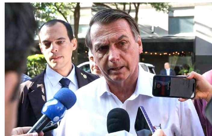
JAIR BOLSONARO VOLTOU A CRITICAR MANIFESTANTES

Após receber a homenagem e o prêmio de personalidade do ano da Câmara de Comércio Brasil-Estados Unidos, ontem (16), em Dallas, no Texas, o presidente Jair Bolsonaro voltou a citar os protestos contra o bloqueio no orçamento das universidades. “Vimos algumas capitais com marchas pela educação como se a educação até o fim do ano passado fosse uma maravilha no Brasil. Temos potencial humano fantástico, mas a esquerda brasileira entrou, infiltrou e tomou, não só a imprensa brasileira, mas também grande parte das universidades e escolas do ensino médio e fundamental”, disse Bolsonaro, no discurso de agradecimento.