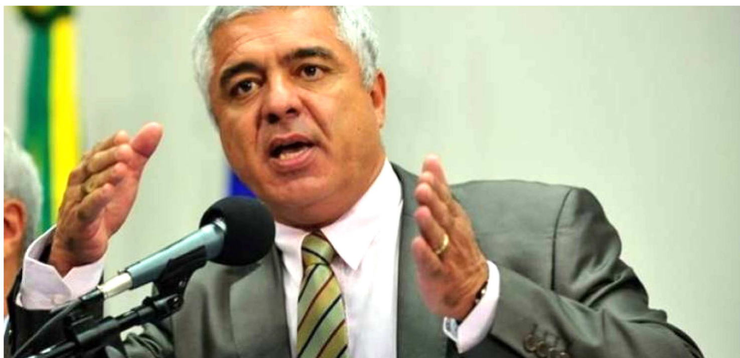
MAJOR OLÍMPIO, LÍDER DO GOVERNO NO SENADO, CONVENCIDO PELO GOVERNO A DEIXAR O COAF COM MINISTÉRIO DA ECONOMIA

O presidente Jair Bolsonaro e os ministros da Economia, Paulo Guedes, e da Justiça e Segurança Pública, Sérgio Moro, convenceram a bancada do PSL no Senado a desistir de apresentar requerimento solicitando a permanência do Conselho de Controle de Atividades Financeiras (Coaf) na Justiça, em matéria tratada na Medida Provisória (MP) 870, da reforma administrativa. A articulação governista entendeu ser melhor garantir a aprovação do texto como saiu da Câmara do que correr o risco de alterar e, assim, reencaminhá-la aos deputados. O processo seria desgastante, uma vez que, pela possibilidade de falta de quórum, colocaria em risco as chances de votação. Não acontecendo isso até 3 de junho, a proposta perderia a validade.