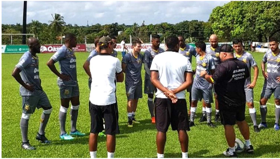
TÉCNICO DO SAMPAIO REUNIU OS JOGADORES E FALOU SOBRE O JOGO DE AMANHÃ

Dois jogadores que já atuaram por outras equipes na Copa do Brasil não estarão em ação pelo Sampaio ama-