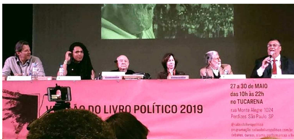
FLÁVIO DINO FALOU SOBRE A IMPORTÂNCIA DA CLASSE MÉDIA PARA A ESQUERDA

O PL está na Comissão de Agricultura e Reforma Agrária e deve ir pro plenário se for aprovada.