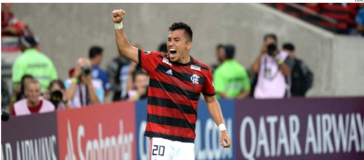
URIBE DEVE SE TRANSFERIR PARA O SANTOS AINDA NESTA SEMANA, A PEDIDO DO TÉCNICO ARGENTINO SAMPAOLI

O Santos encaminhou ontem a contratação de Uribe, do Flamengo. Resta que as partes assinem a documentação para a transferência ser concluída. Vale lembrar que os cariocas deram apenas a opção de compra. A expectativa é que o centroavante chegue à Baixada Santista ainda nesta semana. O Santos corre contra o tempo nos acordos com o clube carioca para buscar as assinaturas que faltam a fim de anunciar o reforço.