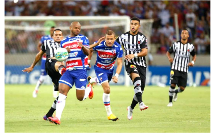
BOTAFOGO-PB E FORTALEZA DECIDEM A COPA DO NORDESTE