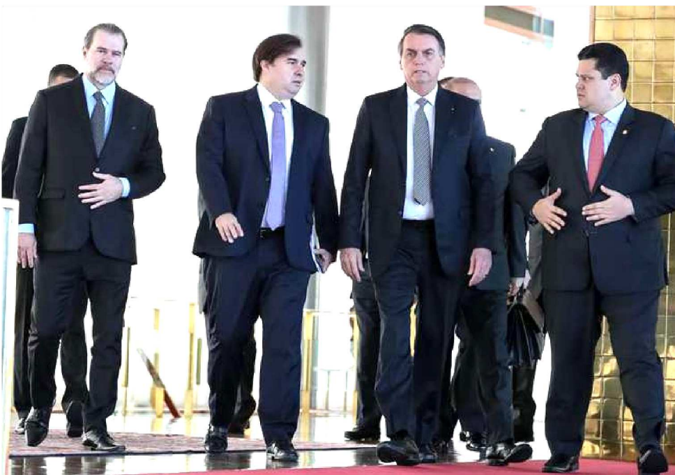
PRESIDENTES DO EXECUTIVO, LEGISLATIVO E JUDICIÁRIO ASSINARÃO PACTO DE METAS

O presidente da República e os presidentes da Câmara, Rodrigo Maia (DEM-RJ), do Senado, Davi Alcolumbre (DEM-AP), e do STF, Dias Toffoli, estiveram reunidos na manhã desta terça-feira (28/5) para afinar a sintonia entre os Poderes. “É algo extremamente importante e, da reunião de hoje, se consolida ideia de que se formalize um pacto de entendimento e algumas metas de interesse da sociedade brasileira a favor da retomada do crescimento brasileiro”, destacou o ministro-chefe da Casa Civil, Onyx Lorenzoni. A previsão é que o pacto seja formalizado daqui a duas semanas, “na semana do dia 10 de junho”. “Daqui até lá, vamos continuar dialogando com os poderes para a construção do texto que será assinado e apresentado ao país”, ressaltou Lorenzoni. O “saldo” do café da manhã que reuniu os presidentes dos Três Poderes foi classificado como positivo pelo articulador político do governo. “Esta-