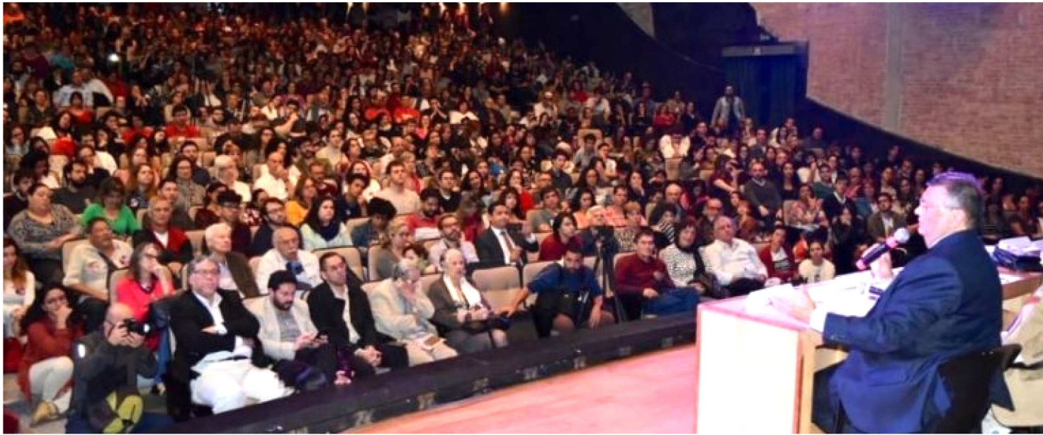
GOVERNADOR FLÁVIO DINO PARTICIPOU DE DEBATE NO SALÃO DO LIVRO POLÍTICO, NO TEATRO DA PUC, EM SÃO PAULO

Governador do Maranhão, Flávio Dino, comparou as manifestações e acredita que a esquerda precisa recuperar a hegemonia da classe média