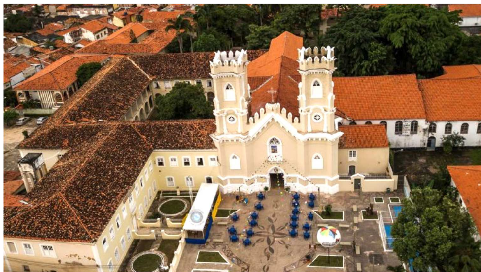
IGREJA DE SANTO ANTÔNIO FICA LOCALIZADA NO CENTRO DA CAPITAL MARANHENSE

Além de celebrações de missas e batizados, a programação inclui tre-