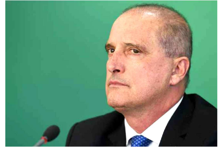
ONYX REVELA ESTUDO QUE ESTÁ SENDO FEITO PELO GOVERNO

O ministro da Casa Civil, Onyx Lorenzoni, afirmou ontem (30) que cabe ao governo acatar a decisão do parlamento de deixar o Coaf sobre a responsabilidade do Ministério da Justiça. No entanto, o presidente declarou que o governo estuda transformar o órgão em uma agência de investigação financeira.