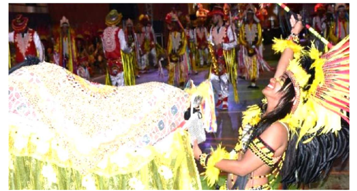
NO SESC TURISMO A FESTA ACONTECE DE 19 A 22 DE JUNHO

O Balaio de Sotaques mais uma vez fortalece a cultura junina em um espetáculo gratuito e aberto a toda família maranhense na edição 2019. Com uma programação que é a cara do nosso São João, diversificada e transmitindo alegria, a estrela principal é o bumba meu boi, que une elementos da cultura negra, indígena e portuguesa. A agenda de apresentações do Sesc acontece em São Luís, Raposa, Itapecuru e Caxias. No Sesc Turismo a festança acontece de 19 a 22 de junho. Entrada liberada.