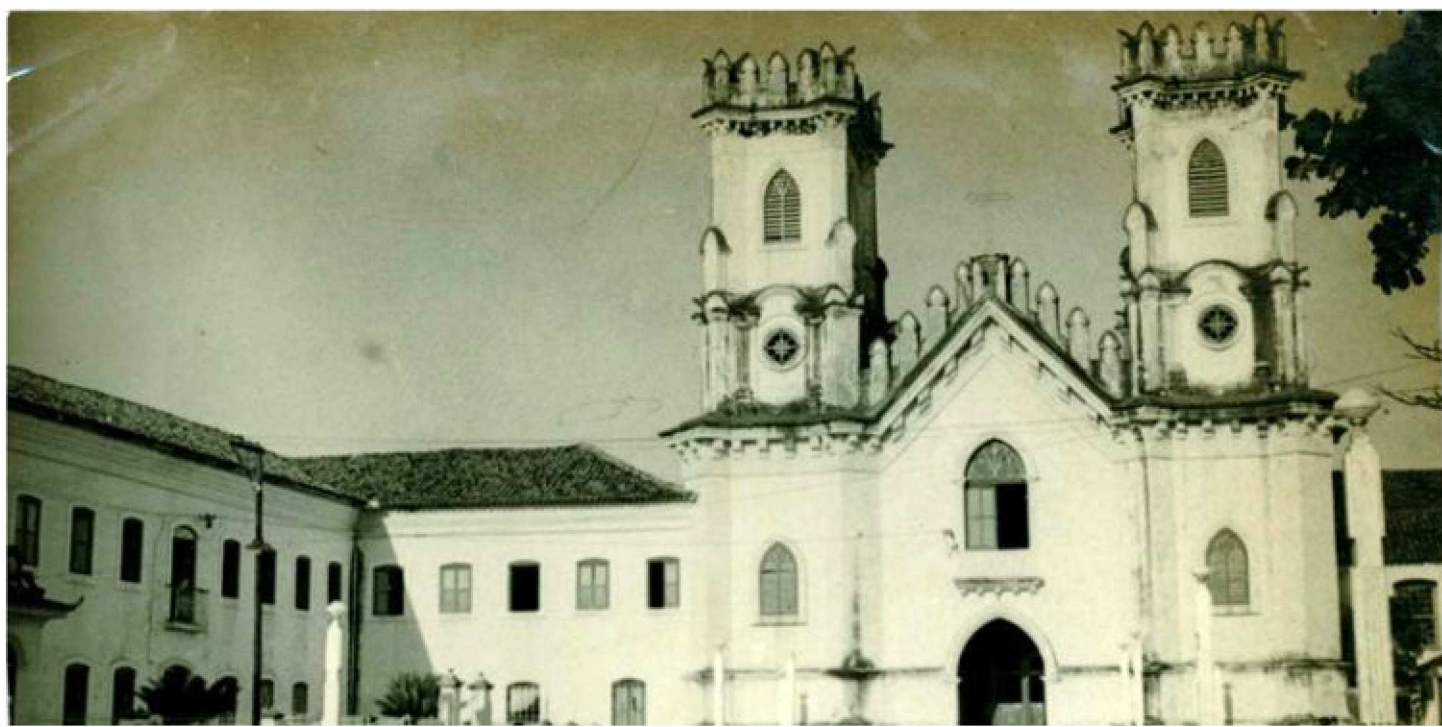
TOMBADAS COMO PATRIMÔNIO HISTÓRICO, AS CONSTRUÇÕES RECEBEM MUITOS VISITANTES EM JUNHO POR CONTA DO FESTEJO