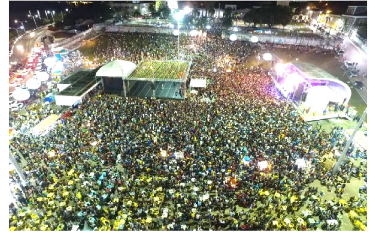
ALÉM DAS ATRAÇÕES LOCAIS, TERÃO DOIS SHOWS NACIONAIS