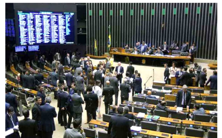
TEXTO ORIGINAL FOI APROVADO PELA CÂMARA FEDERAL

A Câmara dos Deputados aprovou o texto-base da Medida Provisória nº 871/2018. A medida foi uma das primeiras enviadas pelo governo de Jair Bolsonaro ao Legislativo e tem como objetivo combater fraudes e irregularidades em benefícios previdenciários. Ainda falta a apreciação dos destaques.