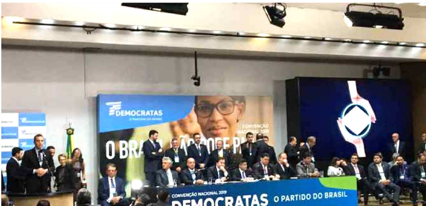
REUNIDOS, DEMOCRATAS SE DISTANCIARAM DO CENTRÃO E ANUNCIARAM APOIO À REFORMA DA PREVIDÊNCIA NO ATUAL GOVERNO

A partir de discursos acalorados na convenção nacional do Democratas, o partido, que é o atual dono das presidências do Senado e da Câmara dos Deputados, se distanciou do centrão e se firmou como partido de direita. Ontem (30), discursos de alguns filiados do partido como o do ministro da Casa Civil, Onyx Lorenzoni, e do governador do Goiás, Ronaldo Caiado, criticaram governos passados como o PT.