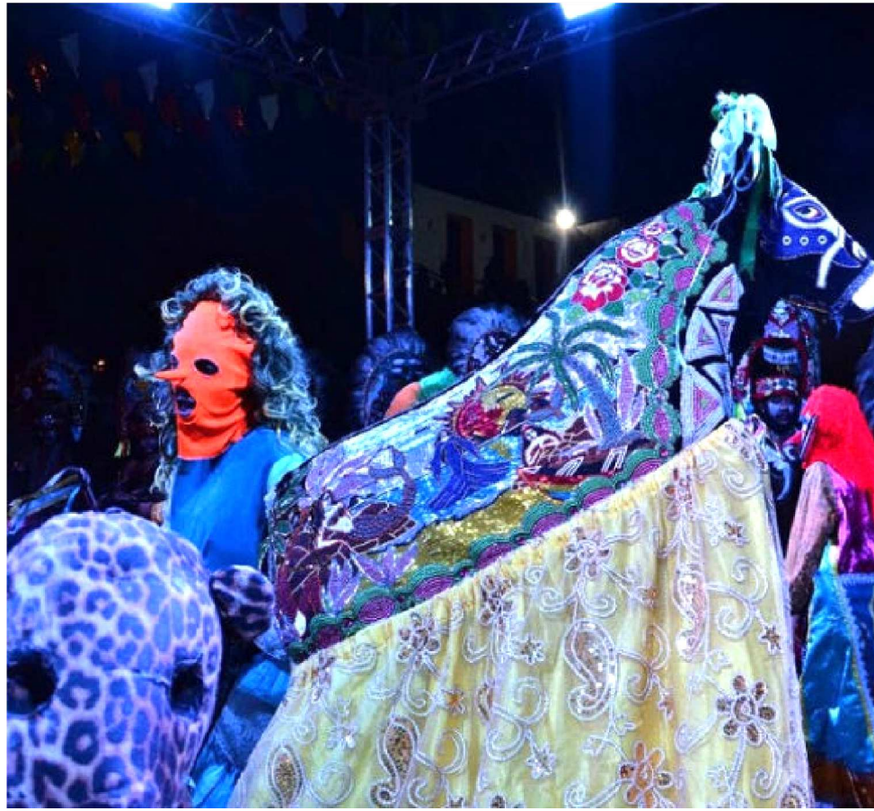
NO DIA 19 COMEÇA A TEMPORADA OFICIAL NOS ARRAIAIS ESPALHADOS PELA CIDADE

Ainda no centro histórico, as saias coloridas das coreiras vão enfeitar as