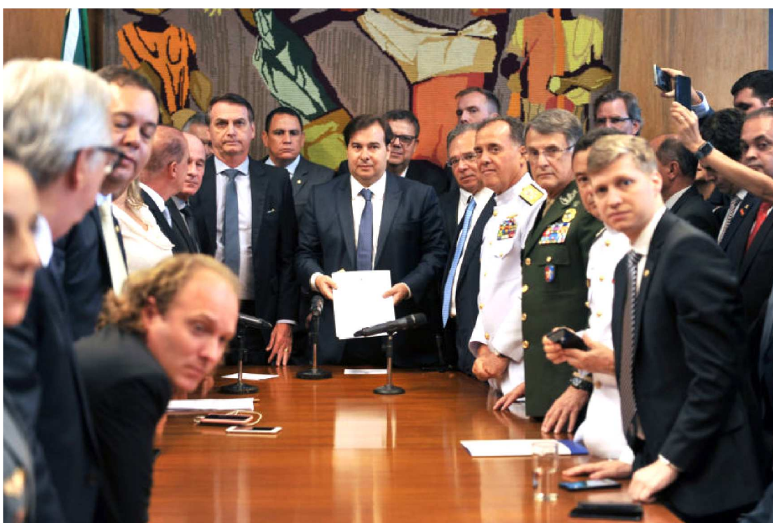
BOLSONARO CERCADO POR ALIADOS. PARA JOÃO DÓRIA, ALGUNS DELES SÃO OS MAIORES INIMIGOS