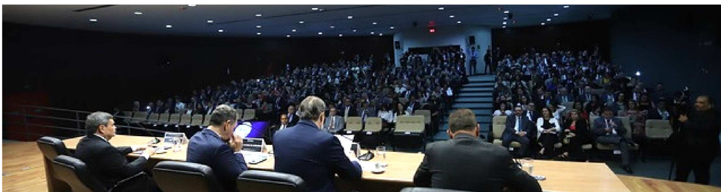
REUNIÃO DO PODER JUDICIÁRIO NACIONAL DISCUTIU EM BRASÍLIA OS CAMINHOS PARA APERFEIÇOAR OS TRABALHOS NO FUTURO

A 1ª Reunião Preparatória para XIII Encontro Nacional do Poder Judiciário terminou com a avaliação preliminar dos segmentos de Justiça sobre temas propostos pelo Conselho Nacional de Justiça (CNJ) para aperfeiçoar o trabalho do Poder Judiciário, nos próximos anos. Foram encaminhados três grandes temas: desenvolvimento de ações no Poder Judiciário contidas na chamada Agenda 2030, com os 17 Objetivos de Desenvolvimento Sustentável (ODS), estabelecimento de prioridade em ações ligadas à Infância e Juventude e andamento aos processos que envolverem grandes obras paradas no país. Também foram apresentados os resultados e o relatório das Metas Nacionais 2018.