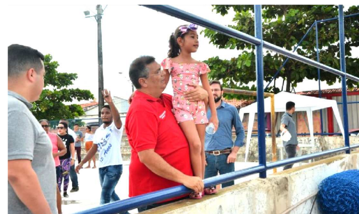
GOVERNADOR FLÁVIO DINO VISTORIA OBRAS

Na manhã deste sábado (1º), o governador do Maranhão, Flávio Dino, realizou vistoria técnica na Praça da Juventude, no bairro João de Deus, em São Luís. O equipamento público vem passando por reforma e adequações. A intenção é garantir um espaço adequado para lazer e esporte aos moradores e visitantes da área.