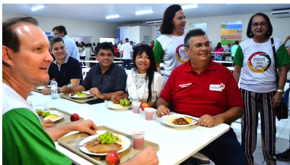
O GOVERNADOR FLÁVIO DINO ALMOÇOU NO NOVO RESTAURANTE

população de todo o Estado, mostrando a importância desses equipamentos para combater a fome e dar mais dignidade aos maranhenses.