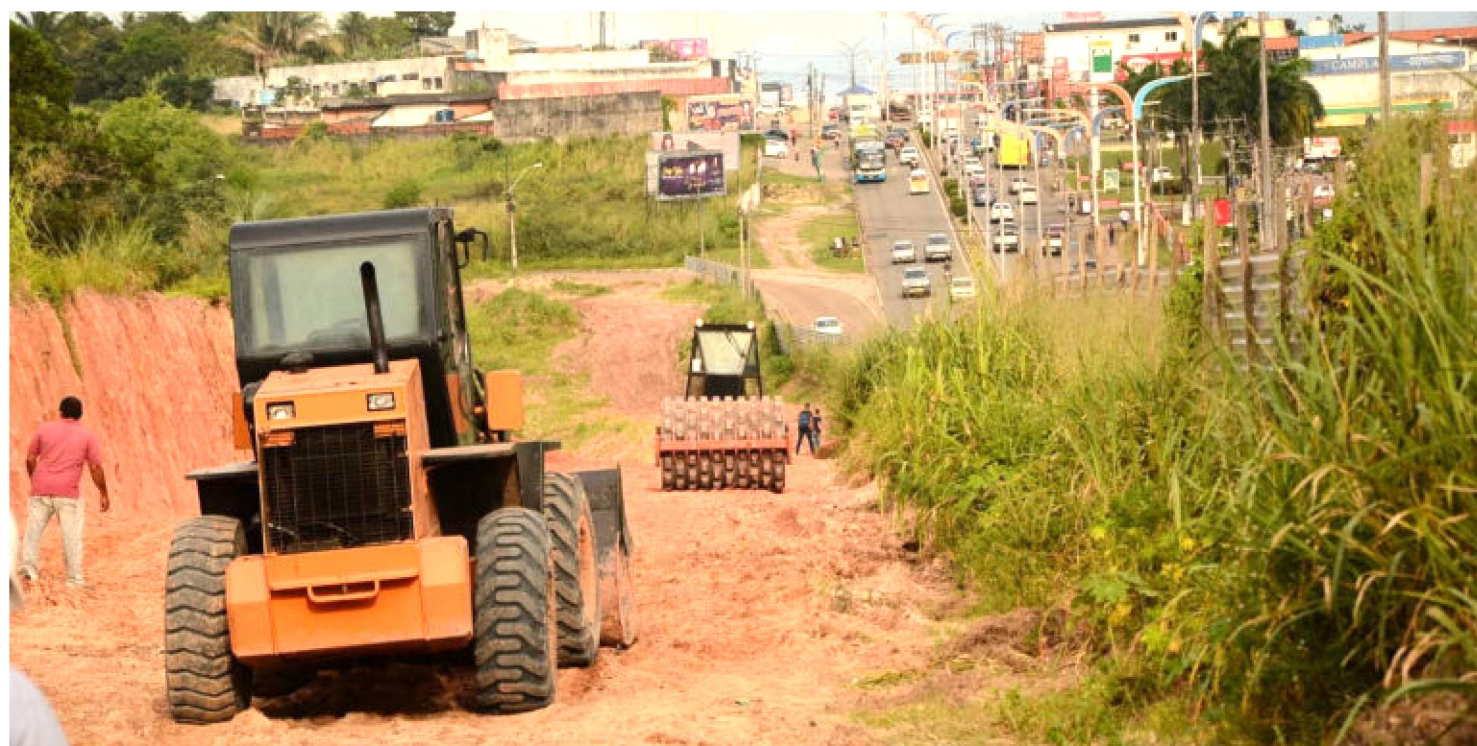
OBRAS DO ALARGAMENTO DA AVENIDA JERÔNIMO DE ALBUQUERQUE AVANÇAM

Dentro do amplo pacote de obras estruturantes realizadas em São Luís, o Governo do Maranhão avança no alargamento de trechos da Avenida Jerônimo de Albuquerque, ação que vai desafogar o trânsito e dar mais segurança a motoristas e pedestres que passam pelo local.