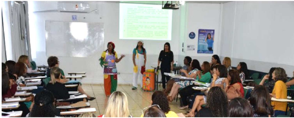
CAPACITAÇÃO REUNIU 60 PROFISSIONAIS

Um momento especial da formação aconteceu na quarta-feira (29), quando as contadoras de história da Semed, que foram premiadas este mês, em São Paulo, com o troféu Baobá de Literatura, fizeram uma breve intervenção, apresentando algumas lendas maranhenses para os participantes, especialmente para as formadoras da Consultoria Gazzola. O obje-