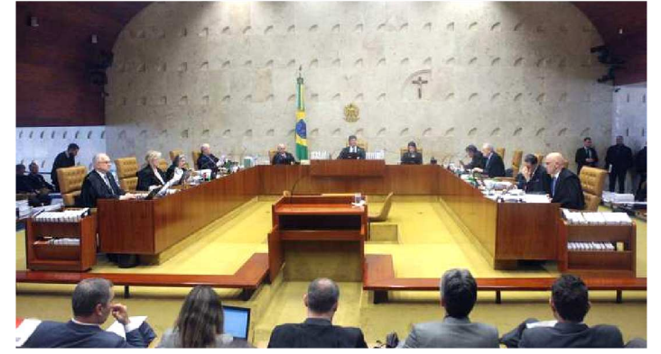
MINISTROS DO SUPREMO CONTRA EXTINÇÃO DOS CONSELHOS

A maioria dos ministros do Supremo Tribunal Federal (STF) decidiu, ontem (12), pela inconstitucionalidade de parte do decreto de lei editado pelo presidente Jair Bolsonaro que extingue conselhos e colegiados de todo o país. Os magistrados avaliam, ainda hoje, qual será a amplitude da decisão. Os ministros Marco Aurélio Mello e Alexandre de Moraes votaram para que apenas conselhos que tenham sido criado por lei sejam mantidos.