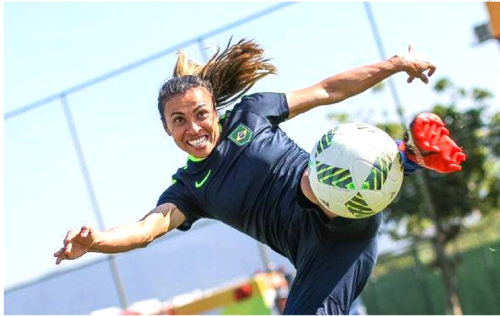
MARTA TREINOU COM MUITA DISPOSIÇÃO E DEVE REAPARECER NA SELEÇÃO BRASILEIRA

A preparação da Seleção Brasileira para o torneio foi bem mais turbulenta que a da Austrália. Teve uma série de nove derrotas e três jogadoras cortadas por lesão. Para piorar, a equipe perdeu para estreia sua maior jogadora. A meio-campista e atacante Marta,