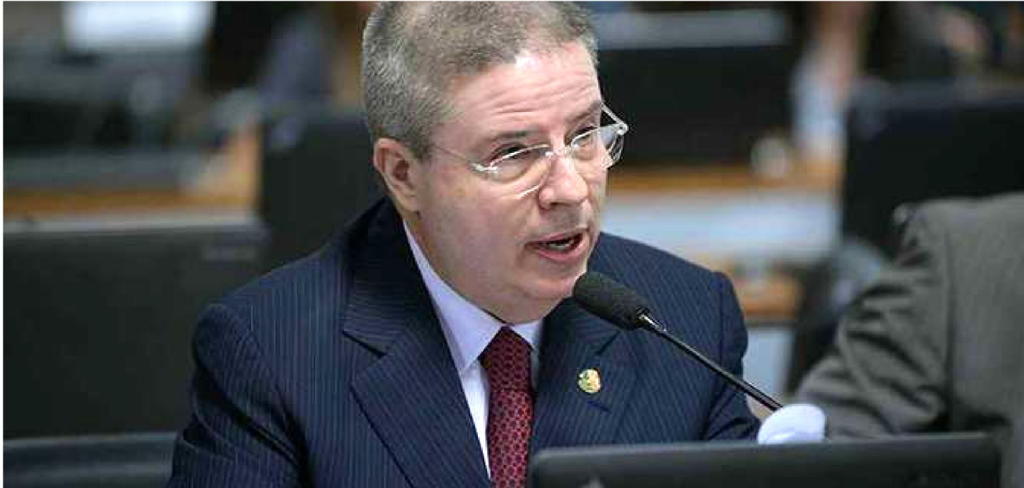
SENADOR ANTÔNIO ANASTASIA, RELATOR DA PEC 91/2019, CUJA PROPOSTA ALTERA A TRAMITAÇÃO DAS MEDIDAS PROVISÓRIAS

Senadores que integram a Comissão de Constituição, Justiça e Cidadania delegaram para o plenário o debate sobre a aprovação da proposta de emenda à Constituição PEC 91/2019. A proposta altera a tramitação de Medidas Provisórias e garante ao Senado pelo menos 30 dias para analisar medidas do governo Bolsonaro. O texto será debatido entre os líderes e pode até ser encaminhado à Câmara se não houver entendimento.