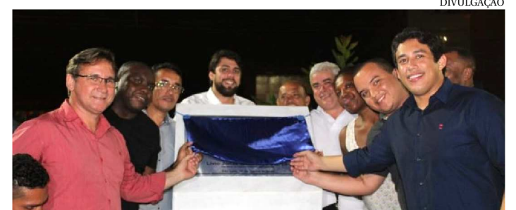
MORADORES FAZEM FESTA DURANTE INAUGURAÇÃO

Os moradores do bairro Bom Jesus, localizado nas proximidades do Coroadinho, fizeram uma grande festa para inaugurar a Praça Bom Jesus, primeiro equipamento de esporte e lazer da comunidade, inaugurada na tarde de segunda-feira (10). O espaço soma-se aos outros sete já entregues pelo Governo do Estado, por meio da Agência Executiva Metropolitana (AGEM), em parceria com a Prefeitura de São Luís. A Praça Bom Jesus foi construída em uma área mal iluminada que antes era utilizada por alguns moradores para descarte de lixo. Agora a realidade é outra. Os 1.013,36m², que constituem a área do local, foram totalmente revitalizados e, o que antes era espaço para matagal, agora está ocupado com academia ao ar livre para a prática de esportes, playground, áreas com canteiros e bancos para descanso e leitura, além de arborização, proporcionando sombra e espaço arejado.