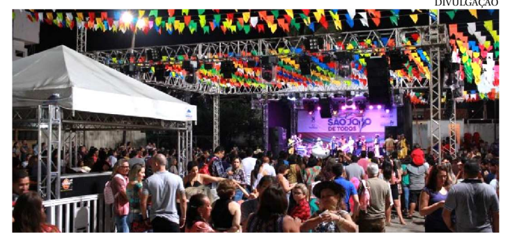
ARRAIAS COMEÇAM OFICIALMENTE DIA 19

O São João do Maranhão teve início em maio com a decoração de bandeirinhas no Centro Histórico e, na primeira semana de junho, com as prévias juninas. Mas, é entre os dias 19 e 30 de junho que se iniciam os arraiais oficiais realizados pelo Governo do Maranhão, por meio da Secretaria de Estado de Cultura (Secma), na Praça Maria Aragão, no Centro Histórico de São Luís; e no Ipem, no bairro do Calhau. Neste ano, as festas juninas, no Maranhão, têm mais novidades para o público: os arraiais oficiais contarão com estrutura pensada para proporcionar acessibilidade. Esse mesmo serviço foi disponibilizado no Carnaval de Todos deste ano. No Arraial do Ipem, um dos mais populares de São Luís, além da decoração com os famosos mosaicos de bandeirinhas, de palco para apresentação de grupos da cultura popular, Barracão do Forró e espaço para venda de artesanato, a estrutura física do local foi pensada para garantir o divertimento de pessoas com necessidades especiais.