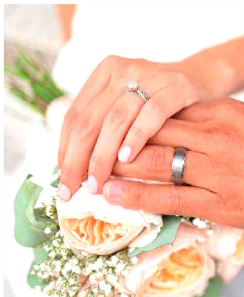
Simpatia para quem quer se casar

Outra história muito popular que tenta ilustrar o assunto é a da moça devota que, cansada de esperar anos por um marido, se irritou com a imagem do santo e a arremessou pela janela. A imagem, por sua vez, atingiu a cabeça de um rapaz que estava de passagem, e a donzela revoltada foi pedir desculpas ao moço. Os dois, naturalmente, apaixonaram-se e casaram-se.