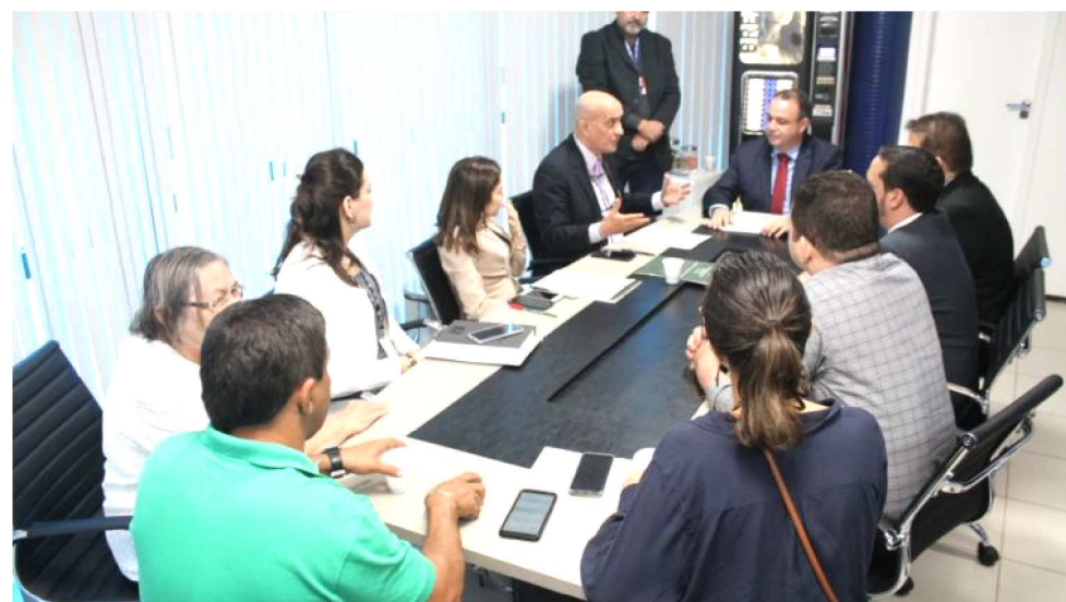
REUNIÃO ENTRE A FAMEM E O PODER JUDICIÁRIO TRATOU SOBRE O ASSUNTO

No mês de julho, a Famem vai promover o seminário conhecendo o Sistema de Inspeção Municipal, em parceria com Confederação Nacional dos Municípios, Conab, Ministério Público do Estado do Maranhão, Sedes e órgãos vinculados ao sistema agrário do estado. No evento, o prefeito do estado de Mato Grosso do Sul vai apre-