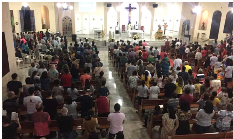
DIA 13 DE JUNHO É COMEMORADO O DIA DE SANTO ANTÔNIO NA CAPITAL MARANHENSE

O ápice da festa é hoje, quando acontecem sete missas. A primeira co-