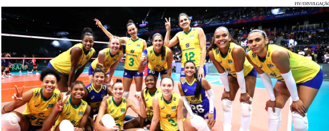
MENINAS DO VÔLEI BRASILEIRO VÃO BEM NA COPA DAS NAÇÕES E BUSCAM LUGAR NA FINAL

A Seleção Brasileira Feminina de Vôlei conseguiu a oitava vitória na Liga das Nações. Na madrugada de ontem (12), a equipe verde e amarelo superou a Tailândia por 3 sets a 0 (25/19, 25/17 e 25/21), em Tóquio, no Japão. A ponteira Gabi se destacou e foi a maior pontuadora entre as brasileiras, com 12 acertos. O Brasil busca um lugar na fase final da competição.