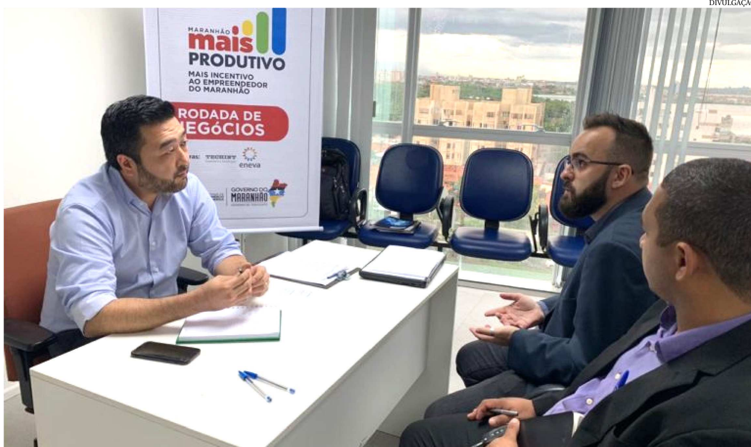
A OBRA, ESTIMADA EM R$ 1,3 BILHÃO, FOI ANTECIPADA EM SEIS MESES PELA ENEVA, EMPRESA RESPONSÁVEL PELO EMPREENDIMENTO

Com a proposta de dar oportunidade às micro e pequenas empresas instaladas no Maranhão, ampliando o acesso a novos mercados, o Governo do Estado, por meio da Secretaria de Indústria, Comércio e Energia (Seinc), realizou, na segunda-feira (10), mais uma rodada de negócios. Desta vez, 43 empresas participaram da ação.