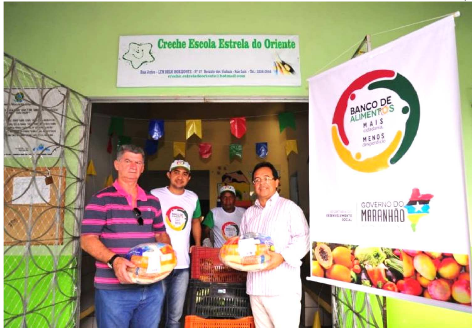
AS DOAÇÕES VÃO GARANTIR UMA ALIMENTAÇÃO DE QUALIDADE E DIGNA ÀS CRIANÇAS

“Sem dúvida o serviço ofertado pelo Governo do Estado, por meio da criação do Banco de Alimentos, terá impacto considerável no funcionamento das entidades. Só hoje conseguimos entregar mais de 2 toneladas de alimentos, dentre cestas básicas,