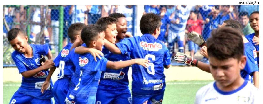
GAROTADA FESTEJOU A CONQUISTA DO TÍTULO NA CATEGORIA SUB 9 NO FUTEBOL 7

Com emoção de sobra, os primeiros campeões estaduais de futebol 7 foram finalmente conhecidos. As equipes do Society Club Calhau, Juventude Maranhense e Cruzeiro SLZ/Apcef conquistaram o Campeonato Maranhense da modalidade nas categorias Sub-7, Sub-9 e Sub-11, respectivamente. As finais ocorreram no campo do A&D Eventos, no bairro do Turu.