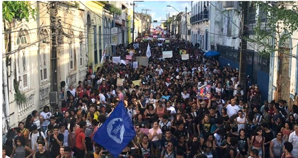
MANIFESTAÇÃO DA EDUCAÇÃO ACONTECEU NO DIA 30 DE MAIO EM TODO O BRASIL

As confirmações das entidades foram comunicadas a O Imparcial por representantes do Sindicato dos Bancários, da Associação dos Professores da Universidade Federal do Maranhão (Apruma), do Sindicato Nacional dos Servidores Federais da Educação (Sinasefe), Sindicato dos Servidores Públicos (Sindsep), Sindicato dos Urbanitários, Sindicato dos Trabalhadores da Justiça Federal (Sintrajufe), Sindicato da Educação (Sindeducação), Sindicato dos Trabalhadores em Educação Pública do Maranhão (Sintroesema), Sindicato dos Servidores