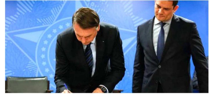
BOLSONARO CONVERTEU EM LEI A MP DAS MUDANÇAS

O presidente Jair Bolsonaro converteu em lei a medida provisória que reestruturou os ministérios de sua gestão. O texto assinado por Bolsonaro veio com alguns vetos, como pontos relacionados ao Conselho de Controle de Atividades Financeiras (Coaf) e a registro sindical.