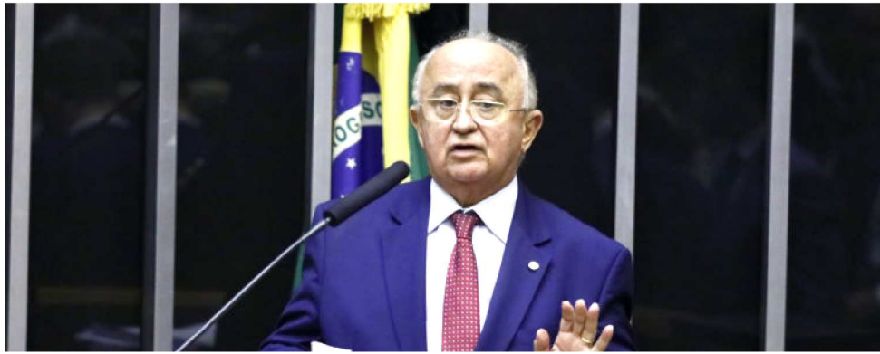
DEPUTADO JÚLIO CESAR, DO PIAUÍ, É O AUTOR DO PROJETO DE LEI QUE MUDA O FPM

1% escalonado em quatro etapas ao longo dos próximos quatro anos, a partir de 2020. Ou seja: 0,25% de acréscimo a partir do próximo ano até alcançar o aumento total em 2024. O relator calcula que a mudança deve liberar quase R$ 60 bilhões para os municípios nos próximos 10 anos.