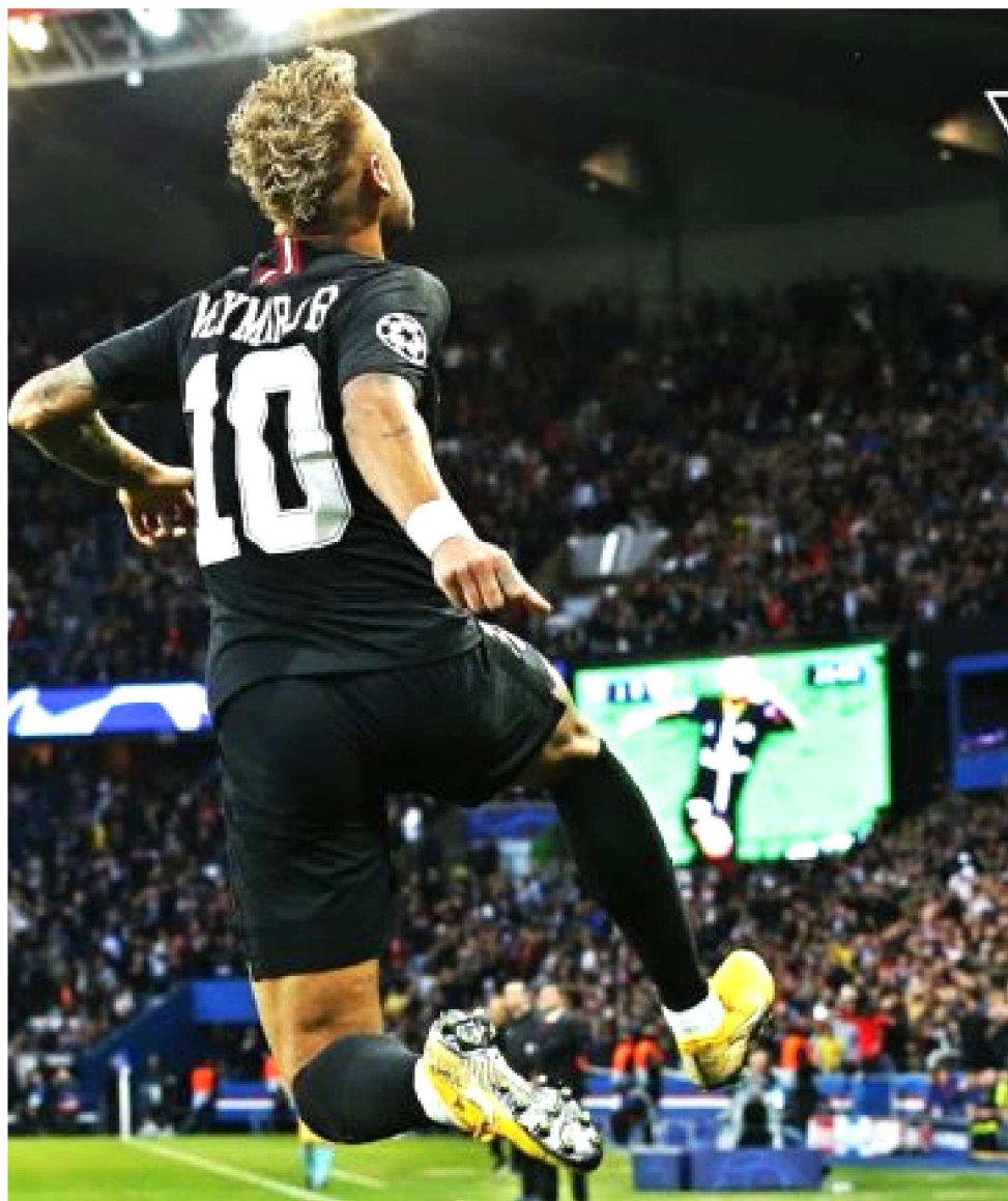
O RETORNO DE NEYMAR AO BARCELONA REALMENTE ESTÁ BEM ENCAMINHADO

O jogador já anunciou que está de saída do Atlético de Madrid, e o clube da Catalunha seria o provável destino,