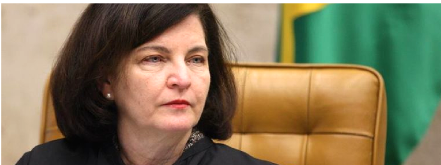
PROCURADORA-GERAL DA REPÚBLICA, RAQUEL DODGE, PODE PERMANECER MESMO FORA DA LISTA TRÍPLICE DO ÓRGÃO