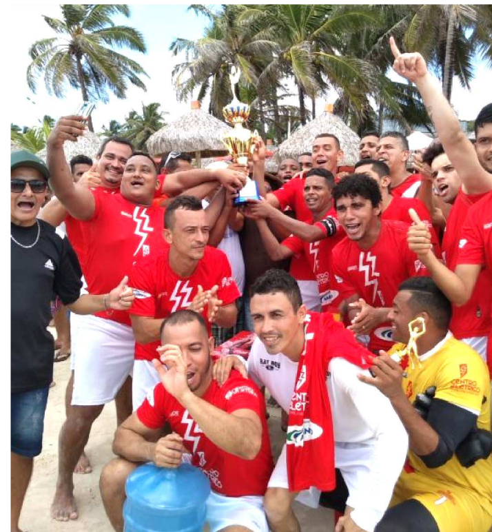
CENTRO ELÉTRICO CONQUISTOU O 4º TÍTULO DA COMPETIÇÃO

O 30º Campeonato de Futebol de Praia dos Comerciários de São Luís edição 2019, promovido pelo Sindicato dos Empregados no Comércio de São Luís (Sindcomerciários), é a competição amadora mais importante da capital.