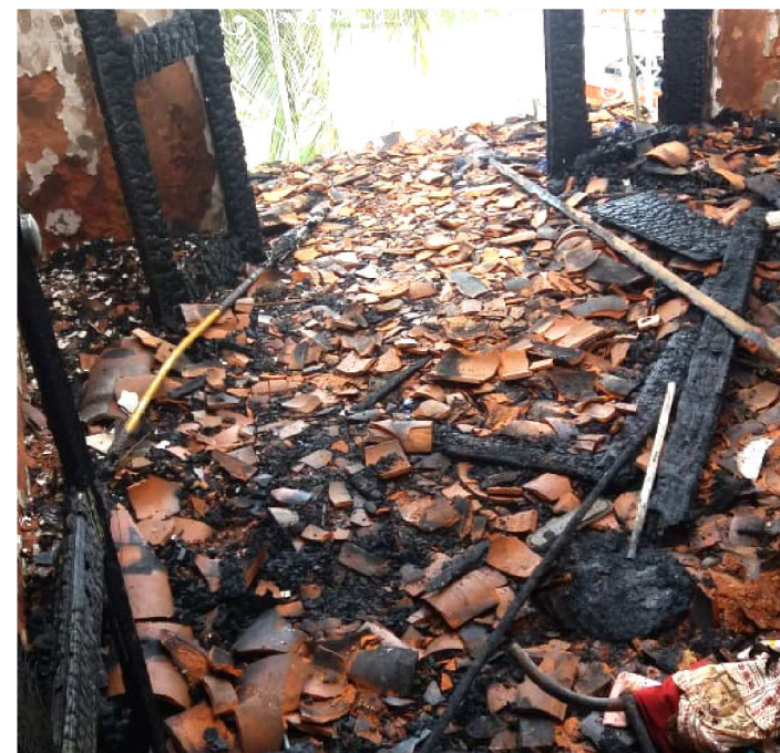
CÔMODO DE CASA FICOU TOTALMENTE DESTRUÍDO COM FOGO