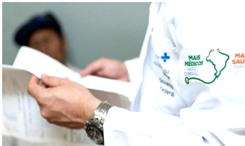
OS PROFISSIONAIS DA SAÚDE DEVEM CHEGAR ÀS CIDADES ATÉ O DIA 28 DE JUNHO

Para tanto, o Ministério da Saúde estabeleceu "critérios de classificação, como títulos de Especialista e/ou Residência Médica em Medicina da Família e Comunidade".