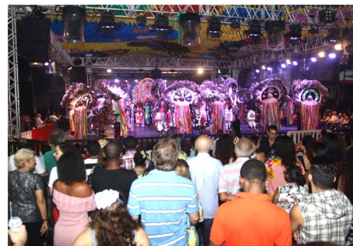
ARRAIAS, UM DOS PONTOS DE REFERÊNCIA PARA TURISTAS

Andando pelos arraiais de São Luís, é comum encontrar sotaques diferentes dos que temos. Um “r” mais puxado daqui, um chiado acolá e é possível perceber que várias pessoas de outros estados e até países nos visitam nesses dias de São João. Como diz o grupo de bumba meu boi Unidos Venceremos: “turista vem de longe para ver essa beleza que tem na ilha do amor”.