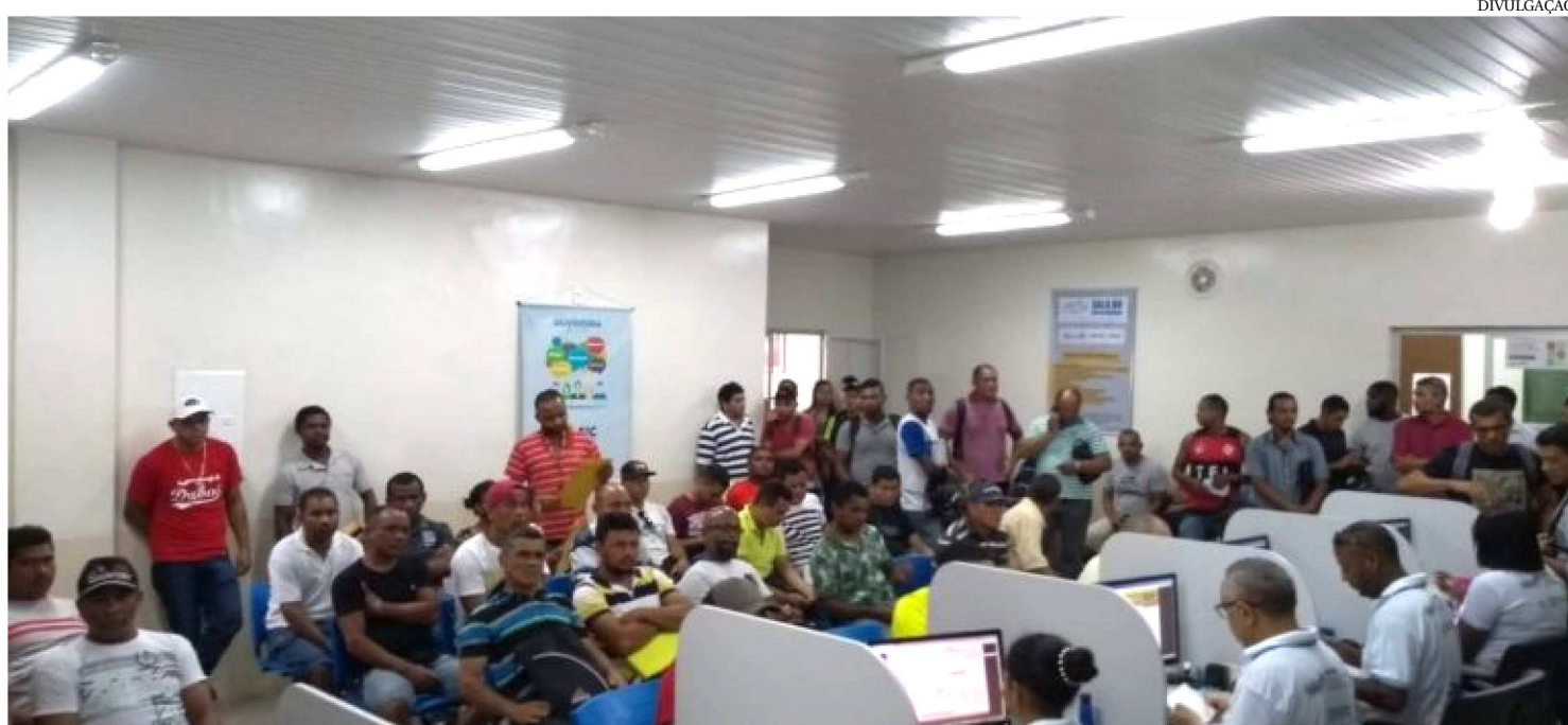
DO TOTAL DE MAIS DE 1.000 TRABALHADORES ENCAMINHADOS, O MAIOR NÚMERO FOI REALIZADO NA AGÊNCIA DO ANJO DA GUARDA

Em um cenário de desaceleração na geração de emprego, que afeta os brasileiros em âmbito nacional, o Governo do Maranhão, através da Secretaria de Estado do Trabalho e Economia Solidária (Setres), mantém os bons números de encaminhamentos de profissionais ao mercado de trabalho, por meio do Sistema Nacional de Emprego (Sine).