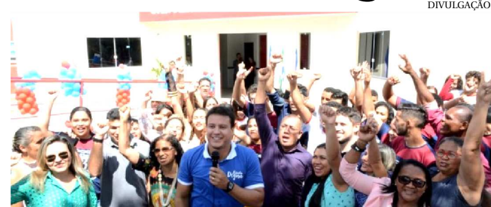
GOVERNO CONTINUA INVESTINDO EM ESCOLAS DIGNAS

Mais duas unidades do Programa Escola Digna do Governo do Maranhão foram entregues, na última quarta-feira (26), na região do Médio Mearim. Os Centros de Ensino Teresa Leite de Miranda, no município de Bom Lugar, e Nazaré Ramos, em São Luiz Gonzaga, foram totalmente reformados, beneficiando 1.500 estudantes do Ensino Médio.