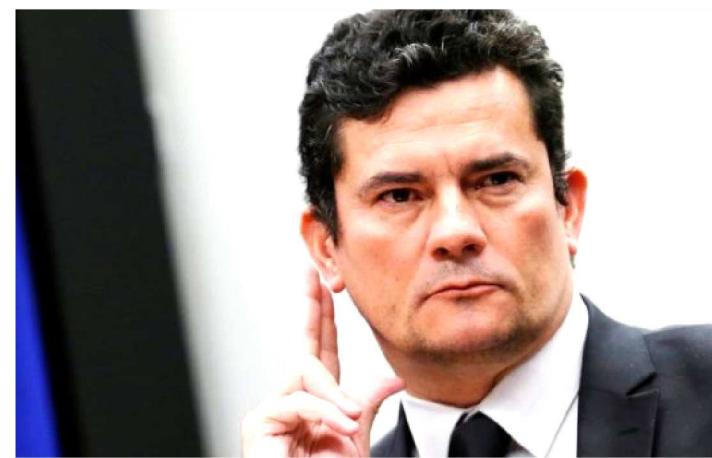
MINISTRO SÉRGIO MORO FALARÁ NA CÂMARA, AMANHÃ

Amanhã, o ministro da Justiça, Sérgio Moro, deve ser ouvido por quatro comissões da Câmara: de Constituição e Justiça e de Cidadania (CCJ); de Trabalho, Administração e Serviço Público; de Direitos Humanos e Minorias; e de Fiscalização Financeira e Controle.