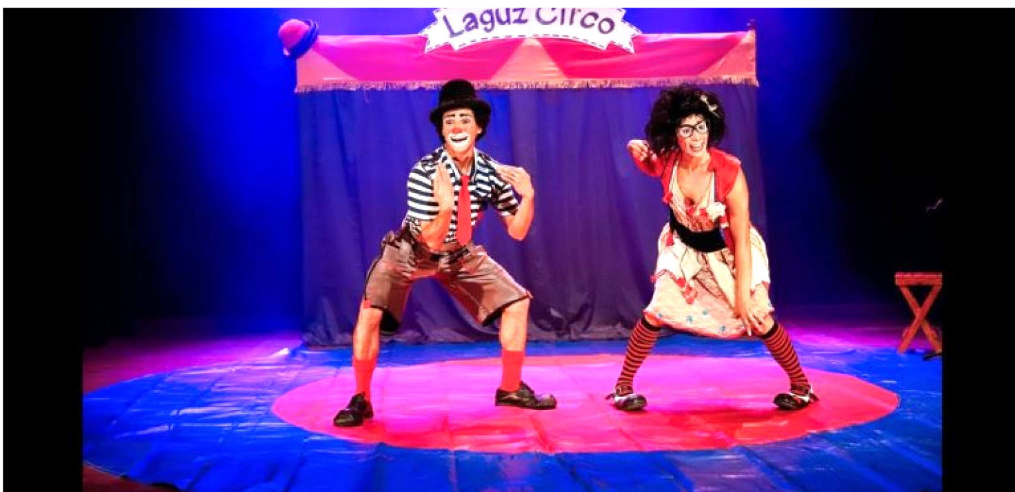
CIA LARGUZ CIRCO É UMA DAS ATRAÇÕES DAS OFICINAS OFERECIDAS À POPULAÇÃO PELO SESC CIRCO

O circo é mágico e nem precisa ser criança para saber disso. É o palhaço e suas estripulias, o acrobata e seus movimentos arriscados, a trapezista e seu voo no ar, a mistura do simples, espontâneo e até ingênuo com o grandioso, o espetacular. Com inscrições gratuitas on-line que iniciam hoje (26), pessoas a partir de 16 anos podem participar. Com oficinas locais e de outros estados, os interessados podem se inscrever até o dia 10 de julho nas seguintes turmas: Manipulação de objetos (Cia. do Relativo – SP), Acrobacia de Dupla (Cia. Laguz Circo – CE), Sentido contrário – Construindo outras formas dramáticas a partir da mágica (Rapha Santa Cruz – PE), Desenvolvimento de números de circo (Dupla GomesNinow – RJ).