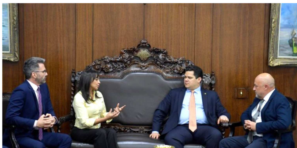
SENADORA ELIZIANE GAMA FALOU COM O PRESIDENTE DO SENADO, DAVI ALCOLUMBRE