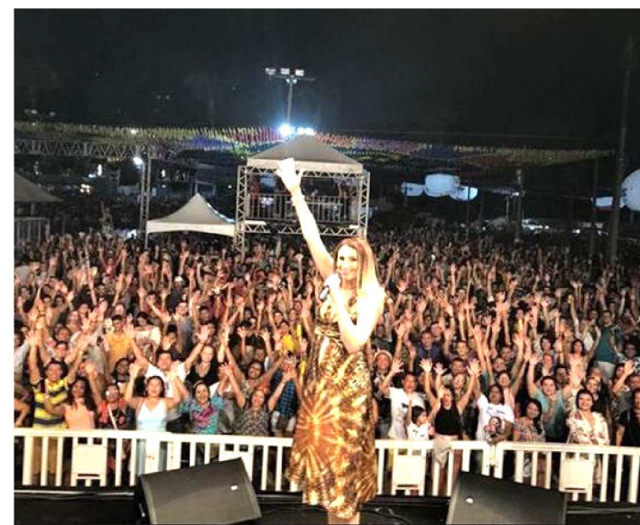
MILHARES DE PESSOAS ACOMPANHARAM SHOW DA CANTORA

A noite da última sexta-feira (28) foi marcada por muito forró e animação no Arraial do Ipem. No palco, uma das maiores compositoras de forró do Brasil, Rita de Cássia empolgou a multidão de gente que dançou por mais de 1 hora embalada por muito forró das antigas no São João do Maranhão.