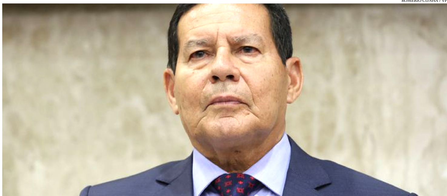
PRESIDENTE EM EXERCÍCIO, HAMILTON MOURÃO, SINALIZOU COM A POSSÍVEL VOLTA DA DISCIPLINA À GRADE CURRICULAR

O presidente da República em exercício, Hamilton Mourão, disse que o governo deve promover a volta de educação moral e cívica aos currículos escolares, em discussão no Ministério da Educação. Para ele, o ministério tem sido “um local de combate”, mas que a volta da disciplina está no “radar” do presidente Jair Bolsonaro.