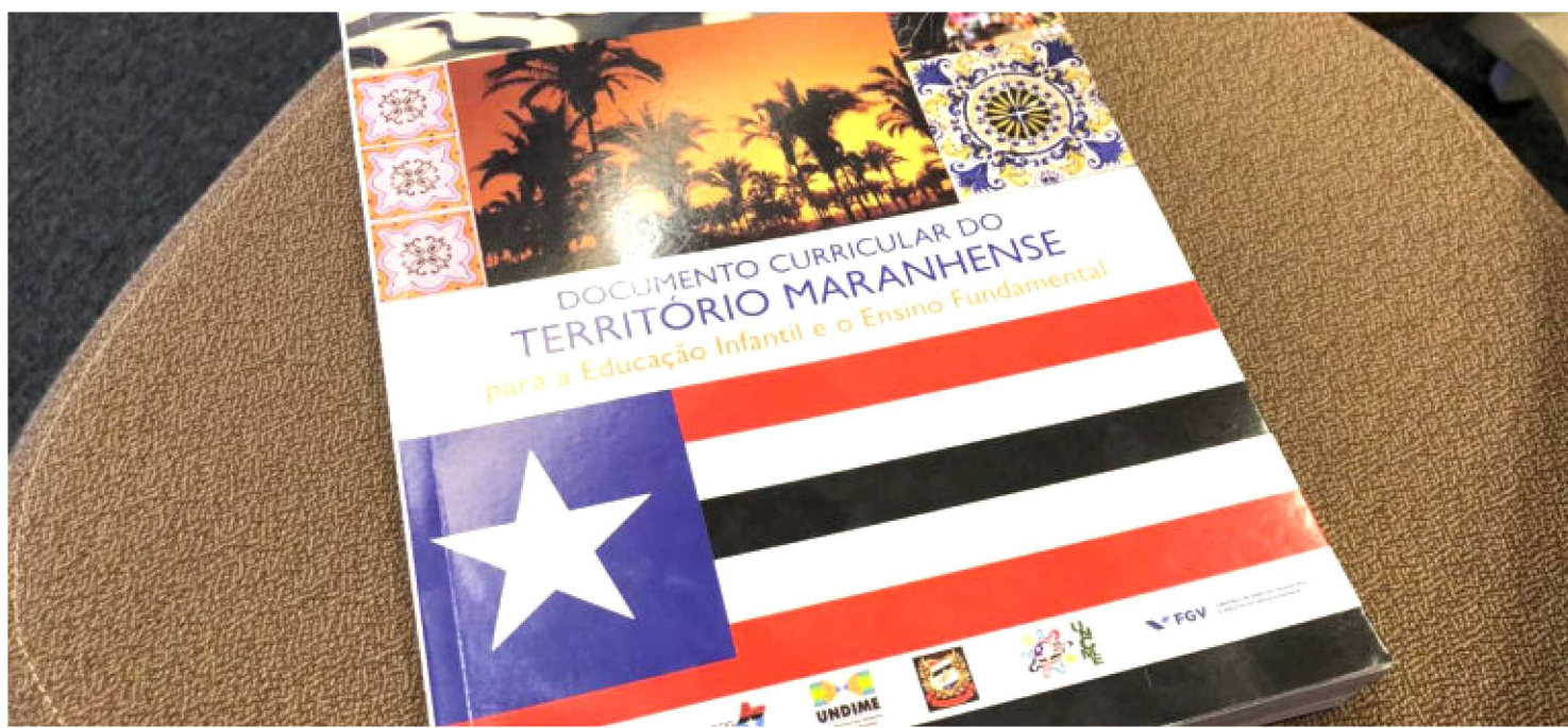
DOCUMENTO CURRICULAR DO TERRITÓRIO MARANHENSE SERÁ DISTRIBUÍDO PARA TODOS GESTORES DOS 217 MUNICÍPIOS DO ESTADO

Construído com ampla participação da sociedade, das prefeituras municipais e das associações ligadas à educação, o Documento Curricular do Território Maranhense foi disponibilizado para todos os 217 municípios do Estado.