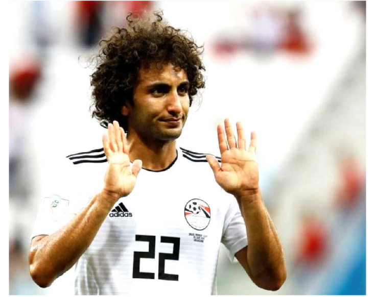
O MEIA WARDÁ É ACUSADO DE ASSEDIAR VÁRIAS MULHERES

Dias depois do anúncio de sua expulsão da seleção do Egito, que disputa em casa a Copa Africana de Nações, por conta de acusações de assédio sexual, o meia Amr Warda foi perdoado e reintegrado ao time e estará disponível para jogar após a fase de grupos da competição.