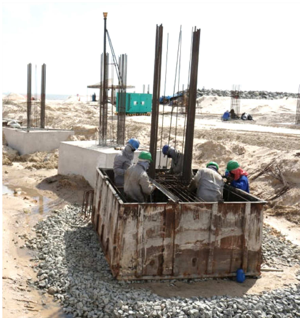
PILARES SÃO CONSTRUÍDOS COM ESTACAS ESCAVADAS A 12 METROS DE PROFUNDIDADE

As Avenidas Litorânea e Holandeses estarão requalificadas com a construção de calçadão, bares, ciclovias, estacionamentos e áreas para caminhada. “O prolongamento da litorânea e a implantação do BRT são as