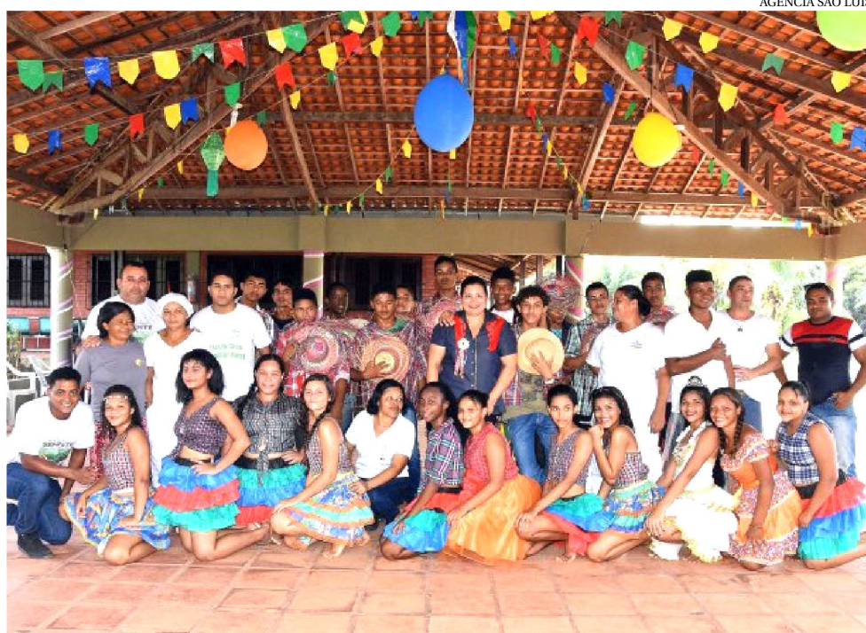
ALLUNOS DA CASA FAMILIAR RURAL DA PREFEITURA COMEMORAM COM FESTAS JUNINAS

Na Casa Familiar Rural, localizada no bairro Quebra Pote, zona rural de São Luís, a festa junina encerrou o 1º semestre do ano letivo. Todos os alunos se envolveram na organização do arraial, cuidando da decoração e da programação. No cardápio teve bolo, canjica, mingau de milho, pipoca e entre as brincadeiras, corrida de saco, dança das cadeiras, corrida de limão e quadrilha.