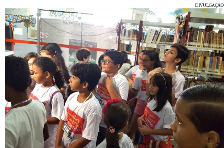
A INSCRIÇÃO GRATUITA COMEÇA NESTA SEGUNDA-FEIRA

A Biblioteca Pública Benedito Leite promove, de 23 a 26 de julho, colônia de férias voltada para filhos de servidores públicos do Estado e crianças da comunidade. O evento será realizado em parceria com a Secretaria de Estado da Gestão, Patrimônio e Assistência dos Servidores (Segep).