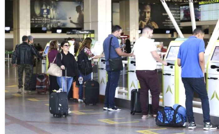
TURISTAS RESPONDEM PERGUNTAS SOBRE SETOR DE VIAGENS

REPRESENTANTES DO PROCON, PRODECON, MPDFT E OAB-DF PARTICIPAM DA BLITZ NACIONAL DOS