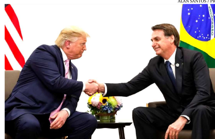
DONALD TRUMP E JAIR BOLSONARO ESTÃO ALINHADOS

Em mais um lance de alinhamento com os Estados Unidos, o presidente Jair Bolsonaro se encontrou com o norte-americano Donald Trump durante a cúpula de líderes do G20. “Somos países que, juntos, podem fazer muito pelos seus povos, de modo que possamos fazer parcerias e desenvolver o nosso país”, disse o brasileiro.