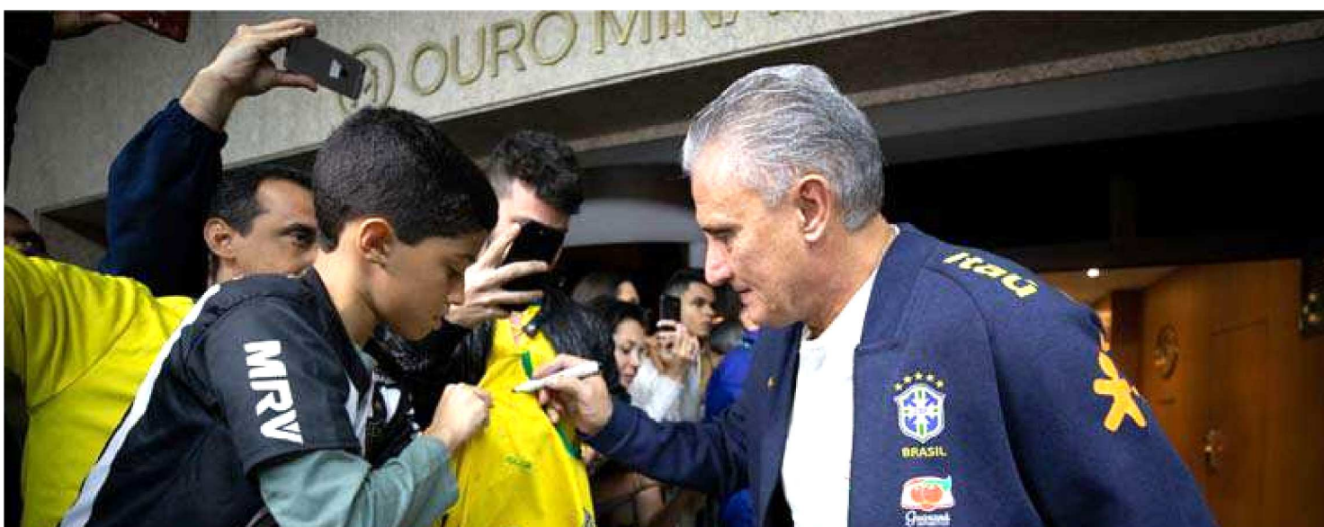
TITE TEM APENAS DUAS DERROTAS NO COMANDO DA SELEÇÃO BRASILEIRA E PODE COMPLETAR UM ANO SEM PERDER NO COMANDO

Os próximos dias podem trazer feitos importantes para o currículo do técnico Tite no comando da Seleção Brasileira. Além de nesta terça-feira a equipe enfrentar a Argentina, em Belo Horizonte, em busca de vaga na final da Copa América, o time pode completar uma marca relevante para o trabalho do treinador, ao atingir a sequência de um ano inteiro sem perder uma partida sequer.