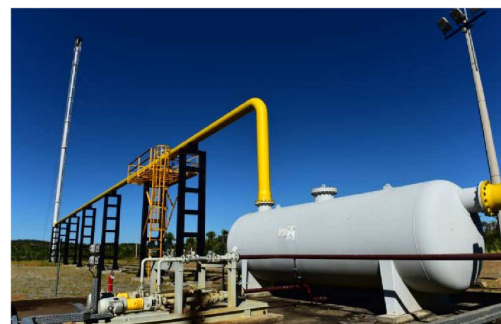
ENCONTRO REUNIU CERCA DE 43 MICRO E PEQUENAS EMPRESAS

A Eneva é a única empresa a produzir gás no Maranhão, e já transferiu mais de R$ 400 milhões em royalties e participações governamentais, regulamentadas por lei federal. A operação integrada na região do Médio Mearim – ou seja, a produção de gás associada a geração de energia – foi o que permitiu que o Estado se tornasse produtor de gás natural.