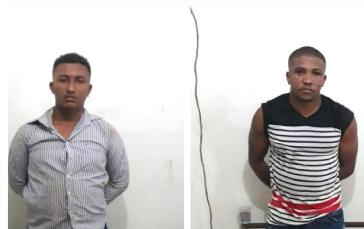
SUSPEITOS LEVARAM DA VÍTIMA MAIS DE R$ 32 MIL