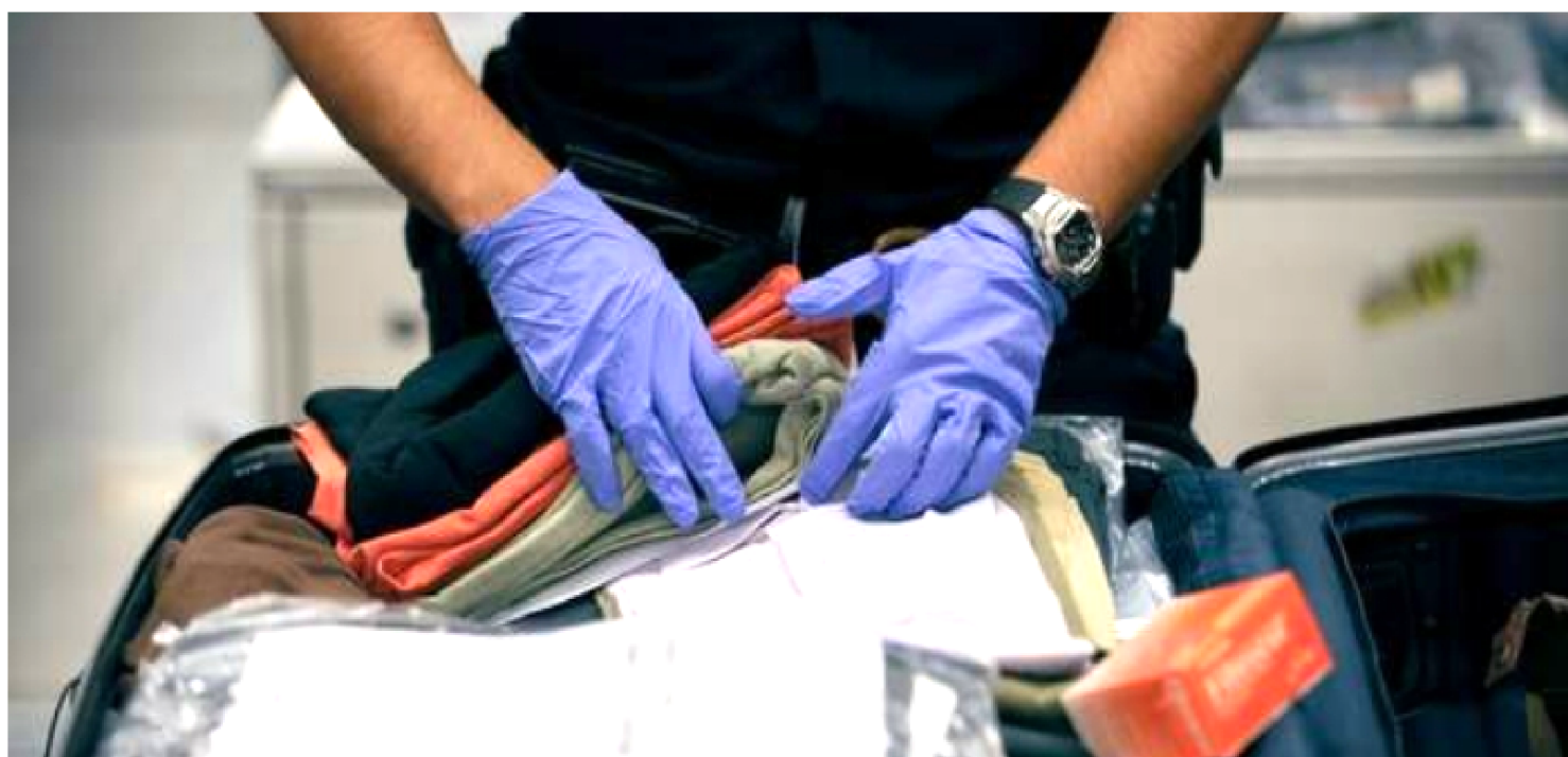
RECEITA FEDERAL DO BRASIL, POR MEIO DA INSPETORIA DE SÃO LUÍS, REITERA QUE FISCALIZAÇÃO É PERMANENTE NOS AEROPORTOS

Nos meses de julho e agosto, em razão do período de férias escolares, as operações sobre as bagagens dos viajantes provenientes e destinados ao exterior serão intensificadas no Aeroporto de São Luís. A Receita Federal do Brasil, por meio da Inspeção de São Luís, reitera que a fiscalização é permanente.