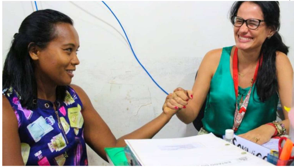
PARCERIAS SÃO PARA QUE O PROGRAMA ESTEJA PRESENTE NOS EVENTOS DO ESTADO

A Sedes faz parcerias com outras secretarias para que o programa esteja presente nos eventos promovidos pelo estado. Em junho deste ano, um dos maiores foi a entrega do Cheque Minha Casa a 1300 famílias, no ginásio do Instituto de Educação, Ciência e Tecnologia do Maranhão (Iema). Foi montada uma pracinha de alimenta-