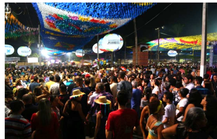
PROGRAMAÇÃO DO ARRAIAL DO IPEM VAI ATÉ O DIA 6 DE JULHO

Outro cartão postal é o complexo do Espigão Costeiro, situado na Península da Ponta d'Areia. A estrutura do Espigão foi inaugurada em 2014 e desde então, aliada com as belezas naturais de São Luís, virou um ponto turístico bastante frequentado por turmas de jovens, famílias, namorados e turistas. Lazer gratuito e indicado para quem gosta de atividades ao ar livre, em um cenário à beira-mar. Na Praça Benedito Leite, ladeada pela histórica Associação Comercial, o prédio do antigo Hotel Central, e pela Catedral da Sé, está inserida a Feirinha de São Luís, que ocorre tradicionalmente aos domingos, a partir das 7h seguindo até as 15h oferecendo música e atrações folclóricas, além de espaço dedicado para comercialização de comida típica, artesanato, frutas, verduras, artigos culturais, unindo agricultura, artes plásticas, gastronomia e literatura.