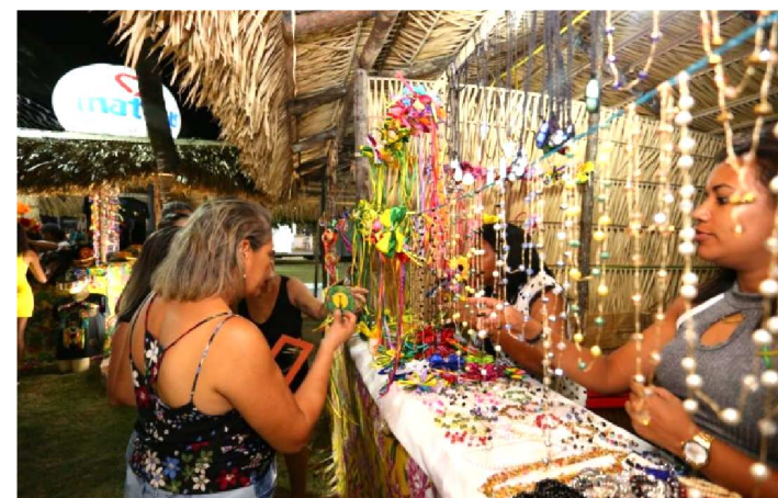
ARTESANATO ATRAIU OS TURISTAS NOS ARRAIAIS DE SÃO LUÍS

A geração de trabalho durante o São João do Maranhão, em São Luís, superou as expectativas e garantiu oportunidade de renda extra para mais de 800 pessoas. Os trabalhos foram temporários, com atividades como a comercialização de produtos nos três principais arraiais promovidos pelo governo do estado, em parceria com a Prefeitura de São Luís. Antes do período festivo, de 19 a 30 de junho, centenas de trabalhadores ajudaram a montar as estruturas dos espaços de apresentações culturais e preparar os demais detalhes da festa.