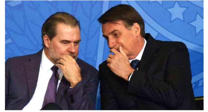
MINISTRO DIAS TOFFOLI DEFENDE QUE BOLSONARO ESCOLHA

O presidente do Supremo Tribunal Federal (STF), Dias Toffoli, afirmou que o nome escolhido pelo presidente para o cargo de procurador-geral da República (PGR) não precisa estar na lista tríplice montada por meio de votação pelos integrantes do Ministério Público Federal (MPF). No entanto, o ministro defendeu que apenas subprocuradores-gerais, que estão no topo da carreira do órgão, podem atuar nos tribunais superiores.