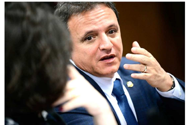
SENADOR MÁRCIO BITTAR É O RELATOR DA PROPOSTA

Proposta que torna crime o uso de caixa dois nas eleições será analisada na reunião da Comissão de Constituição, Justiça e Cidadania (CCJ) de amanhã, a partir das 10h. O Projeto de Lei (PL) 1.865/2019 é terminativo na comissão, ou seja, se não houver recurso para análise em Plenário, segue para a Câmara dos Deputados após aprovado.