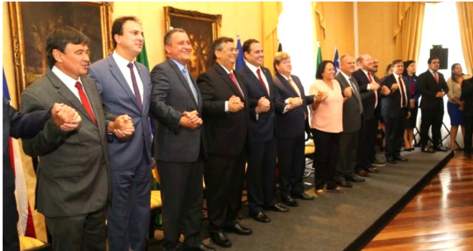
GOVERNADORES DO NORDESTE DIVULGARAM CARTA CRITICANDO SÉRGIO MORO

"É inadmissível uma atuação que se denuncia ilegal entre membros do Ministério Público e do Judiciário,