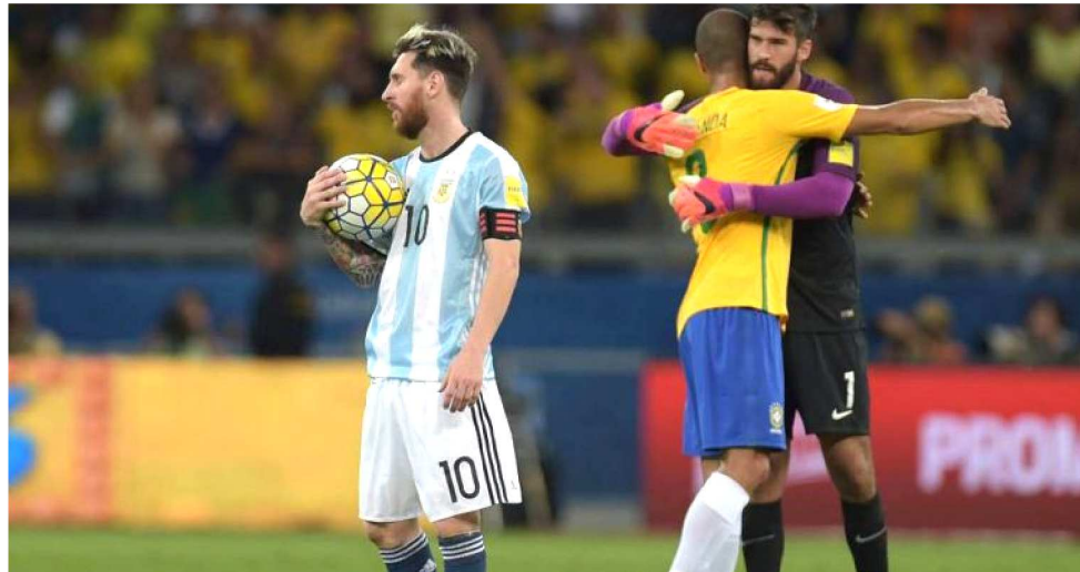
LIONEL MESSI É A PRINCIPAL ATRAÇÃO DA PARTIDA DE HOJE NO ESTÁDIO DO MINEIRÃO

O lateral-direito Daniel Alves e o atacante Lionel Messi foram companheiros de Barcelona (ESP), entre os anos de 2008 e 2016. Ambos fizeram parte do grandioso time de Pep Guardiola, que ganhou praticamente todos os troféus possíveis no período. No Barça, eles venceram três Mundiais, três Liga dos Campeões, três Supercopa Europeia, seis Campeonatos