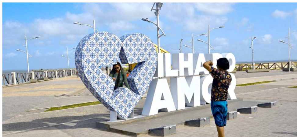
ESPIGÃO COSTEIRO NA PENÍNSULA DA PONTA D'AREIA É UM DOS PONTOS TURÍSTICOS

cremento de seis voos extras da Gol já programados para atender a demanda de alta temporada, com rotas que interligam São Luís às cidades de Brasília (DF), Belém (PA), Rio de Janeiro (RJ) e Porto Seguro (BA).