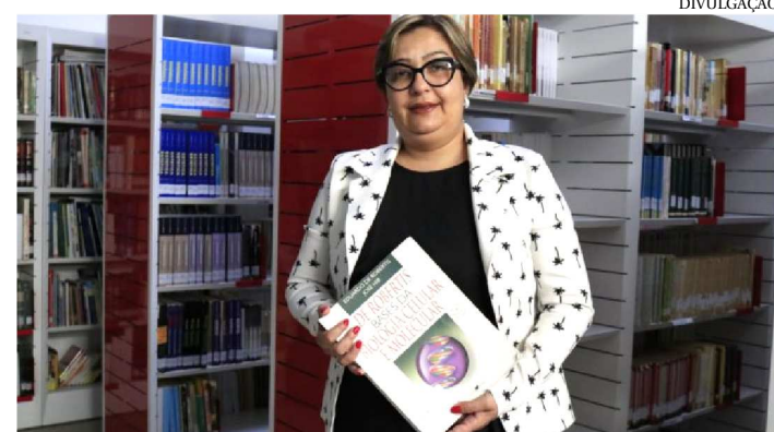
O VESTIBULAR SERÁ NESTE ANO E UM DOS MAIS CONCORRIDOS