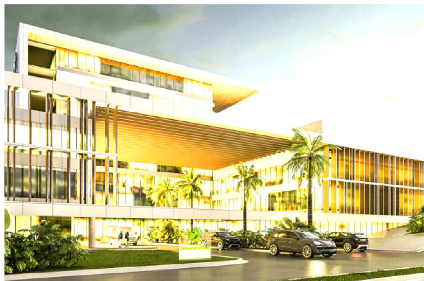
Nestes 30 anos, o HSD ampliou sua estrutura física, aumentou o número de leitos de internação e Unidade de Terapia Intensiva (UTI); entre outras novidades