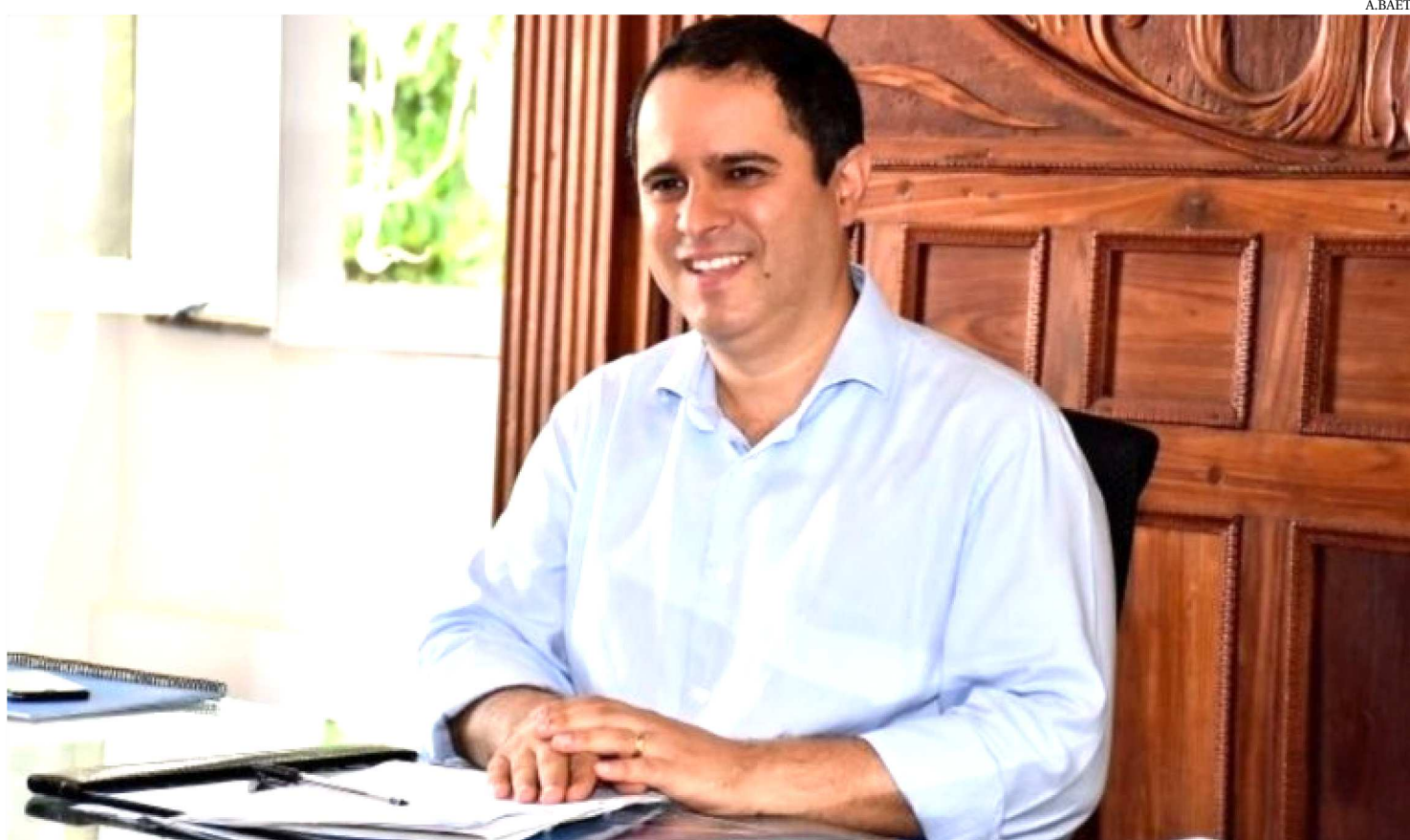
O PREFEITO EDIVALDO HOLANDA JÚNIOR PAGA NA PRÓXIMA SEXTA-FEIRA (19) A PRIMEIRA PARCELA DO 13º SALÁRIO AOS SERVIDORES

O prefeito Edivaldo Holanda Júnior paga na próxima sexta-feira (19) a primeira parcela do 13º salário aos servidores municipais. Uma ótima notícia para os servidores e para o comércio local que será aquecido. A exemplo do ano passado, a Prefeitura de São Luís, mais uma vez, antecipa o calendário de pagamentos que indicava que o 13º seria pago integralmente, em dezembro. Além de demonstrar comprometimento com os servidores públicos municipais, o prefeito Edivaldo contribui com a movimentação do comércio local, aumentando o poder de compra de parte da população ludovicense que compõe o quadro da Prefeitura.