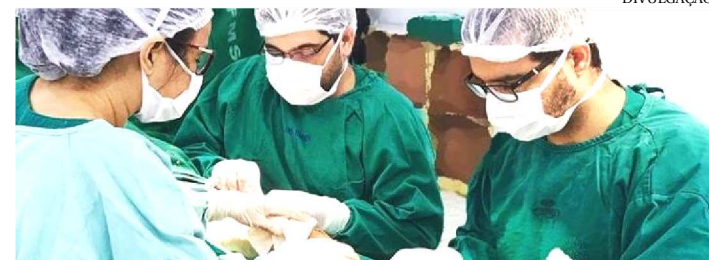
O HOSPITAL OFERECE ESPECIALIDADE VASCULAR

O Hospital Regional Alarico Pacheco, em Timon, tem devolvido à população da região qualidade de vida. A unidade realiza, há um ano e meio, procedimento avançado para tratamento de varizes, aqueles alargamentos e dilatações das veias, que, se não tratados, podem gerar complicações como dores, inchaço e, em casos mais sérios, até trombose.