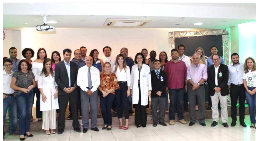
Jornalistas e a diretoria do hospital na manhã de festa e confraternização

Ao longo destes 30 anos, o hospital só cresceu, tanto em estrutura física quanto em pessoal, equipamentos e tecnologia. São constantes os investimentos em infraestrutura. Reformas, adaptações e construção de prédios fazem parte da história do HSD e, atualmente, está sendo executado o Plano Diretor de Expansão, que tem obras previstas até 2023 para se adequar sempre às transformações e demanda da capital por atendimento de saúde de qualidade. O padrão de qualidade no atendimento está chancelado por importantes titulações de creditações nacionais e internacionais, como a Organização Nacional de Acreditação (ONA), níveis I, II e III, concedida pelo IQG (Health Services Accreditation), maior acreditadora da América Latina; e a Qmentum International Diamond, certificação internacional concedida pela Accreditation Canada Internacional. O HSD foi o primeiro hospital do Maranhão a obter esta certificação internacional.