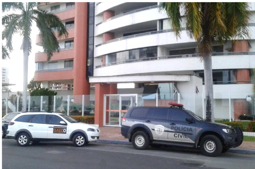
A OPERAÇÃO DEU CUMPRIMENTO A MANDADO DE PRISÃO EM PRÉDIO NO RENASCENÇA