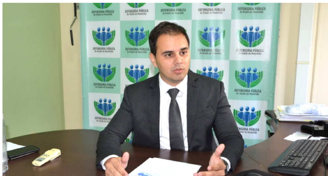
DEFENSOR-GERAL, ALBERTO BASTOS, DEVE REALIZAR MAIS MUDANÇAS PARA ECONOMIA DA DPE

Economizar! Essa é a palavra utilizada na Defensoria Pública do Estado do Maranhão (DPE-MA). Uma reformulação no sistema de transporte utilizado pela DPE-MA gerou uma economia, no primeiro semestre deste ano, de R$ 194.328,20, o que corresponde a um percentual de redução de 92,14%.