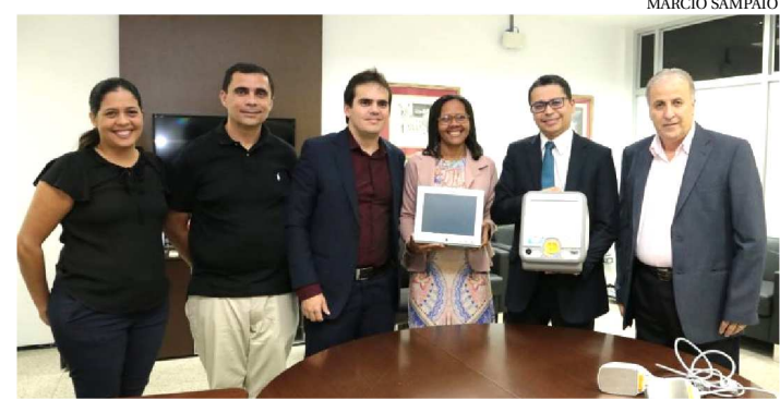
OS EQUIPAMENTOS SERÃO DISTRIBUÍDOS NOS HOSPITAIS E UPA

A Secretaria de Estado da Saúde (SES) recebeu, nesta terça-feira (16), 90 monitores multiparamétricos e 50 desfibriladores/cardioversores doados pelo Ministério da Saúde (MS), por meio de convênio com a Universidade Federal da Paraíba (UFPB). A doação foi feita por meio do Programa Parcerias para o Desenvolvimento Produtivo (PPDP), que visa equipar a saúde pública com equipamentos considerados estratégicos para o Sistema Único de Saúde (SUS).