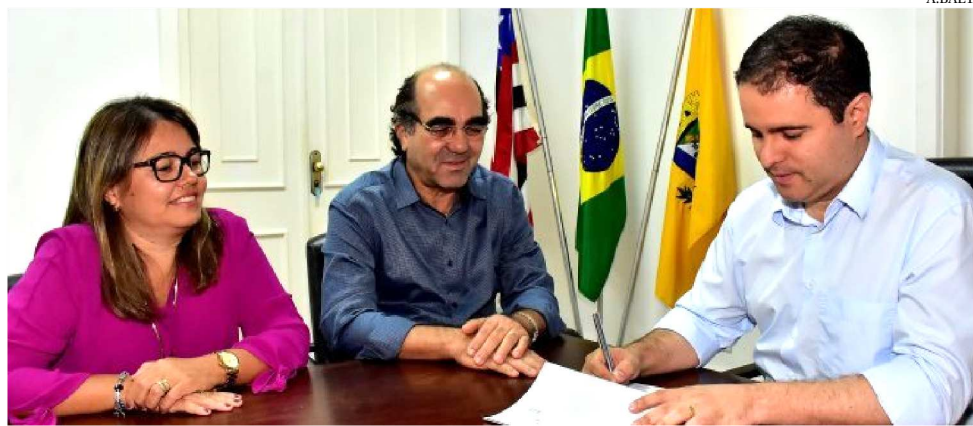
FORAM CONVOCADOS MAIS 64 APROVADOS PARA A ÁREA DA EDUCAÇÃO

Os novos convocados para área da Educação devem comparecer, conforme quadro indicativo com data e horário individuais constantes nos res-