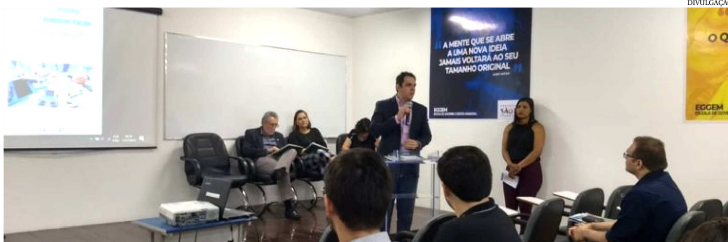
O WORKSHOP APRESENTA AOS NOVOS AUDITORES DA SECRETARIA MUNICIPAL DA FAZENDA O RESUMO DAS AÇÕES DE CADA SETOR

A Prefeitura de São Luís, através da Escola de Governo e Gestão Municipal (Eggem) e da Secretaria Municipal de Fazenda (Semfaz), realiza até dia 23 de julho um workshop para capacitar os novos Auditores Fiscais de Tributos, recém nomeados pela gestão do prefeito Edivaldo Holanda Júnior. Com a inclusão dos novos profissionais ao serviço fazendário municipal, a gestão do prefeito Edivaldo reforça o quadro de servidores que atuam na área, visando ampliar as ações de modernização do setor.