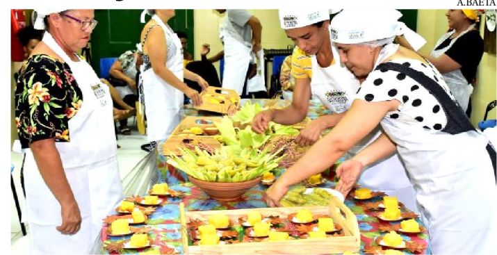
A OFICINA DE MACAXEIRA SERÁ NOS DIAS 22 E 23 DESTE MÊS

A Prefeitura de São Luís, em mais uma iniciativa da gestão do prefeito Edivaldo Holanda Júnior, oferece à população, nos dias 22 e 23 deste mês, a oficina de macaxeira e seus derivados. A ação, que acontece no Centro de Capacitação em Culinária Típica, que funciona no Museu da Gastronomia Maranhense, tem objetivo de resgatar as bases gastronômicas do Maranhão e, ao mesmo tempo, oferecer oportunidade gratuita de capacitação para a geração de emprego e renda por meio da exploração da culinária tipicamente maranhense. A oficina faz parte do programa Férias Culturais e as inscrições poderão ser realizadas gratuitamente na sede do Museu da Gastronomia (Rua da Estrela, nº. 83, C entro Histórico de São Luís) de segunda a sexta-feira, das 8h às 18h.