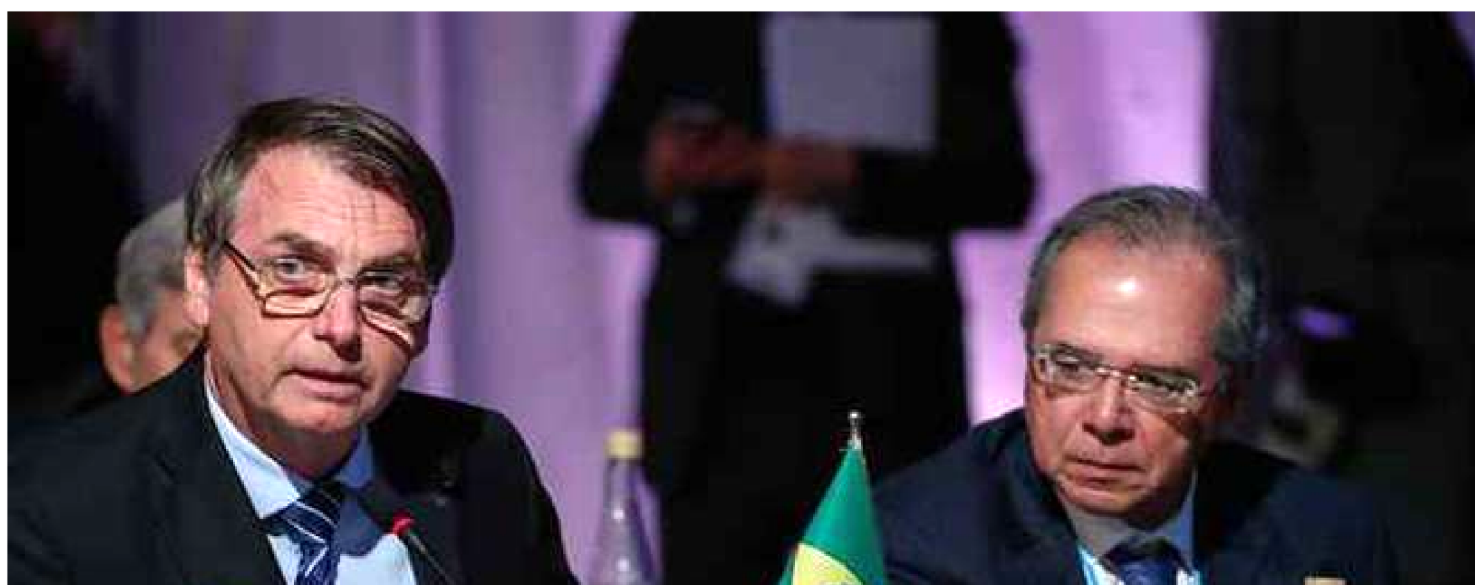
PRESIDENTE JAIR BOLSONARO DISSE QUE VAI TRABALHAR PARA ACELERAR A MODERNIZAÇÃO DO BLOCO SUL-AMERICANO

O presidente Jair Bolsonaro embarcou, na manhã de ontem (17), para a Argentina, onde vai participar da 54ª Cúpula de Chefes de Estado do Mercosul em Santa Fé. O principal acordo a ser assinado é o que elimina a cobrança de roaming internacional de serviços de telecomunicações entre pessoas que residem nos países-membros do bloco.