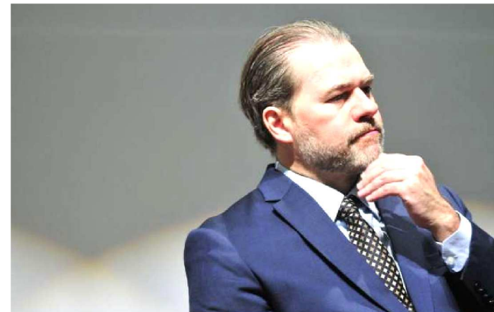
TOFFOLI SUSPENDEU PROCESSO CONTRA FLÁVIO BOLSONARO

A decisão do presidente do Supremo Tribunal Federal (STF), Dias Toffoli, que suspende todos os processos que usam dados fiscais e bancários de contribuintes sem autorização judicial afeta não somente a investigação contra o senador Flávio Bolsonaro (PSL-RJ), suspeito de desviar dinheiro público quando era deputado estadual. A liminar impacta diretamente o combate à lavagem de dinheiro no país, de acordo com integrantes do Ministério Público Federal (MPF).