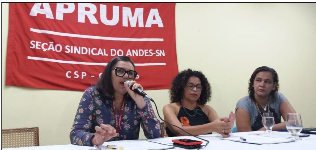
O programa publicado pelo ministro da Educação nessa quarta (17) propõe que financiamento de universidades públicas seja feito por empresas. Segundo Apruma, pode ser negativa à Federal Maranhense

As diretrizes do ‘Future-se’ afirmam, tam-