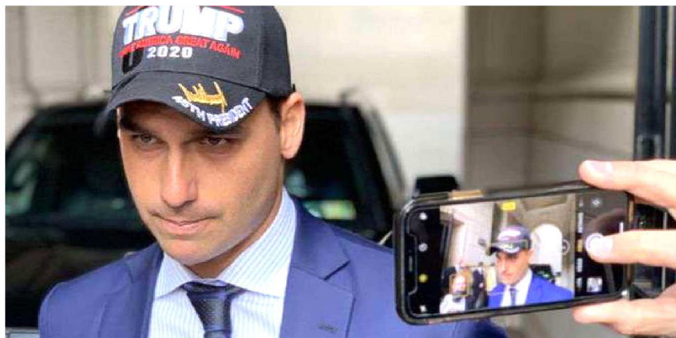
DEPUTADO EDUARDO BOLSONARO SERÁ SABATINADO SE FOR INDICADO EMBAIXADOR

Os diálogos são incipientes, mas ganham força dia após dia desde que o presidente comentou o tema, na última quinta-feira. A confirmação de Eduardo deve ser feita até o fim deste mês, uma vez que Bolsonaro não tem “plano B”. As costuras estão sendo conduzidas junto aos parlamentares da Comissão de Relações Exteriores (CRE) do Senado para “desempatar” o placar, que nas contas de congressistas e interlocutores governistas está próximo de oito votos favoráveis e oito contrários. Até a noite nesta terça-feira (16/7), dois votos ainda eram desconhecidos na sondagem de articuladores contatados pelo Correio. O do senador Romário (Podemos-RJ) e da quinta vaga, ainda não definida, do bloco MDB, PRB, PP. É esse posto vago o alvo central das articulações. O líder do governo no Senado, Fernando Bezerra (MDB-PE), suplente da CRE,