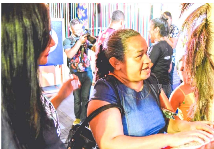
ELES TESTARAM E APROVARAM OS EQUIPAMENTOS SENSORIAIS

Um grupo de deficientes visuais, ligados ao Centro Desportivo Maranhense de Cegos (Cedemac), fez uma visita especial ao Arraial Energia do São João no Ceprama.