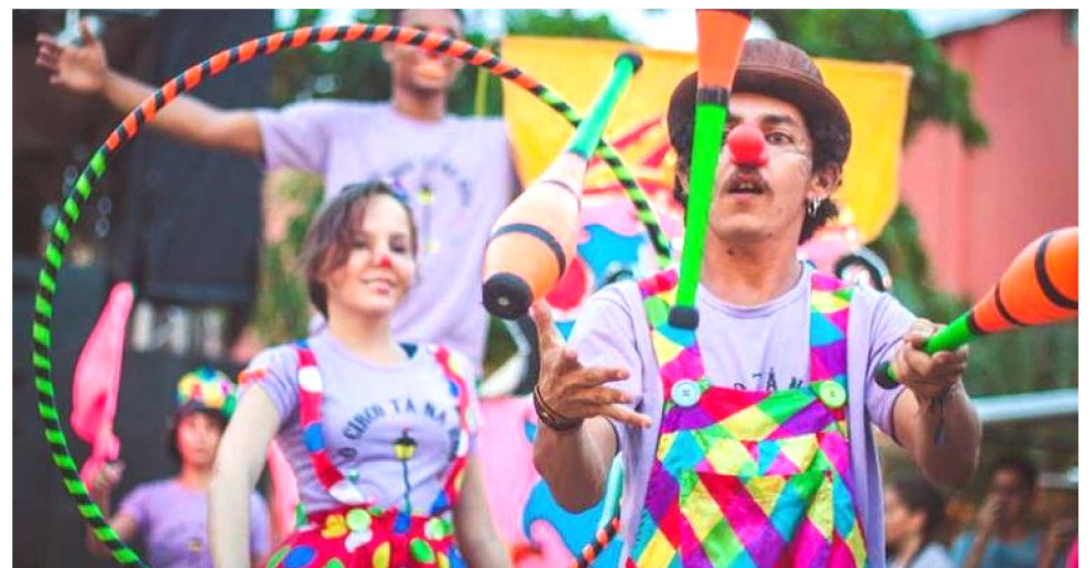
CIRCO TÁ NA RUA É UMA DAS ATRAÇÕES DA EDIÇÃO DO SESC CIRCO DESTA SEMANA

Debate sobre a importância do circo enquanto linguagem artística democrática, social e transformadora que