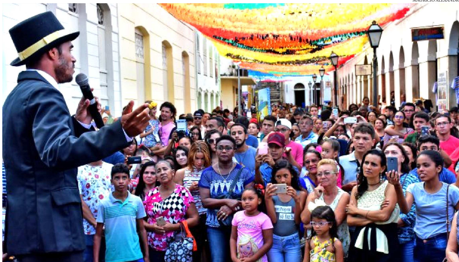
O PROGRAMA FÉRIAS CULTURAIS CONTINUA AGITANDO O CENTRO HISTÓRICO DA CAPITAL NESTA QUINTA-FEIRA, A PARTIR DAS 16H