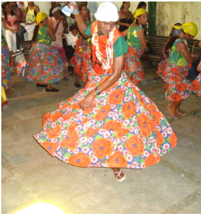
O TAMASSAÊ FOI CRIADO NO CARNAVAL DE 1940, EM ICATU

O interior do Maranhão é repleto de brincadeiras populares. Algumas são mais conhecidas e costumam se apresentar em São Luís, como o Pela Porco (dança do Lelê), da região do Munim, e outras mais raras e tão originais quanto o Baião, o Lili e tantas outras. O Tamassaê, de Icatu, é uma destas raras brincadeiras que surgem em povoados distantes e se tornam uma das referências dos locais onde foram criadas.