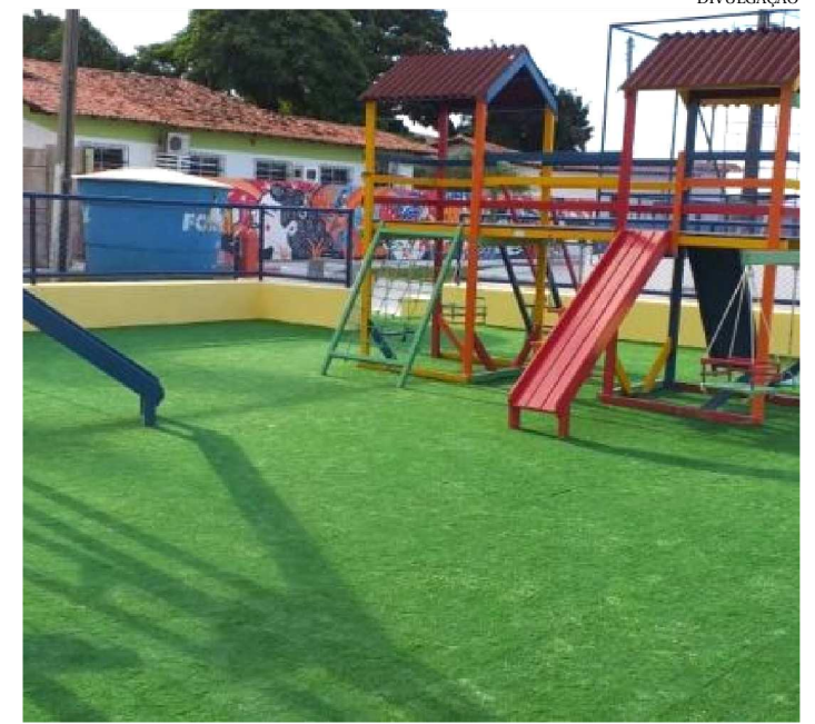
A REINAUGURAÇÃO DA PRAÇA SERÁ ÀS 18H DESTA SEXTA

O Governo do Estado entrega, nesta sexta-feira (19), às 18h, a Praça da Juventude do bairro João de Deus, em São Luís. O equipamento dispõe de quadra poliesportiva, playground, academia ao ar livre, pista para caminhada, internet gratuita, além de melhorias na urbanização e iluminação, que contribuem na democratização do acesso ao esporte e ao lazer, estimulando a inclusão social, cultural e científica em um amplo espaço de convivência comunitária.