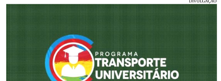
OS BENEFICIADOS PODEM RECEBER ATÉ DIA 9 DE AGOSTO

O Governo do Estado, através da Secretaria de Estado Extraordinária da Juventude (Seejuv) e da Secretaria de Direitos Humanos e Participação Popular (Sedihpop), vem tornar público que já está disponível para saque o benefício do grupo 1 dos contemplados no Programa Cartão Transporte Universitário edital 2019.1.