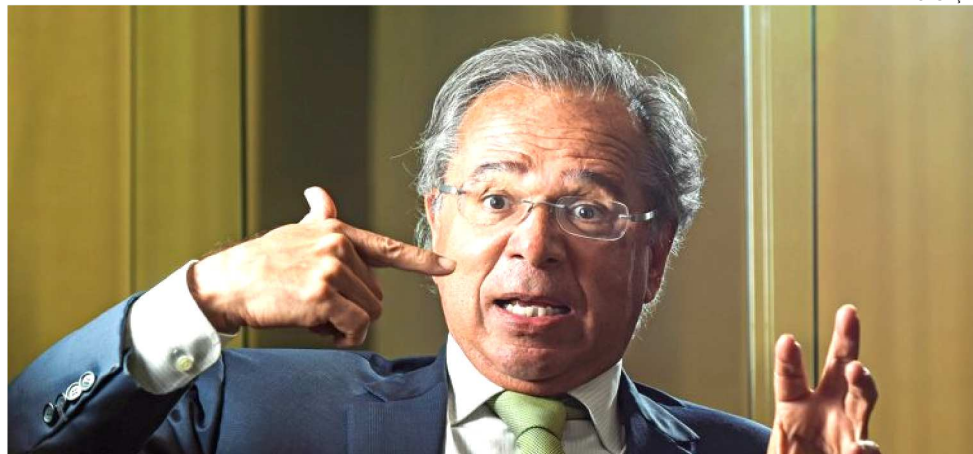
PAULO GUEDES QUER COBRANÇA DE 0,60% NAS MOVIMENTAÇÕES FINANCEIRAS

Guedes escolheu a Argentina — onde participou da Cúpula do Mercosul na cidade de Santa Fé — para dar alguns detalhes da proposta de mudança do sistema tributário. A nova CPMF seria criada como forma de compensar a receita com a desoneração da folha de pagamentos, que também estará nessa proposta. Segundo ele, a reforma tributária do governo terá três eixos: uma importante mudança no Imposto de Renda (IR); redução e simplificação de tributos, criando um Imposto sobre Valor Agregado (IVA) federal; e uma ampla desoneração da folha de pagamentos, que será compensada pela tributação sobre a movimentação financeira. “Os encargos trabalhistas são um imposto cruel que cria milhões de desempregados. É uma arma de destruição em massa de emprego”, afirmou o ministro, acrescentando que quase 30 milhões de desalentados, hoje, não contribuem para a Previdência e um dia vão envelhecer, e, conseqüentemente, “vão quebrar a Previdência”. “Vamos mudar a tributação sobre a mão de obra e tro-