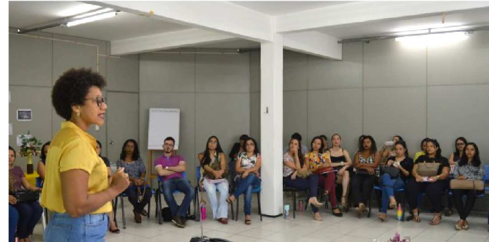
A CAPACITAÇÃO TEVE INÍCIO DIA 16 E TERMINA NESTA SEXTA, 19