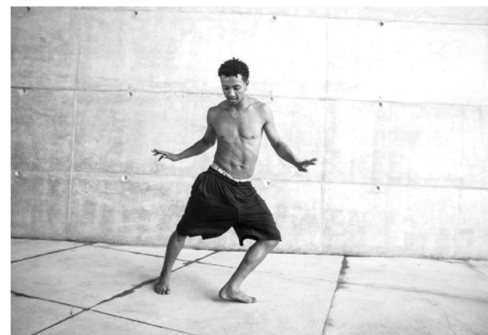
PASSINHO MISTURA SAMBA, FREVO, FUNK E O RITMO KUDURO

No período de férias escolares, o Centro Cultural Vale Maranhão (CCVM) oferece programação para todos os públicos. Diariamente, passam cerca de 400 pessoas no CCVM, que vêm para exposições, sessões de cinema e oficinas gratuitas.