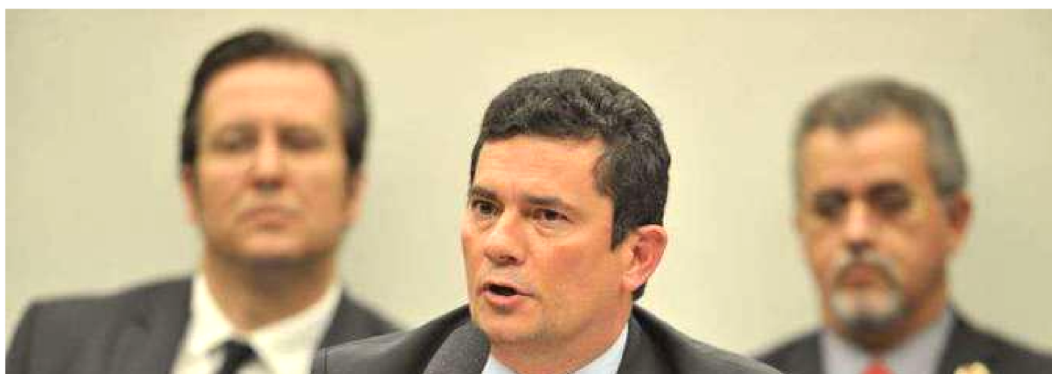
MINISTRO SÉRGIO MORO (AO CENTRO) NEGA INTERFERÊNCIA EM DELAÇÕES PREMIADAS DE EXECUTIVOS DA CAMARGO CORRÊA

Novas mensagens do Telegram obtidas pelo site The Intercept e divulgadas, ontem (18), pelo jornal Folha de S. Paulo indicam que o ministro da Justiça e da Segurança Pública, Sérgio Moro, teria interferido em delações premiadas de executivos da construtora Camargo Corrêa, em 2015, quando ainda era juiz da Operação Lava-Jato. De acordo com o conteúdo, a interferência chegou a causar incômodo entre os integrantes da força tarefa.