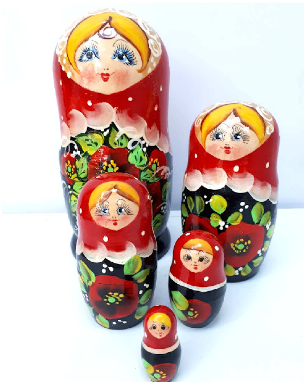
CULTURA E ARTE SERÃO EXPOSTAS NO EVENTO QUE TERMINA NO FIM DO MÊS DE JULHO

Os cursos rápidos, cujas durações vão de 1 hora a 1 hora e meia, serão sobre renda Renascença; adereços de cabeça com flores de conchas; flores com escamas de peixe; adereços para noivas e madrinhas de casamento com flores de conchas; colares com conchas em alta no verão europeu 2019; e bijuterias em geral.