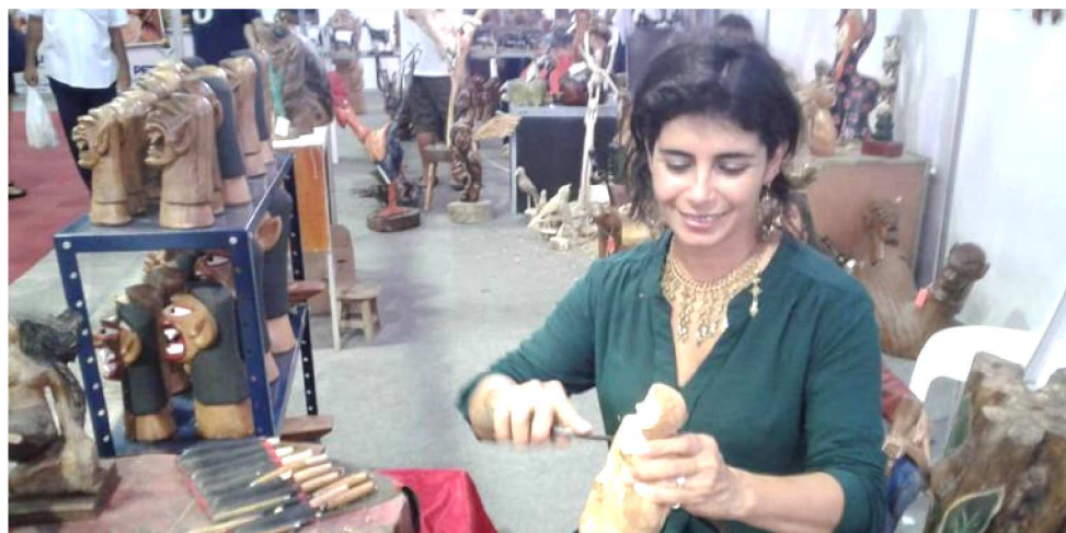
MUITOS ARTESÃOS DE VÁRIOS PAÍSES ESTARÃO NA FEIRA QUE ACONTECE EM SÃO LUÍS

Incentivo ao artesão maranhense – Ao todo, mais de cem expositores estarão reunidos na Feincartes, que conta com um espaço de destaque