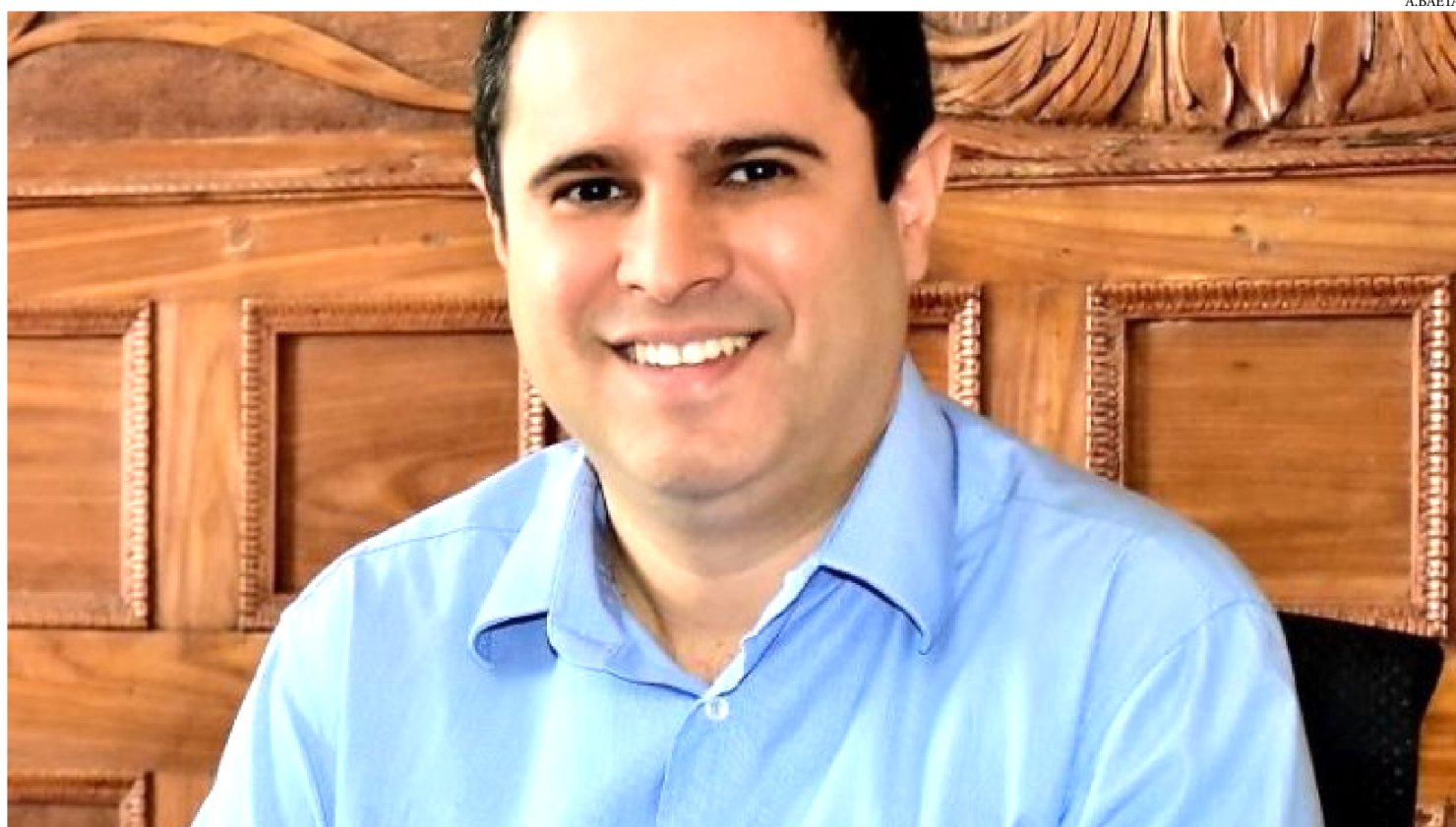
PREFEITO EDIVALDO INJETA MILHÕES NA ECONOMIA COM ANTECIPAÇÃO DA PRIMEIRA PARCELA DO 13º NESTA SEXTA-FEIRA

O prefeito Edivaldo Holanda Júnior paga nesta sexta-feira (19) a primeira parcela do 13º salário. Com a antecipação do pagamento, previsto para ser realizado de forma integral apenas no final do ano, conforme o calendário de 2019, a gestão municipal vai injetar milhões na economia.