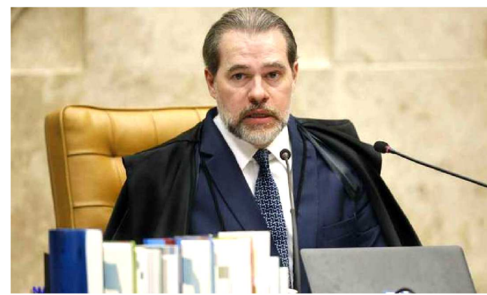
TOFFOLI ACHA QUE NÃO IMPEDIU TODAS AS INVESTIGAÇÕES

O presidente do Supremo Tribunal Federal (STF), ministro Dias Toffoli, disse, ontem (18/), que sua decisão envolvendo o compartilhamento de dados do Conselho de Controle de Atividades Financeiras (Coaf) e da Receita Federal não impede investigações sobre crimes.