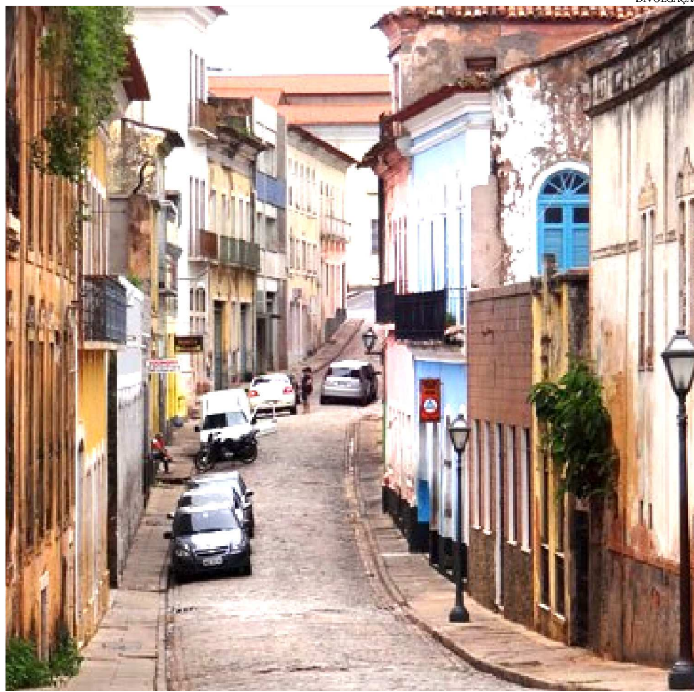
O OBJETIVO DO COMITÊ É PROMOVER AS AÇÕES PREVISTAS NO PROGRAMA

III – fomento à atratividade dos polos por meio do incentivo à habitação,