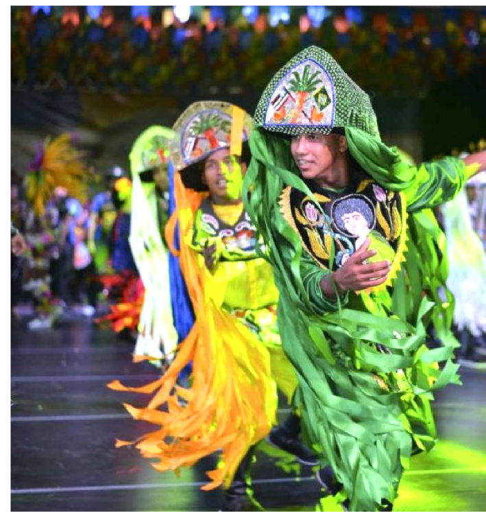
O BOI DE AXIXÁ ENCERRARÁ A PROGRAMAÇÃO DESTE ANO

Com um balanço mais que positivo de público e infraestrutura, será encerrado, neste fim de semana, no Ceprama, o “Arraial Energia do São João 2019”, com uma ampla programação cultural totalmente aberta ao público e gratuita, mostrando o melhor da diversidade e riqueza de ritmos da cultura popular maranhense. Ao todo, foram nove dias de evento com mais de 70 atrações.