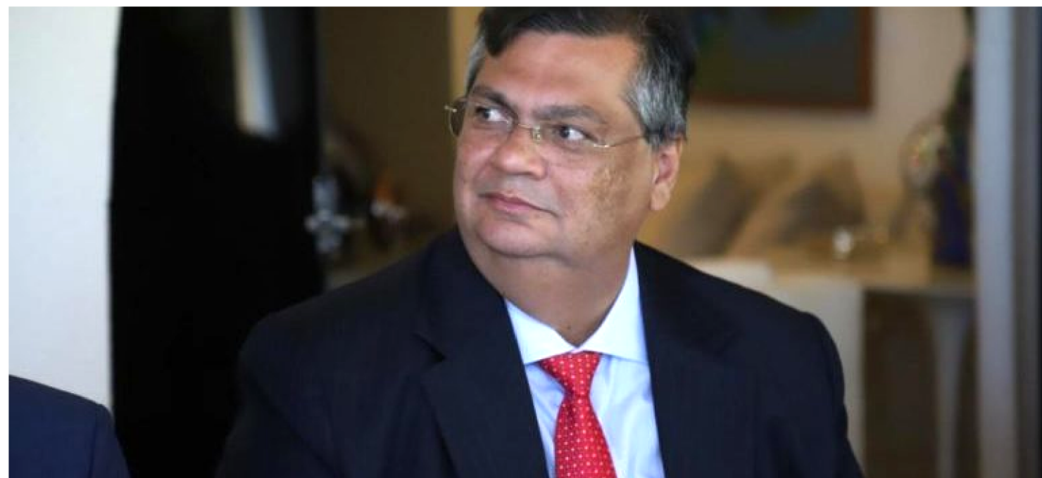
“ELA [A LAVA JATO] FOI DERIVADA, SIM, DE GRAVES CASOS DE CORRUPÇÃO, MAS TAMBÉM DE INTERESSES POLÍTICOS E ECONÔMICOS