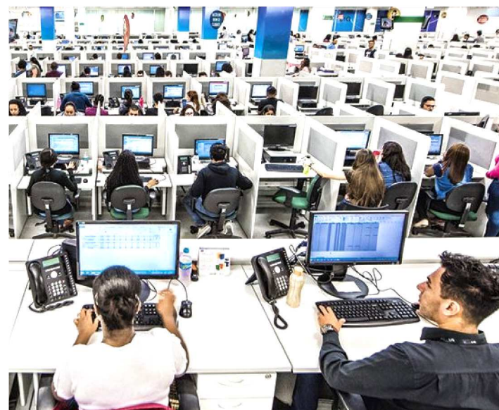
O SERVIÇO DE CADASTRO PARA BLOQUEIO É DE 2015

Ninguém gosta de receber ligações de serviços de telemarketing a qualquer hora do dia. Mas você sabia que é possível bloquear essas chamadas indesejáveis? Uma alternativa para o consumidor não receber mais esse tipo de ligações é cadastrar a linha telefônica na lista de bloqueio de telemarketing, serviço que pode ser realizado no site do Instituto de Proteção e Defesa do Cidadão e Consumidor do Maranhão (Procon/MA), conforme a Lei Estadual nº 9.053/2009.