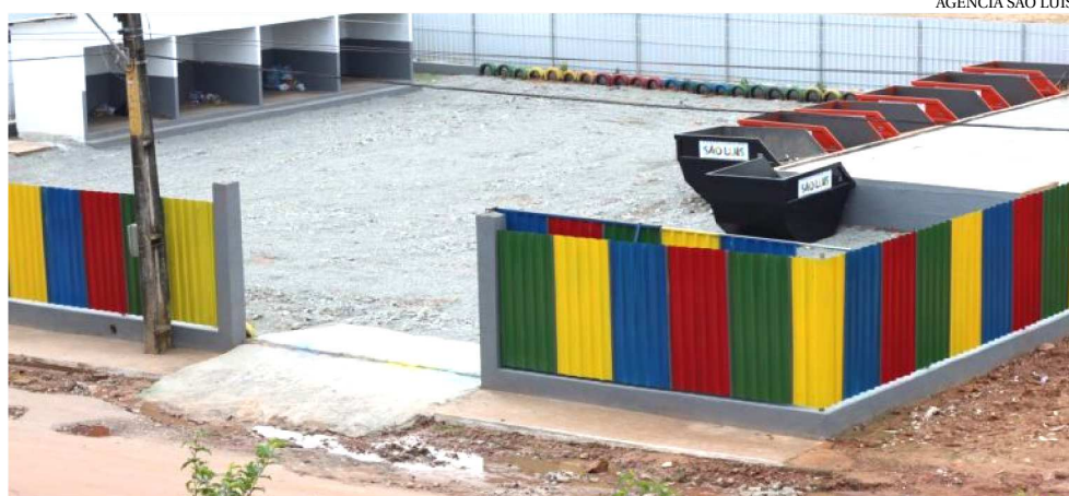
A PREFEITURA AVANÇARÁ COM UMA FRENTE DE OBRAS DE NOVOS ECOPOINTOS

O Ecoponto Parque dos Nobres fica localizado na Rua dos Imperadores, próximo à Igreja Nossa Senhora do Perpétuo Socorro. O equipamento vai garantir aos moradores do entorno o descarte ambientalmente adequado de materiais recicláveis e resíduos vo-