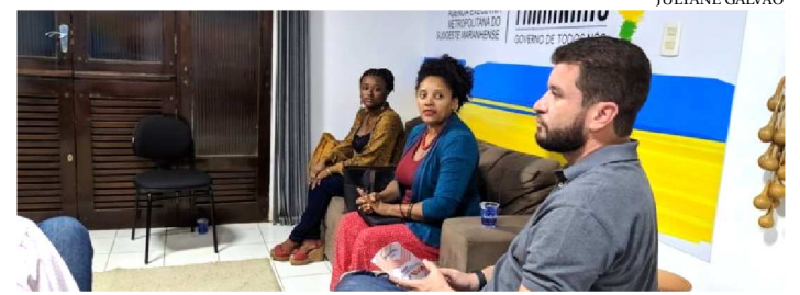
A OFICINA ACONTECE HÁ TRÊS ANOS, ÀS TERÇAS E QUINTAS

Luzes apagadas, música instrumental, respiração profunda e concentração. É com essa atmosfera que as enfermeiras do Hospital de Câncer do Maranhão, unidade vinculada à Secretaria de Estado da Saúde (SES), realizam as oficinas de meditação, recurso terapêutico baseado em conhecimentos tradicionais para promover momentos de relaxamento aos pacientes oncológicos e acompanhantes. A iniciativa também ensina os usuários a fazer o controle da ansiedade e das reações emocionais intensas, bem como auxilia no tratamento da depressão.