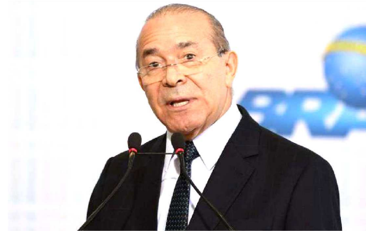
ELISEU PADILHA ESTÁ HOSPITALIZADO EM PORTO ALEGRE

O ex-ministro Eliseu Padilha (MDB/RS) está internado. Ele esteve na Unidade de Tratamento Intensivo (UTI) após passar por um procedimento cirúrgico, mas já foi para um quarto do Hospital Moinhos de Vento, de Porto Alegre (RS). Ele está internado desde a última quinta-feira (18).