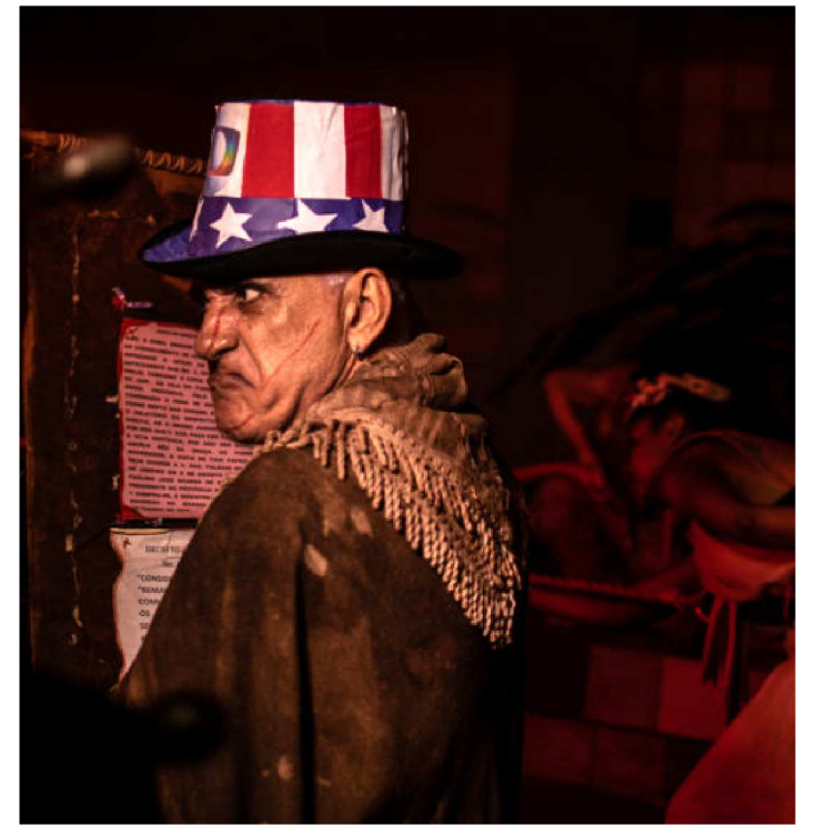
PODEM SER INSCRITOS PROJETOS EM VÁRIAS ÁREAS DE ARTES

As inscrições para a terceira edição do OCUPA CCVM encerram-se no próximo sábado, dia 27. O edital seleciona projetos de todo o Maranhão para serem apresentados/ montados nos espaços do Centro Cultural Vale Maranhão no segundo semestre de 2019.