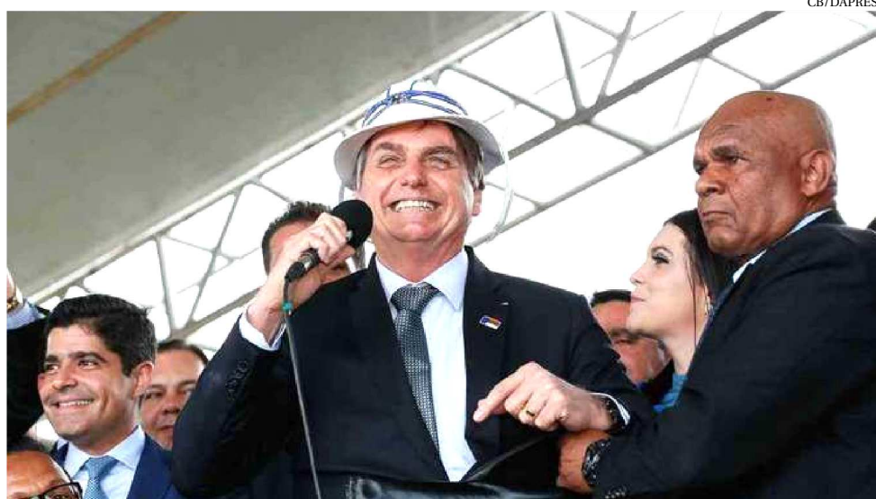
PRESIDENTE BOLSONARO INAUGUROU AEROPORTO EM VITÓRIA DA CONQUISTA-BA

Na passagem pela Bahia, nesta terça, procurou amenizar o desconforto. "Eu amo o Nordeste. Afinal de contas, a minha filha tem em suas veias sangue de 'cabra da peste'. 'Cabra da peste' de Crateús, o nosso estado aqui, mais pra cima, o nosso Ceará. Quem é