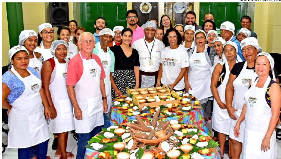
PRIMEIRA-DAMA CAMILA HOLANDA ACOMPANHOU O ENCERRAMENTO DO CURSO

Nas duas primeiras oficinas realizadas pelo Centro foram trabalhados dois produtos da cozinha tradicional maranhense: milho e macaxeira. Com a realização das capacitações temáticas, a Setur objetiva resgatar a culinária