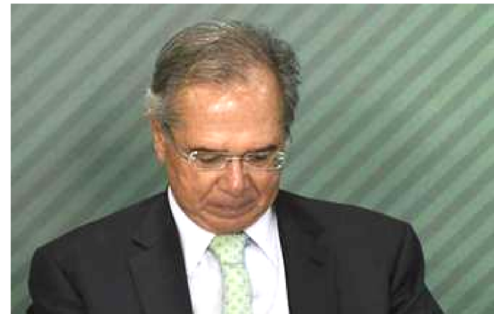
PAULO GUEDES AFIRMA QUE NÃO TEM CONTA NO TELEGRAM

O Ministério da Economia informou, na manhã de ontem (23), que enviará um ofício para o ministro da Justiça e Segurança Pública, Sérgio Moro, para que acione a Polícia Federal investigar o caso de invasão do telefone de Paulo Guedes.