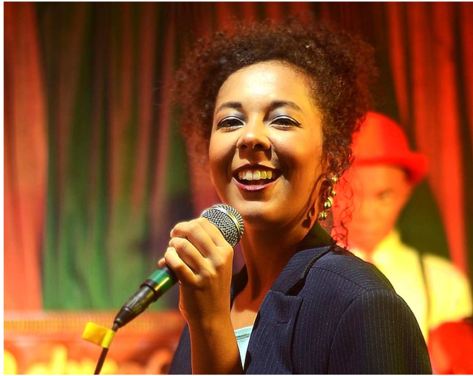
A DENSIDADE DA OBRA DE ELIS REGINA ESTARÁ NO PALCO DO TEATRO ARTHUR AZEVEDO

A densidade da obra de Elis Regina, considerada por muitos críticos a maior cantora brasileira, que morreu em 1982 e deixou um legado musical que influencia até hoje a música popular brasileira, estará no palco do Teatro Arthur Azevedo com o espetáculo “Uma Poesia Eterna, Elis” . O trabalho será apresentado por 25 jovens integrantes do Projeto Pulsar Jovem, criado em junho de 2018, pela Pulsar Companhia de Dança, que vem desenvolvendo trabalhos artísticos há