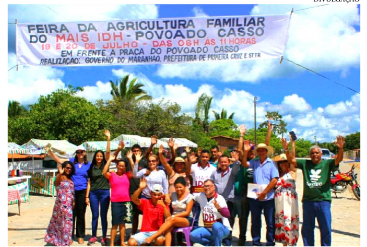
O EVENTO FOI REALIZADO NOS DIAS 19 E 20 DE JULHO DE 2019

O Governo do Estado, por meio do Sistema de Agricultura Familiar – Saf, Agerp, Iterma -, em parceria com a prefeitura e STTR, realizou a 8ª edição da Feira da Agricultura Familiar do Povoado Cassó, localizado no município de Primeira Cruz. O evento movimentou a cidade entre os dias 19 e 20, atraindo turistas e empresários locais.