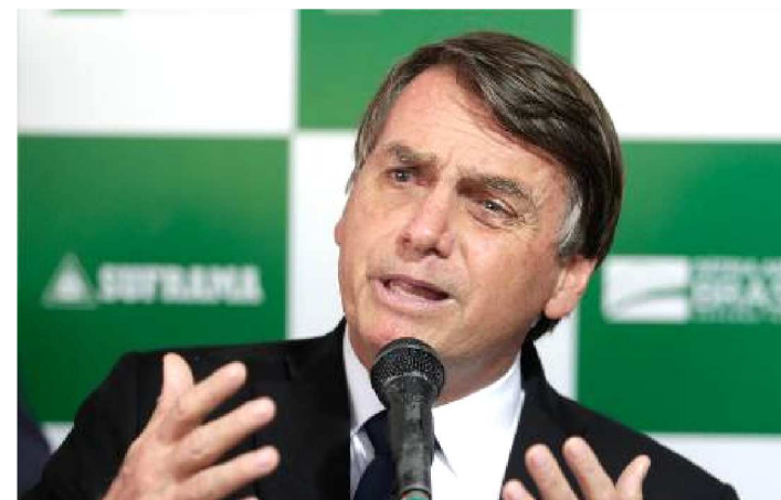
BOLSONARO QUESTIONOU VERACIDADE DE DOCUMENTOS

O presidente Jair Bolsonaro questionou a veracidade dos documentos produzidos pela Comissão Nacional da Verdade (CNV), que apurou os crimes cometidos durante o período da Ditadura Militar, entre 1964 e 1985. “Você acredita em Comissão da Verdade? Qual foi a composição da Comissão da Verdade? Foram sete pessoas indicadas por quem? Pela Dilma”. Para Bolsonaro, os documentos sobre as mortes atribuídas aos militares são “balela”. “Nós queremos desvendar crimes. A questão de 64, existem documentos de matou, não matou, isso aí é balela”, afirmou.