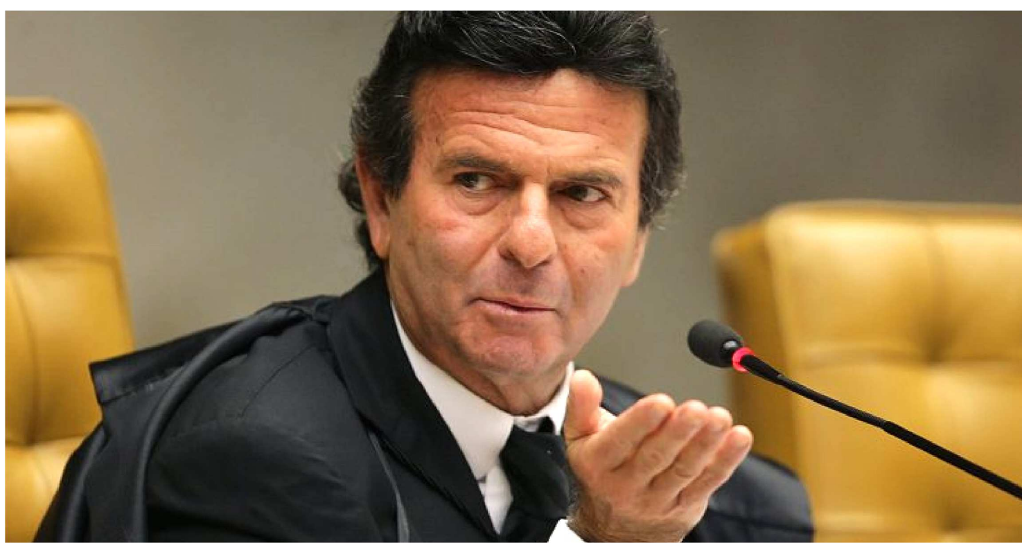
LUIZ FUX, DO SUPREMO TRIBUNAL FEDERAL, SERÁ O RELATOR DO PROCESSO QUE DECIDIRÁ SOBRE DESTRUIÇÃO DE DOCUMENTOS

Partido Democrático Trabalhista (PDT) entrou com uma Arguição de Descumprimento de Preceito Fundamental, no Supremo Tribunal Federal (STF), com pedido de medida liminar, para que o ministro Sérgio Moro (Justiça e Segurança Pública) “se abstenha de destruir provas colhidas com os hackers” presos pela Operação Spoofing – investigação sobre invasão de celulares de autoridades. O processo foi distribuído para o ministro Luiz Fux. Na ADPF 605, a legenda indica que o eventual descarte de provas violaria preceitos constitucionais relativos ao devido processo legal, à legalidade e à moralidade, à segurança pública, e configuraria abuso de poder e ofensa ao princípio da separação dos Poderes.