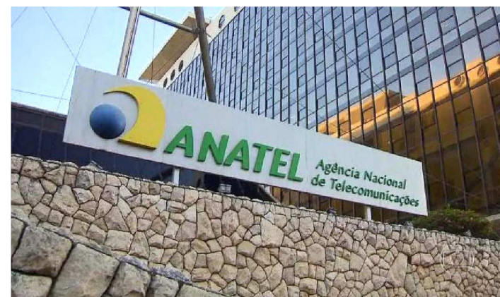
ANATEL DETERMINA CORREÇÃO DE UMA BRECHA NA REDE

A Agência Nacional de Telecomunicações (Anatel) determinou que as operadoras de telefonia corrijam uma brecha na rede que permitiu a invasão dos celulares de centenas de autoridades do País, incluindo o presidente Jair Bolsonaro. A medida é efeito prático das investigações da Operação Spoofing, da Polícia Federal, que prendeu quatro suspeitos na semana passada.