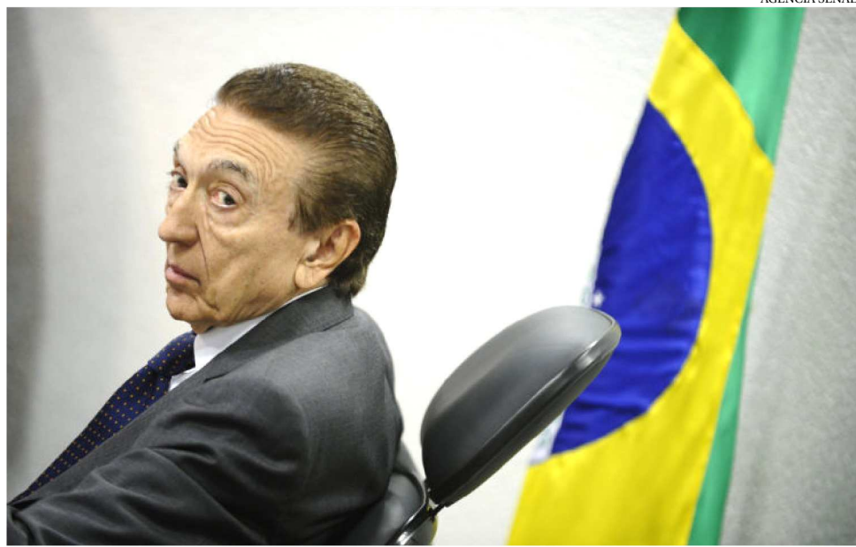
EDISON LOBÃO É ACUSADO DE RECEBER 2,8 MILHÕES DE PROPINAS PELA LAVA-JATO