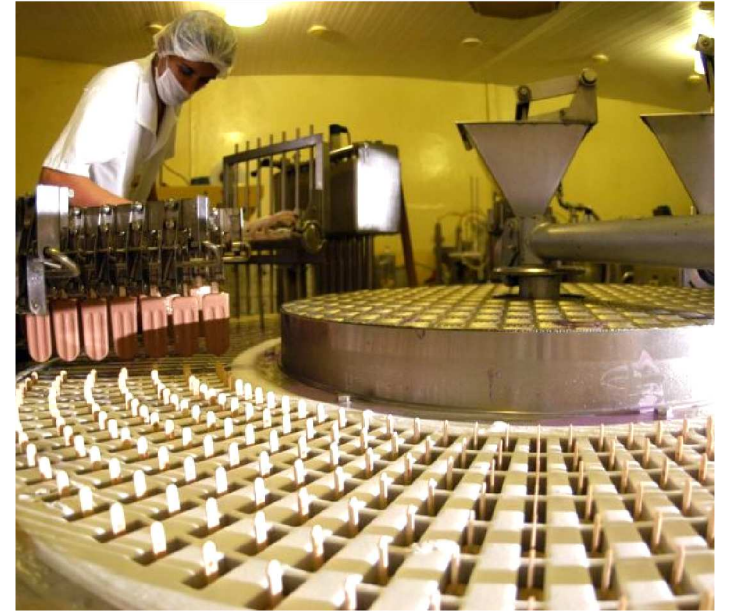
BENS DE CAPITAL SÃO MAQUINÁRIOS, FERRAMENTAS E OUTROS