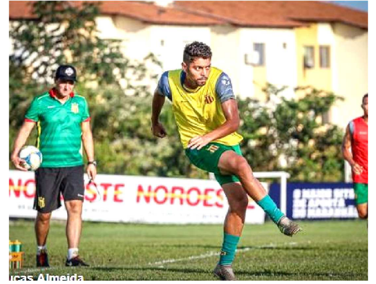
SAMPAIO ESTÁ PRONTO PARA ENFRENTAR O TREZE-PB