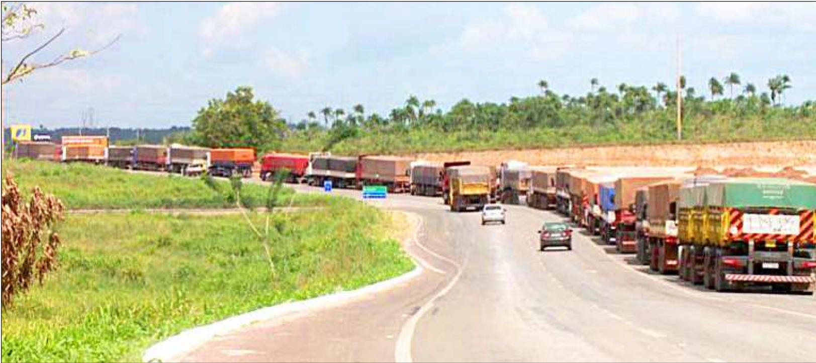
Segundo a Empa, equipes do posto de triagem e do Tegram estão checando os veículos agendados na fila para remanejá-los, agilizando o descarregamento