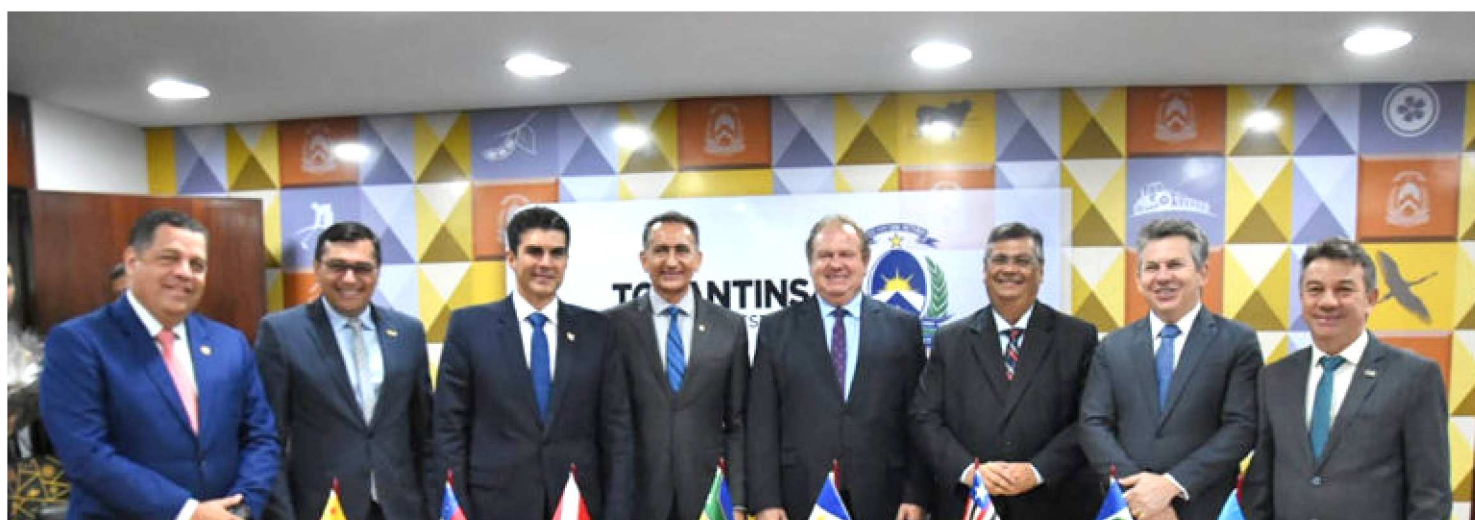
GOVERNADOR FLÁVIO DINO DEBATE DESENVOLVIMENTO SUSTENTÁVEL EM FÓRUM DA AMAZÔNIA LEGAL

O governador Flávio Dino marcou presença nas discussões da 18ª edição do Fórum de Governadores da Amazônia Legal, na manhã desta sexta-feira (2), em Palmas, Tocantins. O encontro reuniu nove representantes de Estados das regiões Norte, Nordeste e Centro-Oeste do país para debater estratégias de desenvolvimento sustentável da região. Entre os assuntos, foram pontuados o destino do Fundo Amazônia, ações de licenciamento ambiental, política nacional e direcionamentos do Conselho Nacional do Meio Ambiente (Conama).