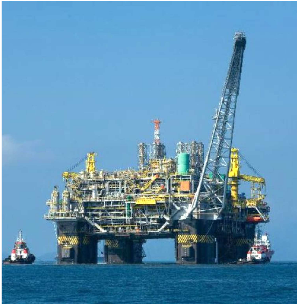
PRODUÇÃO DE PRÉ-SAL CRESCEU 12,7%, COM 1,17 MILHÃO DE BARRIS DE PETRÓLEO/DIA

Os investimentos somaram US$ 2,6 bilhões, sendo 82% em atividades de