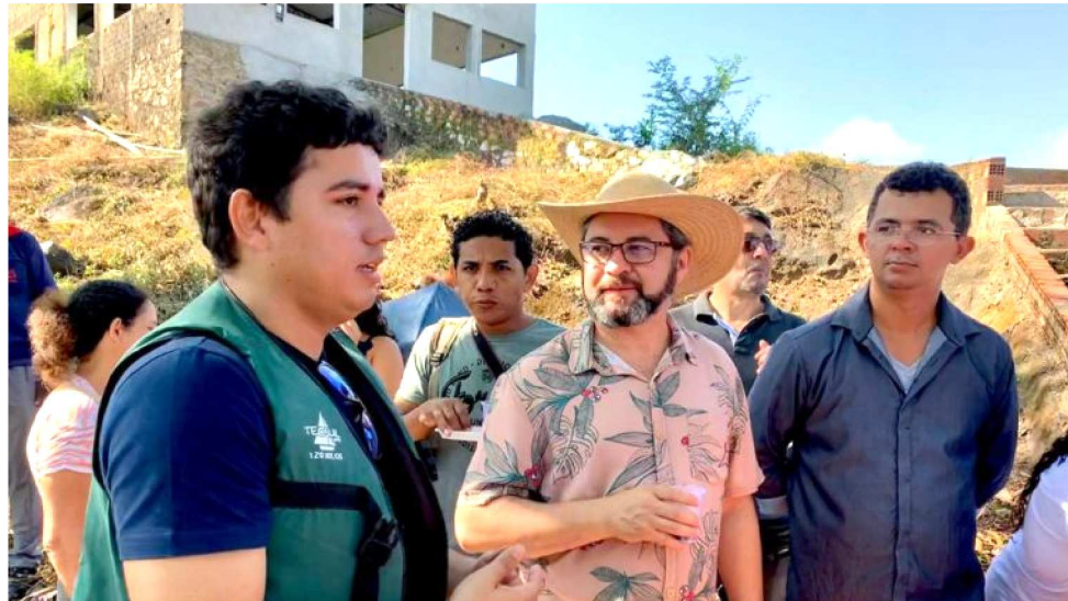
TITULAR E TÉCNICOS DA SETRES FIZERAM AVALIAÇÃO TÉCNICA DO