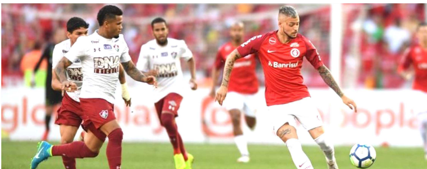
TRICORES E COLORADOS DEVERÃO SE APRESENTAR COM ALGUMAS ALTERAÇÕES NA PARTIDA DESTE SÁBADO, A PARTIR DAS 19H

Com suas missões internacionais cumpridas, Fluminense e Internacional têm seus caminhos cruzados neste sábado, 3 de agosto, em confronto que faz parte da programação da décima terceira jornada da versão 2019 da Série A do Campeonato Brasileiro. O encontro terá como cenário o Maracanã. O pontapé inicial está agendado para 19h (horário de Brasília).