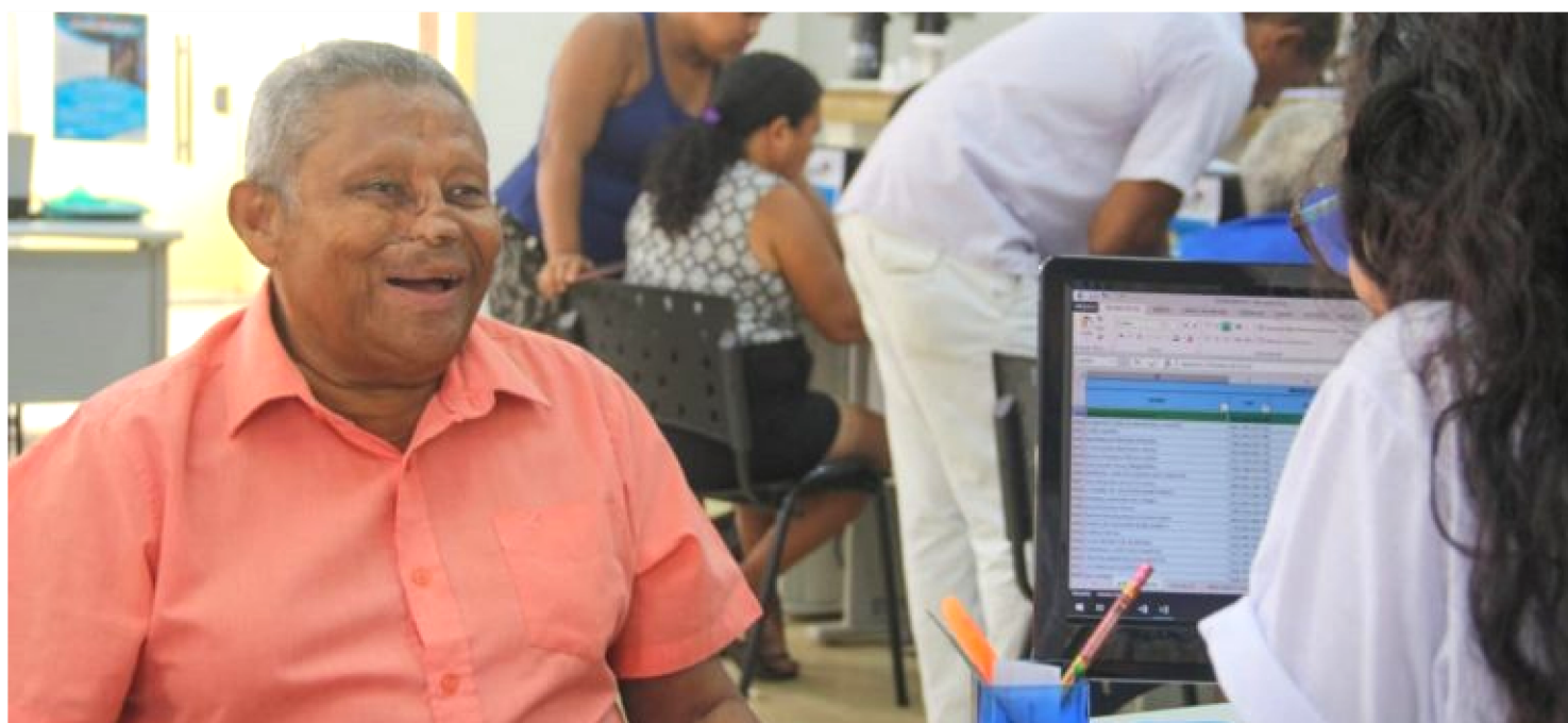
MORADORES DO CENTRO SÃO ASSISTIDOS PELO PROGRAMA DO GOVERNO DO ESTADO