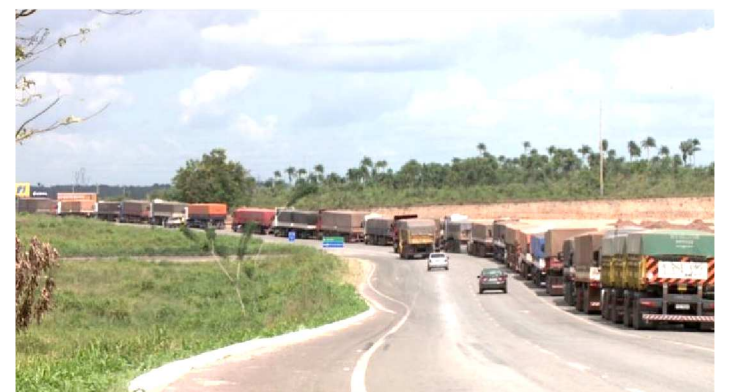
MUITOS CAMINHONEIROS ESTÃO ESPERANDO VAGA NA BR-135

Desde o começo da semana, quem passa nas proximidades do Porto do Itaqui se assusta com um “congestionamento de caminhões” no local.