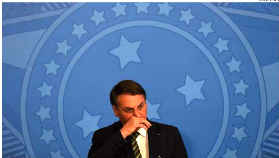
BOLSONARO AFIRMA QUE OS COMUNISTAS NÃO QUERIAM ACEITAR A NORMALIDADE

Questionado novamente se prestaria esclarecimentos, Bolsonaro foi mais objetivo. “Mesmo eu não sendo