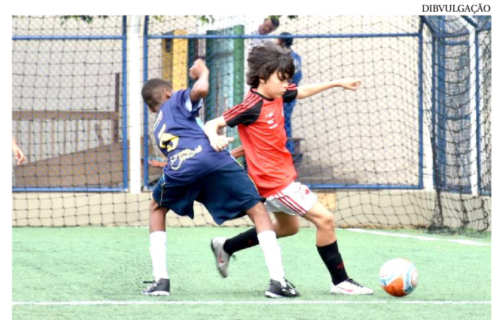
A BOLA ROLA NESTE SÁBADO NO FUTEBOL 7, SUB-13

Após uma breve pausa, o Campeonato Maranhense Sub-13 de Futebol 7, competição promovida pela federação, retorna neste fim de semana. Doze partidas estão programadas para ocorrer no campo da A&D Eventos, no bairro do Turu, a partir das 7h45 deste sábado (3). A rodada será iniciada com o duelo entre Grupama Maranhense B e Futuro da Colina pelo Grupo B. As duas equipes vão em busca da primeira vitória no torneio para subir na tabela de classificação. Na sequência, às 8h30, o Vasco SLZ tenta manter os 100% diante do Grupama Maranhense A. Logo depois, tem Futuro do Amanhã x Slacc e, encerrando os jogos de sábado, o RAF 07 estreia na competição medindo forças com o Meninos de Ouro/Santa Rita, equipe que está na ponta do Grupo B com 3 pontos ganhos.