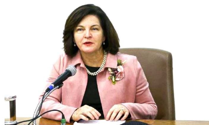
RAQUEL DIZ QUE PROCURADOR TEM GARANTIA LEGAL

A Procuradoria-Geral da República (PGR) negou que a chefe do órgão, Raquel Dodge, esteja sofrendo pressão para afastar o coordenador da força-tarefa da Lava-Jato no Paraná, Deltan Dallagnol, do cargo ou das ações da operação.