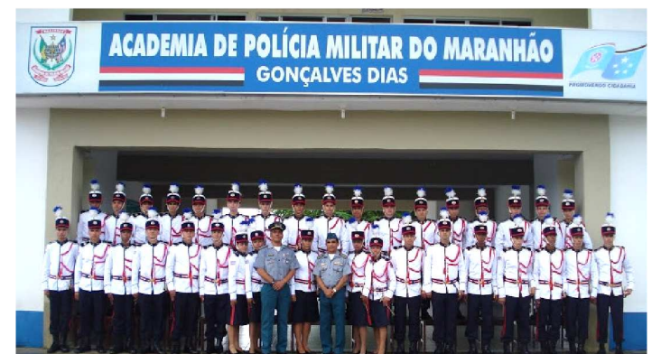
AÇÃO CÍVEL PÚBLICA FOI MOVIDA PELA DEFENSORIA ESTADUAL

Foi aberto o período de inscrição para ingresso no Curso de Formação de Oficiais (CFO) referente ao Processo Seletivo de Acesso à Educação Superior (Paes 2020), da Universidade Estadual do Maranhão (Uema), o edital não prevê a reserva de vagas para candidatos com deficiência. O pedido à Justiça foi feito esta semana, em Ação Cível Pública (ACP) movida pela Defensoria estadual, por meio do Núcleo de Defesa do Idoso, Pessoa com Deficiência e Saúde.