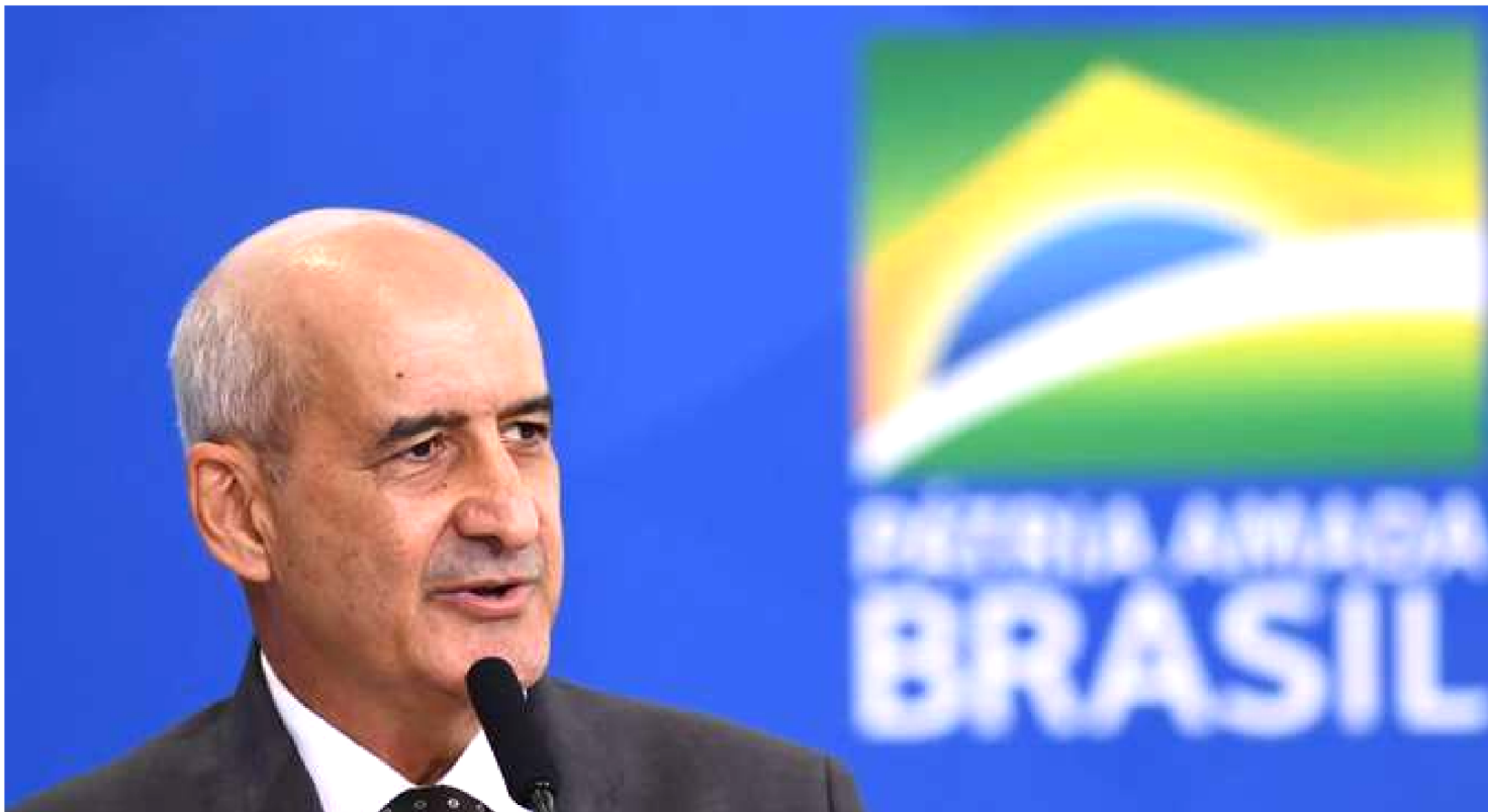
LUIZ EDUARDO RAMOS TENTA IDENTIFICAR AS PRINCIPAIS FALHAS NA ARTICULAÇÃO ENTRE O PLANALTO E O LEGISLATIVO

A articulação política do governo retoma hoje, sob novo comando, os trabalhos no Congresso Nacional, com foco total na reforma da Previdência. O ministro-chefe da Secretaria de Governo, Luiz Eduardo Ramos, assume, definitivamente, as rédeas do diálogo entre o Executivo e o Legislativo. À equipe dele, recomendou descanso no fim de semana, avisando antecipadamente, que, a partir de hoje, as atividades vão se intensificar com o retorno das sessões no Parlamento. O trabalho será árduo, afinal de contas, o Palácio do Planalto tem compromissos pendentes a honrar com parlamentares.