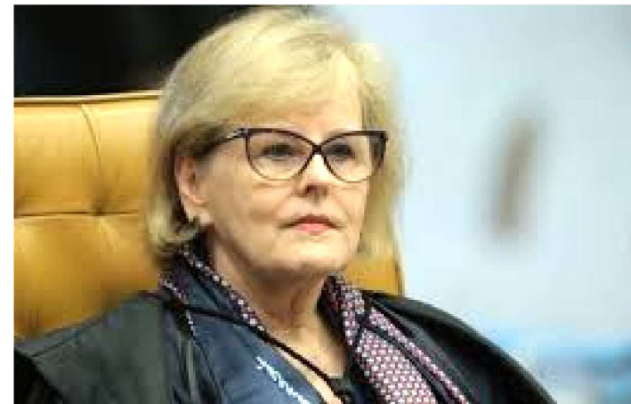
ROSA WEBER ATENDEU PEDIDO DE DILMA ROUSSEF