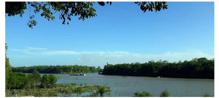
UMA DAS TRAGÉDIAS ACONTECEU NO RIO MARACAÇUMÉ