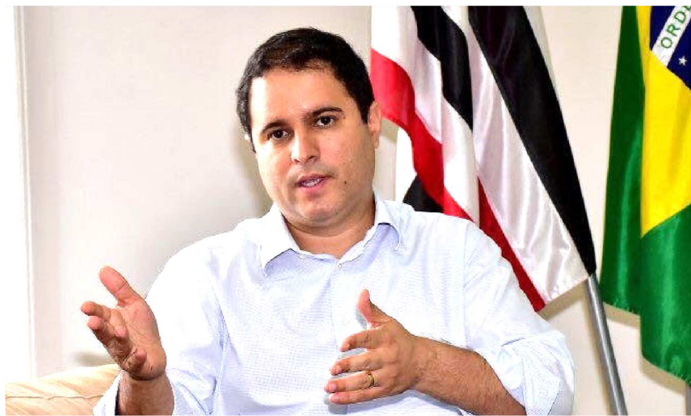
PREFEITO EDIVALDO HOLANDA JUNIOR

“São Luís em Obras” a construção dos mercados do São Francisco, Cohab e Coradinho; e a reforma completa do Mercado das Tulhas, na Praia Grande. Localizado no Centro Histórico da capital, o Mercado das Tulhas passará por reforma em toda a sua estrutura física, para melhorar os serviços prestados ao público no espaço e resgatá-lo como ponto turístico da cidade. O São Luís em Obras inclui, ainda, a requalificação da Praça da Saudade, Praça da Misericórdia e entorno; requalificação do Parque do Bom Menino, Praça da Bíblia e entorno, intervenções viárias em diferentes pontos da cidade, entre outros. As obras do novo programa da Prefeitura de São Luís começam a ser executadas ainda