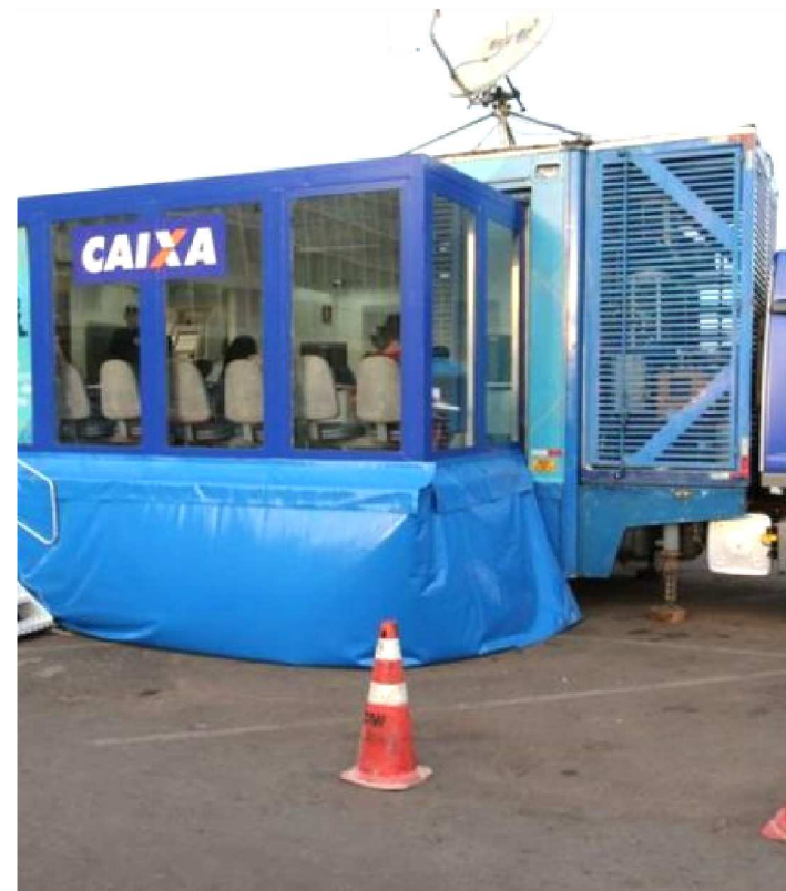
A UNIDADE MÓVEL FICARÁ NA CAPITAL ATÉ O DIA 16 DE AGOSTO

Uma oportunidade para renegociar as dívidas. A partir da próxima segunda-feira (12), os clientes da Caixa Econômica Federal (CEF) de São Luís, terão a oportunidade de liquidar suas dívidas, com descontos especiais, diretamente no Caminhão Você no Azul.