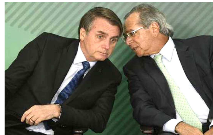
BOLSONARO DEU “CARTA BRANCA” A PAULO GUEDES