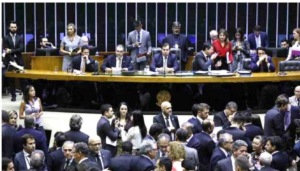
OITO SESSÕES SERÃO REALIZADAS SOMENTE PARA TRATAR DA PEC DA PREVIDÊNCIA

A prioridade na Câmara é o segundo turno da reforma da Previdência. Antes das férias, os deputados aprovaram a Proposta de Emenda à Constituição (PEC) 6/2019 na primeira rodada de votação, com 379 votos favoráveis. Com o objetivo de aprová-la o mais rápido possível na segunda fase, o presidente da Câmara, Rodrigo Maia (DEM-RJ), já marcou oito sessões no plenário nesta semana só para tratar da PEC. Se tudo ocorrer dentro das expectativas dele, a reforma será assunto resolvido em uma semana pelos deputados e passará a ser preocupação dos senadores. O primeiro teste para saber se isso vai dar certo é a reação dos deputados na primeira sessão após o recesso. O tom dos discursos e os temas que prevalecerem na tribuna podem gerar longas discussões e, a depender do nível das conversas, dificultar que o cronograma seja seguido à risca.