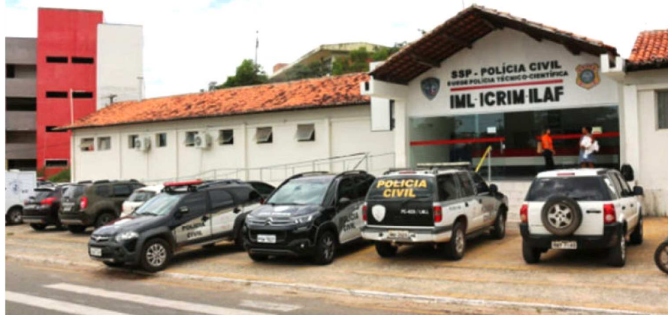
O CORPO DA VÍTIMA FOI RECOLHIDO PARA O IML ONDE PASSOU POR PROCEDIMENTOS

Neste ano, a Delegacia da Mulher, através do Departamento de Feminicídio, chegou a 100% das elucidações dos casos, mas alguns suspeitos ainda