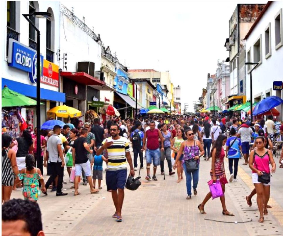
FECOMÉRCIO REVELOU QUE HOUVE QUEDA NO CONSUMO NOS ÚLTIMOS MESES DO ANO

Com a proximidade do dia dos pais, isso dá um fôlego para que a população possa comprar algo para presentear seu pai. É o que pensa vendedores e lojistas. O Dia dos Pais é considerada uma das cinco principais datas comemorativas para o comércio lo-