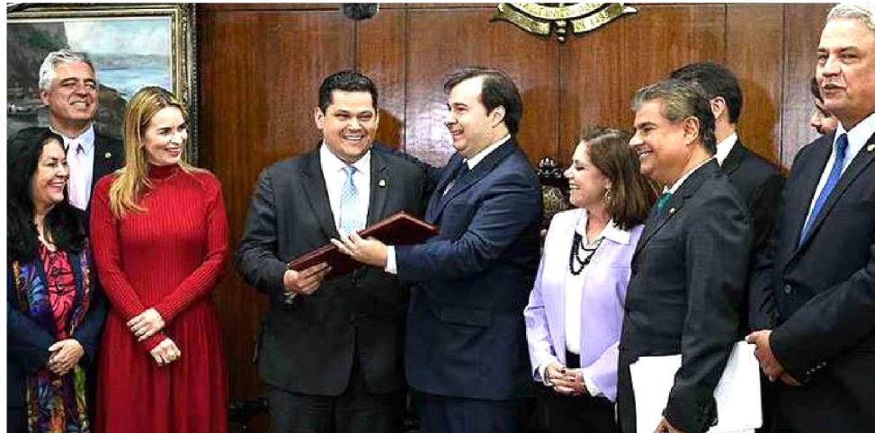
DAVI ALCOLUMBRE RECEBENDO O TEXTO DA REFORMA PELO PRESIDENTE DA CÂMARA

Ao entrar, Jereissati afirmou que o texto da reforma deverá tramitar no Senado por cerca de 60 dias entre a comissão e o plenário. O líder do PSL na Casa, Major Olímpio (SP), havia adiantado o tempo previsto para o andamento da matéria na nova etapa após a Câmara. A expectativa é que possíveis alterações na proposta de emenda à constituição sejam incluídas na pec paralela, que também colocará estados e municípios nas alterações do sistema previdenciário. Nesse ritmo, seria possível que a Pec 6/2019 fosse sancionada até a primeira quinzena de outubro. Após a solenidade, Alcolumbre abriu, às 14h17, a sessão plenária para ler o texto da reforma da Previdência. “Quero em nome do Senado da República, da Casa da Federação, registrar com felicidade a presença do presidente da Câmara, Rodrigo Maia no nosso gabinete, fazendo um gesto simbólico, mas, ao mesmo tempo, importante, desse momento que o Brasil vive. Estamos todos aqui, Senadores, desde o início da legislatura, acompanhando o andamento da reforma da Previdência na