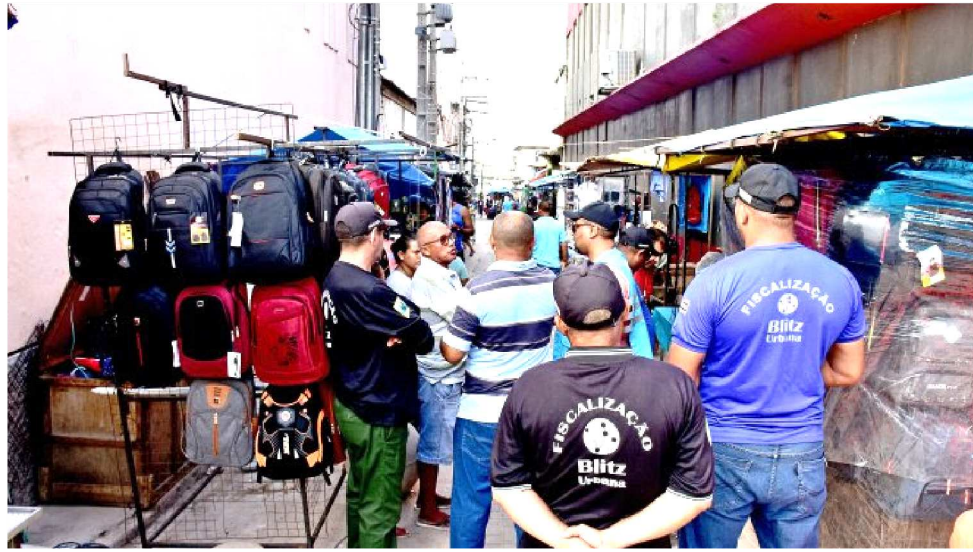
AMBULANTES FORAM TRANSFERIDOS PARA AS TRANSVERSAIS DA RUA GRANDE

O Shopping do Comércio Popular de São Luís será construído nas proximidades do Ginásio Costa Rodrigues, área central da cidade, e vai contar