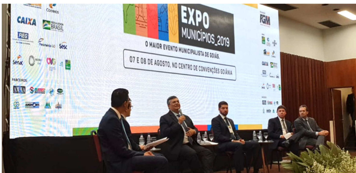
GOVERNADOR FLÁVIO DINO DEFENDE INTEGRAÇÃO REGIONAL

O governador Flávio Dino marcou presença na tradicional Expo Municípios, realizada em Goiânia, que destaca as potencialidades das cidades deste estado.