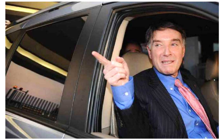
EIKE BATISTA FOI PRESO OUTRA VEZ PELA LAVA JATO

Preso na manhã de ontem pela Operação Segredo de Midas, o empresário Eike Batista terá o valor de R$ 1,6 bilhão em bens bloqueados. A indisponibilidade é relativa a bens de Eike e de seus filhos, Thor e Olin Batista, sendo R$ 800 milhões por danos morais e R$ 800 milhões por danos materiais.