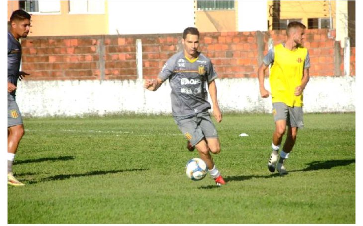
TREINAMENTOS COMEÇAM A DEFINIR EQUIPE TRICOLOR

De olho no confronto diante do Náutico e na primeira colocação geral da Série C, o Sampaio Corrêa fechou mais um dia de treinamento preparatório, em atividade realizada na tarde de ontem, no CT José Carlos Macieira.