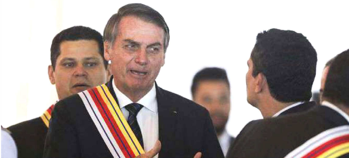
JAIR BOLSONARO GARANTE A MORO QUE VAI DAR UMA SEGURADA NA TRAMITAÇÃO DA PROPOSTA DE COMBATE AO CRIME

O pacote anticrime do ministro da Justiça e Segurança Pública, Sérgio Moro, subiu no telhado. O titular da pasta foi avisado que o governo vai “dar uma segurada” na tramitação da proposta, que prevê um conjunto de ações para combate da corrupção, do crime organizado e de crimes violentos. O objetivo é evitar “pressionar”, “atrapalhar” ou “tumultuar” a tramitação da reforma da Previdência. Será a agenda econômica a principal prioridade da gestão.