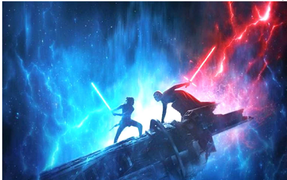
REY E KYLO REN SE ENFRENTAM EM PÔSTER DIVULGADO NO ÚLTIMO FINAL DE SEMANA

A sequência começa mostrando cenas clássicas de filmes Star Wars, como Luke Skywalker (Mark Hamill) olhando para os dois sóis de Tatooine, Obi-Wan Kenobi tirando sua capa, Leia se despedindo de Han Solo antes de ele ser capturado por Darth Vader, e a voz de Luke narrando a mesma frase de abertura do trailer anterior: “Mil gerações vivem em você agora. Mas esta é a sua luta.”