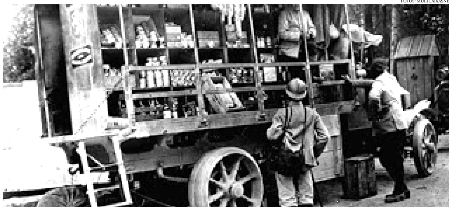
NAQUELA ÉPOCA ERAM VENDIDAS APENAS TORTAS E SANDUÍCHES AOS TRABALHADORES DAS FÁBRICAS NOS ESTADOS UNIDOS

A atividade surgiu nos Estados Unidos em 1872. Naquela época eram vendidas tortas e sanduíches aos trabalhadores das fábricas. Até o começo do ano 2000, os food trucks ainda carregavam o estigma de comida barata e de baixa qualidade.