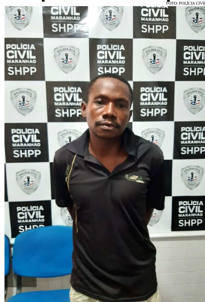
"ALUMÍNIO" É SUSPEITO DE PARTICIPAÇÃO EM CRIME EM 2016

Uma ação da Polícia Civil do Maranhão culminou na prisão temporária de um homem suspeito de participação em um homicídio.