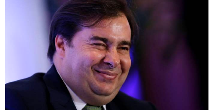
CÂMARA DOS DEPUTADOS