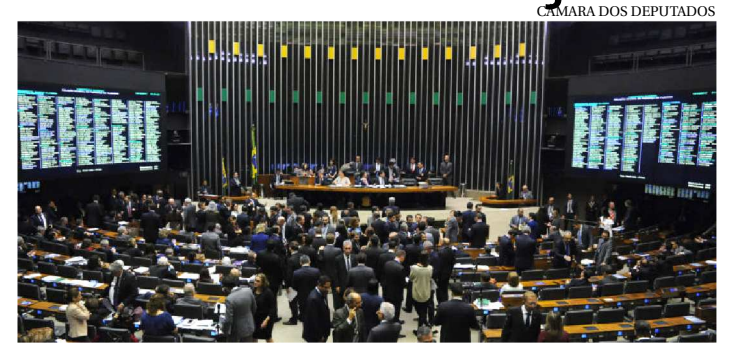
CÂMARA DOS DEPUTADOS