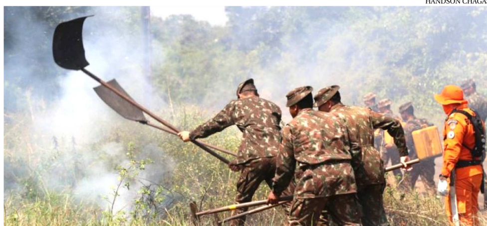
EXERCÍTO E CORPO DE BOMBEIROS IRÃO FAZER AÇÕES PARA EVITAR PREJUÍZOS