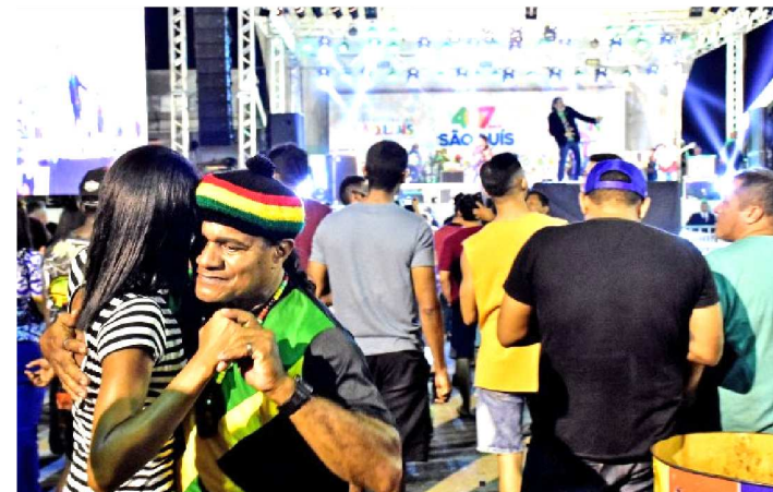
DIA DO REGUEIRO FOI COMEMORADO COM VÁRIOS SHOWS