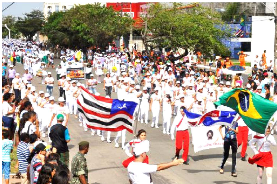
DESFILE DE 7 DE SETEMBRO E GRITO DOS EXCLUÍDOS MARCARÃO DATA CÍVICA NA ILHA

Haverá, entre outros veículos, várias viaturas do Exército, Polícia Militar e Corpo de bombeiros, além das tro-