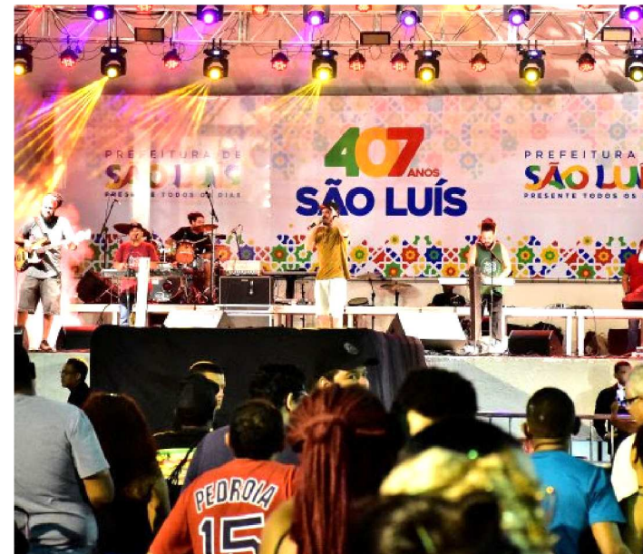
PRAÇA MARIA ARAGÃO SERÁ O PALCO DAS COMEMORAÇÕES