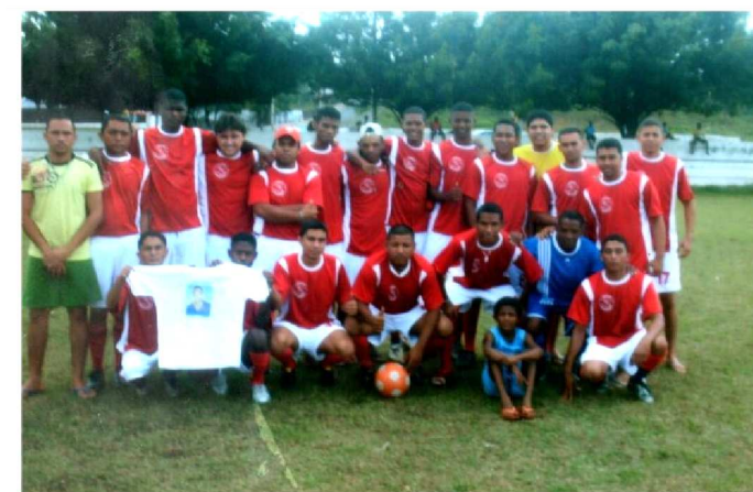
AMIGOS PARA SEMPRE FUTEBOL CLUBE DO COROADINHO