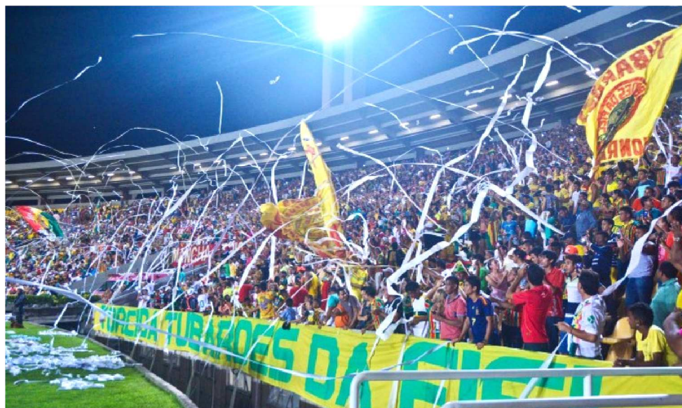
CASTELÃO RECEBERÁ CENTENAS DE BOLIVIANOS QUE ESTÃO NA TORCIDA PELO TIME