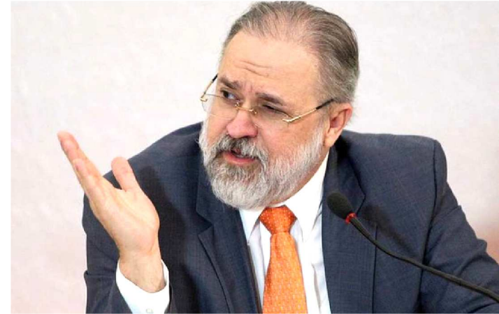
AUGUSTO ARAS FOI O ESCOLHIDO POR BOLSONARO PRA PGR

O procurador-geral da República é um postos mais importantes e prestigiados da República. Até hoje, 41 pessoas ocuparam o cargo. O primeiro deles foi o cearense José Júlio de Albuquerque, que exerceu a função entre 3 de março de 1891 e 3 de agosto de 1893. Raquel Dodge foi a última a ser nomeada. Indicada pelo ex-presidente Michel Temer em 28 de junho de 2017, tomou posse em 18 de setembro daquele ano. Agora é a vez de Augusto Aras, 61 anos, escolhido na última quinta (5) pelo presidente Jair Bolsonaro.