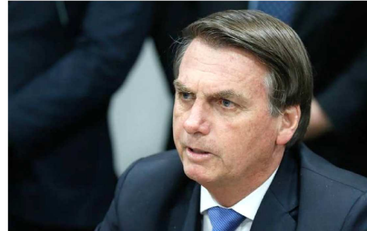
PRESIDENTE BOLSONARO CRIOU A ID ESTUDANTIL POR MP

O presidente Jair Bolsonaro lançou, na tarde de ontem, no formato de aplicativo, a ID Estudantil para alunos da educação básica, tecnológica e superior. Totalmente gratuita, a carteirinha será disponibilizada em ambiente digital, nas lojas Google Play e Apple Store.