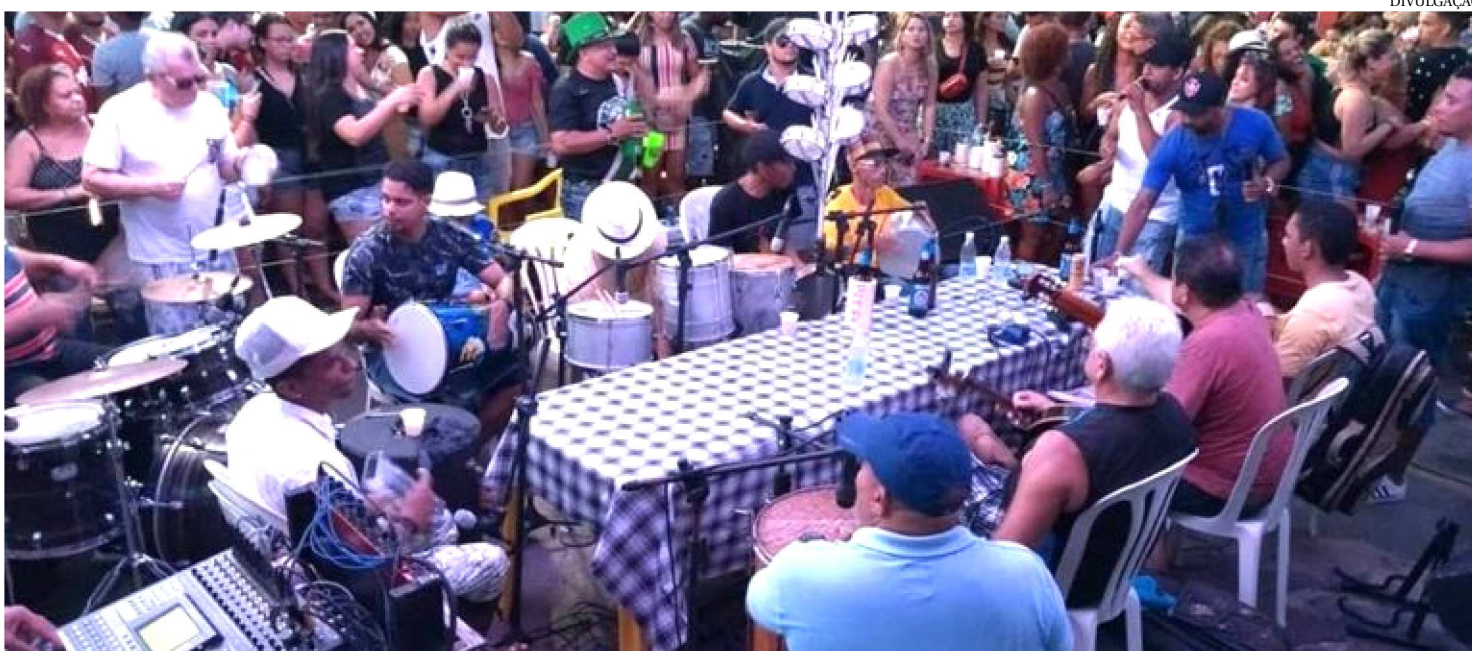
O TRIBUNA DO SAMBA FOI IDEALIZADO PELO CONJUNTO DE SAMBA MADRILENUS EM 2012 E ESTE ANO COMPLETA SETE ANOS

O aniversário dos 407 anos de São Luís é domingo, dia 8, e que tal comemorar com uma grande roda de samba? A roda de samba mais raiz e charmosa da Madre Deus é o Tribuna do Samba, que terá uma programação especial para marcar o aniversário da cidade. Será a terceira das 8 edições do Projeto, que neste ano será encerrado no dia 8 de dezembro. Há seis anos o projeto ocorre sempre no segundo domingo de cada mês na Madre Deus. A roda de samba, aberta ao público e aos artistas começa às 17h, no Conselho Comunitário da Madre Deus, e a entrada é gratuita.