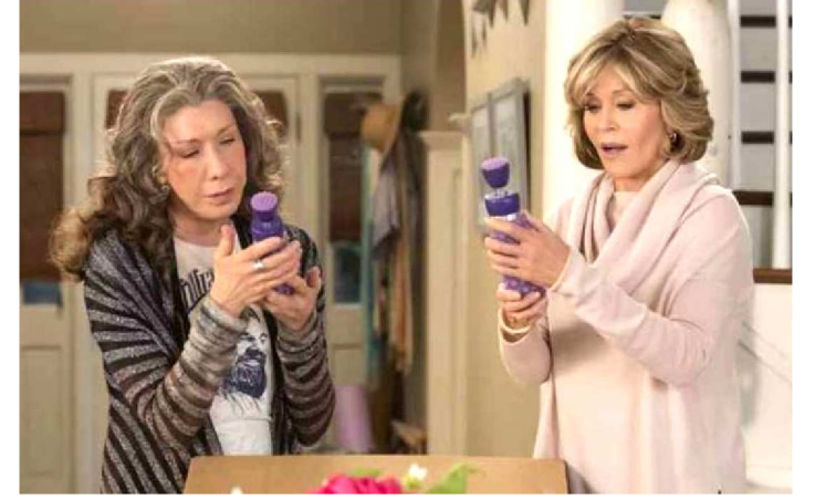
LILY TOMLIN PROTAGONIZA A SÉRIE JUNTO COM JANE FONDA

A Netflix anunciou, nesta semana, que uma das mais bem-sucedidas séries originais do serviço de streaming foi renovada para a sétima e última temporada. Trata-se da comédia dramática Grace and Frankie . A temporada de conclusão da série contará com 16 episódios, diferentemente das anteriores com 13, e torna a série a mais longa de todos os tempos da Netflix, totalizando 94 episódios.