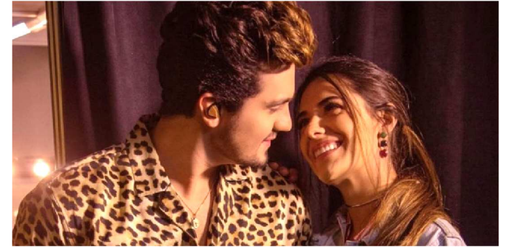
LUAN SANTANA E JADE MAGALHÃES ESTÃO JUNTO HÁ 12 ANOS

Finalmente! Luan Santana e Jade Magalhães vão se casar. O cantor anunciou a novidade em entrevista à revista 'Veja'. Eles estão juntos, entre idas e vindas, há mais de 10 anos.