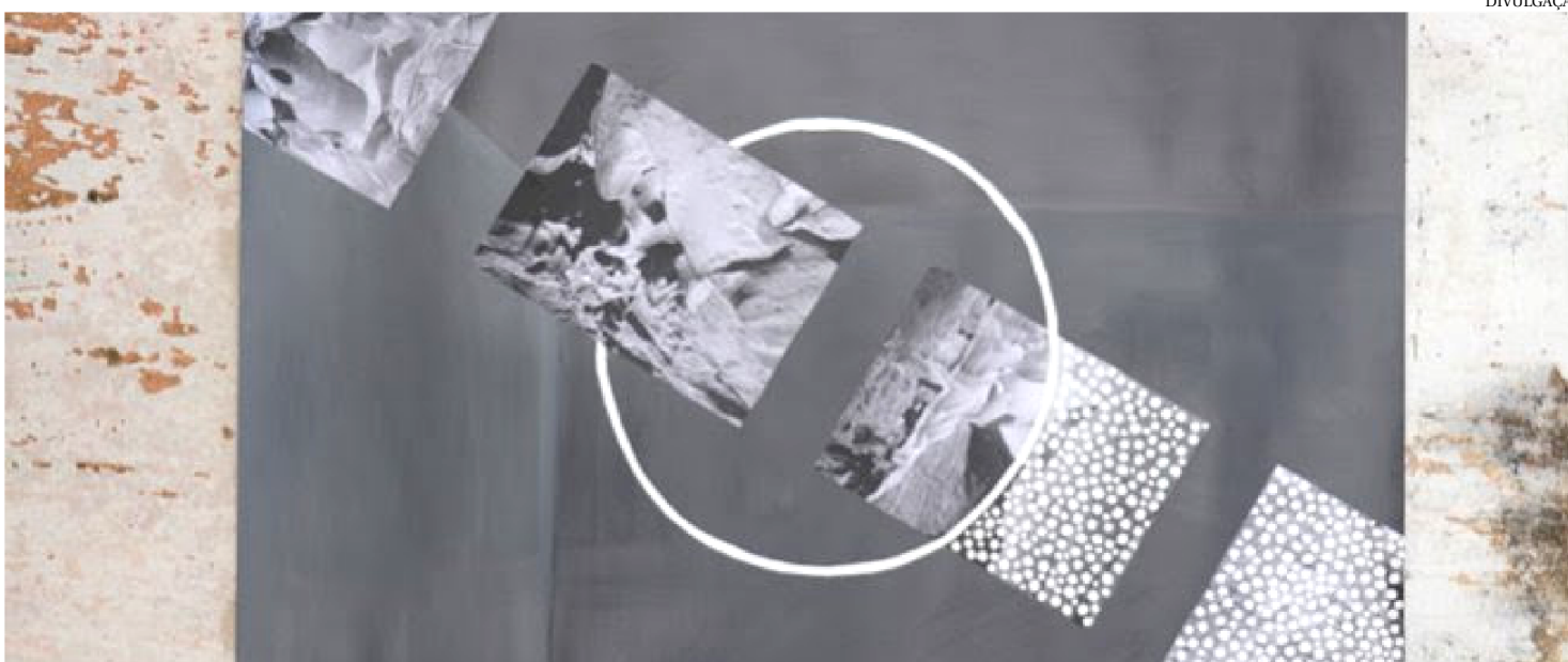
MOSTRA FOTOGRÁFICA DE ARTISTA ITALIANA SIMONA LUCHAIN ESTÁ EM CARTAZ NA GALERIA TRAPICHE ATÉ 25 DE OUTUBRO

Nesta semana, na Galeria Trapiche, tem início uma nova edição da mostra Ocupação Trapiche intitulada ‘Vestígios de um Nascimento’, da artista ítalo-romena Simona Luchian, que apresenta uma fusão de suportes como fotografia, escultura, instalação, pintura e performance. A galeria é um equipamento cultural da Prefeitura de São Luís coordenado pela Secretaria Municipal de Cultura (Secult) e fica localizada na Praia Grande, em frente ao Terminal de Integração. A exposição fica aberta à visitação das 14h às 19h de segunda a sexta-feira até 25 de outubro.