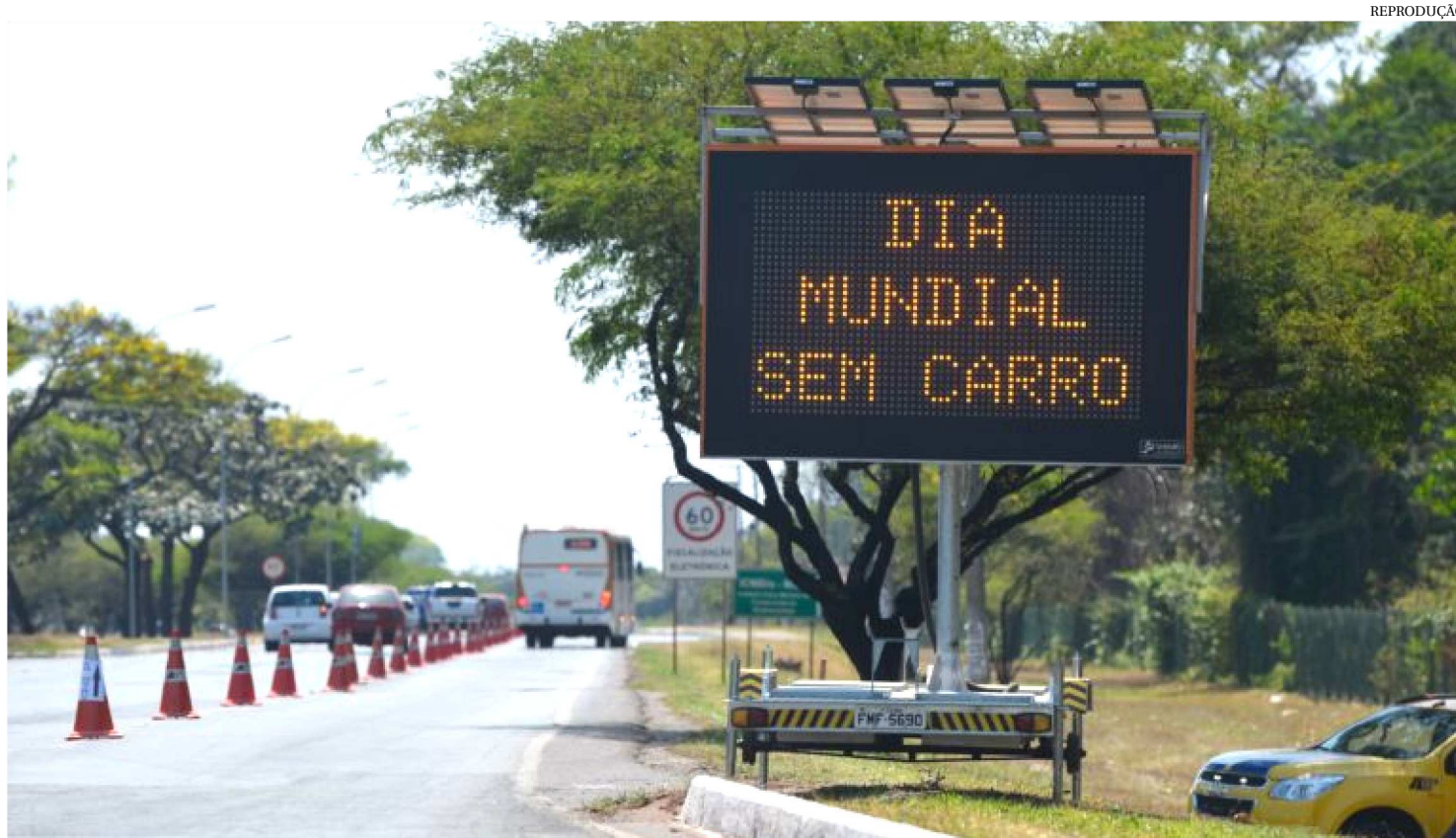
DIA MUNDIAL SEM CARRO DESEMBARCOU NO BRASIL APENAS EM 2001 COM AÇÕES EM 11 CIDADES DO PAÍS

Os carros, inegavelmente, foram uma evolução para o modo de vida do homem. As estradas avançaram fronteiras e as distâncias longas rapidamente se encurtaram. Mas também há muitos problemas que vieram de carona com o mercado automobilístico: o excessivo aumento da poluição, a imensa concentração de carros em grandes cidades, o gasto com matérias-primas e o trânsito irracional. Foi para repensar tudo isso que foi criado o Dia Mundial Sem Carro, celebrado em 22 de setembro.