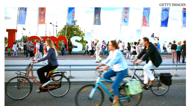
USO DE BIKES É UM DOS PONTOS DO DIA MUNDIAL SEM CARRO

Um levantamento feito recentemente pela ONG Mobilize Brasil, que acompanha os dados da mobilidade urbana do país, mostrou quanto espaço as bikes têm nas metrópoles brasileiras. A soma das estruturas cicloviárias das capitais que possuem vias exclusivas para bicicletas passa longe dos mais de 1.200km que os ciclistas têm à disposição em cidades da Europa como Berlim e Amsterdã, por exemplo.