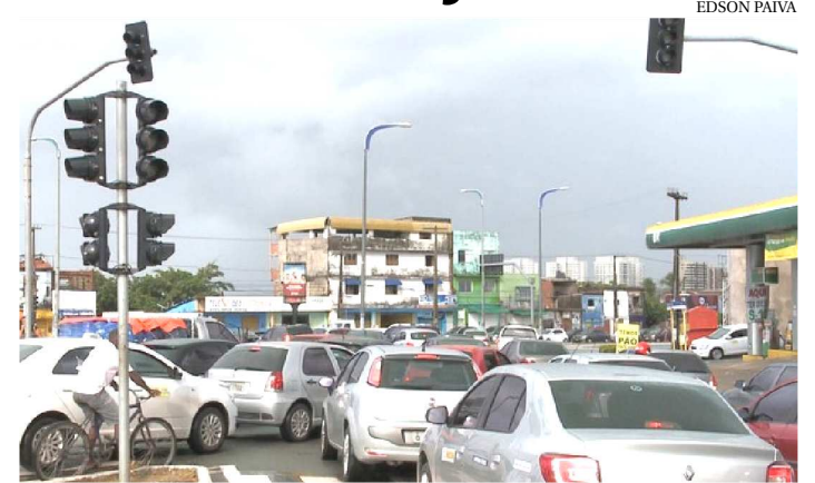
ENGARRAMENTOS SÃO COMUNS NA CAPITAL MARANHENSE

Segundo o site do Detran no Maranhão, o estado possui um 1.687.248 veículos, sendo que a São Luís possui uma frota de 400.760 veículos. Apesar de ter um número expressivo de automóveis, a cidade e os órgãos ligados ao segmento ainda não aderiram à data voltada para conscientização sobre os problemas causados pelo uso constante de veículos automotivos pela população. Essa data foi instituída em 2000 em outras partes do mundo como World Carfree Day e começou a ser comemorada no Brasil a partir de 2001. A última vez que a capital maranhense participou do movimento, foi no ano de 2016 com uma bicicletada segundo o site dos Engenheiros da Cidade de São Paulo.