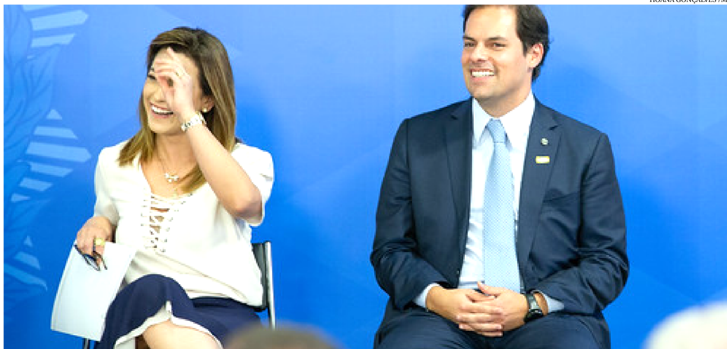
SECRETÁRIO ESPECIAL DE DESBUROCRATIZAÇÃO, GESTÃO E GOVERNO DIGITAL DO MINISTÉRIO DA ECONOMIA, PAULO UEBEL