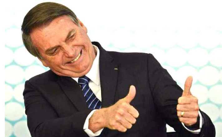
JANTAR FOI CONFIRMADO PARA APÓS PARTICIPAÇÃO NA ONU

Na entrada para o Palácio do Alvorada, após sancionar a MP da liberdade econômica no Planalto, o presidente Jair Bolsonaro afirmou que se encontrará com o líder dos Estados Unidos, Donald Trump, em um jantar, depois de participar da Assembleia Geral da Organização das Nações Unidas (ONU) na semana que vem.