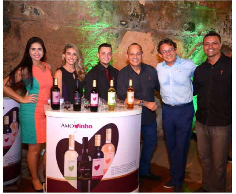
Degustação de vinhos e espumantes para descontrair o lançamento