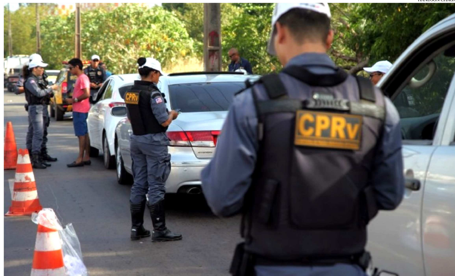
PESQUISA APONTA QUE ENTRE OS ANOS DE 2008 E 2016 A LEI SECA TERIA EVITADO A MORTE DE QUASE 41 MIL PESSOAS NO BRASIL

A “Lei Seca” completou 11 anos em 2019. Criado em 2008 pelo então deputado federal do PSC-RJ, Hugo Leal, o projeto nasceu com o intuito de coibir e punir quem bebe e dirige, e não apenas ampliou o rigor da legislação, como também estimulou o debate em toda a sociedade. Um estudo conduzido pelo Centro de Pesquisa e Economia do Seguro (CPES) e divulgado em 2017 aponta que, entre 2008 e 2016, a Lei Seca teria evitado a morte de quase 41 mil pessoas. Contudo, a embriaguez ao volante continua sendo umas das principais causas de acidentes de trânsito no país.