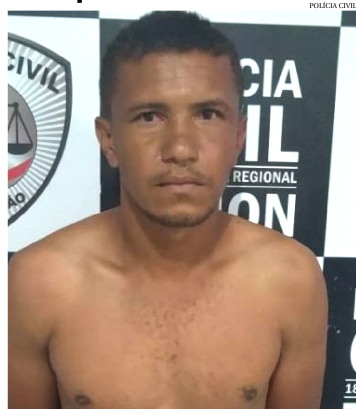
ALDERLI ABUSAVA DAS ENTEADAS JUNTO COM OS FILHOS