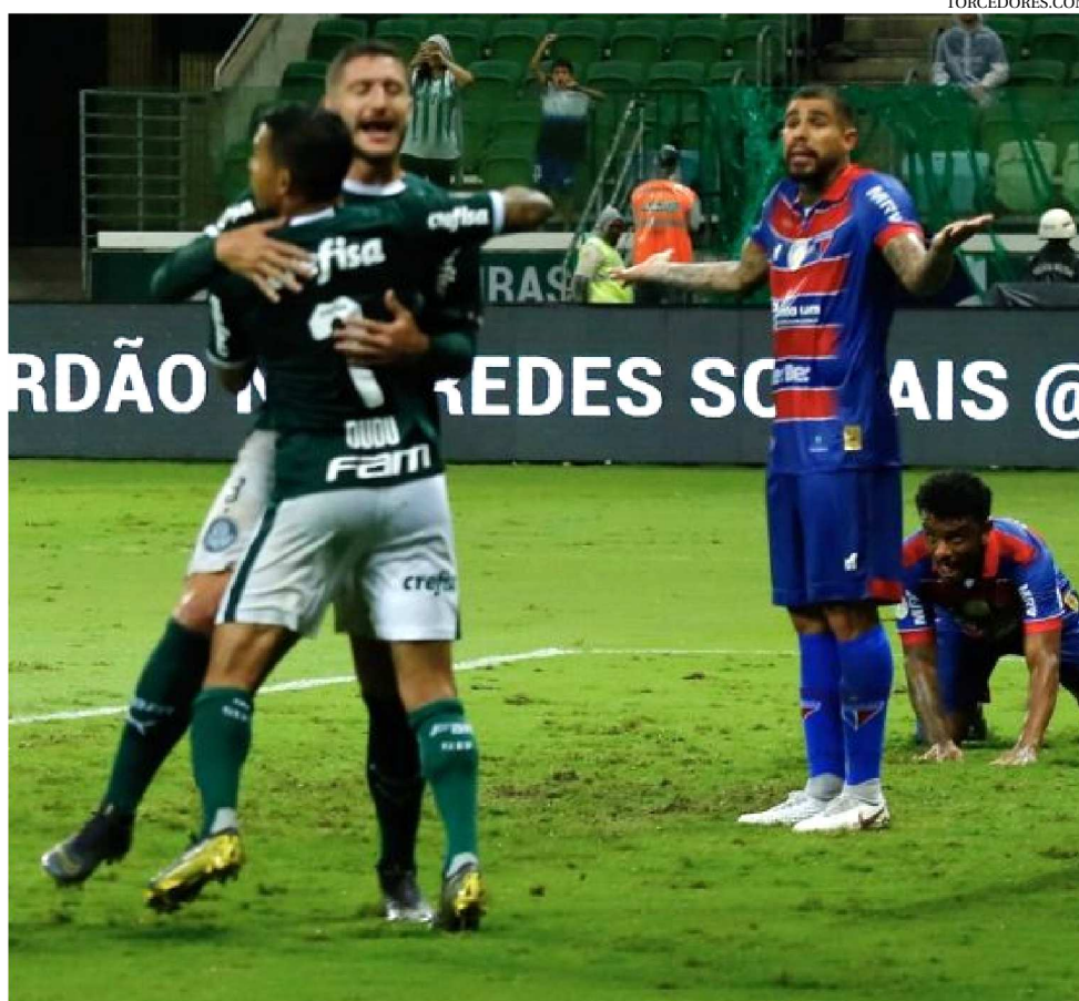
NO PRIMEIRO TURNO, O PALMEIRAS GOLEOU O LEÃO CEARENSE POR 4 X 0 EM SÃO PAULO

Um dos quesitos que precisa ser melhorado para atingir essa meta é o desempenho caseiro. O Tricolor é o 5º pior dono da casa da Série A do Brasileirão. Dos 27 pontos que disputou diante a torcida, ganhou 13 (quatro vi-