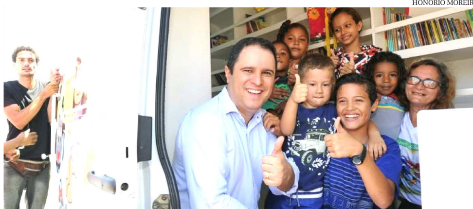
PREFEITO EDIVALDO ENTREGA CRECHE EM TEMPO INTEGRAL NA CHÁCARA BRASIL

“Estamos fazendo a entrega desta creche hoje com a certeza de que ela trará muitos benefícios para as crianças e famílias da região. A creche conta com toda a estrutura e equipe de profissionais necessárias para atender todas as necessidades dos alunos. A equipe é multiprofissional com nutricionistas, psicólogos, fonoaudiólogos e outros. Ainda este ano entregaremos creches na Cidade Operária e Morada do Sol e temos outras em construção”, disse o prefeito Edivaldo que estava acompanhado da primeira-dama, Camila Holanda, do vice-prefeito Julio Pinheiro e de secretários municipais, entre eles o titular da Semed, Moacir Feitosa.