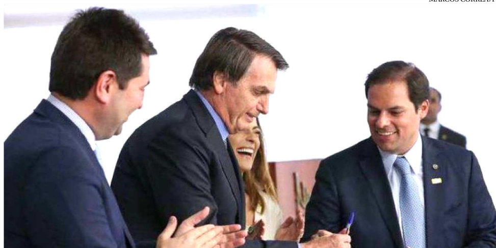
JAIR BOLSONARO NA VOLTA AO PALÁCIO DO PLANALTO APÓS CIRURGIA

O presidente afirmou que a lei “vai ajudar muito” a economia e sugeriu a criação de um programa para estímulo do empreendedorismo. “Queremos dar meios para que as pessoas se encorajem e tenham a confiança e a segurança jurídica de abrir um negócio. Se der errado lá na frente, ele desiste e