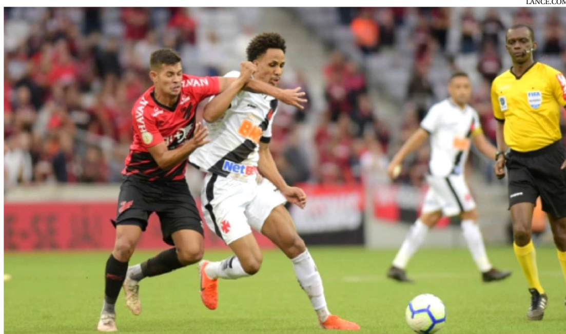
NA ABERTURA DA SÉRIE A, O VASCO FOI ATROPELADO PELO ATHLÉTICO-PR NA ARENA DA BAIXADA

O Vasco terá pela frente hoje, domingo (22), o que restou do Athletico-PR depois da comemoração do título da Copa do Brasil. O encontro cumpre a programação da vigésima jornada da edição 2019 da Série A do Campeonato Brasileiro. Será realizado no estádio de São Januário, no Rio de Janeiro, a partir das 16h (horário de Brasília).