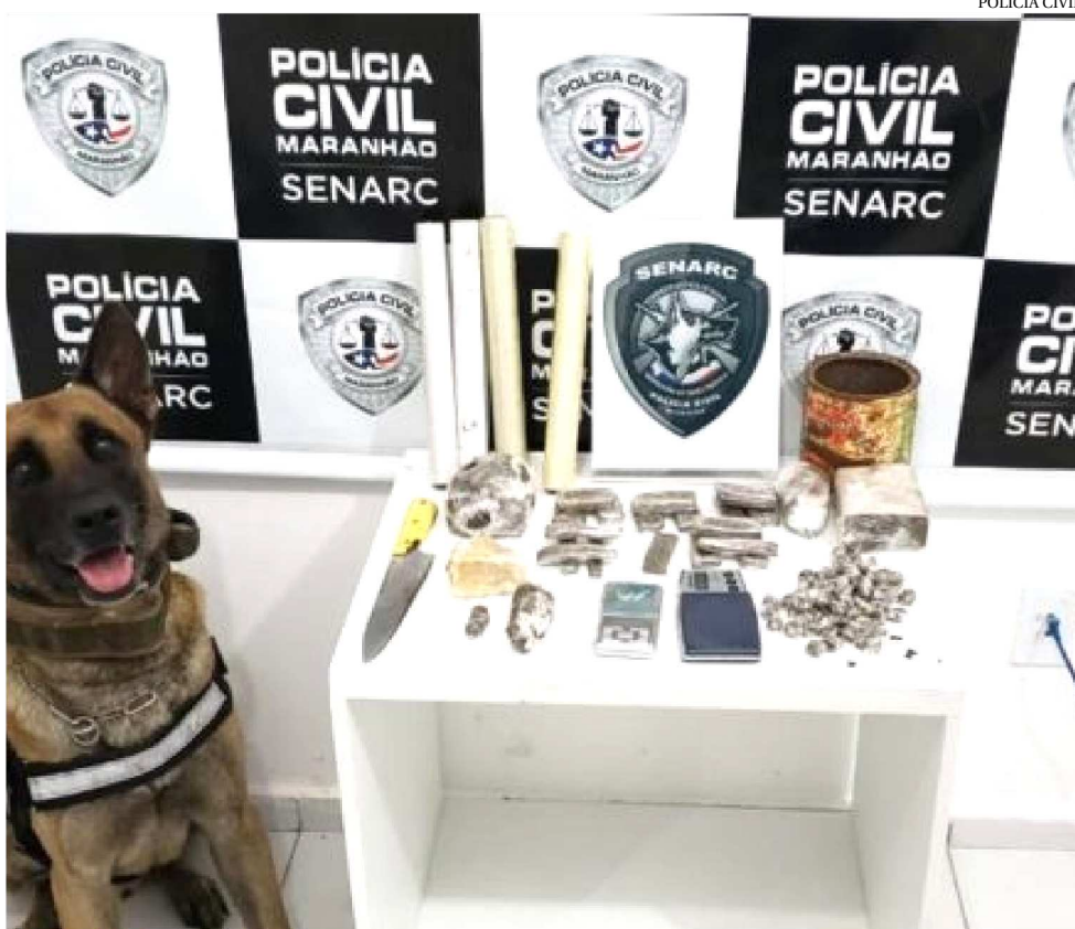
O CACHORRO VINY ENCONTROU OS ENTORPECENTES EM ÁREA DE MATAGAL, NA LAGOA

Uma operação da Polícia Civil do Maranhão, através da Superintendência Estadual de Investigações Criminais (Seic) e da Superintendência Estadual de Repressão ao Narcotráfico (Senarc), executou ação com a finalidade de coibir o tráfico de drogas cometido por integrantes de facção criminosa.