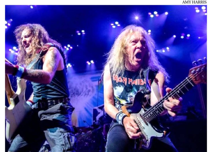
GUITARRAS SÃO O DESTAQUE DA BANDA INGLESA IRON MAIDEN

A paixão do brasileiro pelo samba é notória, mas também há uma grande parte da população que curte um rock’n roll. E às vésperas de começar mais um Rock In Rio, uma pesquisa descobriu que o Brasil é o país que mais ouve as músicas da banda inglesa Iron Maiden.