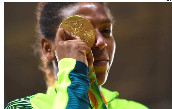
RAFAELA DISSE QUE PODE TER SIDO CONTAMINADA POR BEBÊ

Flagrada em exame antidoping realizado durante os Jogos Pan-Americanos de Lima, em agosto, Rafaela Silva deu suas primeiras palavras sobre o caso. Na Universidade Federal do Estado do Rio de Janeiro (Unirio), na Urca, na Zona Sul do Rio de Janeiro, em coletiva convocada pelo Instituto Reação, a judoca disse não ter feito o uso da substância de forma consciente.