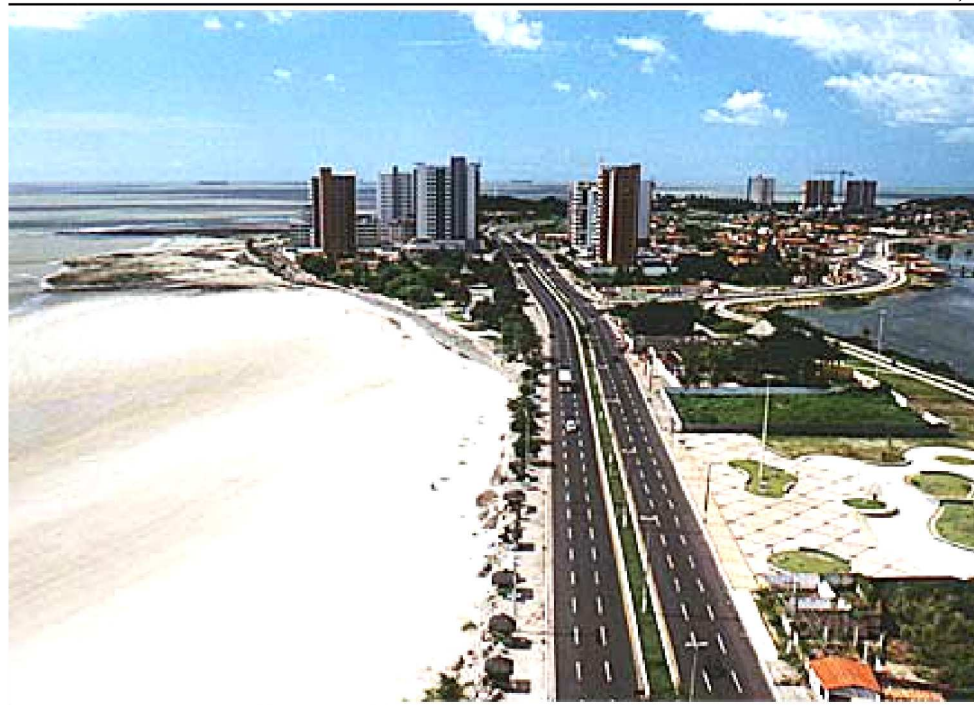
SONHO DOS ORGANIZADORES É VER AVENIDAS VAZIAS SEM AUTOMÓVEIS

Para comemorar o Dia Mundial sem Carro, diversas atividades são propostas para mudar o hábito da sociedade de grande uso de veículos automotivos. Em várias partes do mundo, são realizadas campanhas para motoristas deixarem seus carros em casa e irem ao trabalho ou escola a pé, de bicicleta, de transporte público ou,