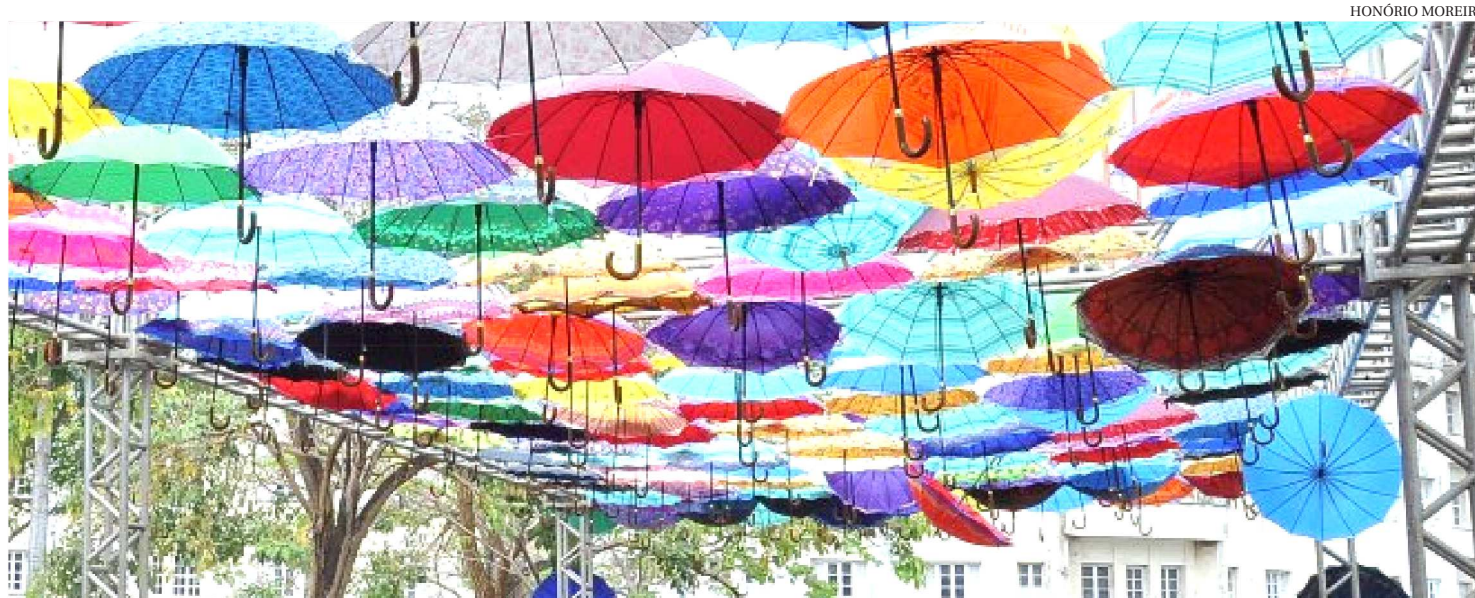
DECORAÇÃO COM SOMBRINHAS COLORIDAS ENCANTA PÚBLICO E SE TORNA NOVA ATRAÇÃO DA FEIRINHA SÃO LUÍS