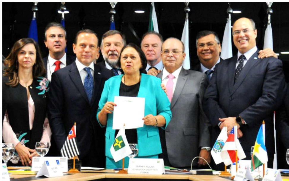
GOVERNADORES REAFIRMAM A IMPRESCINDIBILIDADE DO FUNDEB SER PERMANENTE

Durante o Fórum, o governador Flávio Dino defendeu a união dos gestores estaduais em torno da pauta da