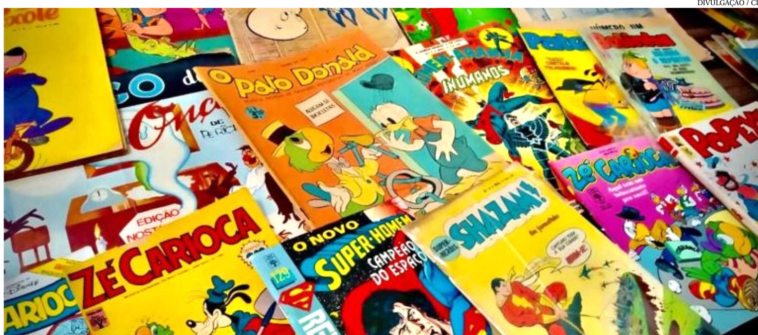
CENTRO DE INICIAÇÃO AO TRABALHO REALIZA EXPOSIÇÃO DE QUADRINHOS NA “SEMANA DA CRIANÇA”, NO BAIRRO DA FÉ EM DEUS

Durante o mês de outubro, a criança e os amantes de histórias em quadrinhos (HQs) terão a oportunidade de apreciar uma fantástica exposição dessas produções com mais de 3 mil exemplares. A mostra estará disponível até o dia 12 deste mês, no Centro de Iniciação ao Trabalho (CIT), localizado na Avenida IV Centenário, no bairro Fé em Deus, em São Luís.