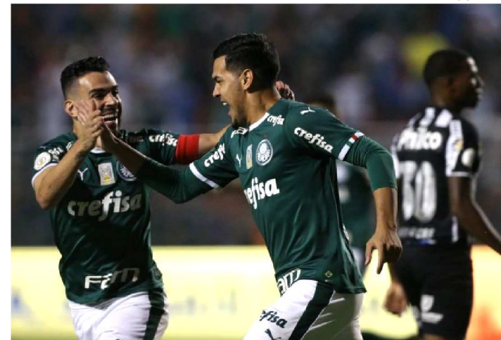
NO PRIMEIRO TURNO, PALMEIRAS GOLEOU O SANTOS POR 4 X 0

A vice-liderança da edição 2019 da Série A do Campeonato Brasileiro estará em jogo hoje, quarta-feira (9), no clássico paulista envolvendo Santos e Palmeiras. As equipes terão seus caminhos cruzados no estádio Urbano Caldeira, a Vila Belmiro, com público apenas do clube mandante, a partir das 21h30.