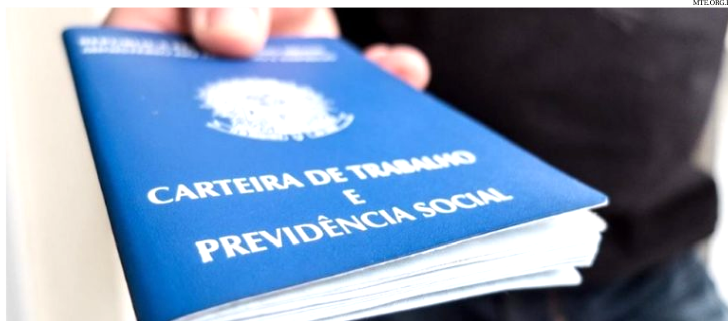
POSTOS DE TRABALHO SÃO OFERECIDOS EM VÁRIAS ÁREAS DE FORMAÇÃO, INCLUSIVE OPORTUNIDADES PARA ESTÁGIO REMUNERADO

As oportunidades são distribuídas em várias áreas de trabalho, com vagas também para estagiários e temporárias. Confira os postos abertos.