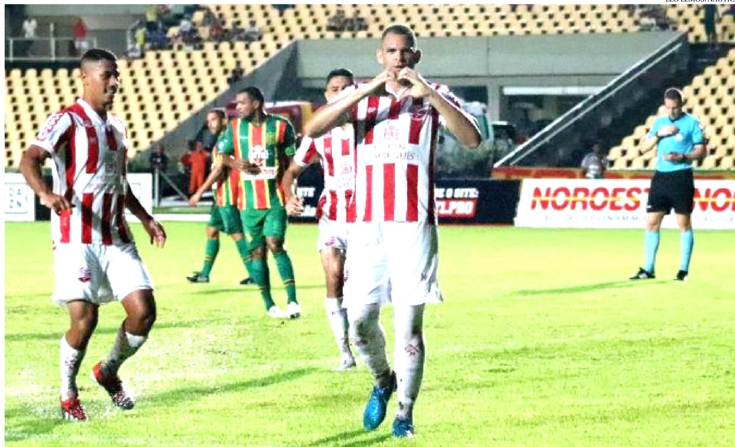
OS ESTÁDIOS COMEÇARAM A MELHORAR APÓS O TIME DO SAMPAIO CHEGAR ÀS FINAIS DA SÉRIE C DO CAMPEONATO BRASILEIRO 2019