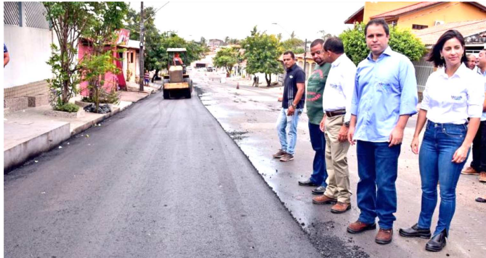
PAVIMENTAÇÃO D DO CONJUNTO ANGELIM FORAM INICIADOS NA MANHÃ DE ONTEM

“Esta é mais uma ação do programa São Luís em Obras. Estamos dando início ao trabalho no Angelim, onde serão pavimentados cerca de cinco quilômetros de vias contemplando ruas do Angelim de Baixo e do Angelim de Cima. Lembrando que temos outras frentes de trabalho em andamento, como no Conjunto Vinhais, com 16 quilômetros de pavimentação de ruas e avenidas, onde já estamos com mais da metade do serviço concluído. Também no Cohatrac já avan-