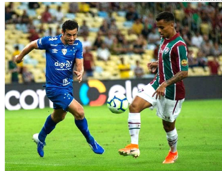
CRUZEIRO É O 3º PIOR MANDANTE DO BRASILEIRÃO DESTA ANO

Com três baixas para cada lado, Cruzeiro e Fluminense se enfrentam hoje, no Mineirão, em Belo Horizonte, a partir das 21h30.