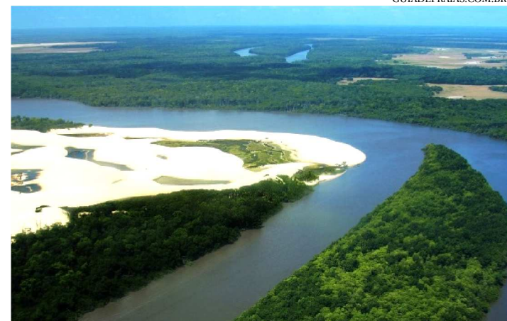
AS BUSCAS ESTÃO SENDO REALIZADAS NO RIO PREGUIÇAS