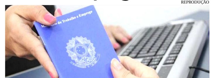
AS OPORTUNIDADES DE EMPREGO DISPONÍVEIS NA CAPITAL

A edição de ontem do jornal O Globo mostra que São Luís é a única capital nordestina que acumula saldo positivo na criação de empregos com carteira assinada neste ano. Os dados foram extraídos de levantamento feito pela Consultoria Tendências.