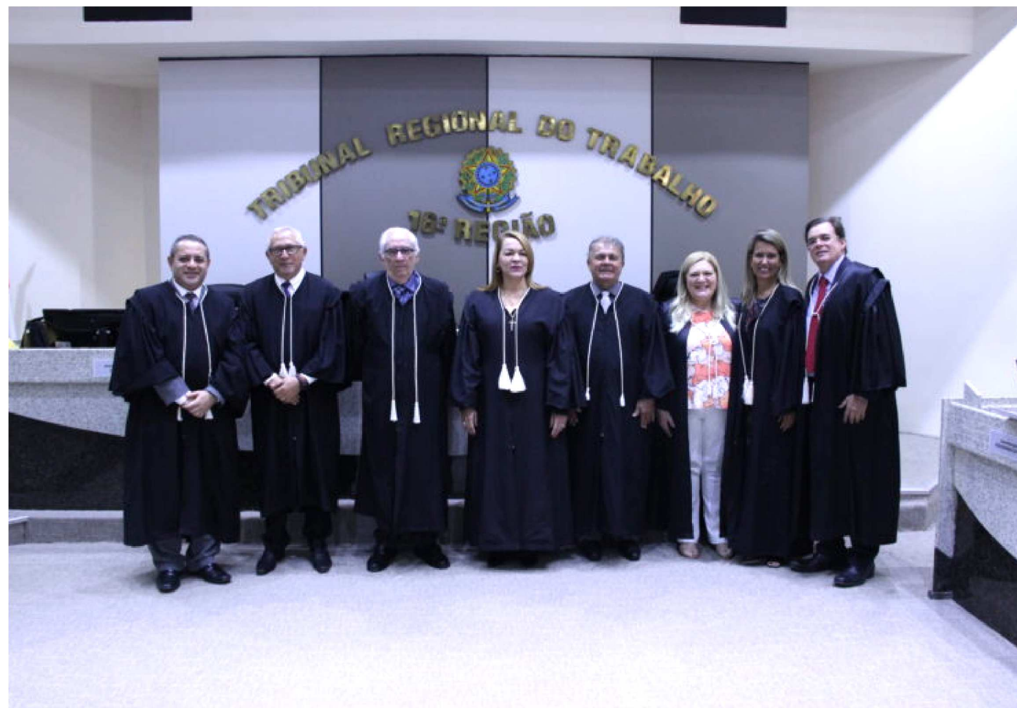
INTEGRANTES DO PLENO FORAM ELEITOS POR ACLAMAÇÃO, PARA OS CARGOS DE PRESIDENTE, VICE-PRESIDENTE E CORREGEDOR