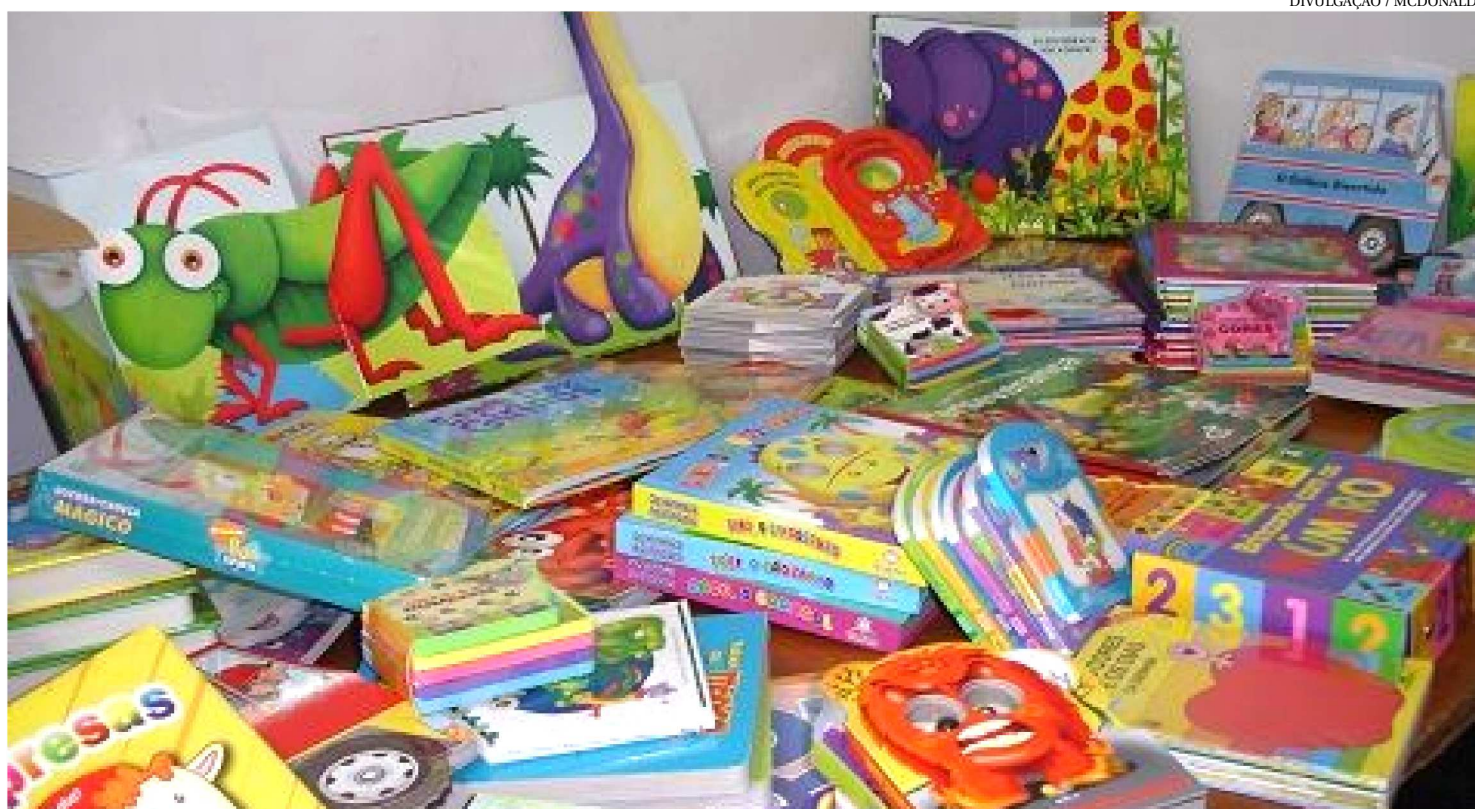
LIVROS E BRINQUEDOS SÃO AS OPÇÕES MAIS PROCURADAS PARA PRESENTES NO DIA DAS CRIANÇAS

Encerrando mais uma ação em alusão ao Dia das Crianças, o Instituto de Promoção e Defesa do Cidadão e Consumidor do Maranhão (Procon/MA) divulgou ontem a pesquisa comparativa de preços sobre brinquedos e livros infantis, em São Luís.