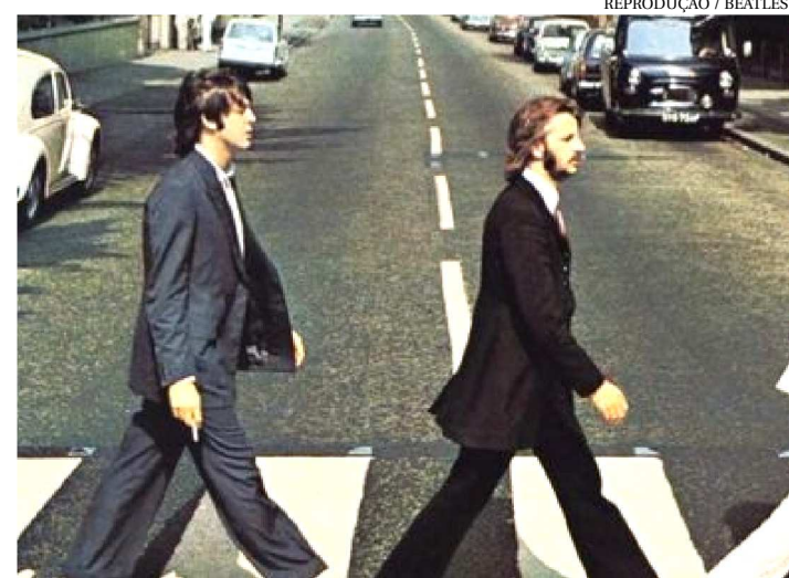
PAUL E RINGO SÃO OS ÚNICOS MEMBROS DA BANDA VIVOS

Cinquenta anos depois de seu lançamento original, Abbey Road , dos Beatles, voltou ao pódio de discos mais vendidos, chegando ao terceiro lugar na parada Rolling Stone Top 200 da semana passada, vendendo mais de 81 mil unidades.