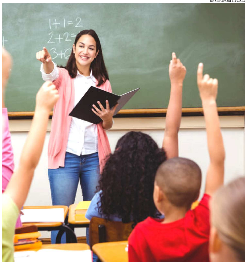
AS VAGAS OFERECIDAS NO CONCURSO SÃO PARA PROFESSORES DE VÁRIAS MATÉRIAS

O período de inscrições iniciará às 10 horas do dia 23 de outubro e se encerra às 18 horas do dia 7 de novembro de 2019.