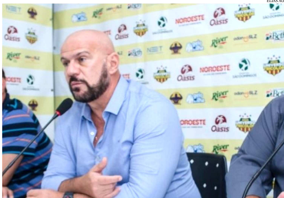
FROTA REVELOU QUE ADMINISTRA O SAMPAIO CORRÊA COM ORÇAMENTO MUITO BAIXO

Precisamos pagar a folha de setembro, que vence agora em outubro, mais o prêmio do acesso, além de outros compromissos financeiros em geral