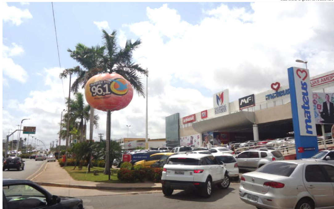
DUPLA CHEGOU AO SHOPPING DO AUTOMÓVEL EM MOTO E FUGIU CORRENDO PARA O MATAGAL