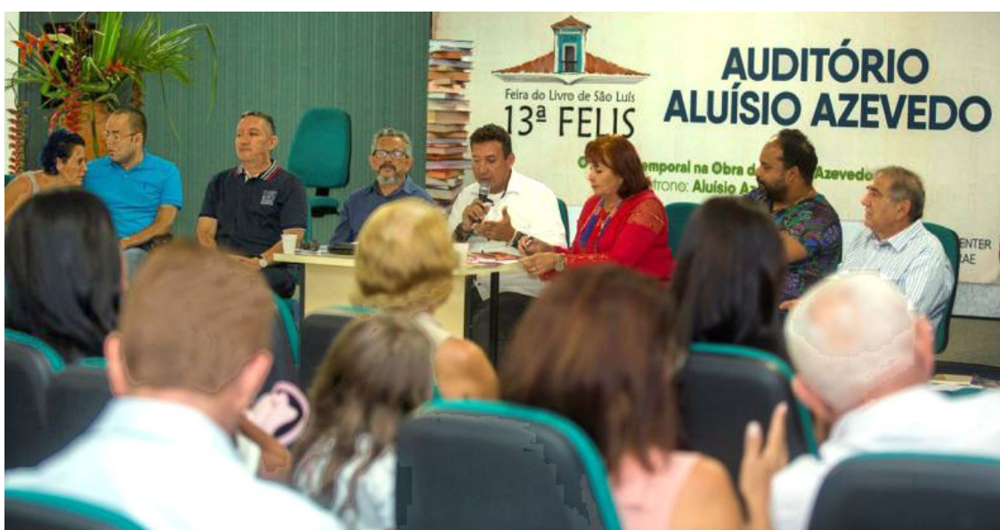
Dentro da programação acontecem diversos eventos paralelos que têm temáticas transversais à educação e cultura