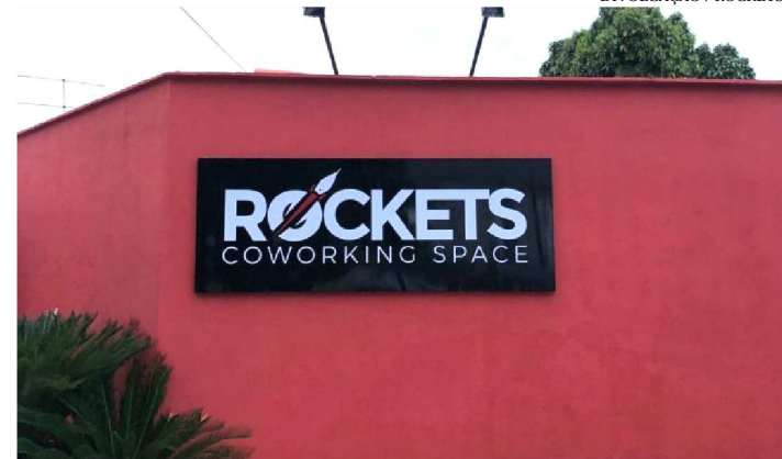
EVENTO OCORRE EM COWORKING NO BAIRRO DO OLHO D'ÁGUA

Para quem deseja aprender a usar as redes sociais de forma eficiente, um curso em São Luís de hoje até o dia 17 vai oferecer esta oportunidade. O objetivo é ensinar aqueles profissionais que trabalham com redes sociais ou pretendem ingressar na área a usarem as plataformas digitais de forma mais eficaz e, conseqüentemente, obtendo melhores resultados.