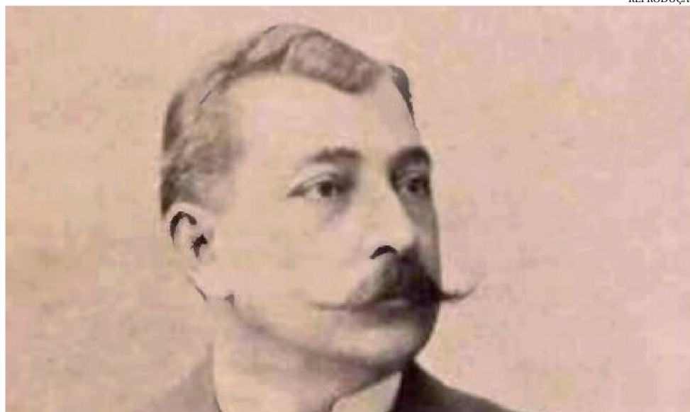
MARANHENSE ALUÍSIO DE AZEVEDO ESCREVEU O ROMANCE ORIGINAL EM 1881

Lançado em 1881, o romance original de Azevedo inaugurou o “Natura-