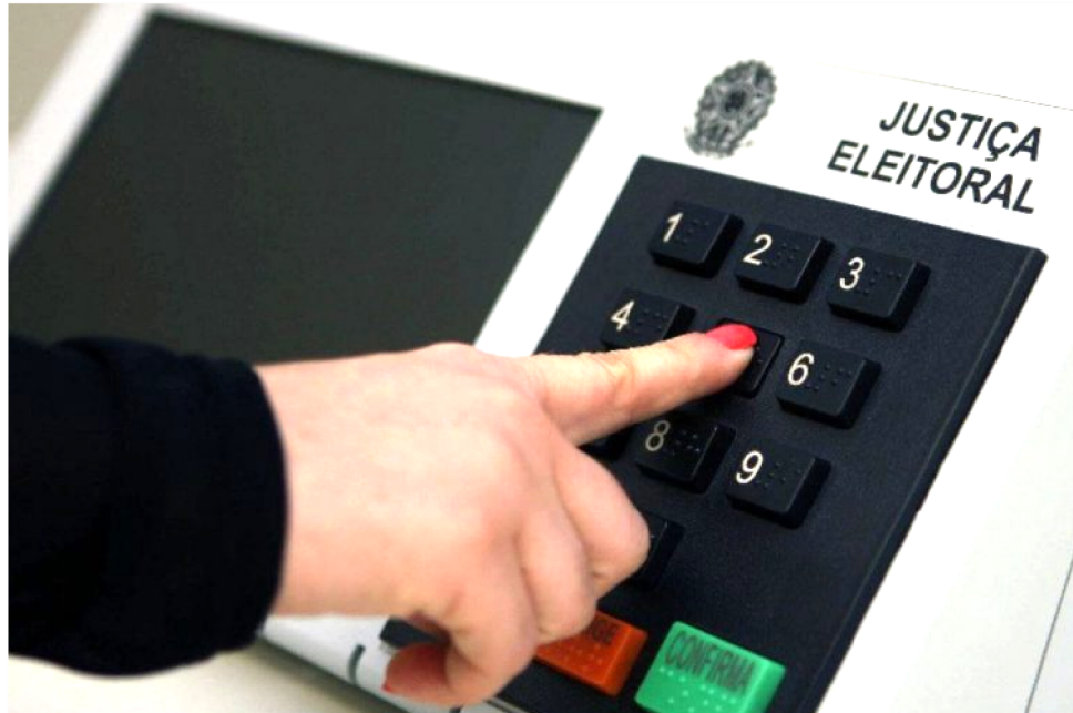
COM A MUDANÇA NA LEI ELEITORAL, ELEIÇÕES PARA VEREADOR FICARÃO MAIS DIFÍCEIS