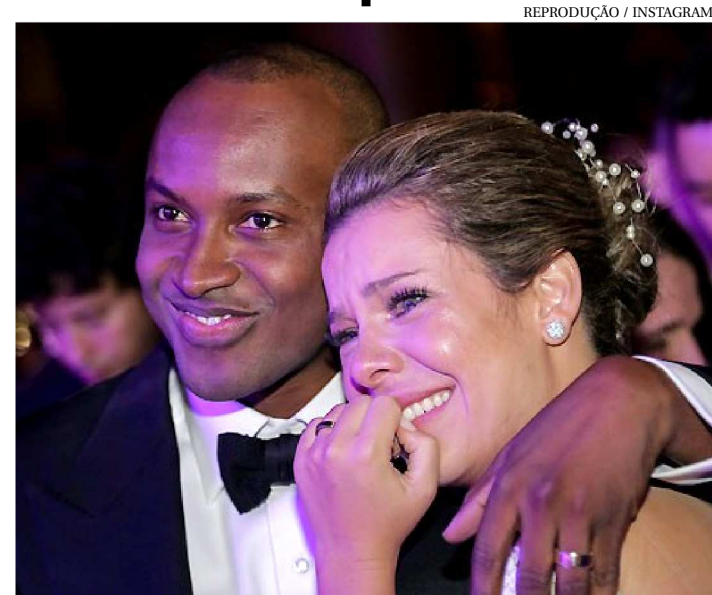
CANTOR E ATRIZ ESTAVAM JUNTOS HÁ MAIS DE OITO ANOS

Após mais de 8 anos juntos, o cantor Thiaguinho e a atriz e comediantes Fernanda Souza anunciaram o fim da relação. Na tarde desta segunda-feira (14/10), o casal publicou um comunicado no Instagram. “Não somos mais um casal”, escreveram.