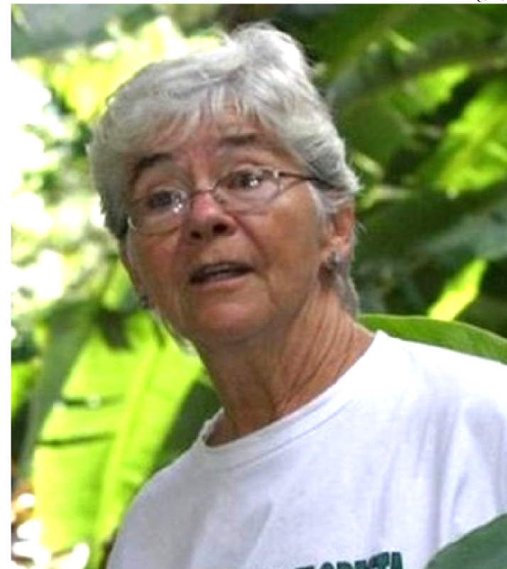
DOROTHY STANG FOI MORTA EM 2005 NA CIDADE DE ANAPU