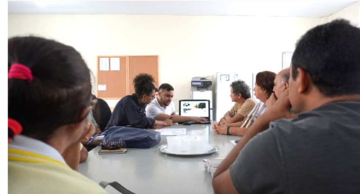
TÉCNICOS DA SECID APRESENTAM PROJETO DE REVITALIZAÇÃO

O bairro do Cohatrac, em São Luís, será o segundo a ser contemplado com o projeto de revitalização das praças; o primeiro foi a Cidade Operária, também na capital. A iniciativa é promovida pelo Governo do Estado, por meio da Secretaria das Cidades e Desenvolvimento Urbano (Secid) e visa incentivar a integração e transformar os equipamentos públicos em espaços democráticos de interação, lazer e convívio social.