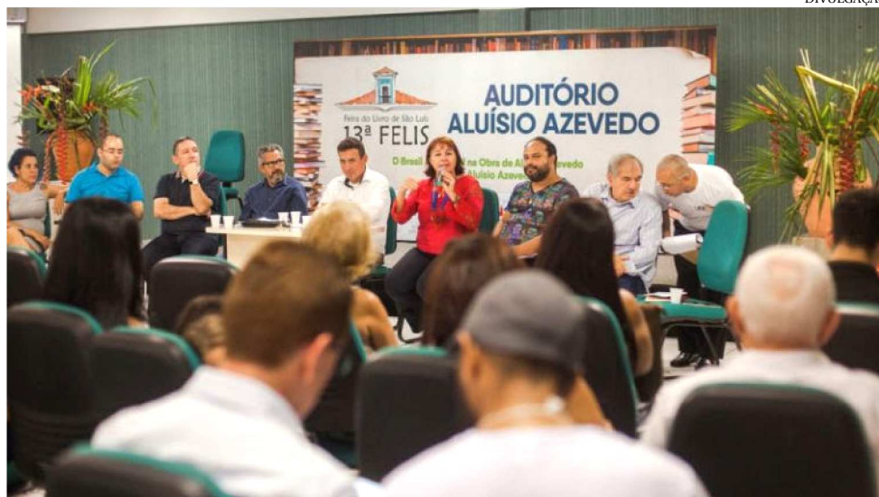
EVENTOS E ATIVIDADES SIMULTÂNEAS ATRAEM PÚBLICO PARA FEIRA DO LIVRO