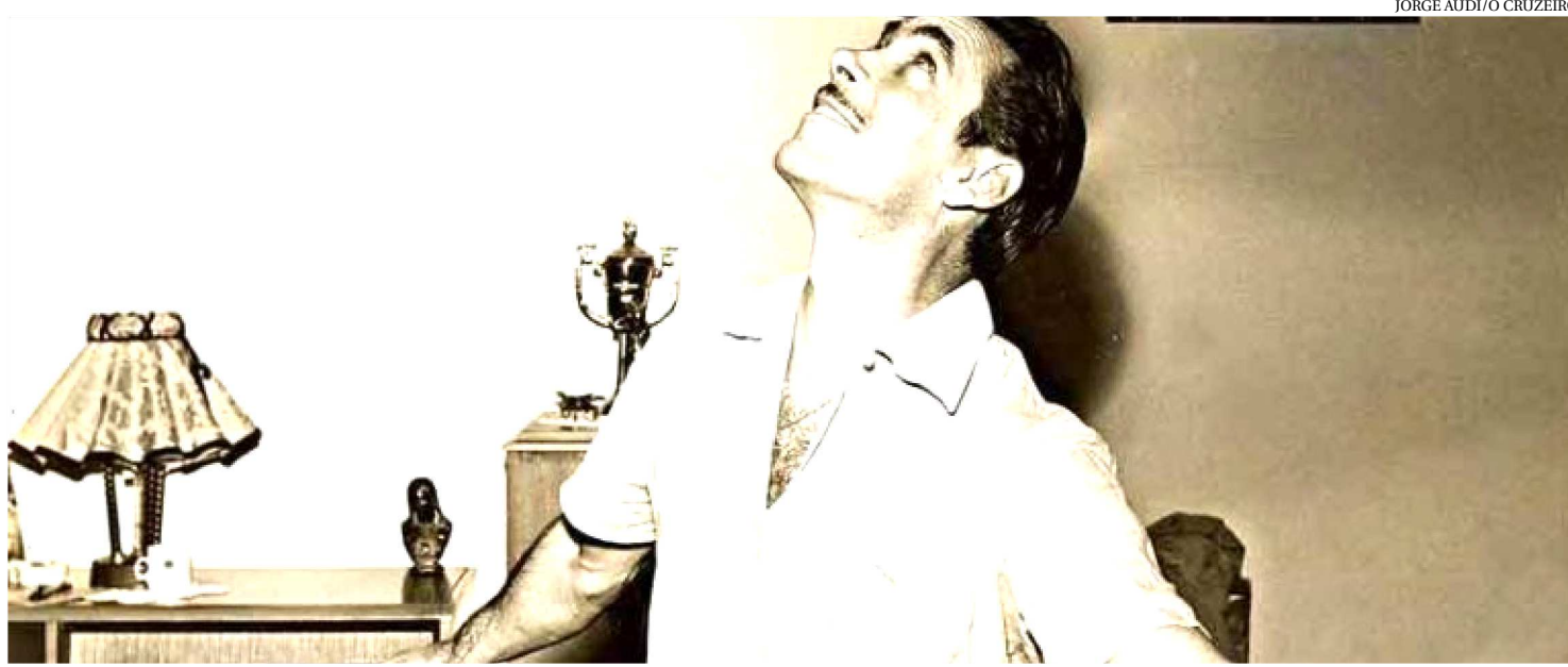
COM 60 ANOS DE CARREIRA, NELSON GONÇALVES FOI UM DOS CANTORES MAIS CARISMÁTICOS DO PAÍS

Nelson Gonçalves é o segundo maior vendedor de discos da história do Brasil – bateu 81 milhões de cópias e ficou atrás apenas de Roberto Carlos, com 120 milhões. Amado por várias gerações, seu maior sucesso foi a canção A volta do boêmio , composta por Adelino Moreira, em 1957. No dia 21 de junho completaram-se 100 anos de seu nascimento, mas poucos se lembraram da data.