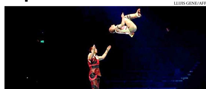
CIRQUE DU SOLEIL DURANTE ENSAIO DO ESPETÁCULO MESSI10

O Cirque du Soleil estreou na última quinta-feira (10), em Barcelona (Espanha), o espetáculo Messi10 , inspirado nas habilidades e na história do astro argentino do futebol. Os números se inspiram nas habilidades e na história de superação de Lionel Messi, embora não componham exatamente uma biografia do jogador.