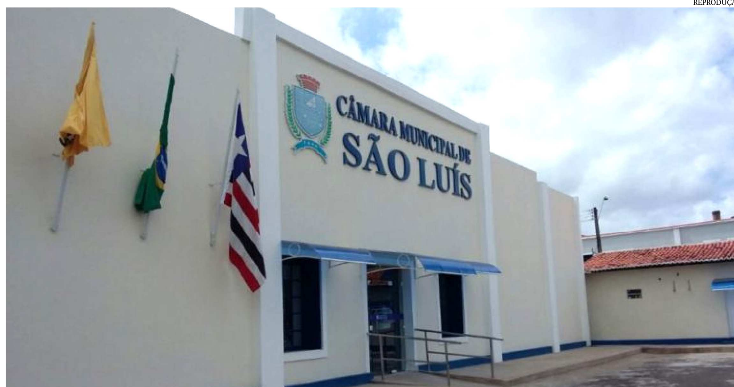
FIM DAS COLIGAÇÕES PODE SE TORNAR DETERMINANTE PARA A RENOVAÇÃO ENTRE ATUAIS VEREADORES DA CÂMARA DE SÃO LUÍS