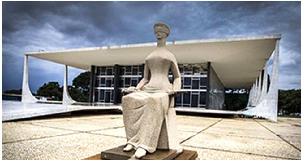
JULGAMENTO DO MÉRITO PODE BENEFICIAR O EX-PRESIDENTE LULA NA LAVA-JATO

O Tribunal também pode optar por uma solução intermediária, fixando como marco uma definição do Supe-