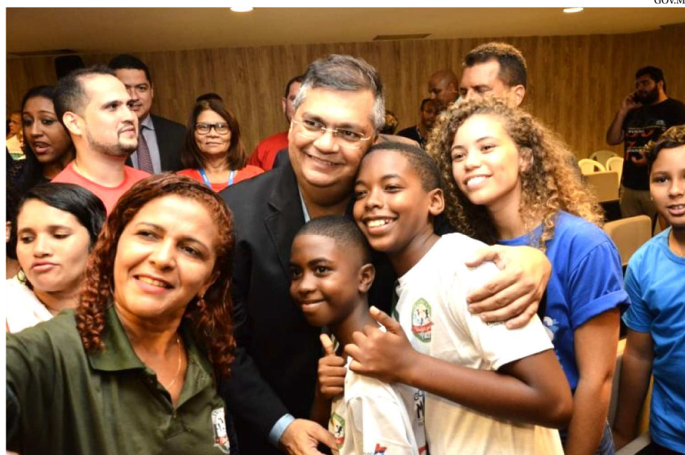
O ANÚNCIO FOI FEITO PELO GOVERNADOR DURANTE APRESENTAÇÃO DE PROJETO

A iniciativa representa um passo a mais na promoção e na garantia dos