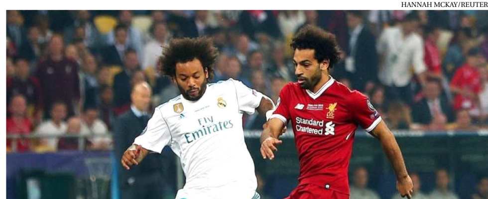
MARCELO CONQUISTOU O TRICAMPEONATO SOBRE O LIVERPOOL NA TEMPORADA 2018

Todo mundo tem medo, até quem é quatro vezes campeão da Liga dos Campeões. Em texto publicado no “The Players Tribune”, Marcelo revelou ter sofrido uma crise de pânico antes da final da Champions de 2018, contra o Liverpool. “Quando existe a chance de fazer história, você sente o peso disso. Mas, por alguma razão, eu realmente estava sentindo essa pressão. Nunca que eu tinha passado por tanta ansiedade assim antes. Pensei em chamar o médico, mas estava com medo que ele não me deixasse jogar”.