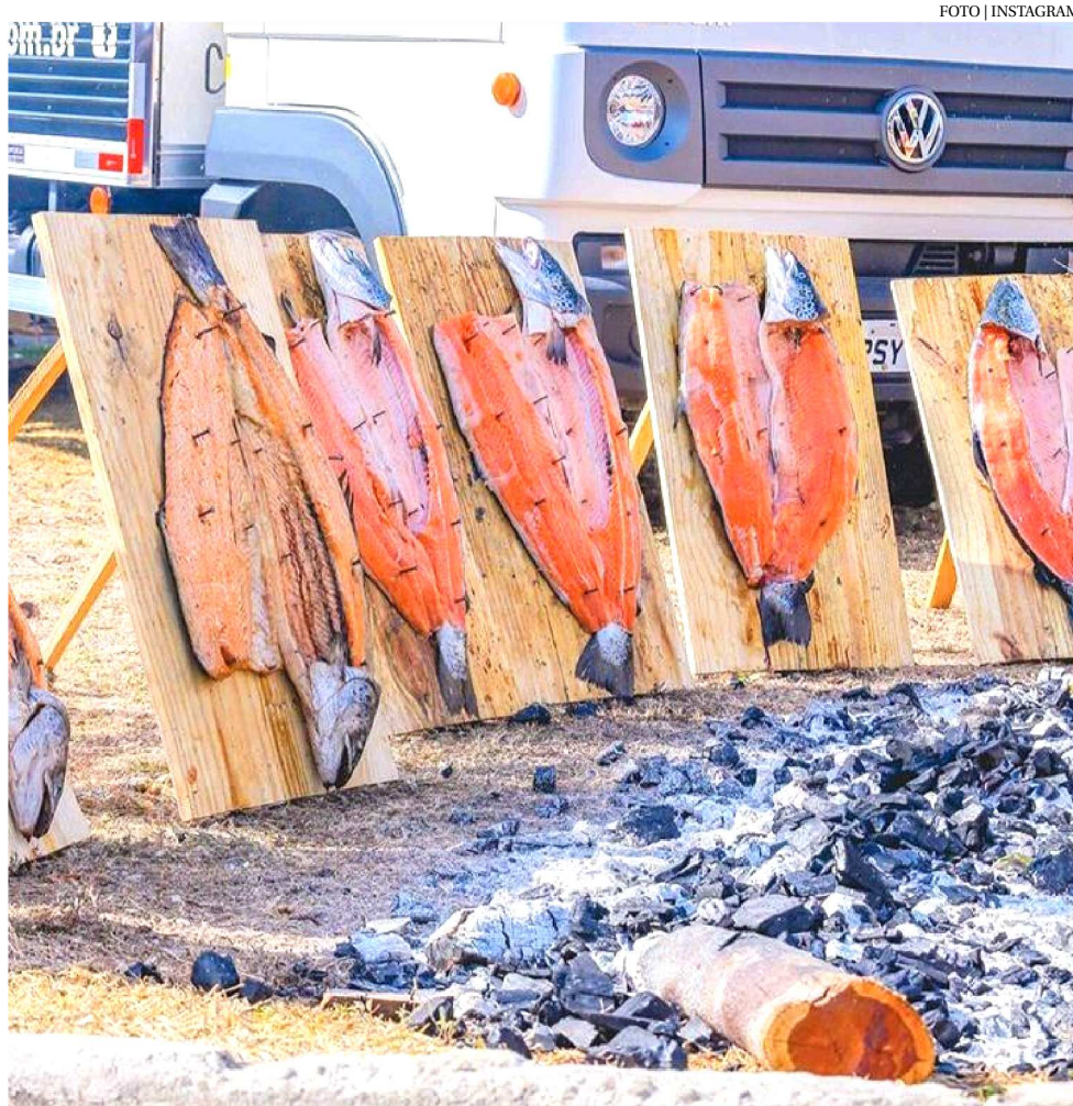
ESTAÇÃO DO SALMÃO PRANCHADO NA EDIÇÃO 2018.