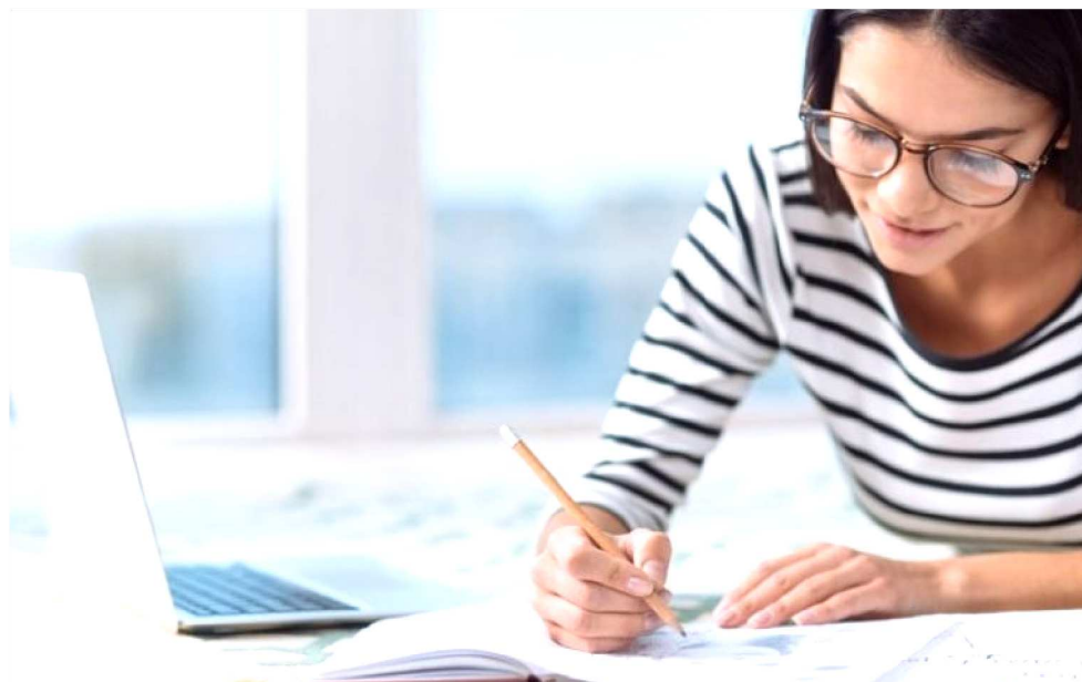
ESTUDAR E DESCANSAR AJUDA DURANTE A EXECUÇÃO DAS PROVAS DO ENEM

Mas o mais interessante desse estudo é a descoberta de que as pessoas se lembram melhor de informações depois de uma boa noite de sono quando sabem que elas serão úteis no futuro. Para chegar a essa conclusão, os pesquisadores realizaram dois testes de memória envolvendo 191 voluntários. Em um deles, cada participante deveria memorizar 40 pares de palavras; o outro foi um jogo da memória envolvendo pares de cartas com figuras de objetos e animais. Logo depois, metade dos voluntários foi informada de que faria um teste 10 horas depois para avaliar sua memória em relação a essas atividades. A outra metade não foi informada antes, mas também fez o teste junto com os outros. Somente alguns voluntários puderam dormir durante o período entre as tarefas e a avaliação. Resultado: quem dormiu se saiu melhor do que quem se manteve