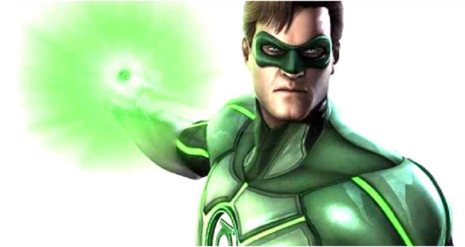
LANTERNA VERDE É UM DOS SUPERHEROIS DA DC COMICS

A HBO Max vai entrar com força no mercado das plataformas de streaming e decidiu começar com personagem importante dos quadrinhos. O serviço anunciou Lanterna Verde como uma de suas primeiras séries originais da DC. A novidade foi apresentada durante a WarnerMediaDay, convenção anual em que a Warner Bros. apresenta os novos projetos.