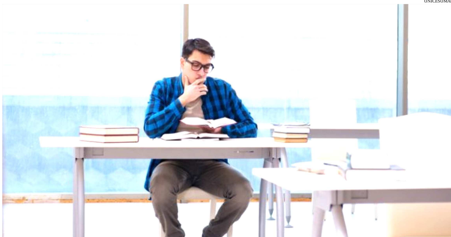
REVISÕES SÃO ESSENCIAIS PARA FIXAÇÃO DO APRENDIZADO, JÁ QUE O CÉREBRO APRENDE BASTANTE PELO MÉTODO DA REPETIÇÃO

Planejar os estudos é um dos passos mais importantes na sua caminhada para conquistar o diploma. Mesmo com o conteúdo do colégio, é importante tirar algumas horinhas do dia para dar aquela revisada e fixar melhor os conteúdos das provas. Hoje nós separamos algumas dicas para você montar o seu plano de estudos. E se você quer se atualizar pra mandar bem no Enem.