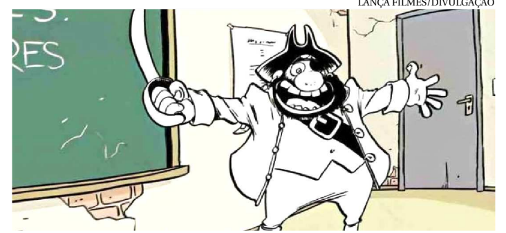
A CIDADE DOS PIRATAS SE INSPIRAM EM CRIAÇÃO DE LAERTE

Piratas do Tietê é o nome da série de quadrinhos criada pela cartunista Laerte Coutinho no começo dos anos 1980. Navegando pelo rio paulistano, o bando busca vítimas para saquear ou simplesmente torturar, por mera diversão. Apesar do sucesso dos personagens, eles foram abandonados por seu criador.