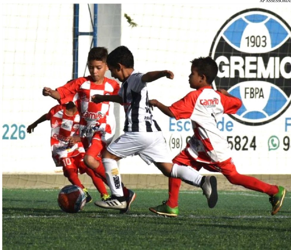
A BOLA VAI ROLAR NA CIDADE DE CHAPADINHA, DURANTE ESTE FIM DE SEMANA

De acordo com a programação divulgada para FMF7, na manhã de hoje serão realizados os jogos do torneio Sub-8. A bola vai rolar a partir das 8h para a partida entre Cruzeiro Chapadinha x Real Cruz. Ainda no período matutino, haverá os seguintes duelos: Titans x Cruzeiro Chapadinha e Real Cruz x Titans.