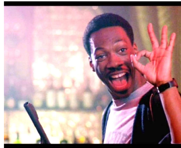
EDDIE MURPHY VOLTA COMO O POLICIAL AXEL FOLEY

A Netflix obteve licença junto a Paramount para filmar o quarto filme da franquia Um Tira da Pesada com a presença do ator Eddie Murphy, que interpretará novamente o policial Axel Foley. A informação é do site "Deadline".