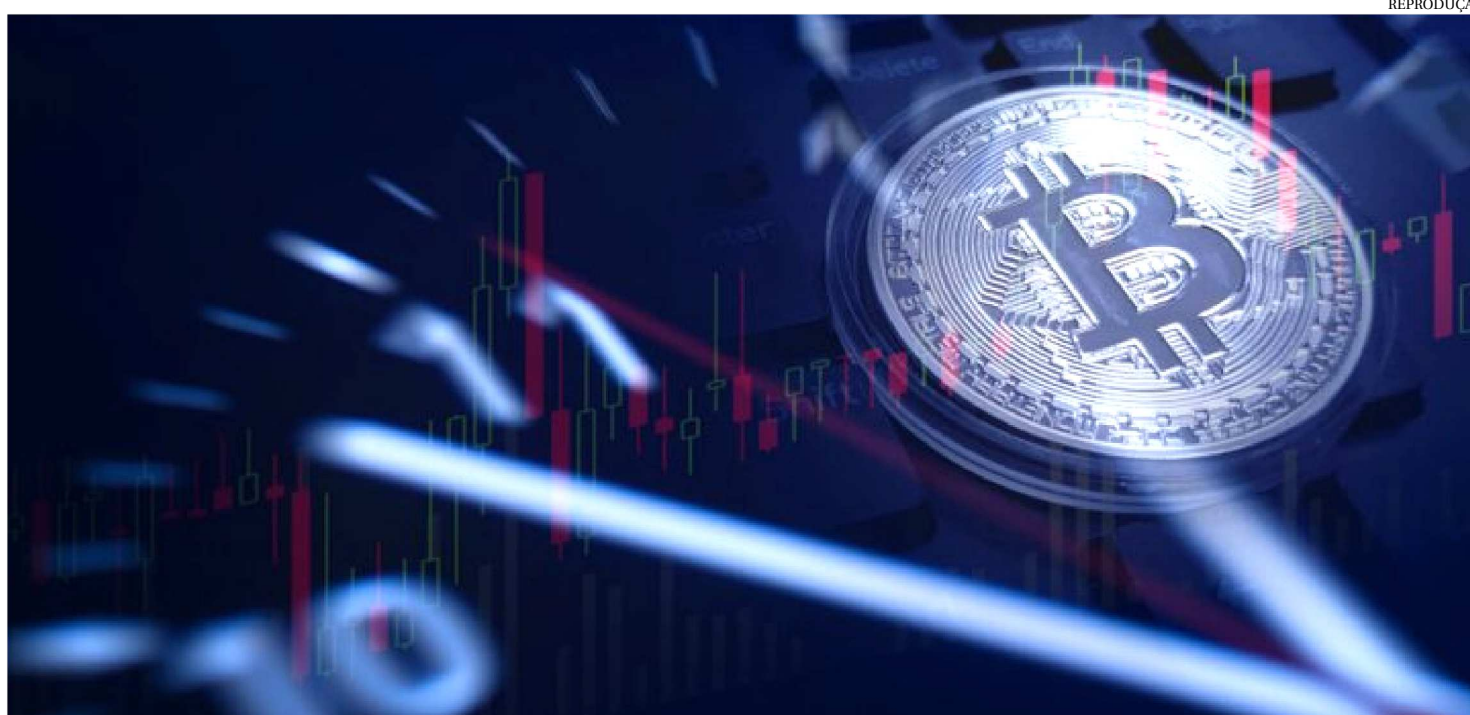
A TRANSFORMAÇÃO DO ANALÓGICO PARA O DIGITAL É UM DOS PONTOS CRUCIAIS PARA O SUCESSO DE UM EMPRESA MODERNA