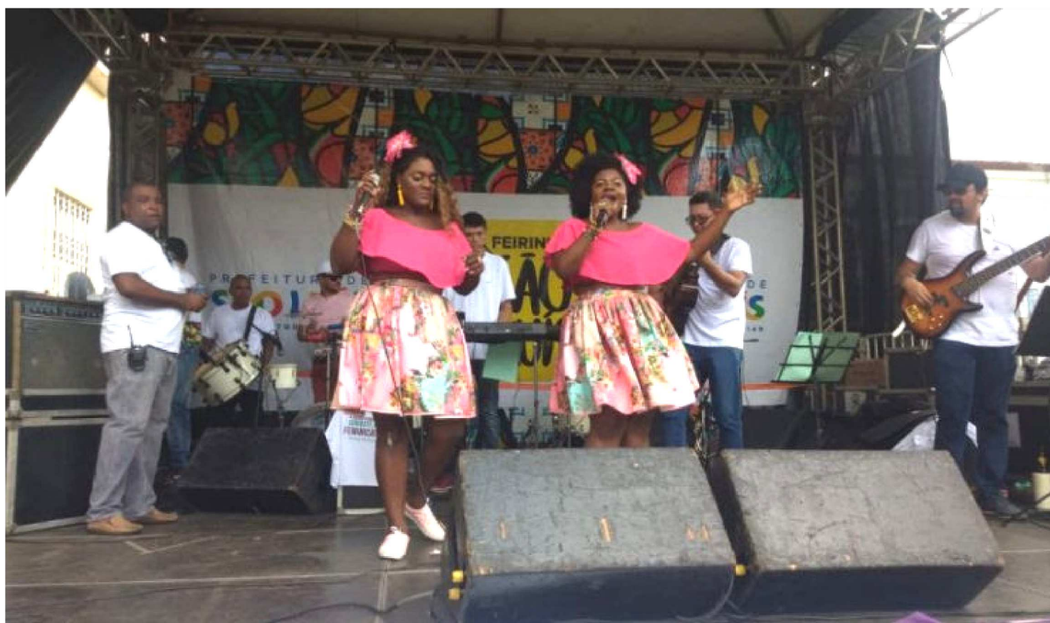
FEIRINHA SÃO LUÍS CELEBRA DIA DA CONSCIÊNCIA NEGRA COM ATRAÇÕES QUE REPRESENTAM A DIVERSIDADE CULTURAL DA CIDADE