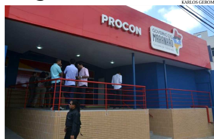
NOTA FISCAL GARANTE TROCA DE PRODUTOS SEM CPF

Diversos estabelecimentos comerciais exigem o CPF na hora da compra sob os mais diversos argumentos. Entretanto, o Instituto de Promoção e Defesa do Cidadão e Consumidor do Maranhão (Procon/MA) esclarece que os consumidores não são obrigados a informar o CPF para a emissão da nota fiscal, já que a exigência desse documento para realizar compras é considerada prática abusiva, de acordo com o artigo 39 do Código de Defesa do Consumidor (CDC).