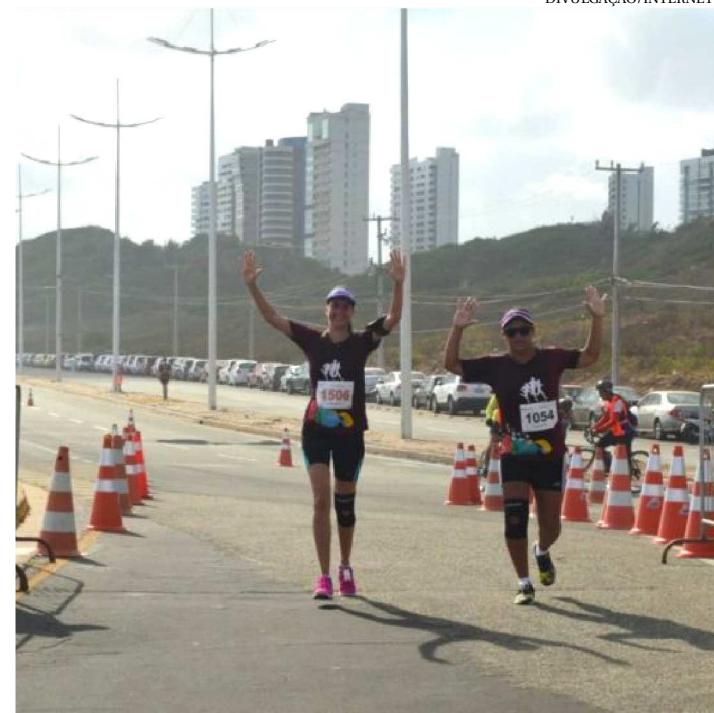
LARGADA DA CORRIDA ACONTECE NA PRAÇA DOS PESCADORES

Trocar o terno e sapato social por uniforme e tênis. Por algumas horas, a concentração de Procuradores do Estado e servidores não será em documentos, mas na pista, quando for dada a largada para a Corrida PGE 50 Anos.