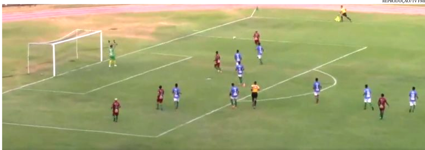
SÃO JOSÉ VENCEU O PINHEIRO POR 2 X 1, NA ÚLTIMA QUARTA-FEIRA, NO ESTÁDIO CASTELÃO, EM JOGO VÁLIDO PELA 3ª RODADA