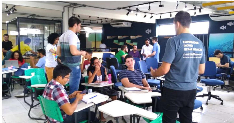
EMPREENDEDORES PARTICIPAM DE OFICINA DO PROJETO ‘STARTUPS SÃO LUÍS’

O caso mostra que as startups estão crescendo gradativamente no Maranhão, com várias histórias de iniciativas inovadoras com potencial de crescimento no ramo do empreendedorismo no mercado tecnológico. A iBuscar é uma das muitas startups que surgiram tentam se firmar no estado, buscando principalmente, espaços de apoio e desenvolvimento. A empresa foi uma das selecionadas para participar do projeto ‘Startups São Luís’, promovido pela Unidade Regional do Serviço de Apoio às Micro e Pequenas Empresas (Sebrae – MA) em São Luís, que tem como objetivo, fo-