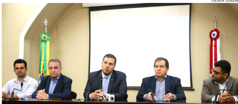
EM ENTREVISTA COLETIVA, O GOVERNO DETALHOU OS NÚMEROS DO IBGE

A variação real positiva de 5,3%, alcançou o montante de R$ 89,524 bilhões. O PIB é uma espécie de termô-