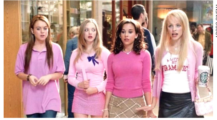
Comédias como Meninas Malvadas são boas opções

O fim de semana prolongado traz uma grande opção para quem não quer sair de casa, e por isso, listamos uma série de filmes para aproveitar. PÁGINA 6