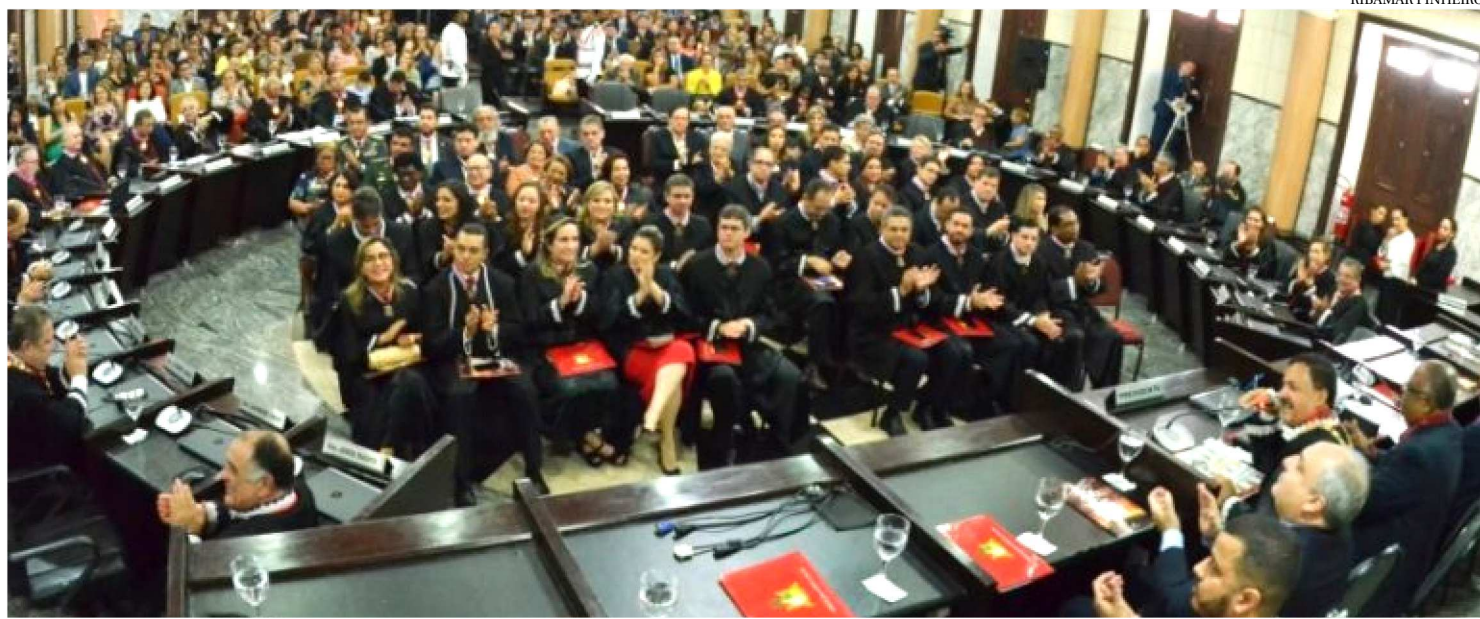
FORAM AGRACIADOS COM MEDALHAS MAGISTRADOS, ADVOGADOS, PROCURADORES, E PERSONALIDADES DE DIVERSOS SEGMENTOS

Em solenidade comemorativa pelos 206 anos da Corte estadual de Justiça, o Poder Judiciário do Maranhão concedeu, nesta quinta-feira (14), a “Medalha dos Bons Serviços Desembargador Bento Moreira Lima”; a “Medalha do Mérito Judiciário Antônio Rodrigues Vellozo” e a “Medalha Especial do Mérito Cândido Mendes” a personalidades que se destacam pelos relevantes serviços prestados à Justiça e à cidadania. As medalhas foram entregues pelos desembargadores da Corte estadual.