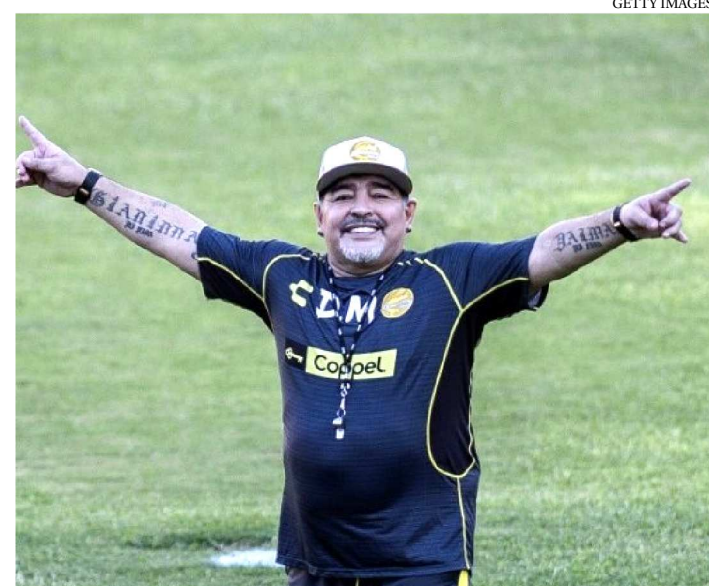
MARADONA DIRIGIU O DORADOS DO MÉXICO EM 2018 E 2019

O maior ídolo da história do futebol argentino ganhou um documentário na Netflix. Maradona no México, nova série da plataforma, mostra a trajetória de Diego como treinador do Dorados de Sinaloa, clube da segunda divisão mexicana com sede em Culiacán, cidade conhecida por ser centro de operações de um cartel de drogas.