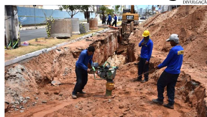
OBRAS DE AMPLIAÇÃO E IMPLANTAÇÃO DE REDE DE COLETA

A Companhia de Saneamento Ambiental do Maranhão (Caema) retomou as obras de ampliação e implantação de rede de coleta e tratamento de esgotos na Península da Ponta d'Areia, em São Luís.