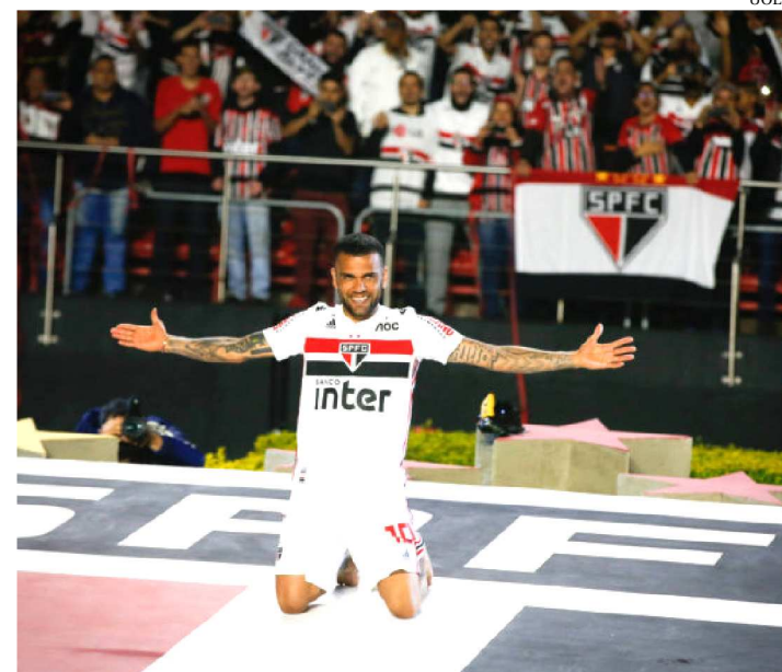
DANIEL ALVES ESTÁ À DISPOSIÇÃO DO TÉCNICO TRICOLOR

Santos e São Paulo fazem o clássico estadual do fim de semana pelo Brasileiro 2019 – e o Peixe, próximo de se garantir na fase de grupos da próxima Libertadores, pode deixar seu rival ainda mais distante de alcançar esse objetivo. Graças ao péssimo momento vivido pelo Tricolor contra o Alvinegro da Baixada, o time paulista entrou em crise com a torcida. O clássico pode mudar isso hoje, às 17h, na Vila Belmiro.