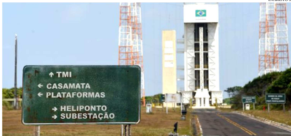
ESTADOS UNIDOS FIRMARAM ACORDO PARA USO DA BASE DE LANÇAMENTO