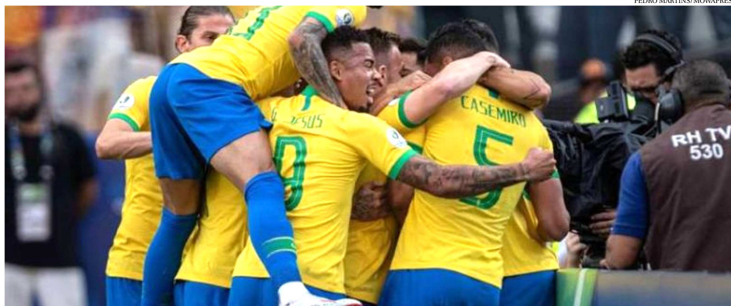
A SÉRIE DOCUMENTAL 'TUDO OU NADA: SELEÇÃO BRASILEIRA' MOSTRARÁ OS BASTIDORES DA SELEÇÃO DURANTE A COPA AMÉRICA

No Brasil há mais de três anos com o Prime Vídeo, o serviço de streaming Amazon entrará de vez no mercado brasileiro, agora com produções nacionais originais. A plataforma anunciou, ontem, seis séries brasileiras já confirmadas no serviço.