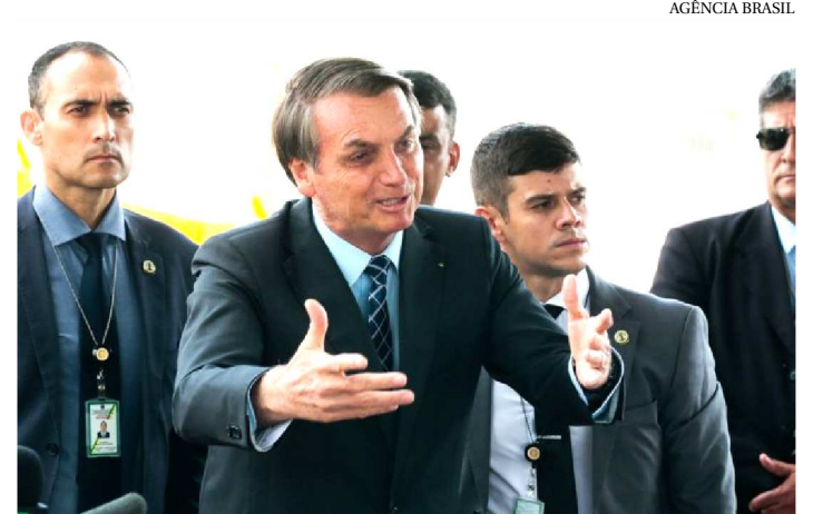
ACORDO DEVE SER SACRAMENTADO HOJE NA CÚPULA

O governo brasileiro está próximo de fechar um acordo automotivo com o Paraguai, que permitirá a eliminação de tarifas sobre peças e automóveis comercializados entre os dois países. O anúncio pode ser feito durante a 55ª Cúpula de Chefes de Estado do Mercosul, que será realizada hoje, em Bento Gonçalves (RS). A informação foi confirmada pelo presidente Jair Bolsonaro.