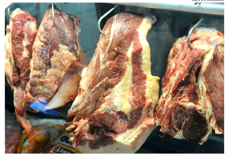
ALTA DO PREÇO DA CARNE É TEMPORÁRIA PARA O CNA

A Confederação da Agricultura e Pecuária do Brasil (CNA) afirmou que o Brasil não vai passar por uma escassez de carne, em decorrência do aumento das exportações para a China. De acordo com a instituição, o aumento dos preços “é um ponto fora da curva” e a tendência é que o valor da carne reduza nos próximos meses.