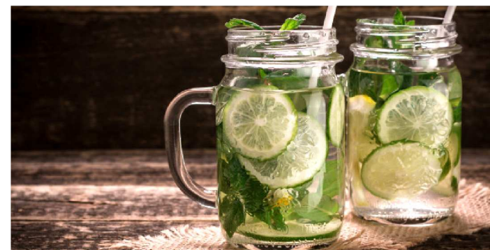
ÁGUA SABORIZADA NÃO PODE SUBSTITUIR A ÁGUA NORMAL

Você provavelmente já deve estar cansada de saber que beber água é muito importante para o funcionamento do nosso corpo. Afinal, ela melhora a aparência da pele, regula a temperatura corporal, faz o transporte das vitaminas e sais minerais pelo sangue... E até pode dar mais saciedade! Os principais órgãos e pesquisas na área da saúde recomendam que você tome cerca de 30 a 35 ml para cada quilo que tiver. Uma pessoa de 70 kg, por exemplo, deve ingerir de 2,1 L até 2,45 L por dia.