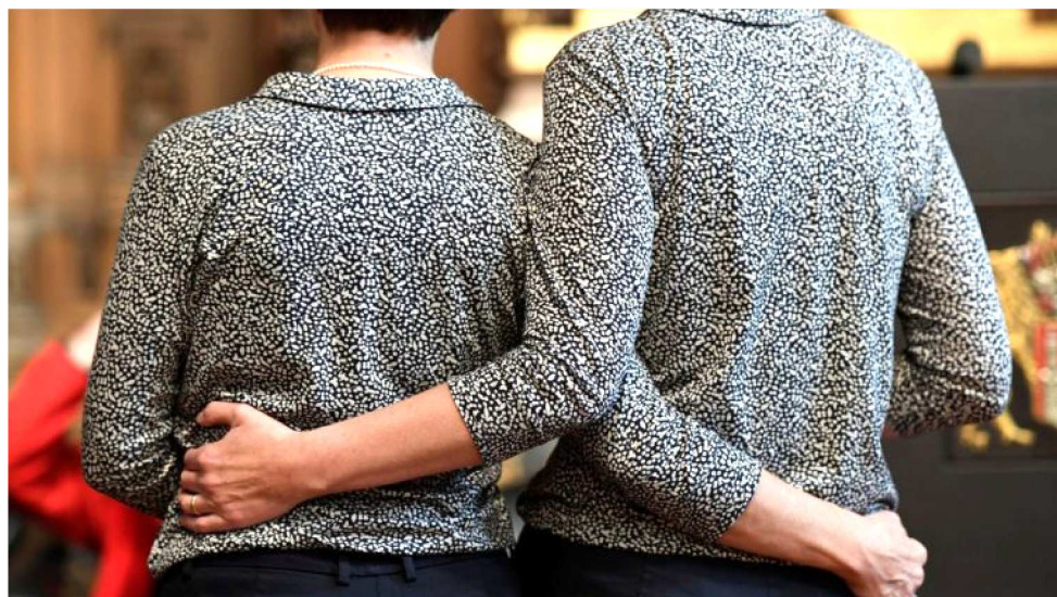
CASAMENTOS ENTRE HOMENS SUBIRAM DE 2,5 MIL PARA 3.958, UM AUMENTO DE 58,3%