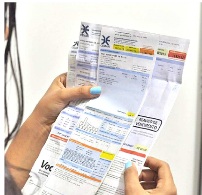
PREVISÃO DE CHUVAS FOI FATOR PARA BANDEIRA AMARELA

As contas de energia vão ficar mais baratas em dezembro. A Agência Nacional de Energia Elétrica (Aneel) anunciou no primeiro dia do mês, que a bandeira tarifária será amarela em dezembro. A bandeira amarela representa um custo extra de R$ 1,343 para cada 100 quilowatts-hora consumidos (kWh) contra os R$ 4,169 por kWh cobrados quando a bandeira tarifária é vermelha patamar 1.