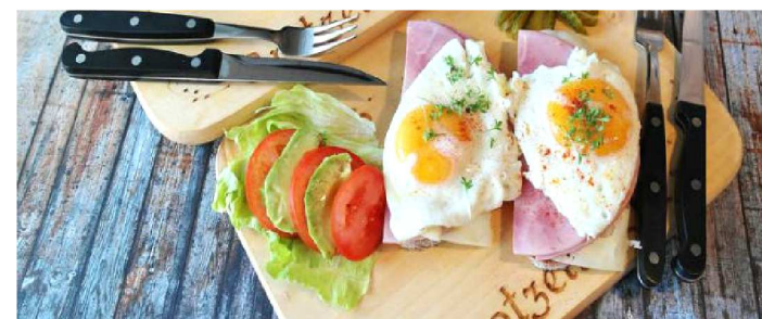
PROTEÍNAS SÃO IMPORTANTES PARA A DIETA DIÁRIA

Quem busca manter uma alimentação saudável já está cansada de saber da importância de tentar equilibrar o consumo diário de carboidratos, proteínas e gorduras. Esses são os principais macronutrientes que garantem a nutrição do nosso corpo e dão o gás que a gente precisa para enfrentar o dia – e até aquela aula de HIIT na academia. O problema é que os hábitos de consumo hoje em dia prezam muito o carboidrato: pãozinho no café da manhã, macarrão no almoço, risoto no jantar... Quem nunca se pegou enchendo o cardápio de alimentos desse tipo e resolveu mudar isso?