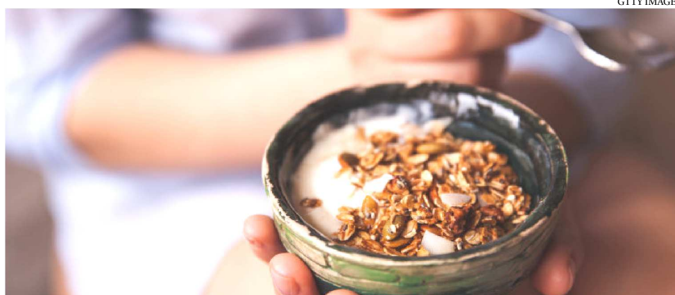
TANTO IOGURTE QUANTO GRANOLAS POSSUEM UMA QUANTIDADE GRANDE DE AÇÚCAR

Por isso, a nutróloga recomenda que você preste muita atenção na tabela nutricional da marca que for escolher. Se ele tiver mais que o recomendado, vale ser trocado por um