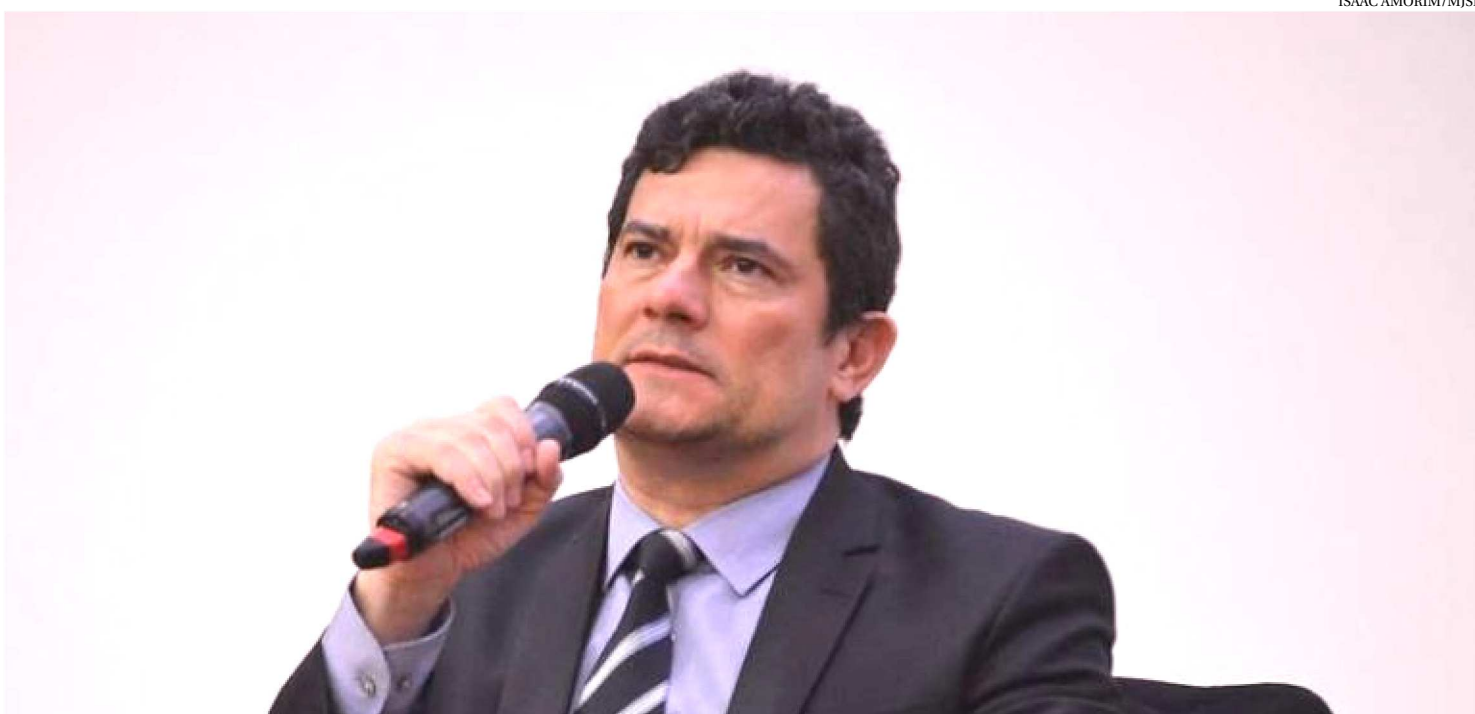
O MINISTRO DISSE RESPEITAR O ENTENDIMENTO DO STF, SOBRE BARRAR PRISÃO APÓS CONDENÇÃO EM 2ª INSTÂNCIA

O ministro da Justiça e Segurança Pública, Sergio Moro, voltou a defender a prisão após condenação em segunda instância ontem, durante audiência pública sobre o assunto na Comissão de Constituição e Justiça (CCJ) do Senado. Segundo ele, a liberdade de condenados “gera sensação de injustiça, impunidade, abandono e insegurança”.