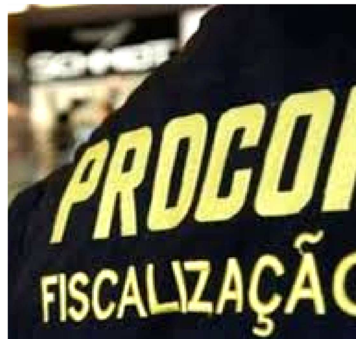
EMPRESAS PRECISAM ATENTAR PARA VÁRIAS EXIGÊNCIAS

O Instituto de Promoção e Defesa do Cidadão e Consumidor do Maranhão (Procon/MA) iniciou, nesta semana, as notificações das produtoras de eventos que irão promover festas de Réveillon, em São Luís. O objetivo é verificar se as empresas estão cumprindo a legislação vigente para a realização das festas.