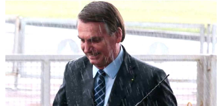
PRESIDENTE NÃO CONFIRMOU AINDA SE SERÁ CANDIDATO

O presidente Jair Bolsonaro disse ontem, a apoiadores em frente ao Palácio da Alvorada que “está cheio de traíras” o partido que “deixou para trás”. Bolsonaro se desfilou recentemente do PSL, legenda pela qual se elegeu presidente, e tenta agora tirar do papel o Aliança Pelo Brasil, partido conservador com forte presença da família Bolsonaro no comando.