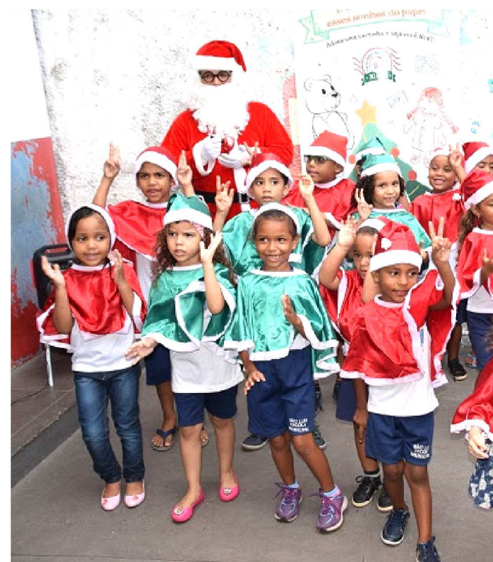
PAPAI NOEL ENTREGOU PRESENTES PARA 90 CRIANÇAS

Os estudantes da Unidade de Educação Básica Antonio Lopes, no Centro de São Luís, receberam na tarde desta terça-feira, 10, os presentes doados por membros e servidores do Ministério Público do Maranhão durante a campanha Papai Noel dos Correios. O MPMA participa da campanha, que em 2019 completa 30 anos, desde 2011.