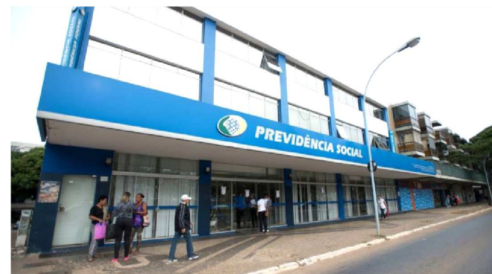
PREVIDÊNCIA SOCIAL CANCELARÁ PAGAMENTOS IRREGULARES