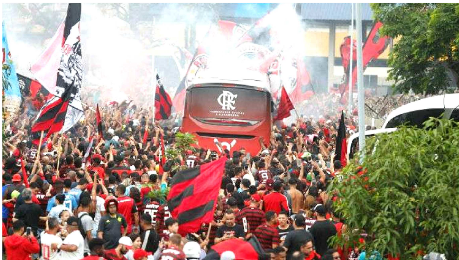
DIRETORIA QUER EVITAR A REPETIÇÃO DA CONFUSÃO OCORRIDA QUANDO O CLUBE RUBRO-NEGRO FOI PARA A LIMA, NA LIBERTADORES

O Flamengo embarca nesta sexta-feira para o Catar para a disputa do Mundial de Clubes da Fifa e entre os órgãos de segurança do Rio de Janeiro há uma preocupação: evitar a repetição da confusão ocorrida quando o clube rubro-negro foi para a Lima, no Peru, onde fez a final da Copa Libertadores contra o River Plate, da Argentina.