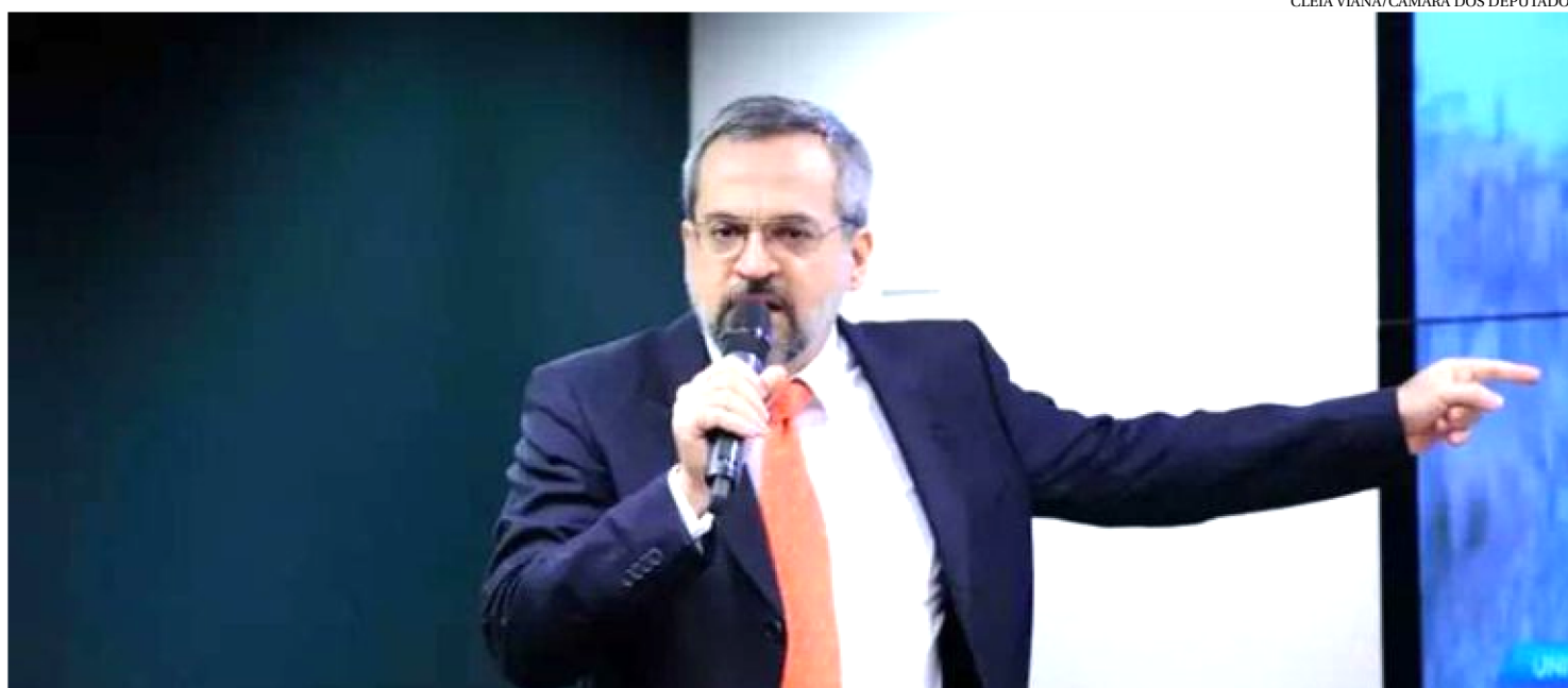
WEINTRAUB DISSE QUE POLÍCIA MILITAR PRECISA PODER ENTRAR NO CAMPUS DESSAS INSTITUIÇÕES PARA INTERROMPER SITUAÇÕES

O ministro da Educação, Abraham Weintraub, voltou a afirmar que há plantações de maconha dentro das universidades federais ontem durante a sua apresentação na Comissão de Educação da Câmara dos Deputados. O ministro foi convocado para dar explicações sobre declaração dada à imprensa de que nas universidades federais há extensas plantações da droga.