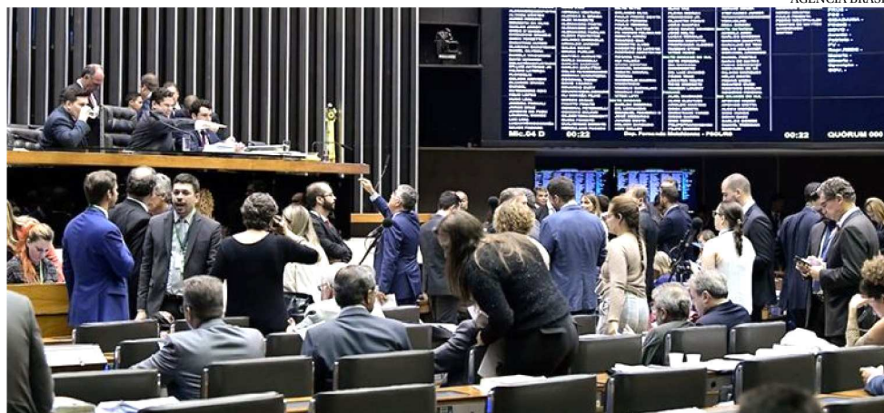
FORAM APROVADOS UM PACOTE DE PROJETOS QUE ABRE CRÉDITOS PARA MINISTÉRIOS

No Ministério da Infraestrutura, a verba (R$ 15 milhões) será aplicada na adequação de trecho rodoviário Teresina-Parnaíba na BR-343, no Piauí. Para o Ministério do Desenvolvimento