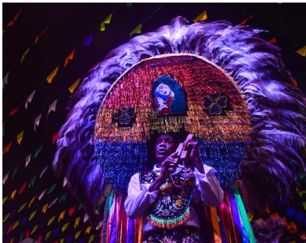
TÍTULO FOI CONCEDIDO DURANTE REUNIÃO DA UNESCO, EM BOGOTÁ, NA COLÔMBIA

Cinco sotaques diferentes marcam o ritmo da brincadeira maranhense: sotaque de matraca, sotaque de orquestra, sotaque da baixada, sotaque de zabumba, sotaque costa de mão. Em nota, a Unesco destacou a riqueza presente na manifestação do bumba meu boi no Maranhão: A prática está fortemente carregada de simbolismo: ao reproduzir o ciclo de nascimento, vida e morte, oferece uma metáfora para a própria existência humana. Existem formas de expressão semelhantes em outros estados brasileiros, mas no Maranhão o Bumba-meu-boi se distingue pelos vários estilos e gru-