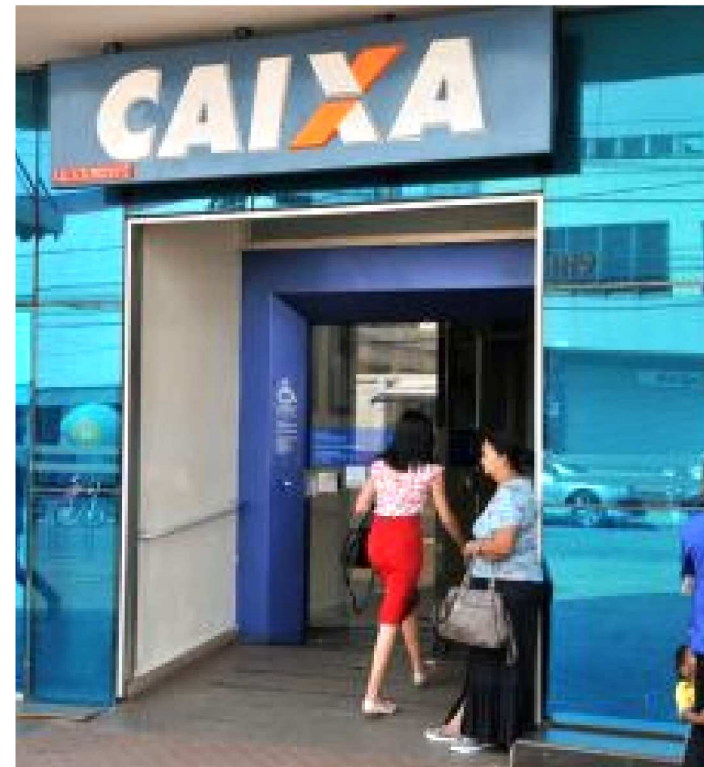
PRAZO FINAL PARA O SAQUE SERÁ O DIA 30 DE JUNHO DE 2020

A Caixa inicia, nesta quinta-feira (12), o pagamento do Abono Salarial (Programa de Integração Social – PIS) calendário 2019/2020, para os trabalhadores nascidos no mês de dezembro. Os valores variam de R$ 84 a R$ 998, de acordo com a quantidade de dias trabalhados durante o ano base 2018.