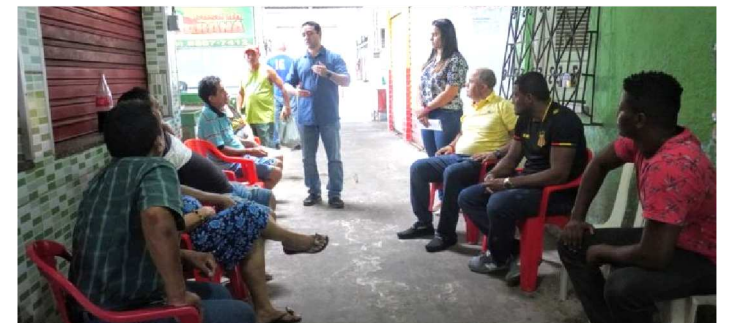
TÉCNICOS TRATAM SOBRE A REFORMA DO MERCADO

As obras de reforma do mercado do Bairro de Fátima iniciam hoje. A informação foi dada aos feirantes pelos técnicos da Secretaria das Cidades e Desenvolvimento Urbano (Secid) em reunião nesta sexta-feira (13). O objetivo do encontro foi discutir sobre a intervenção no equipamento público e a logística que será montada pela construtora para atender as demandas e necessidades de todos.