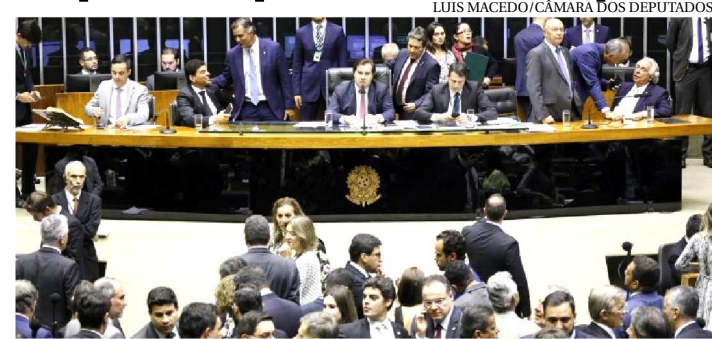
DEPUTADOS PODERÃO PROSEGUIR ANÁLISE DO NOVO MARCO

O Plenário da Câmara dos Deputados pode votar hoje a proposta que aumenta o repasse da União às cidades por meio do Fundo de Participação dos Municípios (FPM). Trata-se da Proposta de Emenda à Constituição (PEC) 391/17, do Senado, que aumenta em 1 ponto percentual os repasses de certos tributos da União para os municípios.