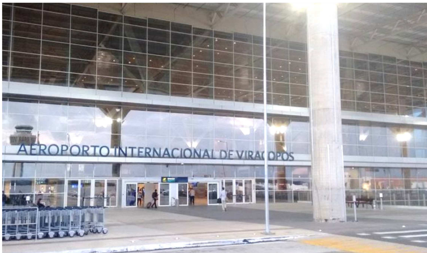
O MINISTRO COMENTOU SOBRE CONCESSÕES QUE ENFRENTAM PROBLEMAS COMO A DO AEROPORTO DE VIRACOPOS, EM CAMPINAS

O ministro comentou sobre concessões que enfrentam problemas, como a do aeroporto de Viracopos, em Campinas (SP), cujo processo de caducidade da concessão foi aberto pela Agência Nacional de Aviação Civil (Anac). “Eu acho que a gente está mais perto da solução [...] me parece que agora eles já estão sinalizando para a devolução”, disse.