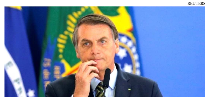
BOLSONARO DEVE FAZER UMA MINIRREFORMA PARA O ANO

O presidente Jair Bolsonaro quer iniciar 2020 com um mapa definido da reestruturação no primeiro escalão de seu governo para ser anunciado até fevereiro.