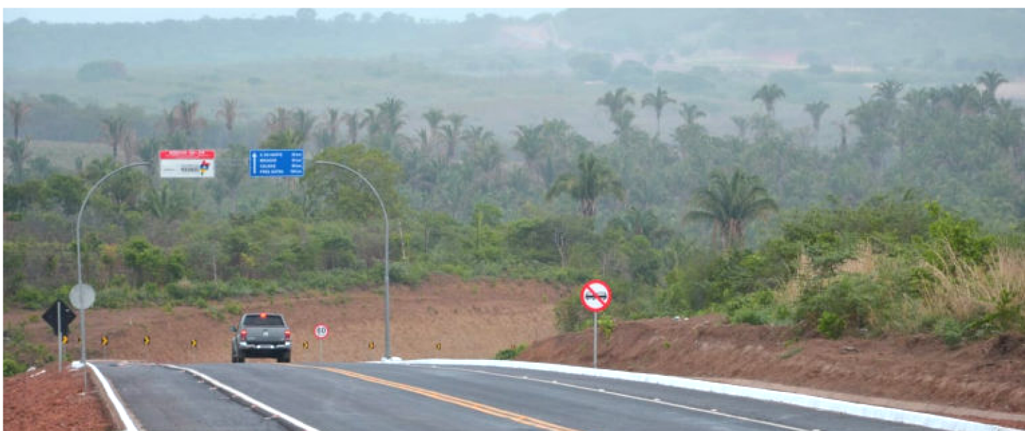
MA-270 GARANTE ROTA RÁPIDA E COM SEGURANÇA PARA OS MORADORES DO SUL DO MARANHÃO

Um acesso rápido, seguro e totalmente sinalizado. Esse foi o resultado da obra de pavimentação completa da MA-270, rodovia que interliga os municípios de Sucupira do Norte e Pastos Bons, na região Sul do Maranhão.