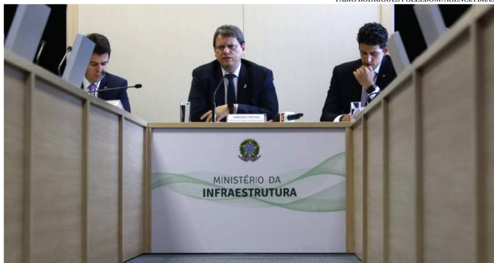
O MINISTRO DA INFRAESTRUTURA, TARCÍSIO GOMES DE FREITAS, FALOU DE LEILÕES

O ministro disse que a relicitação da Nova Dutra será o grande destaque