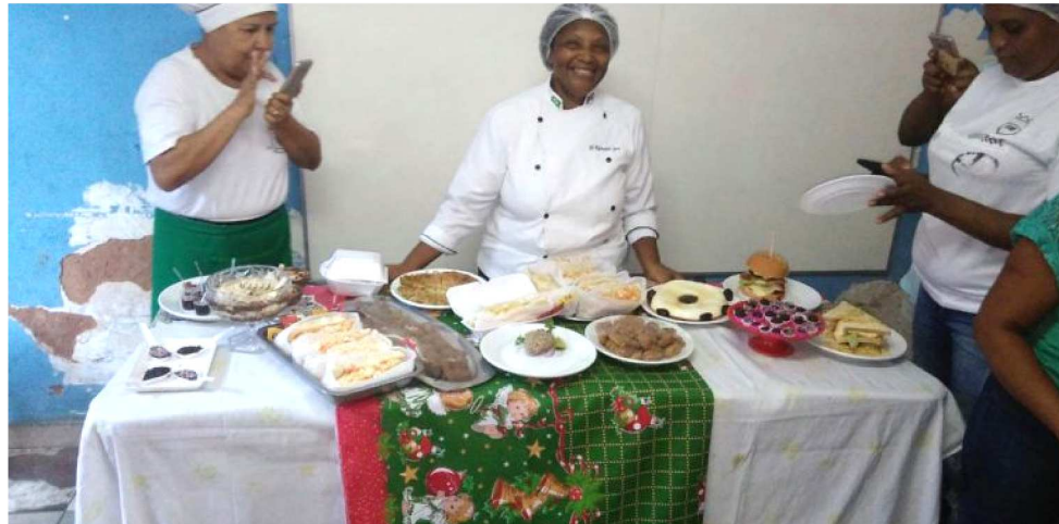
CERCA DE 20 HOMENS E MULHERES PARTICIPAM DA AÇÃO EMPREENDEDORA

“A nossa prioridade é trazer mulheres carentes que não sabem fazer nada e chama-las para aprender a cozinhar e usar isso como fonte de renda.