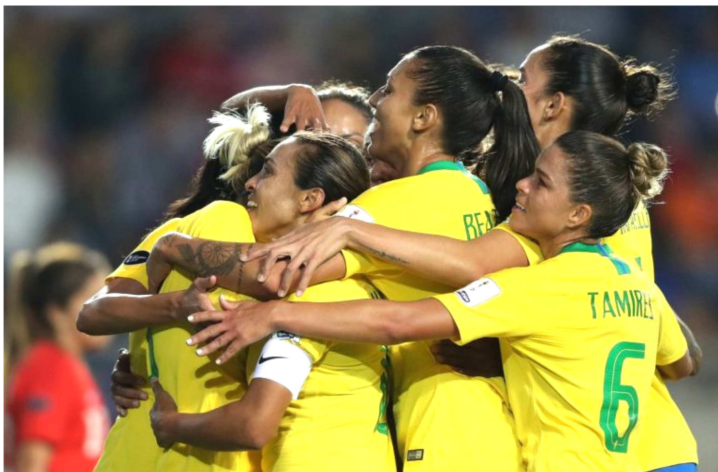
DOS NOVE PAÍSES QUE DEMONSTRARAM INTERESSE NO INÍCIO DO PROCESSO, APENAS QUATRO SEGUEM NA DISPUTA PELA ESCOLHA

A Confederação Brasileira de Futebol (CBF) oficializou a candidatura do Brasil para sediar a Copa do Mundo de futebol feminino em 2023. Oito cidades receberão os jogos do Mundial feminino, caso o país seja escolhido: Brasília, Manaus, Recife, Salvador, Belo Horizonte, Rio de Janeiro, São Paulo e Porto Alegre. Dos nove países que demonstraram interesse no início do processo, apenas quatro seguem na disputa. Os outros três concorrentes do Brasil na briga para receber a competição são a Colômbia, o Japão, e a candidatura conjunta de Austrália e Nova Zelândia. Todos enviaram o caderno de encargos dentro do prazo.