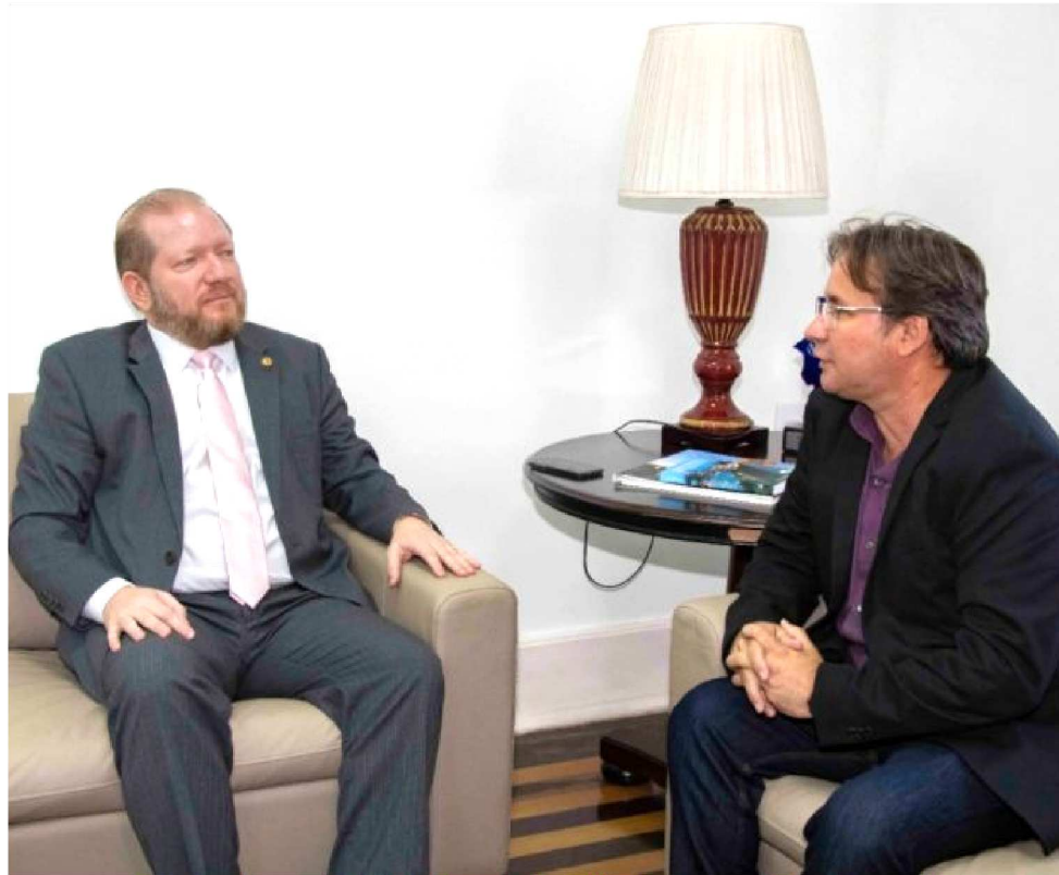
OTHELINO NETO (PCDOB), EM VISITA AO PREFEITO EM EXERCÍCIO, JULIO PINHEIRO

O presidente da Assembleia Legislativa do Maranhão (Alema), deputado Othelino Neto (PCdoB), em visita de cortesia ao prefeito em exercício de São Luís, Júlio Pinheiro, nesta quarta-feira (11), reforçou a importância da boa relação institucional entre o Legislativo Estadual e o Executivo Municipal para promover avanços na capital maranhense. Júlio Pinheiro assumiu a Prefeitura de São Luís interinamente no último sábado (7) e deve permanecer no cargo até esta sexta-feira (13), em razão de viagem do prefeito Edvaldo Holanda Júnior ao exterior.