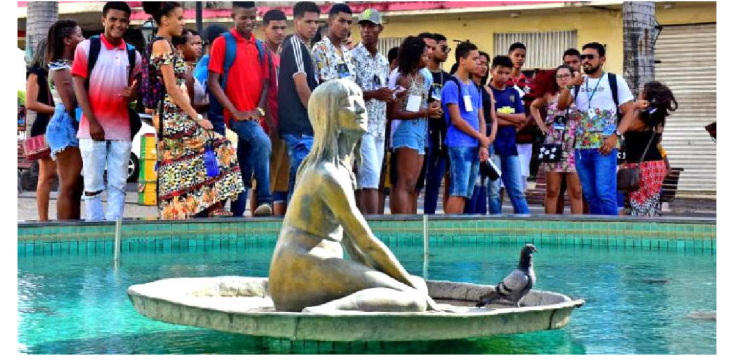
INFORMANTE ANFITRIÃO LEVA ADOLESCENTES PARA PONTOS