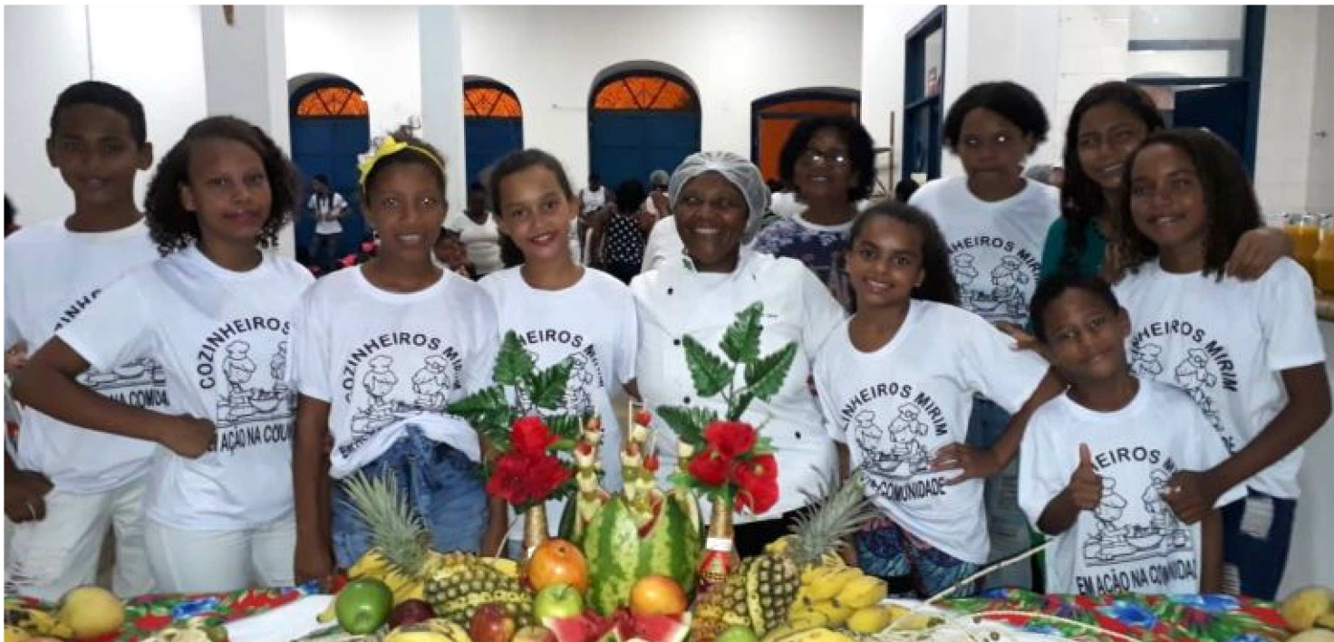
OBJETIVO É DAR EDUCAÇÃO E OPORTUNIDADE DE EMPREGO PARA QUEM NÃO TEM, USANDO A COMIDA COMO AGENTE DE INCLUSÃO

Hoje elas trabalham de forma itinerante e também fazem intercâmbio. Nessa edição elas pegaram as crianças que fizeram curso na Vila dos Frades e juntaram com as do Coroadinho para possibilitar a troca de experiências. Como resultado do curso, as crianças já apresentaram seu aprendizado em eventos na Casa do Maranhão e no Coroadinho de Natal realizado recentemente.