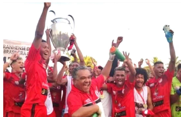
TIME DO JUVENTUDE COMEMOROU TÍTULO COM MUITA FESTA

A diretoria do Maranhão Atlético deverá se reunir nas próximas horas para fazer um balanço da participação do clube na Copa FMF e traçar planos para o Campeonato Maranhense que se aproxima. Depois da derrota para o Juventude, no último domingo, em São Mateus, ficou muito claro que o clube precisa se reforçar para evitar uma possível queda para a segunda divisão. Como só estará disputando duas competições em 2020, a intenção dos dirigentes é montar uma equipe forte e depois aguardar até o fim do ano, quando novamente estará brigando pelo título da Copa FMF, que valerá uma vaga na Série D e outra na Copa do Brasil 2021.