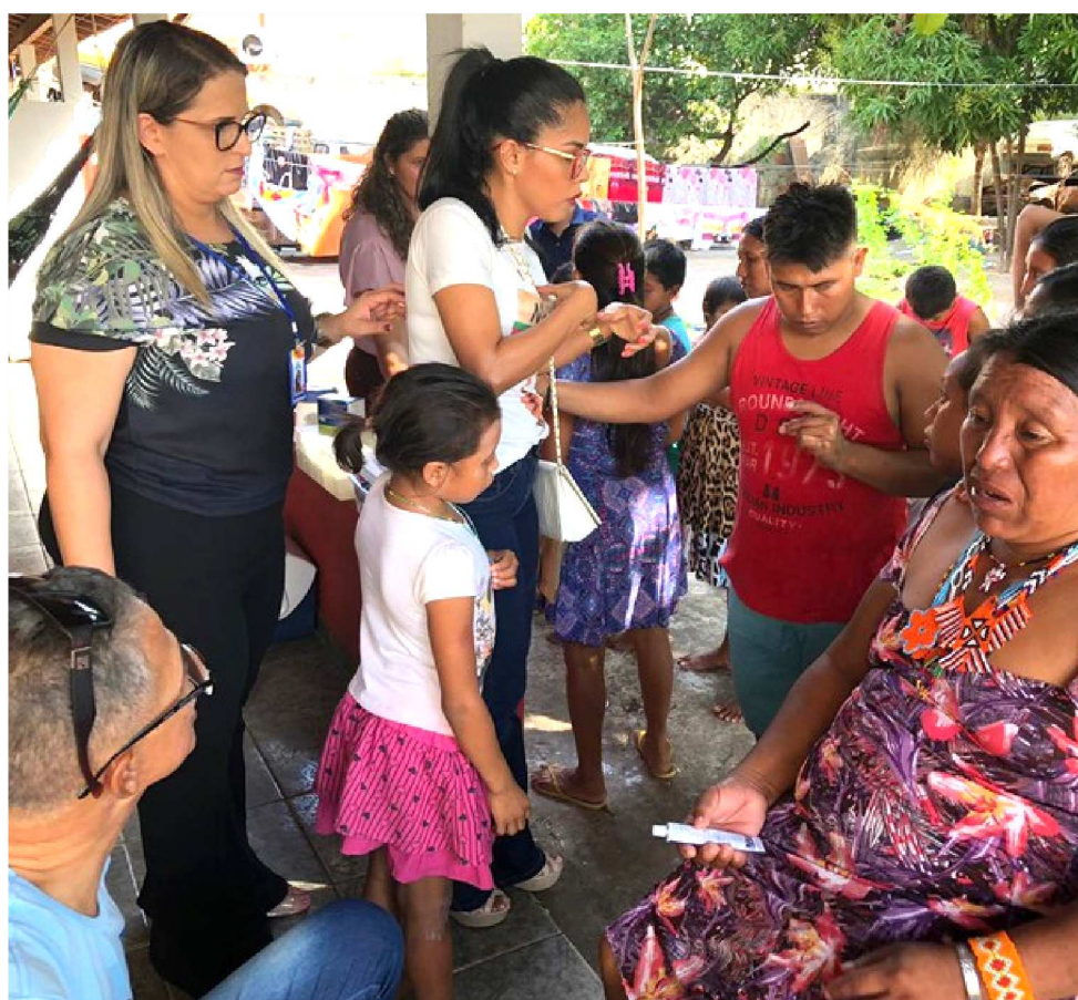
MPF DETERMINOU QUE O MUNICÍPIO DISPONIBILIZE UM ABRIGO IMEDIATAMENTE

De acordo com o Ofício nº 71/2019 emitido pela Funai ao MPF no dia 09 de dezembro, os Warao ainda estão em sua sede, vivendo de modo precário e improvisado, atualmente em 60 pessoas. O local corre risco de desabamento, possui esgoto a céu aberto e tem-se a informação de que duas crianças indígenas (um com 1 mês e o outro com 3 meses de idade) faleceram nas dependências do alojamento, provavelmente por pneumonia.