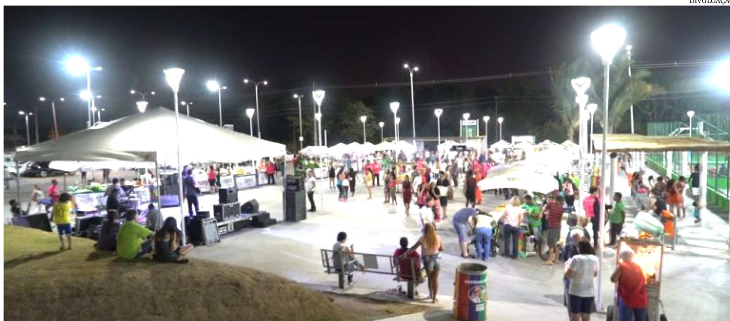
SAGRIFEIRA LEVA ALIMENTOS FRESCOS, ORGÂNICOS E SAUDÁVEIS PARA A POPULAÇÃO DO ESTADO DO MARANHÃO EM 2019

O plano de ações do Governo do Estado para potencializar e estimular a produção rural e agrícola se destaca por iniciativas com foco na garantia da autonomia, crescimento e capacitação do produtor. Para fortalecer a agricultura familiar, o Estado criou a Sagrifeira, evento onde agricultores familiares maranhenses têm a oportunidade para vender, expor e divulgar seus produtos.