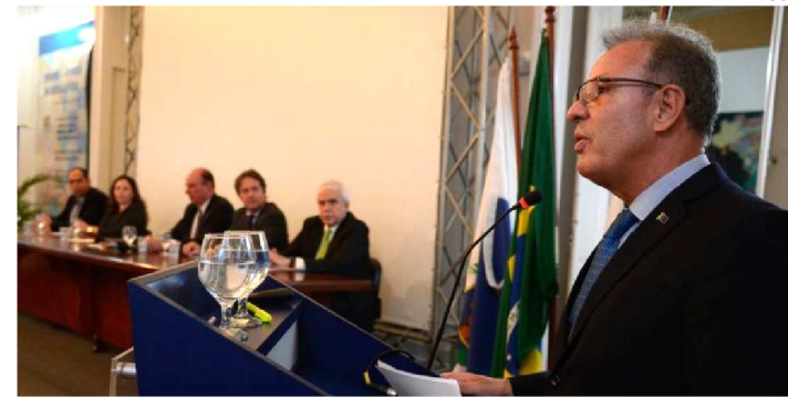
BENTO ALBUQUERQUE COMENTOU POSSIBILIDADE ONTEM

O ministro de Minas e Energia, Bento Albuquerque, afirmou, ontem (16), ao comentar a possibilidade de paralisação dos caminhoneiros, que a situação está sob controle. Ele disse que informações recebidas ao longo do fim de semana, e também nesta manhã, mostram que não há problemas de deslocamento nas estradas, nem em questões de segurança energética e no setor econômico.