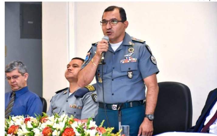
COMANDANTE GERAL DA PMMA, ISMAEL FONSÊCA

Em Timon, o projeto Capitães de Areia fortalece o projeto de vida de adolescentes em cumprimento de medida socioeducativa em meio aberto e de semiliberdade. Na sexta-feira (13), foi realizado o encerramento da primeira etapa do projeto, que reuniu todos os participantes para celebrar os resultados alcançados.