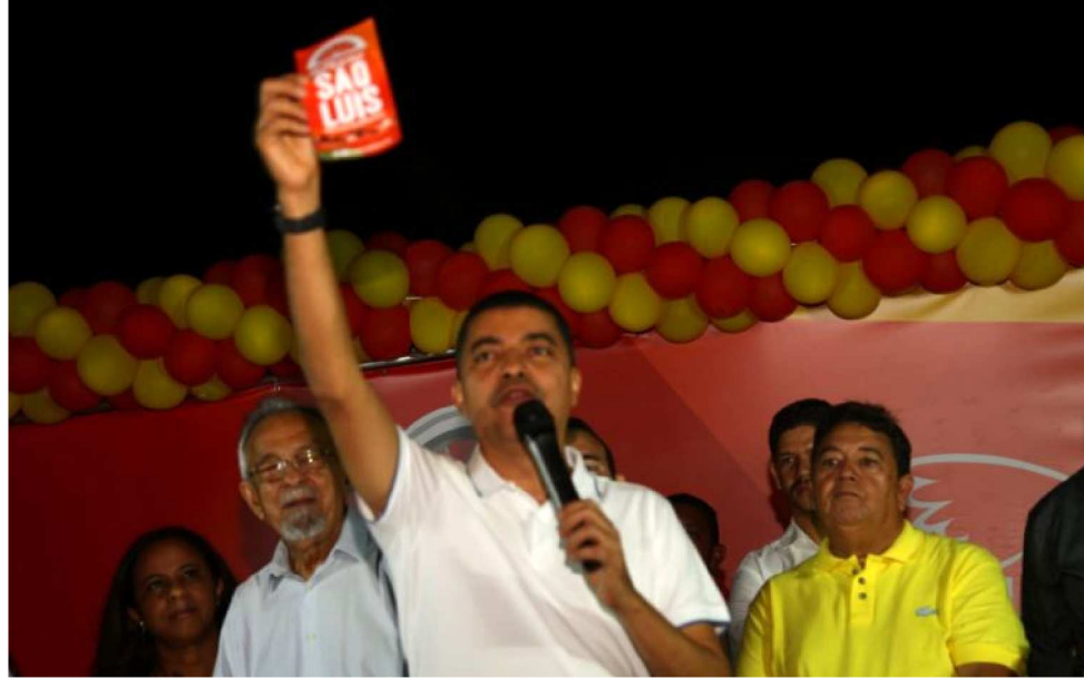
SB INAUGURA NOVA SEDE E INICIA MOVIMENTO PARA DISCUTIR SÃO LUÍS

Na oportunidade, o líder nacional do PSB, apresentou também a proposta de auto-reforma do partido, que