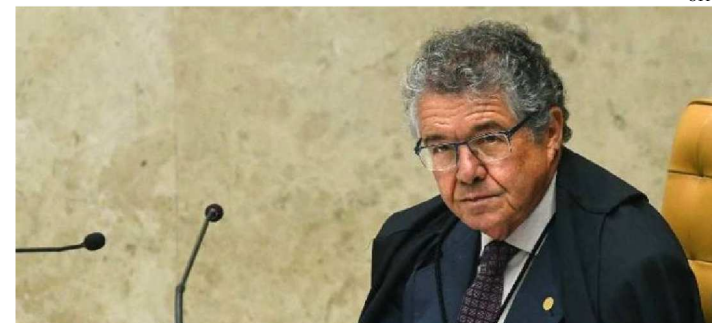
PARA MINISTRO, A LIBERDADE É CLÁUSULA PÉTREIA

O ministro Marco Aurélio Mello, do Supremo Tribunal Federal (STF), afirmou, ontem, que o Congresso Nacional não pode mudar o entendimento da Corte sobre a prisão em segundo grau de Justiça.