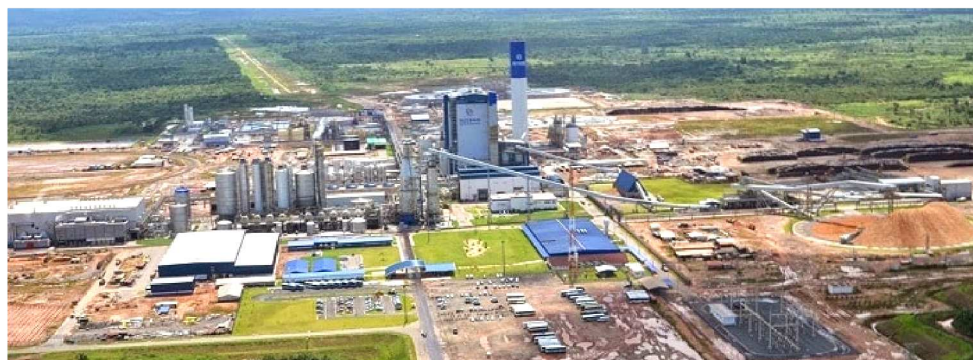
IMPERATRIZ OCUPA O SEGUNDO LUGAR DO PIB NO MARANHÃO COM 7,37%

“As políticas atualmente implementadas pelo Governo do Maranhão