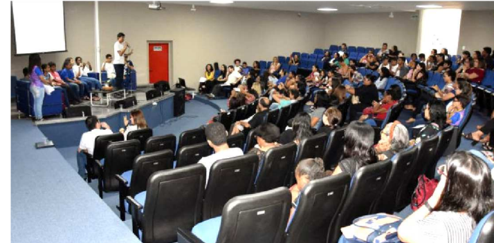
PREFEITURA DE SÃO LUÍS PROMOVE SEMINÁRIO DA EDUCAÇÃO