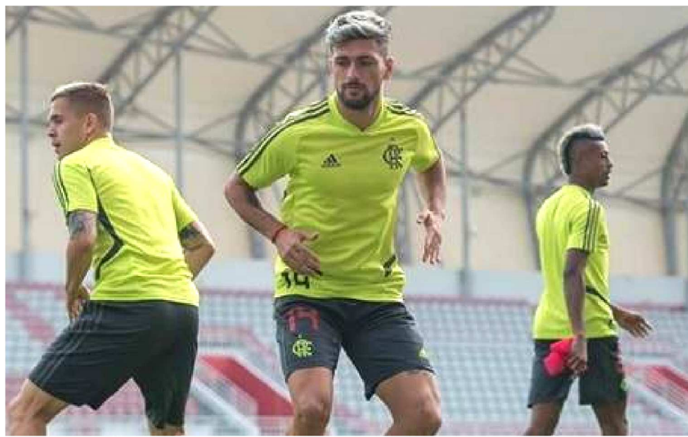
FLAMENGO ENFRENTA NO CATAR HOJE O TIME DA ARÁBIA SAUDITA AL-HILAL

O Flamengo ganhou o direito de participar da competição no Catar em novembro passado ao derrotar na fi-