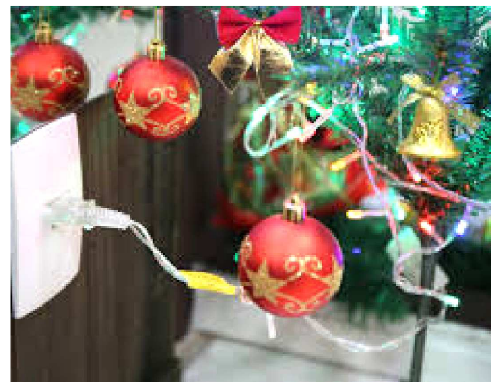
INCÊNDIOS PODEM OCORRER PELA SOBRECARGA NA REDE

O período natalino é uma das épocas em que as cidades tornam-se iluminadas, uma série de enfeites e luzes decoram as casas, comércios, indústrias e ruas em todos os cantos do mundo. Porém, junto com a beleza do Natal, os perigos também aparecem. O mais comum são os curtos-circuitos na rede elétrica, ocasionados por sobrecargas com o excesso de luzes natalinas, que geram incêndios e uma série de transtornos.