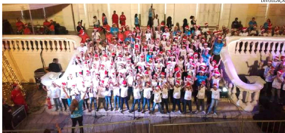
CANTATA NATALINA REALIZADA ANO PASSADO NA ESCADARIA DA IGREJA DA SÉ

A programação da cantata, organizada pela Secretaria Municipal de Educação (Semed), começa às 17h30 com o cortejo natalino pelo Complexo Deodoro com a Banda Marcial Amadeus Mozart, e prossegue às 18h30 com abertura musical com o projeto Cordas Friccionadas e a apresentação do Coral Mil Vozes de Natal na escadaria da Biblioteca Benedito Leite. O encerramento da Cantata Natalina