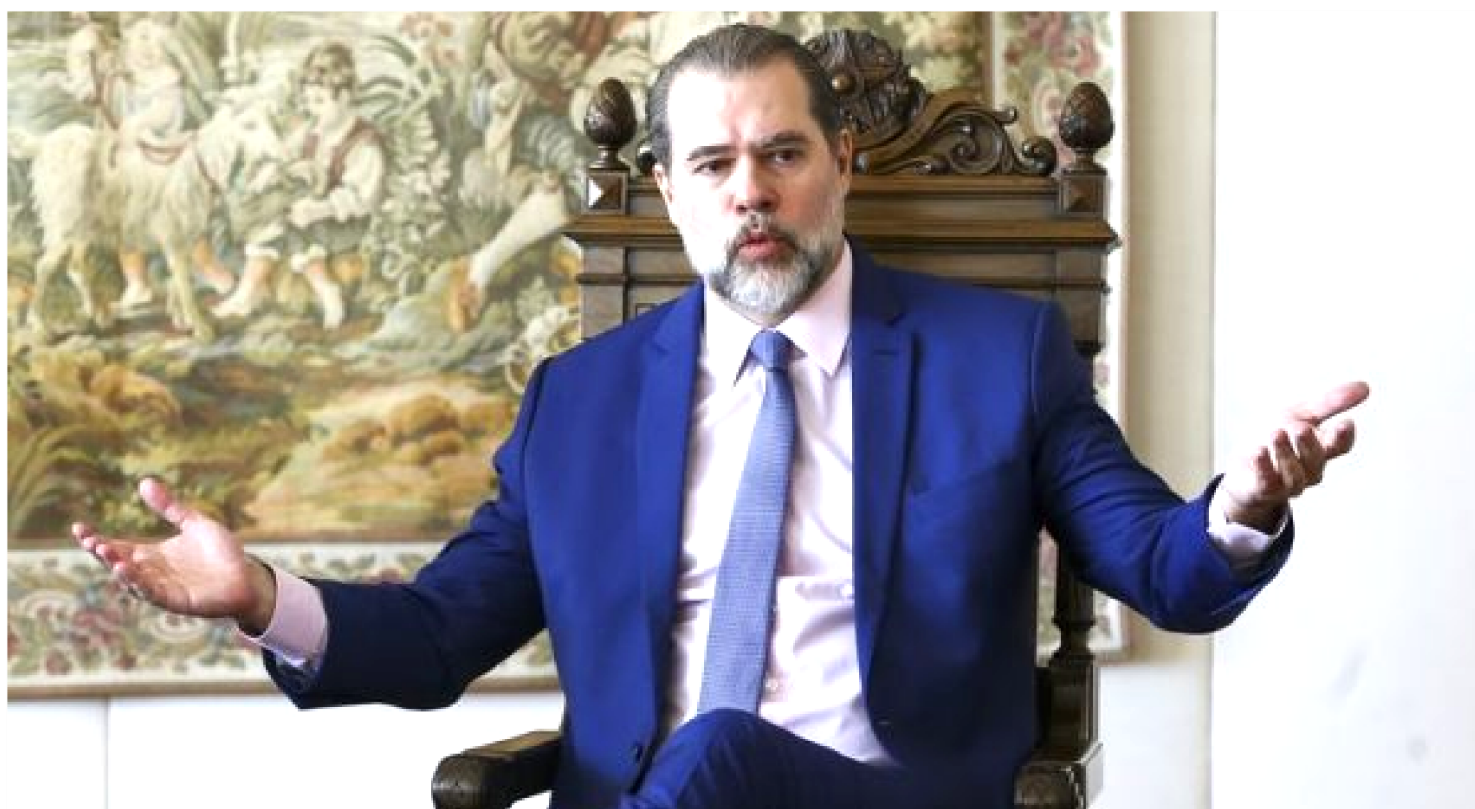
PRESIDENTE DO SUPREMO TRIBUNAL FEDERAL CRITICOU A FORMA COMO FORAM FEITAS ALGUMAS INVESTIGAÇÕES DO MP

O presidente do Supremo Tribunal Federal (STF) e do Conselho Nacional de Justiça (CNJ), ministro José Antônio Dias Toffoli que o governo do presidente Jair Bolsonaro “tem pessoas e áreas de excelência funcionando muito bem”. Não quis dizer quais são, mas reiterou: “São áreas de excelência, têm feito belíssimos trabalhos, têm tido diálogos com as instituições o tempo todo”.