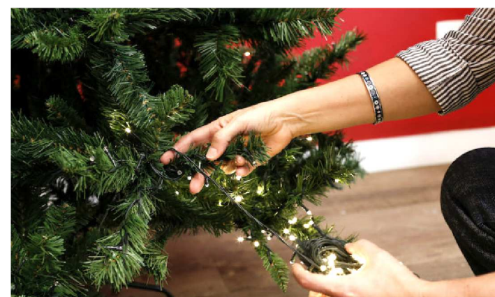
ATTITUDES SIMPLES PODEM EVITAR GRAVES PROBLEMAS

1. Qualquer item decorativo deve ter o selo de certificação do Inmetro (Instituto Nacional de Metrologia, Qualidade e Tecnologia), que atesta a qualidade e a segurança do artigo de acordo com a legislação e realidade elétrica do Brasil. Se possível, teste o produto antes de decidir pela compra e confirme a tensão – 110v ou 220v.