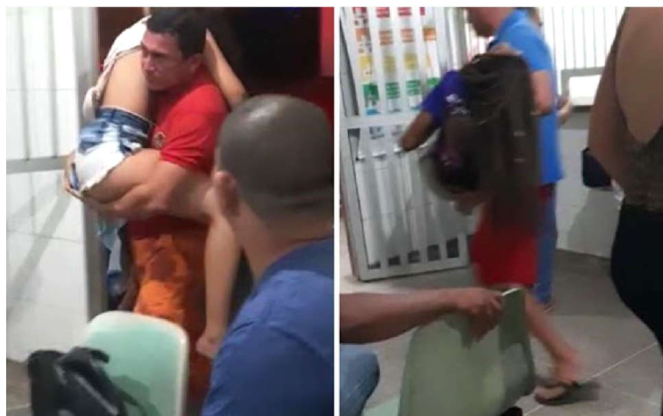
SURTO COLETIVO DURANTE GINCANA EM ESCOLA NO BAIRRO DA COHAB

Esclareceu ainda, que as equipes estiveram no local para dar suporte às vítimas e que o caso será apurado pa-