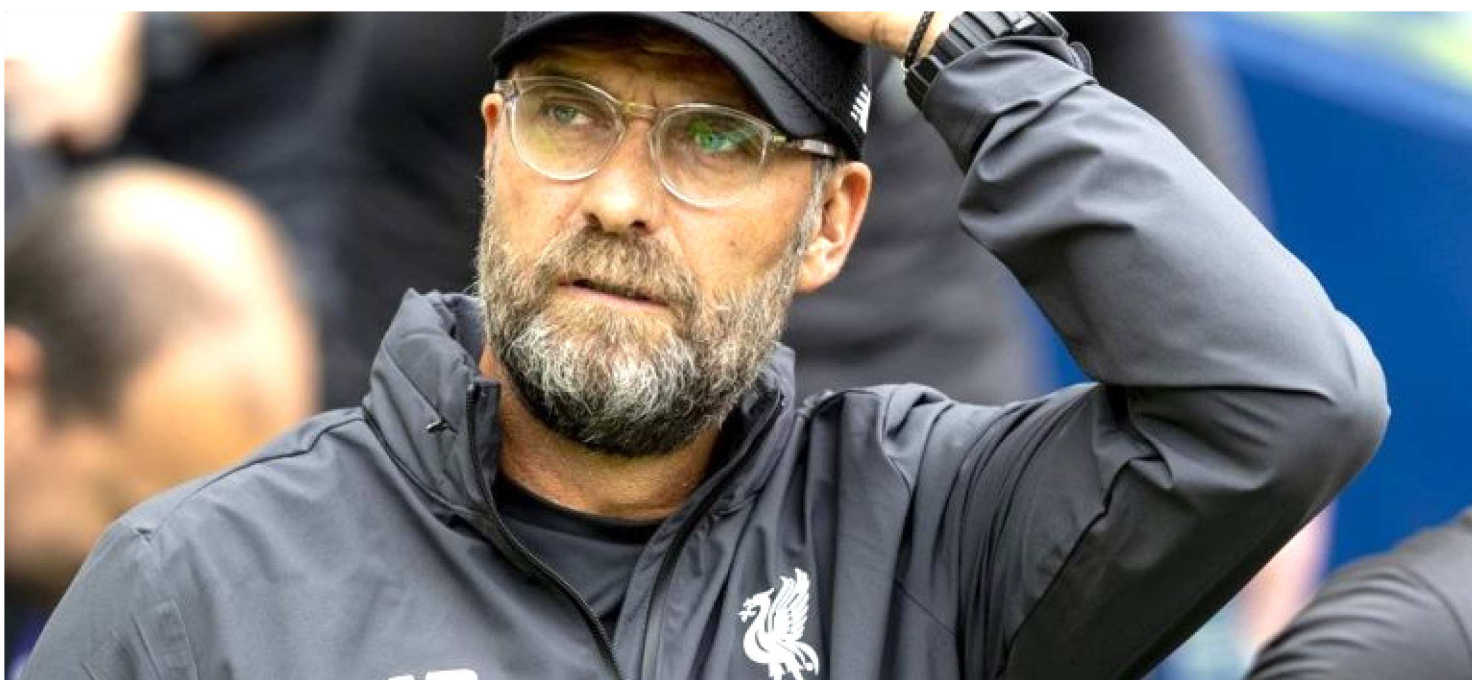
TÉCNICO KLOPP VAI TENTAR QUEBRAR UM TABU DIANTE DE CLUBES SUL AMERICANOS AMANHÃ NA DISPUTA PELO TÍTULO MUNDIAL

Neste sábado, Flamengo e Liverpool se enfrentam pela final do Mundial de Clubes. Enquanto os cariocas vão com força máxima, os ingleses sofrem com problemas físicos, que afetam a escalação ideal desde a final da Champions League. A apuração é do jornalista Paulo Vinícius Coelho, do FOX Sports.