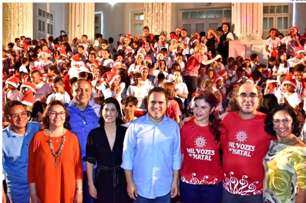
PREFEITO EDIVALDO HOLANDA JR. PRESTIGIA CANTATA MIL VOZES DE NATAL

A programação da cantata teve início com um cortejo natalino com a