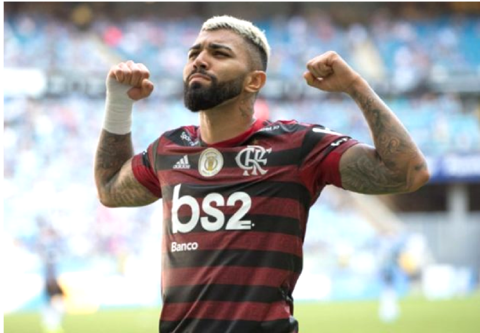
CONTRATO DE TRÊS ANOS DE GABIGOL NO FLA PODE VALER 16 MILHÕES DE EURO

Se a situação de Gabriel já está mais avançada para o lado positivo, quem pode se despedir do Flamengo é Bruno Henrique. Além dos quatro clubes da China que já apresentaram propostas, conforme apuração do L1, o jogador também despertou interesse de um grande europeu – cujo clube ainda não foi revelado por uma pessoa do estafe do camisa 27. O atacante possui multa rescisória de 30 milhões (cerca de R$ 140 milhões) e vínculo até o fim de 2021.