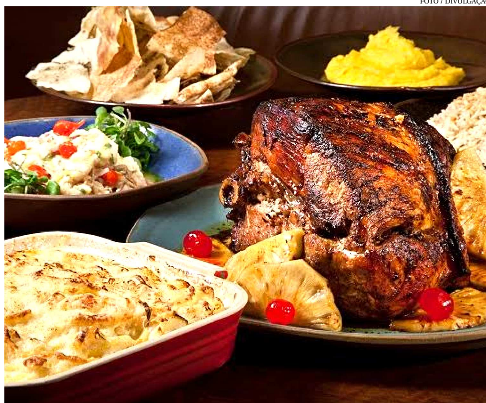
NATAL PRÁTICO COM CEIA SOB ENCOMENDA.

Um dos restaurantes mais respeitados da cidade, também funcionará com encomenda para esse período de festa. É possível adquirir o pernil sem osso, ao forno, por R$ 380 servindo até dez pessoas. O famoso Peru assado é possível encomendar por R$ 400 e serve oito pessoas. Ele é feito na manteiga de sálvia e alecrim e decorado sobre cama de farofa de miúdos. Outra opção mais em conta é o filé mig-