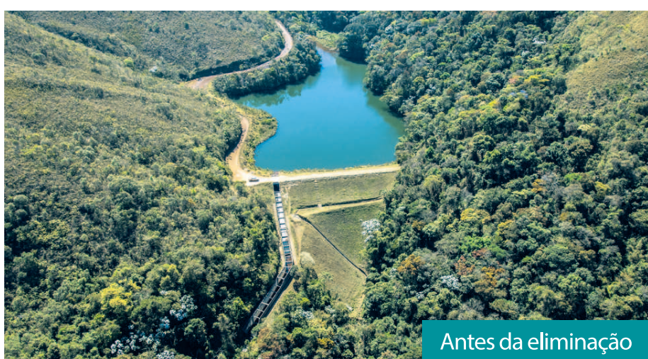
Antes da eliminação