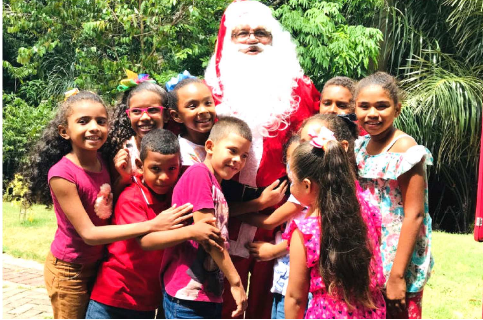
CRIANÇAS RECEBERAM O ABRAÇO E O CARINHO DO PAPAÍ NOEL NO PARQUE BOTÂNICO

as doces do projeto Gostosuras do Campo (Bacabeira) e as artesãs do projeto Casa e Aconchego (Bacabeira) ofertarão aos viajantes conhecimentos de como tornar o Natal mais gostoso e enfeitado, com um custo acessível. Essas ações promovem oportunidades de as pessoas terem uma boa experiência com a nossa empresa, o que auxilia no fortalecimento de nossa reputação.