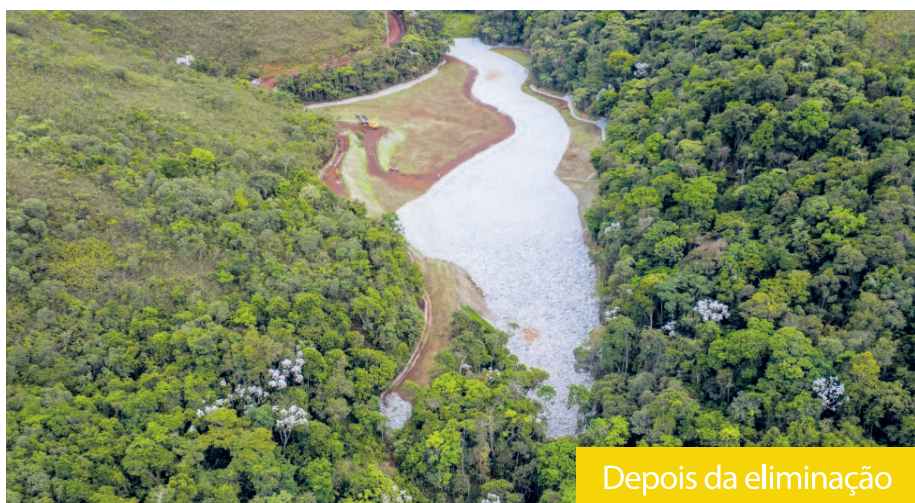
Depois da eliminação