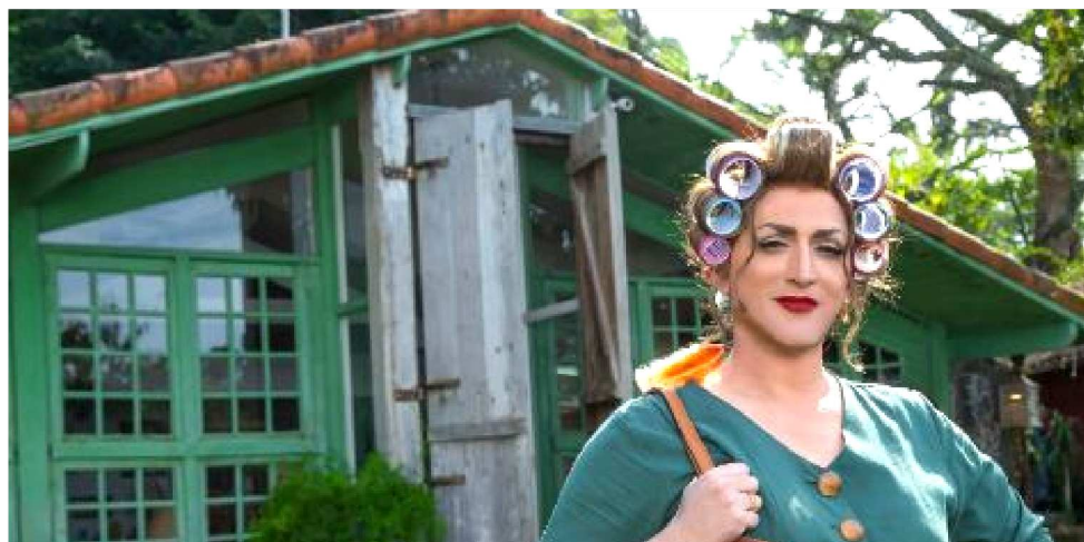
“MINHA MÃE É UMA PEÇA 3” ESTREIA NESTA QUINTA-FEIRA

Hermínia, como dito, faz rir, mas as facetas da mãe controladora, preocupada e que se acha abandonada pelos próprios filhos, cada vez mais independentes, são as mesmas de sempre, atestadas em cenas como a de Marcelina com o anúncio da gravidez ou quando Juliano avisa que vai casar