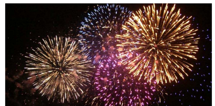
FOGOS DE ARTIFÍCIO SÃO ATRAÇÕES DE UM BOM RÉVEILLON

Atualmente, todo produtor pode contar com a facilidade da internet para divulgar os eventos e convidar as pessoas. Então, aproveite a versatilidade da ferramenta! Aqui vão algumas dicas de como você pode realizar a divulgação da festa de Réveillon: