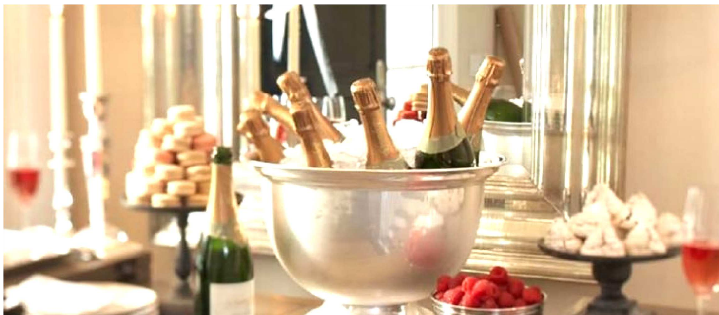
ESCOLHER BEM OS COMES E BEBES SÃO UMA DAS PARTES MAIS IMPORTANTES DA FESTA DE FIM DE ANO

Se a sua festa de Réveillon será realizada para mais de 250 pessoas, o alvará para eventos é obrigatório e deve ser providenciado para que o evento possa acontecer. Este documento serve como garantia de segurança aos participantes, além de, caso haja uma emergência, facilitar o trabalho de autoridades policiais, médicas ou dos bombeiros.