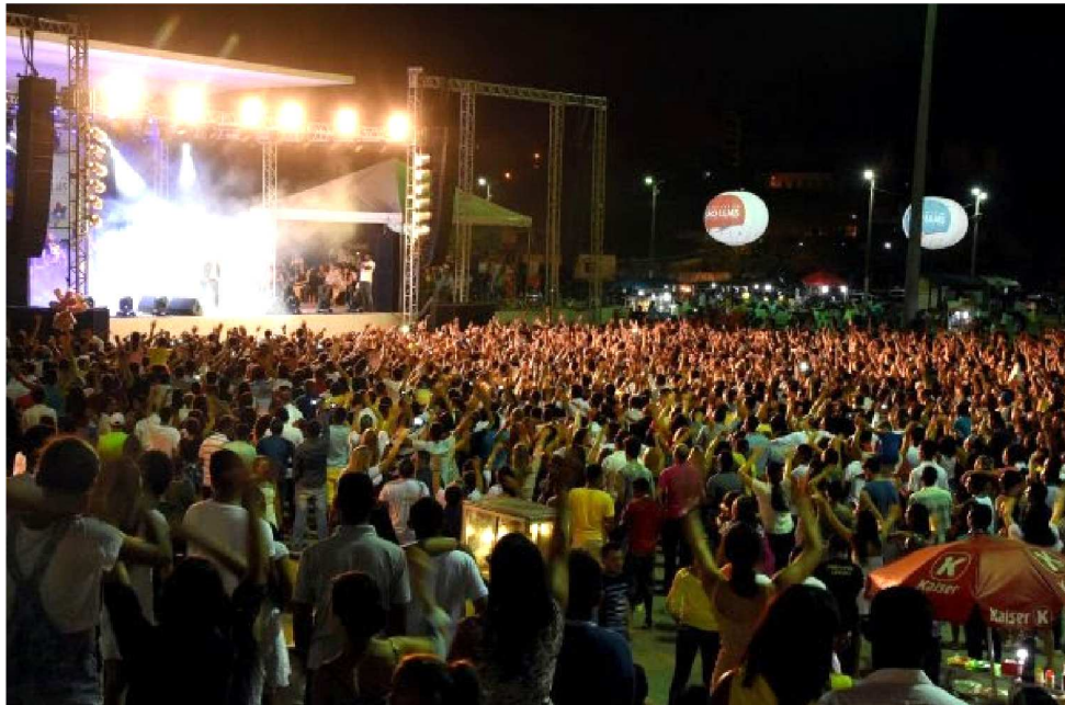
PRACA MARIA ARAGÃO SERÁ PALCO PARA O SHOW "VIRADA COM JESUS"