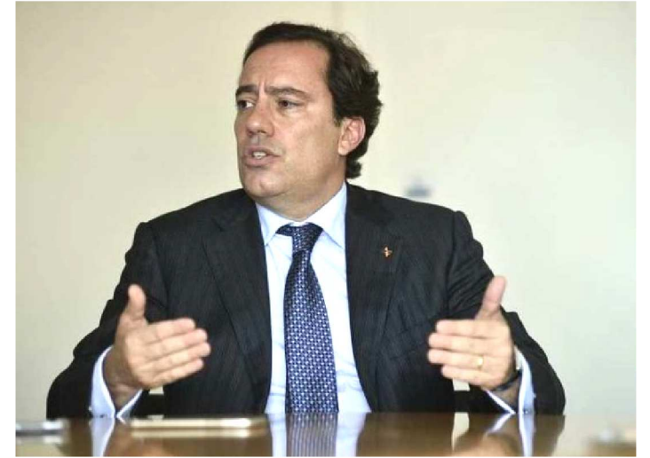
PEDRO GUIMARÃES É O PRESIDENTE DA CAIXA ECONÔMICA

A Caixa Econômica Federal encerra 2019 cumprindo a prometida redução de juros do cheque especial, do rotativo do cartão de crédito e do crédito imobiliário. A meta é ser cada vez mais identificada como um banco social. Não à toa, essa é uma das principais posturas de ajuste na governança do presidente da estatal, Pedro Guimarães. Em entrevista ao programa CB Poder, uma parceria entre o Correio e a TV Brasília, ele promete, em 2020, acelerar a liberação de microcrédito.