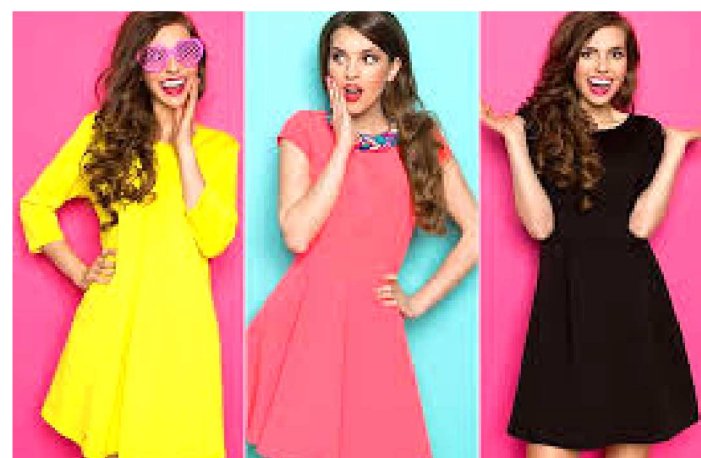
PARA QUEM ACREDITA A COR DA ROUPA É FUNDAMENTAL

Rosa – Quer encontrar o amor verdadeiro? O resultado da mistura entre as cores branca e vermelha é a melhor opção para expressar esse desejo, pois a cor rosa simboliza ternura, delicadeza, carinho e companheirismo, ou seja, é perfeita para quem procura felicidade no amor.