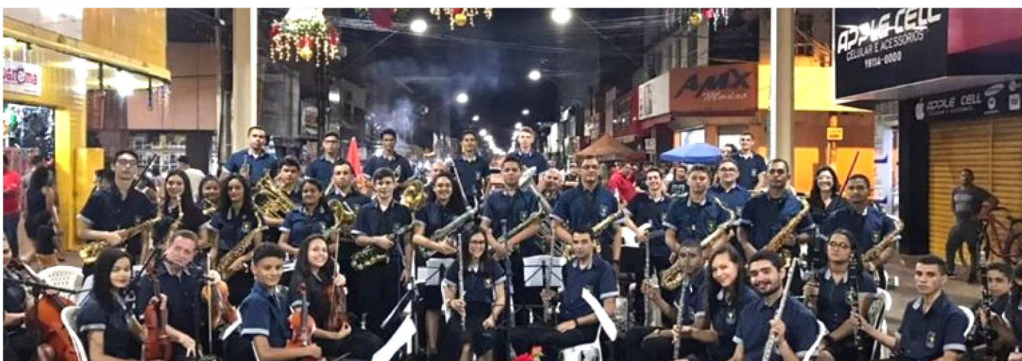
A ORQUESTRA FILARMÔNICA LÍRIO DOS VALES DURANTE APRESENTAÇÃO NO CALÇADÃO DE IMPERATRIZ

Cenário para eternizar histórias de amor, pontos de encontro, apresentações culturais. Desde que a reforma do Calçadão, realizada pelo Governo do Estado, por meio da Secretaria da Infraestrutura (Sinfra), foi entregue o local tem se tornado uma opção para a realização de diversas atividades.