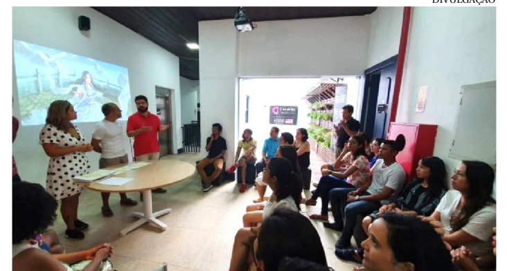
CHINESE DAY ORGANIZADO PELA SECTI NO CASARÃO TECH

O hub de inovação do Governo do Estado, o Casarão Tech Renato Archer, recebeu no último fim de semana, o Chinese Day. Organizado pela Secretaria de Estado de Ciência, Tecnologia e Inovação (Secti) e pelo Instituto Confúcio na Unesp-Maranhão, instituição ligada à Secti, o evento contou com uma programação diversificada com oficinas e exibição de filmes.