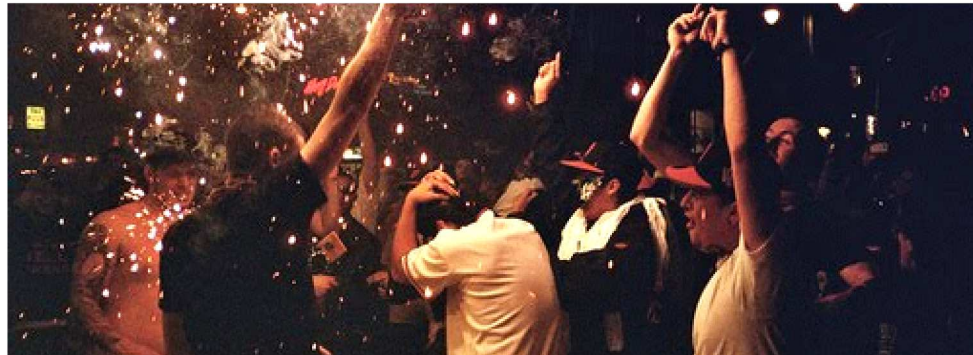
MUITOS DETALHES DEVEM SER VISTOS E ORGANIZADOS ANTES DE COMEÇAR A FESTA

Toda a sua organização será pensada a partir das pessoas que compõem o público-alvo e de quantos participantes estarão presentes. Logo, essa é