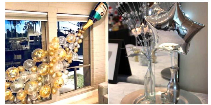
DETALHES SÃO OS RESPONSÁVEIS PELO SUCESSO DA FESTA

Os detalhes são os responsáveis por fazer da sua festa um sucesso. Por isso, não deixe a decoração do Réveillon em segundo plano!