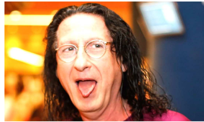
GERALD THOMAS É UM DOS DIRETORES MAIS POLÊMICOS

As palavras pulsam no texto teatral de Gerald Thomas – os diálogos, criados especialmente para os atores que vão proferi-los, transformam a narrativa em um fluxo de consciência, remetendo quase à escrita surrealista, e ainda sugerem ser algo em constante construção, crescendo a cada apresentação da peça. “Já houve texto que, no início da temporada, a primeira cena demorava uns poucos minutos e, depois de algumas sessões, durava muito mais, pois sempre é, para mim, uma obra em construção”, diz ele.