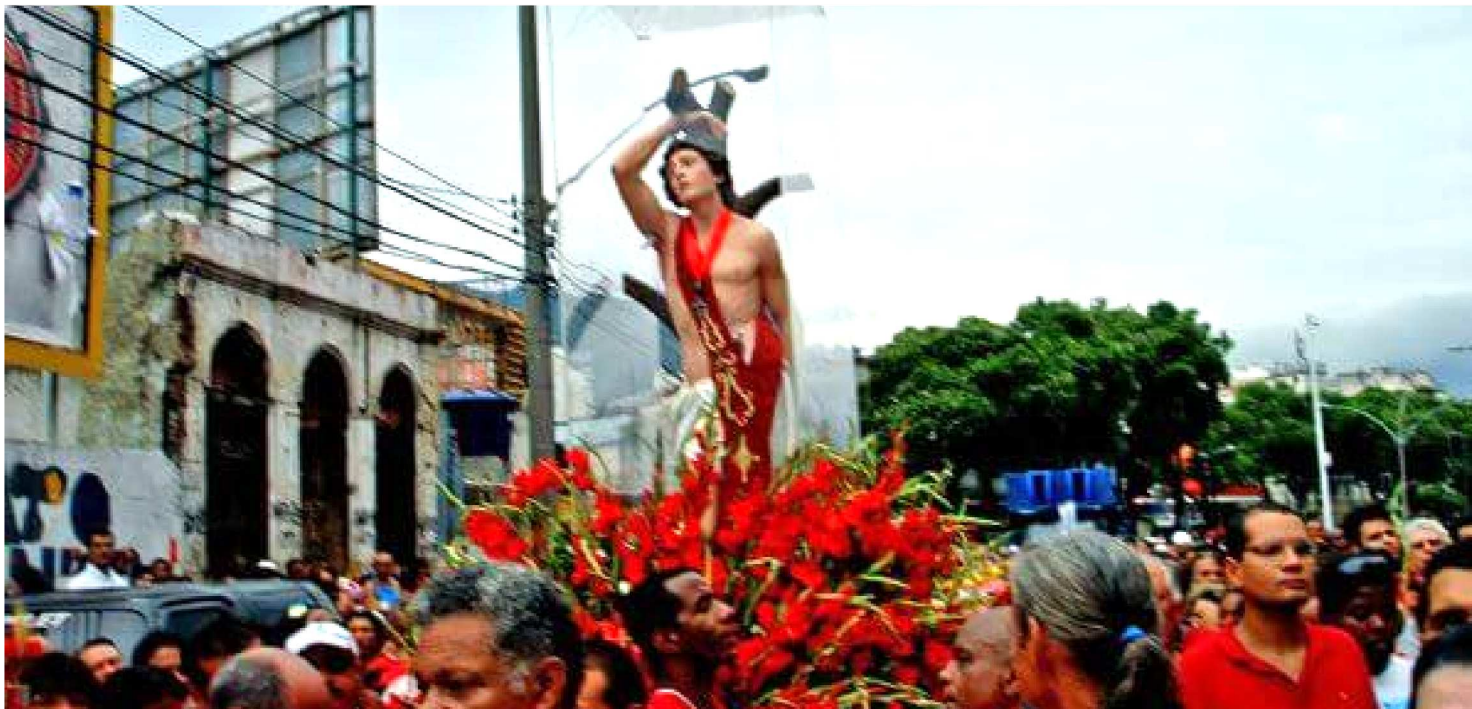
EM CAXIAS, O LEVANTAMENTO DO MASTRO ABRE O FESTEJO NO DIA 12. NESTE ANO, A FESTIVIDADE COMPLETA 140 ANOS DE TRADIÇÃO

Também em Codó, a comunidade se prepara para o festejo. E na abertura, ocorre a tradicional corrida no dia 12 de janeiro (domingo), com largada na Igreja São Sebastião. Segundo a organização, a finalidade é "divulgar festejo de São Sebastião e promover o esporte com caráter socioeducativo, fundamentado na participação, na formação e no rendimento, tendo em vista a valorização humana a promoção social e a melhoria da qualidade de vida".