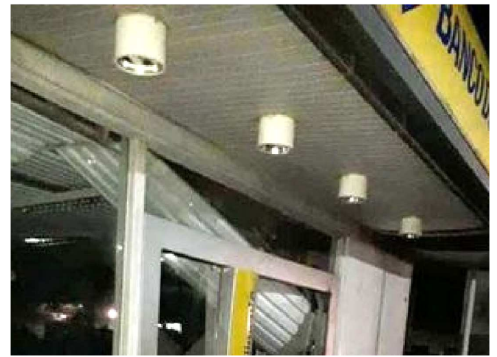
UM TOTAL DE 38 AGÊNCIAS FORAM EXPLODIDAS NO ESTADO

Trinta e oito casos de assaltos, arrombamentos e explosões de agências bancárias foram registrados no ano de 2019, no Maranhão. Os números são com base em dados do Departamento de Combate a Roubo a Instituições Financeiras (Decrif) da Superintendência Estadual de Investigações Criminais (Seic).