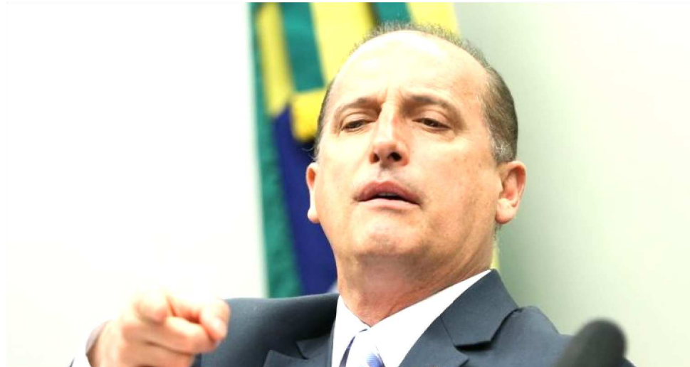
ONYX LORENZONI ENTREGOU PROPOSTA DO NOVO BOLSA FAMÍLIA PARA BOLSONARO

O governo planeja dividir o Bolsa Família em três partes: benefício cidadania, pago às famílias de baixa ren-