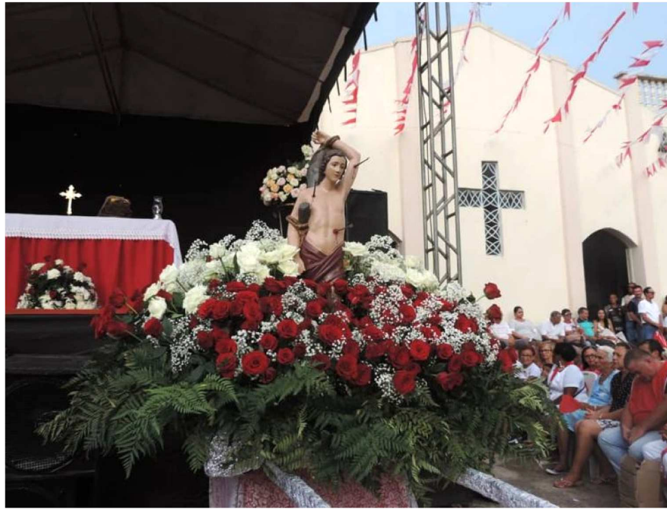
FESTEJO ANIL EM HOMENAGEM AO SANTOS É UM DOS MAIS TRADICIONAIS DE SÃO LUÍS

Com as bênçãos divinas e a proteção de São Sebastião, nos dias 11 a 20 de janeiro toda a comunidade do Cruzeiro do Anil estará em festa. Será um tempo em que nos reuniremos para celebrar a vida e o exemplo singular de seguimento a Jesus Cristo. Por isso, convidamos todo o povo de Deus, devotos eromeiros para vivenciar com fé, amor e devoção ao nosso Santo Pa-