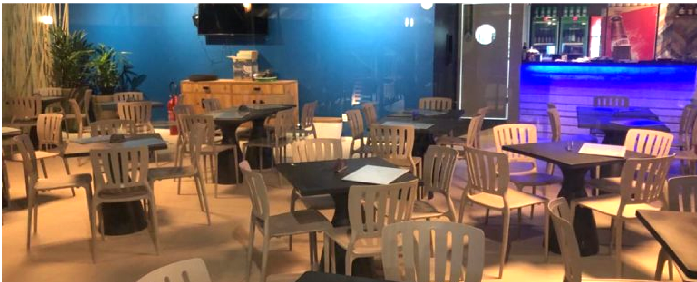
IMAGEM DA ÁREA INTERNA.

O Azeite & Sal Praia foi inaugurado no início de dezembro de 2019 e já consolida-se entre os ambientes mais disputados da cidade