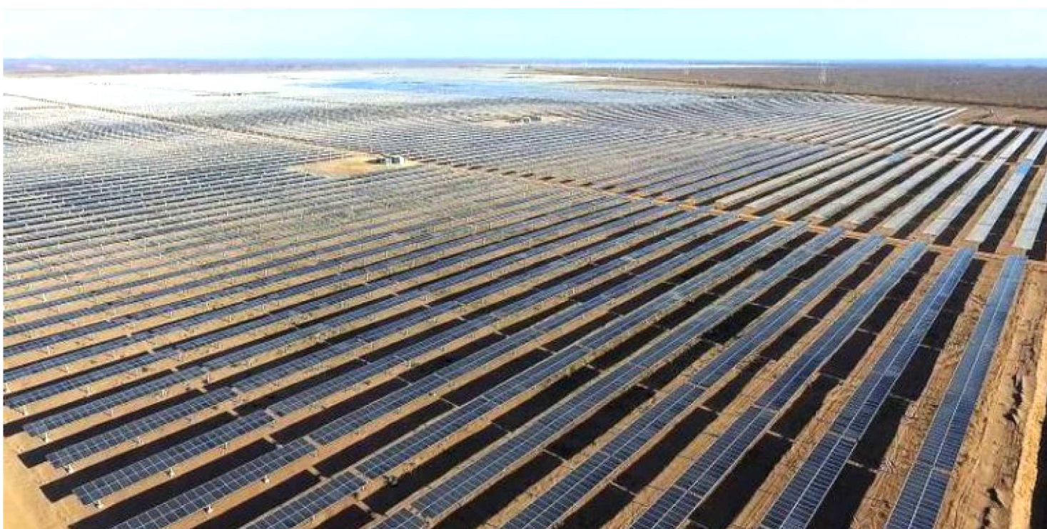
PARQUE SOLAR NOVA OLINDA EM RIBEIRA DO PIAUÍ: O ESTADO É UM DOS CINCO MAIORES PRODUTORES DE ENERGIA SOLAR DO PAÍS

O martelo batido pelo presidente Jair Bolsonaro de não taxar energia solar faz parte de um processo para elevar o capital político no Nordeste, principal polo do país nesse quesito. Entre os cinco maiores estados produtores, três são da região: Bahia, Piauí e Ceará. Com incentivos como esse, o governo acredita ter condições de tornar o presidente mais popular nessas localidades, de olho, obviamente, nas eleições de 2022. As metas, no entanto, são mais ousadas e amplas e envolvem até mesmo a discussão de ações para estimular a infraestrutura e as políticas públicas no semiárido nordestino.