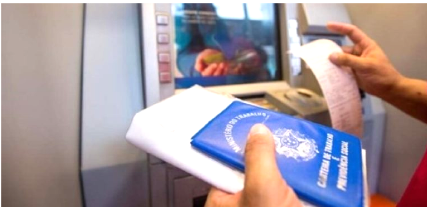
POLÍCIA FEDERAL ESTÁ CUMPRINDO 12 MANDATOS DE BUSCA E APREENSÃO E 21 DE PRISÃO PREVENTIVA PARA PRENDER QUADRILHA

Fique atento aos golpes aplicados em quem vai receber o seguro-desemprego. A Polícia Federal (PF) deflagrou a segunda fase da Operação Mendacium contra uma quadrilha acusada de fraudar o recebimento de seguro-desemprego. Estão sendo cumpridos 12 mandatos de busca e apreensão e 21 de prisão preventiva. Dez das detenções deem ocorrer em Mauá, na Grande São Paulo, quatro na capital paulista, duas em Porangatu (GO) e duas em Ibicuí (BA).