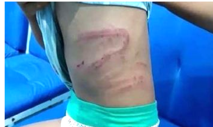
GAROTO FOI SURRADO COM FIO ELÉTRICO PELO PADRASTO

A Polícia Civil de Balsas abriu inquérito na última quarta-feira (8) para apurar um caso de agressão a uma criança de dez anos, distante 400 km de Imperatriz. Segundo informações, a criança estava em um culto com a mãe e o padrasto e teria pedido à mãe para ir em casa para usar o banheiro. O padrasto quando deu por fé que o menino não estava na igreja, perguntou para a mãe onde ele estava. E ao saber que o garoto estava em casa, saiu da igreja e foi para o local onde, com um fio elétrico, surrou o menino deixando marcas profundas pelo corpo. O homem está foragido desde o momento que as agressões foram denunciadas e teria alegado que o motivo teria sido porque o garoto estava namorando. O Conselho Tutelar foi acionado e tomou as providências, denunciado o caso na Polícia Civil. O garoto foi submetido a exame de corpo de delito, que foi feito em Imperatriz e está tendo acompanhamento de uma psicóloga. O agressor já foi indiciado e o delegado do caso vai representar pelo pedido de prisão preventiva. O menino continua sob a responsabilidade da mãe, mas com acompanhamento do Conselho Tutelar de Balsas.