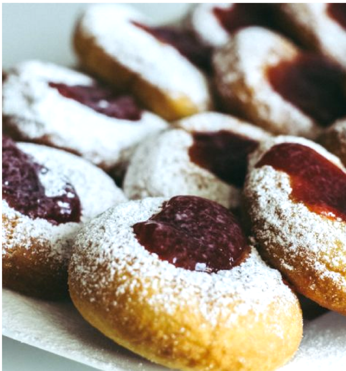
AMANTEIGADOS COM GELEIA DE GOIABA PREDILECTA DOCE É UM CLÁSSICO DELICIOSO

Sirva ainda quente, acompanhado com a Geleia de Morango Predilecta!