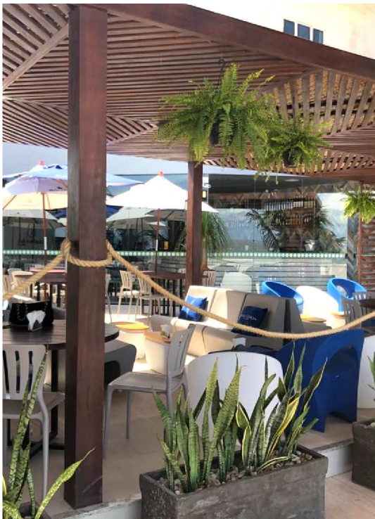
Imagem da área externa