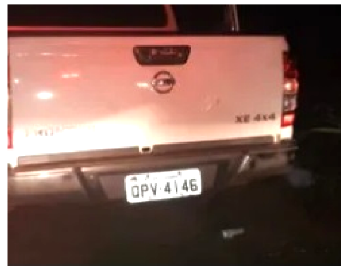
PASTOR FOI ABORDADO QUANDO DESCEU DO CARRO NA BR 135