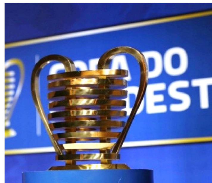
TAÇA DEVE CHEGAR A IMPERATRIZ NO DIA 21 DE JANEIRO

A cidade de Imperatriz e o estado do Maranhão vão receber no dia 21 de janeiro de 2020, a mais cobiçada taça entre clubes do nordeste. A ‘Orelhuda’, como foi apelidada por torcedores de clubes nordestinos, vai percorrer cidades onde existem clubes disputando a competição em 2020, para que os torcedores possam conhecer de perto a grande estrela da Copa do Nordeste. Imperatriz vai ser a primeira cidade a receber o troféu, tendo em vista que a abertura da competição vai ser no Frei Epifânio, no dia 21 de janeiro, ocasião que o Imperatriz receberá o CRB pela primeira rodada da fase de grupos da Copa do Nordeste 2020.