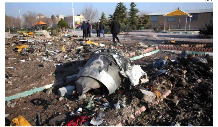
TODAS AS 176 PESSOAS A BORDO MORRERAM

Autoridades do governo americano acreditam que o Boeing 737-800 da Ukrainian International Airlines foi alvejado por um míssil. O governo da Ucrânia disse que estava investigando se a aeronave havia sido atingida por um míssil, mas o Irã descartou essa possibilidade.