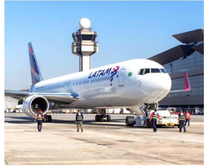
LATAM AMPLIARÁ A ROTA GUARULHOS-IMPERATRIZ EM MARÇO

Companhias aéreas confirmam incremento na malha aérea maranhense. A partir de fevereiro, a Azul passará a oferecer voo na madrugada aos sábados e domingos na rota São Luís-Imperatriz, tornando esse trecho diário, além de um upgrade de aeronave que antes era EMBRAER 195 e passará a ser um Airbus 320.