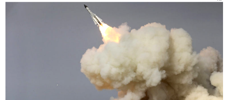
MISSEIS IRANIANOS ATINGIRAM BASES AMERICANAS

O chefe da Força Aeroespacial da Guarda Revolucionária do Irã afirmou ontem que o bombardeio contra as bases americanas no Iraque dá início a uma série de ataques contra os Estados Unidos no Oriente Médio, informou a TV estatal iraniana.