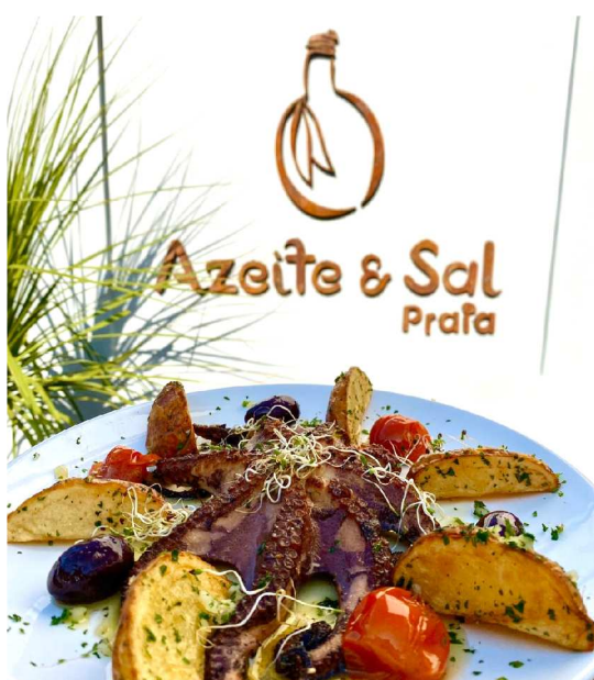
Polvo grelhado é o carro-chefe da casa.

O espaço começa a funcionar no horário do almoço e segue até o final da noite, ou seja, ideal para quem deseja aproveitar o dia e esticar um pouco mais com a turma.