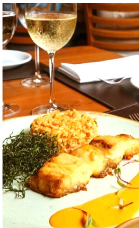
Pescada grelhada com arroz de moqueca e chips de couve.

O restaurante oferece três opções para entrada e entre elas, destaca-se a casquinha de caranguejo. Para quem tem um gosto bem variado vai gostar dessa informação, pois são cinco opções como principal e três como sobremesa. O destaque fica para pescada grelhada com molho de moqueca, arroz no próprio molho e crisp de couve.