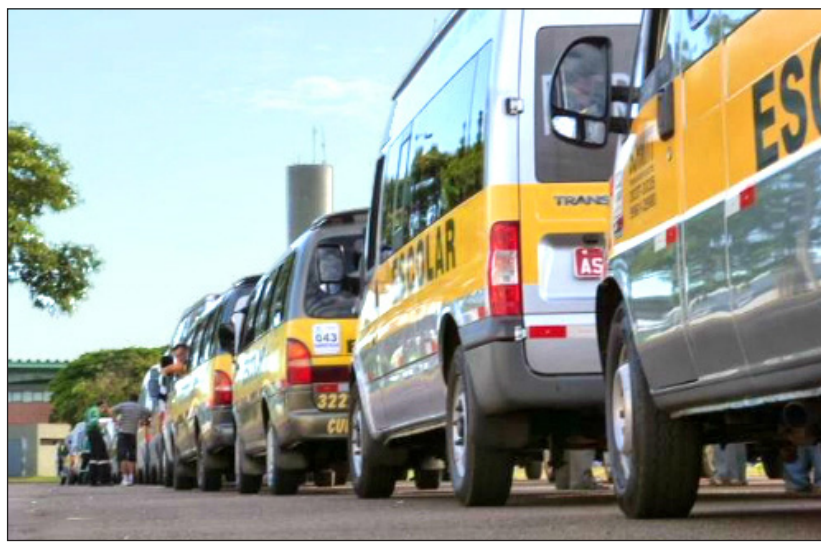
NEM TODOS OS VEÍCULOS DE TRANSPORTE ESCOLAR PASSARAM PELA FISCALIZAÇÃO

LICENÇAS 58% da frota de transporte escolar ainda está irregular