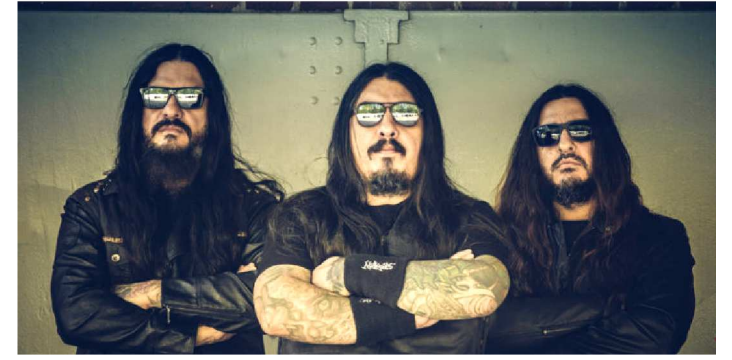
KRISIUN TOCA NO ANIVERSÁRIO DE TRÊS ANOS DA FANZINE