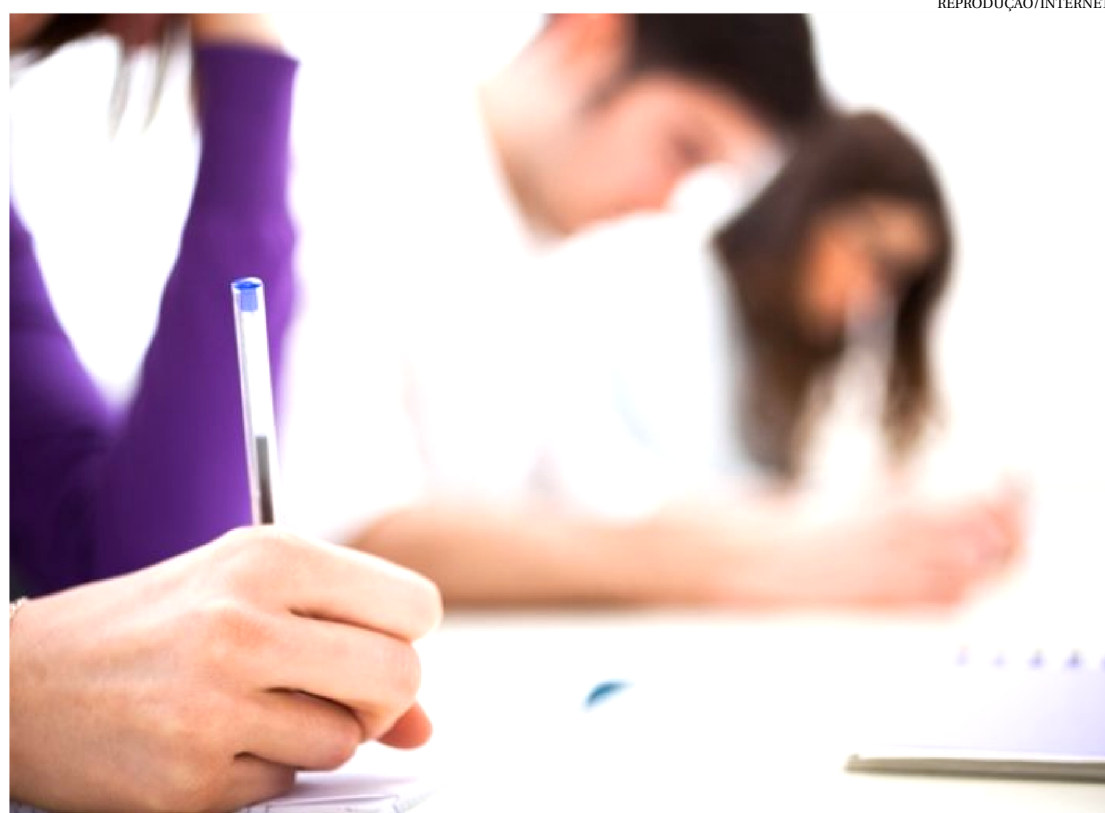
AS VAGAS ESTÃO DISTRIBUÍDAS EM 25 CARGOS E OS SALÁRIOS CHEGAM A R$ 4 MIL

Foram prorrogadas as inscrições do concurso público da Prefeitura de Barreirinhas que está oferecendo 222 vagas para contratação imediata e para cadastro de reserva. Todos os cargos contam com reserva de vagas para pessoas com deficiência (PcD). O certame está sendo realizado pelo Instituto Legatus.