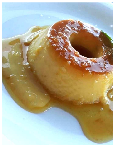
Pudim do Barroso, uma das opções do restaurante como sobremesa.

O cliente pode escolher uma das quatro opções de entrada e entre elas o destaque fica para o brandade de bacalhau. Já como principal o espaço oferece cinco opções que entre massas, carne e peixe. Para sobremesa entre as quatro opções, o carro-chefe é o famoso pudim do barroso, uma mistura de doce com flor de sal.