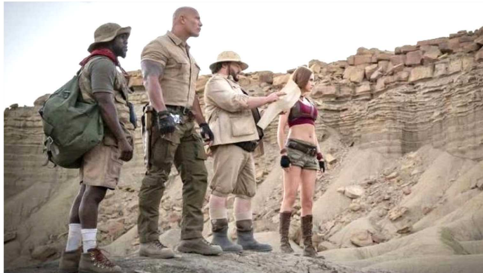
UM DOS GRANDES CHAMARIZES DE "JUMANJI" É A PRESENÇA DE DWAYNE JOHNSON