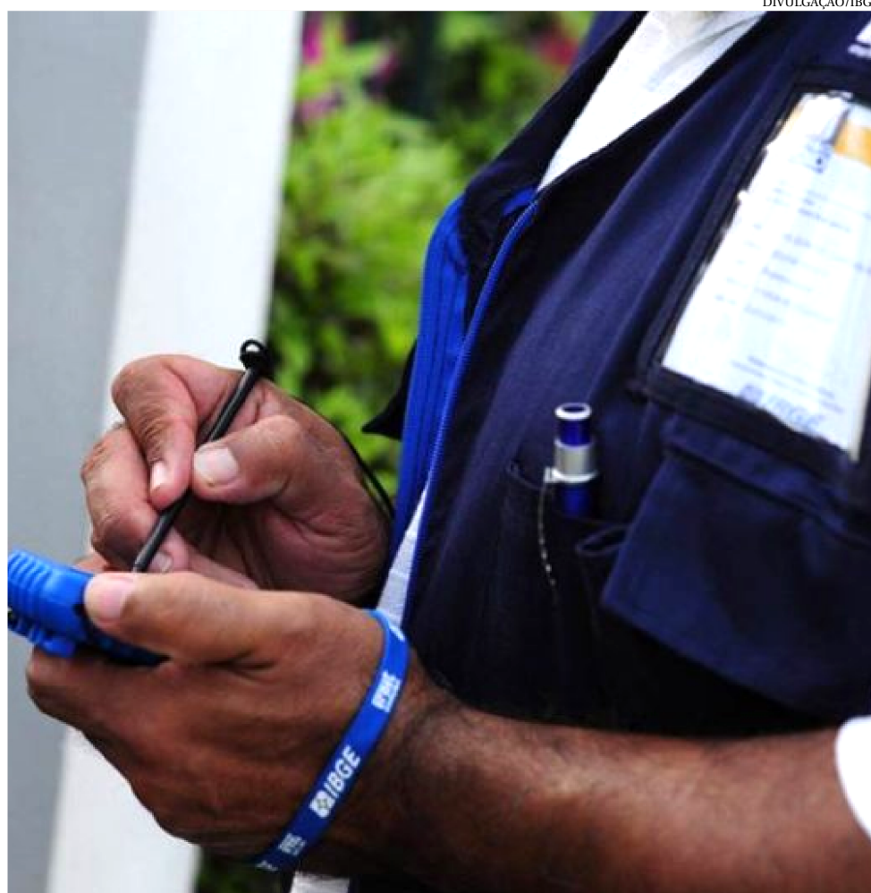
OS SALÁRIOS QUE DEVE SER PAGO AOS AGENTES CENSITÁRIOS CHEGA A R$ 2.400

O recenseador tem papel fundamental importância para o levantamento de dados destinados ao Censo Demográfico. É ele o profissional responsável por percorrer residências e estabelecimentos no intuito de coletar dados. Sua principal função é lidar,