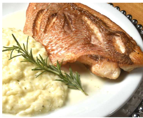
Pargo grelhado ao molho cítrico com risoto de parmesão.

Segundo Werther Bandeira, a sugestão de entrada é o famoso Carpaccio clássico, mas em seu menu também é possível encontrar Cerviche de peixe branco com slim de torradas, salada Caesar e Emincé de filé com fricassé de Cogumelos. O prato principal fica a cargo do Pargo grelhado ao molho cítrico com risoto de parmesão (foto). Já a sobremesa uma banana flambada no conhaque, entre as opções. Também é possível escolher entre massas e carnes.