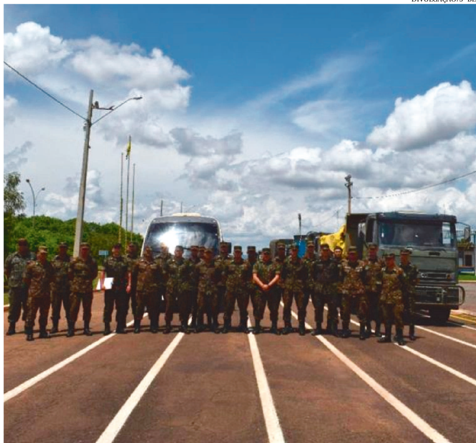
33 MILITARES DO 3º BATALHÃO DE ENGENHARIA DE CONSTRUÇÃO ESTÃO EM BACABEIRA

De acordo com a Superintendência Regional do Departamento Nacional de Infraestruturas de Transportes (SR-