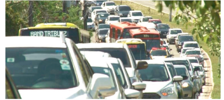
É POSSÍVEL ACESSAR A PÁGINA NO PORTAL DA SEFAZ

O Governo do Maranhão, por meio da Medida Provisória nº 305/2020, instituiu o Programa de Pagamento e Parcelamento de Débitos Fiscais relacionados ao Imposto sobre a Propriedade de Veículos Automotores (IPVA), concedendo redução de 100% das multas e juros para pagamento a vista ou 50% para parcelamento. Os proprietários de veículos automotores com débitos do IPVA até 1º de janeiro de 2019 terão a oportunidade de se regularizar com desconto.