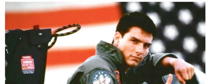
TOM CRUISE VOLTA A VIVER MAVERICK EM TOP GUN

Top Gun foi um sucesso instantâneo quando foi lançado, em 1986. O filme estrelado por Tom Cruise e dirigido por Tony Scott arrecadou mais de US$ 353 milhões nas bilheterias internacionais e se tornou o maior sucesso dos cinemas americanos naquele ano. Por isso, é de se estranhar que sua sequência, Top Gun: Maverick, só vá estreiar agora, 34 anos depois. Mas há uma história por trás dessa demora toda – e ela está ligada a casos de assédio sexual dentro do exército norte-americano.