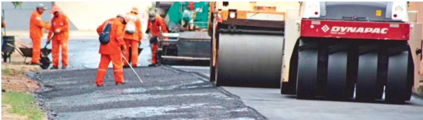
PREFEITURA SEGUE COM ASFALTAMENTO E DRENAGEM NA REGIÃO DO COHATRAC POR MEIO DO PROGRAMA SÃO LUÍS EM OBRAS

Prefeitura segue com asfaltamento e drenagem na região do Cohatrac por meio do programa São Luís em Obras. A gestão do prefeito Edivaldo Holanda Junior, por meio do programa São Luís em Obras, segue com dezenas de frentes de serviço pela cidade. Na região do Cohatrac, nesta semana, os trabalhos estão concentrados na pavimentação de ruas e avenidas, bem como serviços de drenagem superficial. As obras no bairro somam-se a outras implementadas pela Prefeitura de São Luís como a reforma de espaços públicos, de unidades de saúde e mercados e asfaltamento de diversos bairros da cidade.