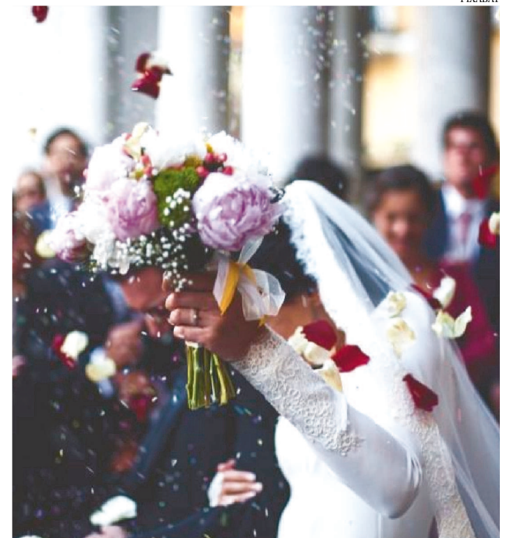
A CERIMÔNIA MATRIMONIAL SERÁ REALIZADA DIA 24 DE ABRIL

As inscrições para participar do casamento comunitário em São Luís estão abertas até amanhã, próxima sexta-feira (24). Aos interessados, as inscrições estão sendo realizadas no Cartório da 4ª Zona de Registro Civil das Pessoas Naturais de São Luís, localizado no bairro Cohab Anil IV, funcionando em horário comercial.