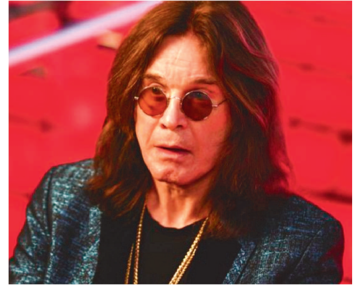
OZZY OSBOURNE É VOCALISTA DA BANDA BLACK SABBATH

O vocalista da banda de rock Black Sabbath, Ozzy Osbourne, relatou que foi diagnosticado com Parkinson. Segundo o artista, em entrevista ao programa Good Morning America, levar a doença tem sido "terrivelmente desafiador".