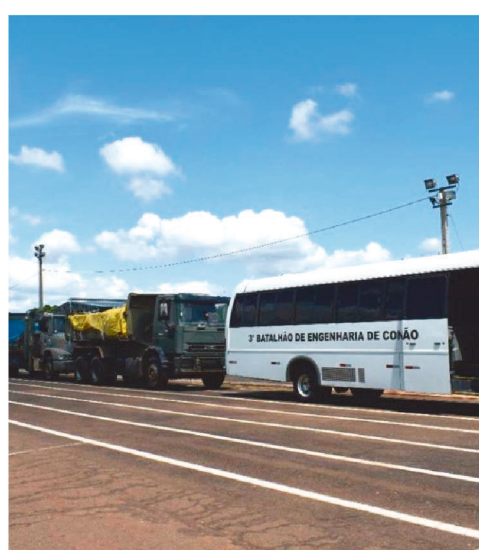
Relembra a Refinaria Premium