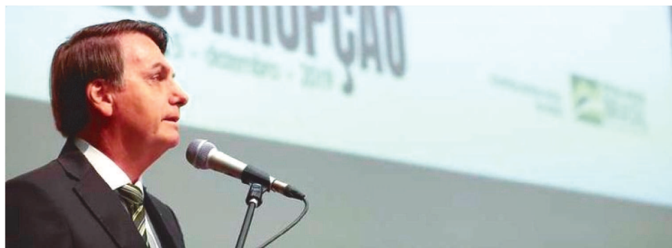
O RESULTADO É O PIOR SE COMPARADO AO ANO DE 2012

culdade do combate à corrupção no Brasil são as "interferências políticas" do presidente Bolsonaro em órgãos de controle, como substituições polêmicas na Polícia Federal e Receita Federal e a nomeação de um Procurador-Geral da República fora da lista triplíce.