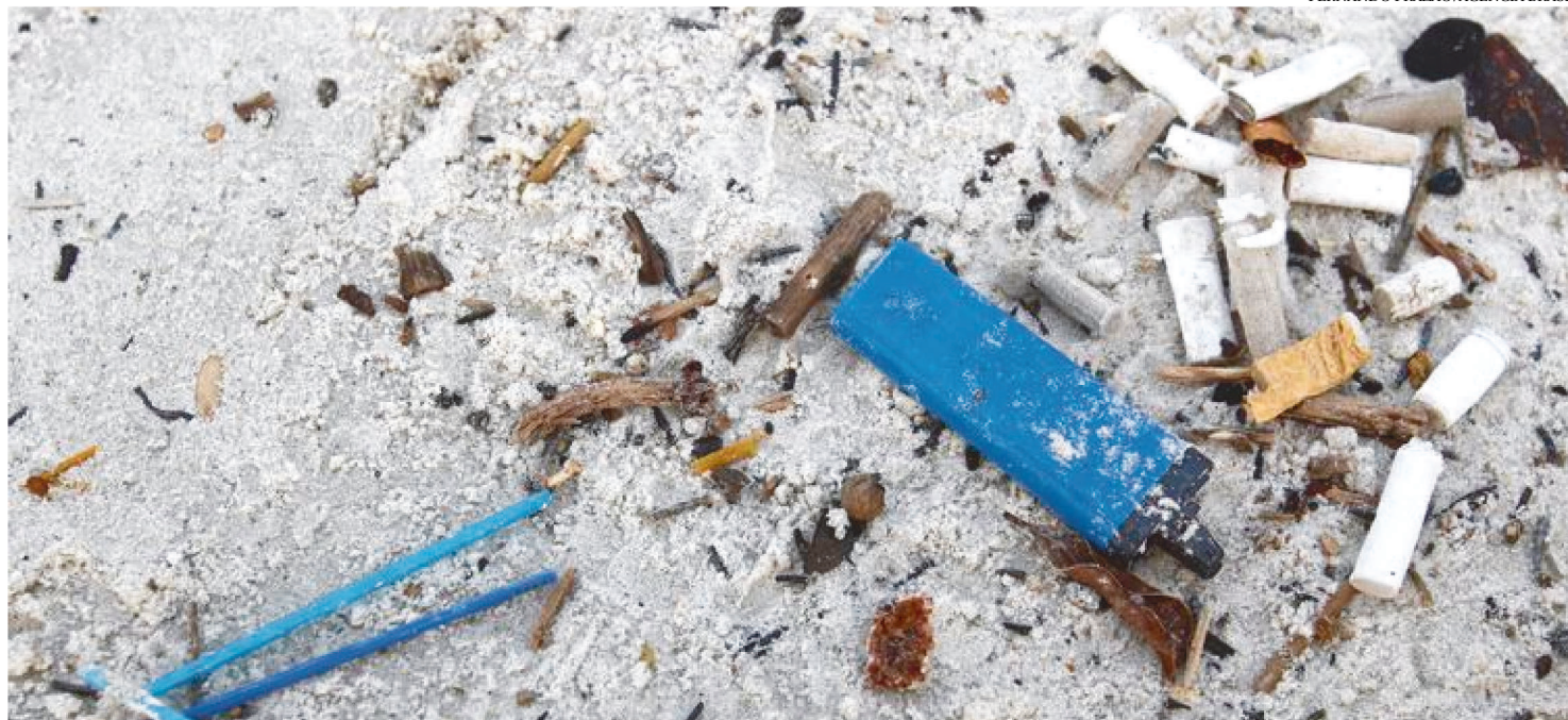
MICROLIXO VINDO DO MAR COLETADO NA AREIA DAS PRAIAS DE VÁRIOS ESTADOS, COMO MARANHÃO, RIO DE JANEIRO E PERNAMBUCO

Um estudo inédito revelou que os banhistas que frequentam as praias no país dividem espaço, a cada trecho de 8 quilômetros, com mais de 200 mil bitucas de cigarro, 15 mil lacres, tampas e anéis de lata, 150 mil fragmentos de plásticos diversos, 7 mil palitos de sorvete e churrasco e 19 mil hastes plásticas de pirulitos e cotonetes.