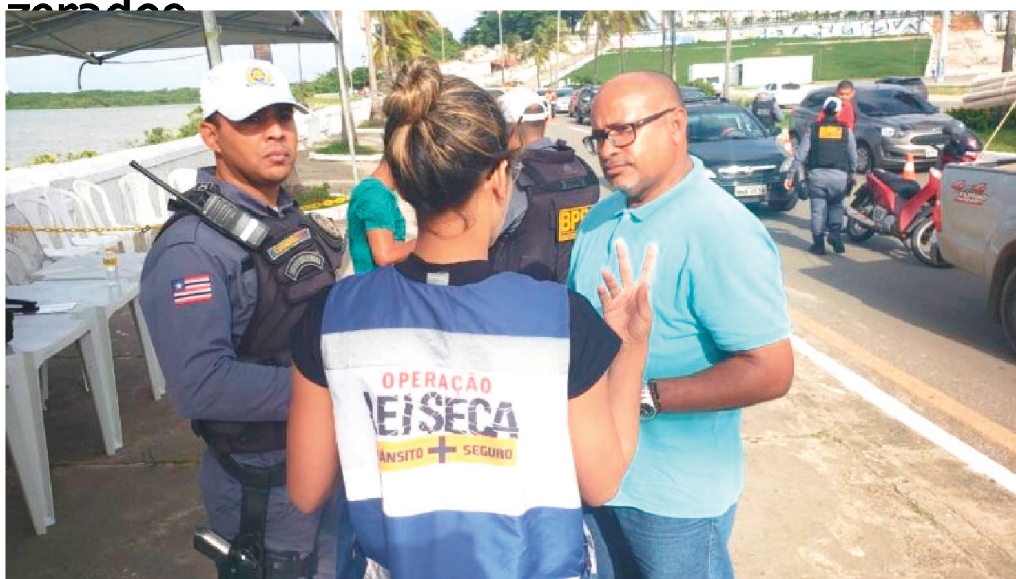
A INTENSIFICAÇÃO DAS OPERAÇÕES DA LEI SECA TEM O OBJETIVO DE GARANTIR A SEGURANÇA NA MALHA VIÁRIA

O Departamento Estadual de Trânsito do Maranhão (Detran-MA), em parceria com o Batalhão de Polícia Militar Rodoviária (BPRV), segue realizando a Operação Lei Seca, neste período de férias e de pré-carnaval. Na tarde de quarta-feira (22), a blitz aconteceu na Avenida Beira-Mar e contou com o total de 100% dos testes efetuados zerados.