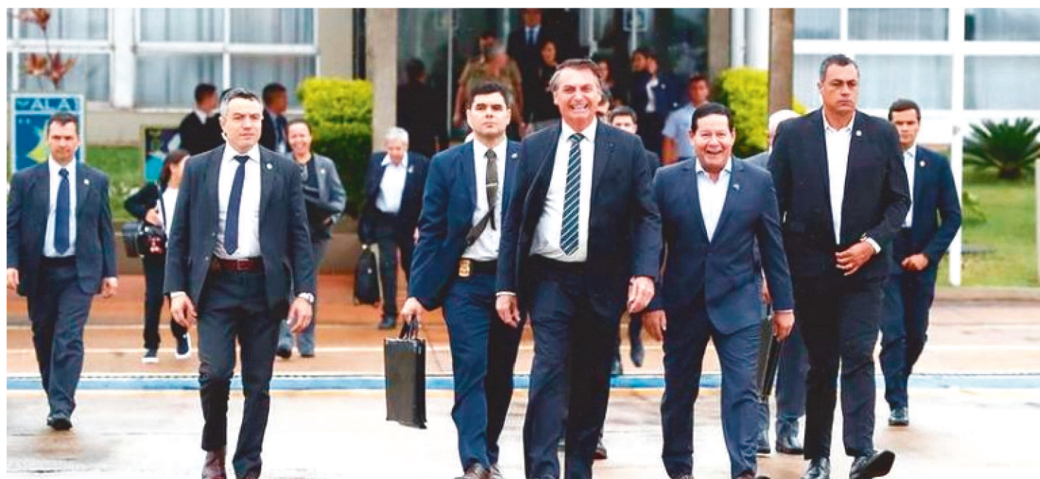
COMITIVA DO BRASIL CHEGOU A CIDADE DE NOVA DEHLI PARA VISITA ÀS AUTORIDADES INDIANAS

O presidente Jair Bolsonaro faz a primeira viagem internacional à Índia, com roteiro da visita oficial entre os dias 24 e 27 de janeiro. A expectativa dos organizadores da primeira visita de Estado de um presidente brasileiro ao país asiático desde 2004 é de assinarem de 10 a 12 acordos que estão sendo costurados pelos técnicos dos dois países.