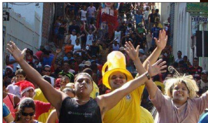
AGENCIA SÃO LUISIA BAEITA

Com ou sem chuva as programações para o pré-carnaval de rua de São Luís já estão garantidas. De hoje até domingo, tem opções para todos os gostos com toda a diversidade de brincadeiras e ritmos que é peculiar ao carnaval do Maranhão. Se você for folião, escolha onde quer se divertir e tenha um bom pré-carnaval. Com destaque para a grande programação do Bloco de Imprensa que ocorre neste sábado.