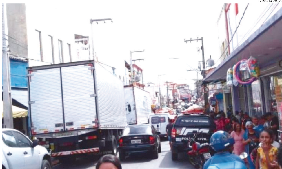
A OPERAÇÃO BARBA NEGRA FOI REALIZADA NO DIA 19 DE DEZEMBRO DO ANO PASSADO

A Coordenação de Vigilância e Repressão ao Contrabando e Descaminho da Receita Federal do Brasil (CO-REP) fez a divulgação dos números, nesta semana.