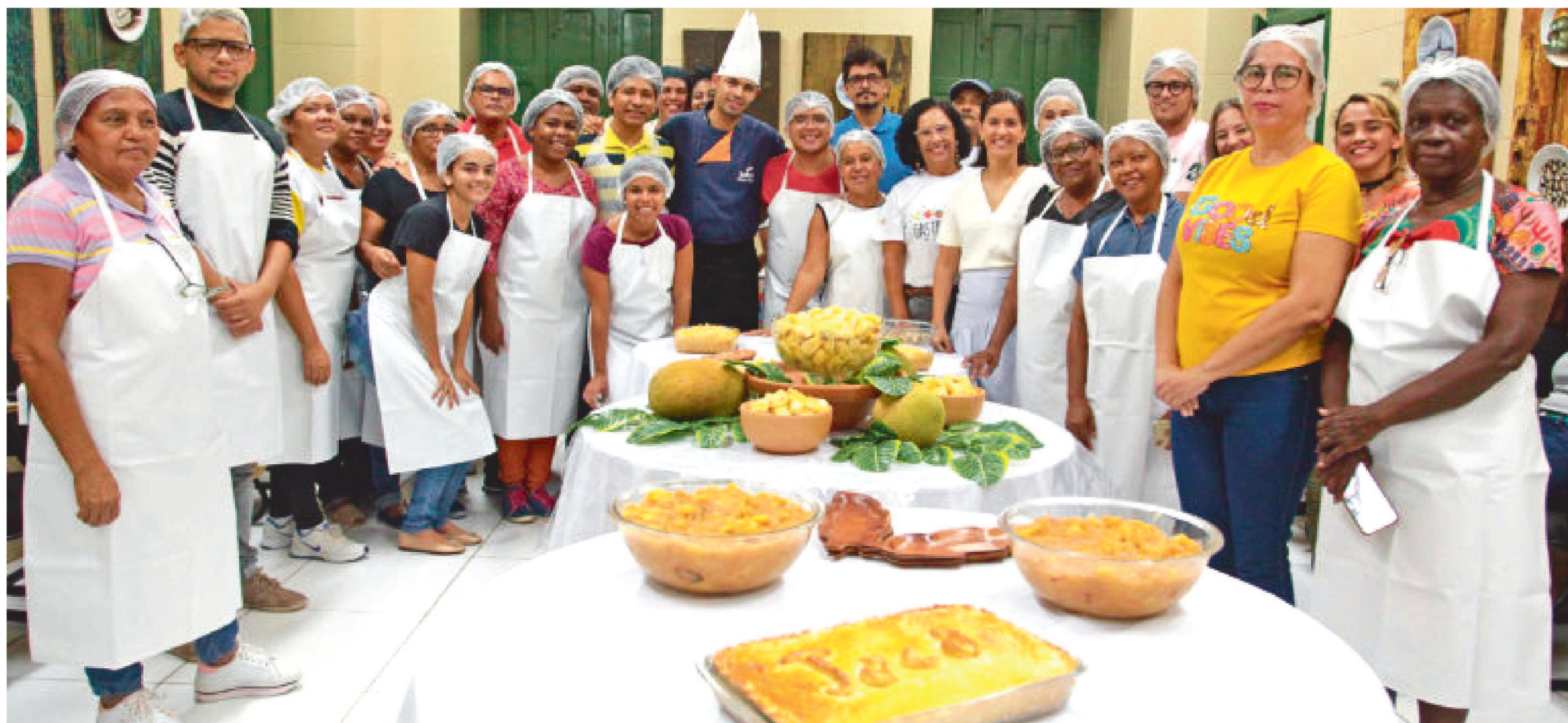
ALUNOS DA PRIMEIRA OFICINA DE 2020

Oficina realizada no início da semana mostrou a importância da jaca, como um ingrediente importante da gastronomia