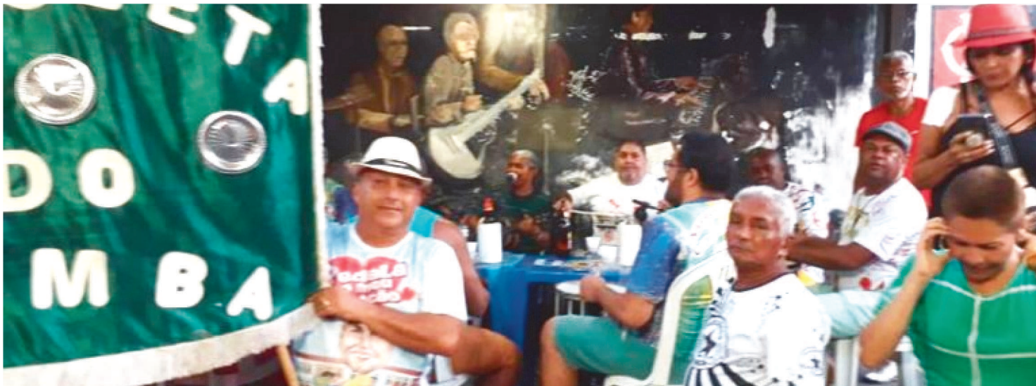
BICICLETA DO SAMBA É UM DOS GRUPOS DA MADRE DEUS QUE MAIS LEVAM SEGUIDORES PARA O PERÍODO CARNAVALESCO