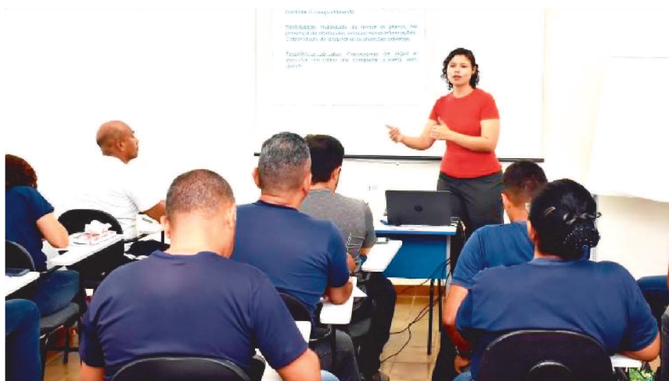
A ESCOLA DE GOVERNO E GESTÃO MUNICIPAL ESTÁ SITUADA NA RUA DAS SUCUPIRAS

É pré-requisito necessário para participar da especialização, ter concluído graduação em qualquer área do conhecimento. Após a pré-seleção dos servidores interessados, será realizada, entre os dias 3 e 9 de fevereiro a