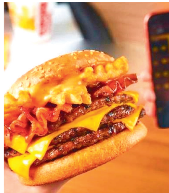
BURGUER KING PARA O MC DONALD'S TROCAM FARPAS

O Burger King voltou a provocar o Mc Donald's nesta quinta-feira (23). Pelas redes sociais, a empresa de fast-food protagonizou mais um capítulo da famosa “guerra de lanchonetes”.