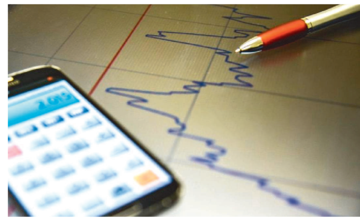
INPC ENTRE DEZEMBRO E NOVEMBRO SERÁ USADO