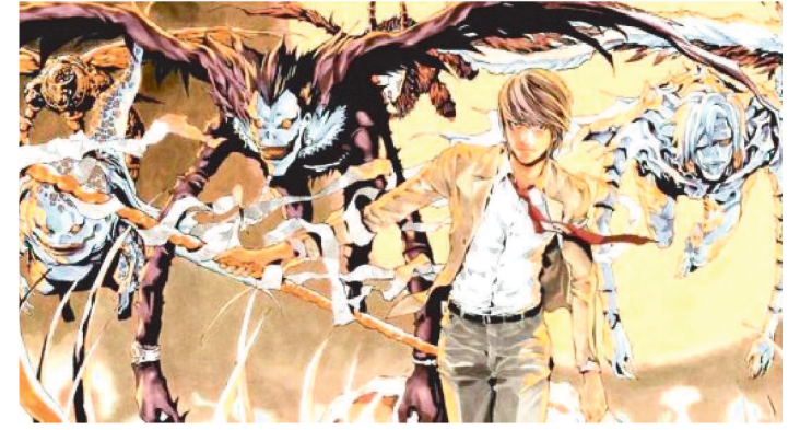
A EDITORA SHUEISHA ANUNCIOU DEATH NOTE PARA 2020

Não é exagero afirmar que Death Note é um dos shonens de maior influência dos anos 2000 pra cá. A série escrita por Tsugumi Ohba e desenhada por Takeshi Obata rendeu 12 volumes encadernados, um anime aclamado, vários livros, novelas, peças de teatro e até um controverso filme americano feito pela Netflix. Nem só de torneio de luta se vive o shonen no mundo, Death Note está aí para provar isso.