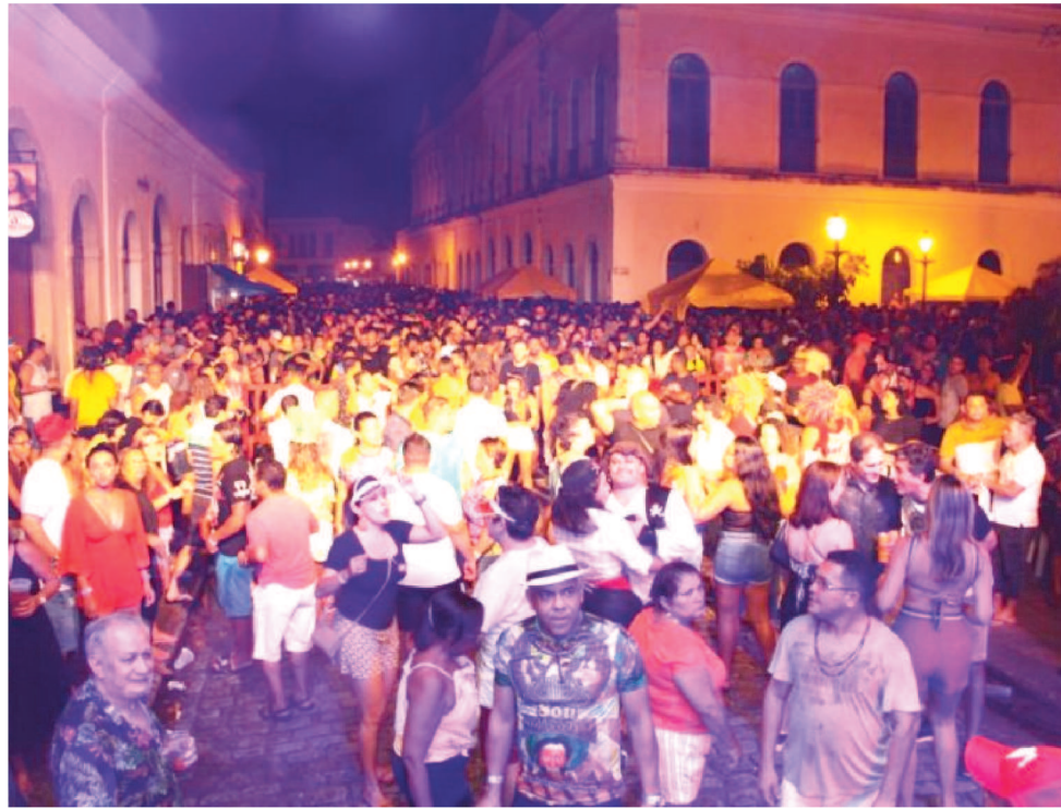
CENTRO HISTÓRICO É UM DOS PONTOS PRINCIPAIS DO PRÉ-CARNAVAL MARANHENSE

Hoje também acontecerá o encontro dos blocos tradicionais a partir das 17h, na Praça Deodoro, de onde os grupos sairão juntos para a Praia Grande. A promoção é da Secretaria de Estado da Cultura, em parceria com a Associação e a Academia de Blocos Tradicionais. Desfilarão os blocos: Os Foliões, Os Brasinhas, Os Feras, Os Tremendões, Os Vampiros, Príncipe de Roma, Originais, Os Curingas, Os Vingadores, Falcão de Prata, Kambalacho do Ritmo, Gladiadores, Renovação do Ritmo, Os Tradicionais do Ritmo, Os Trapalhães e Os Inacreditáveis.