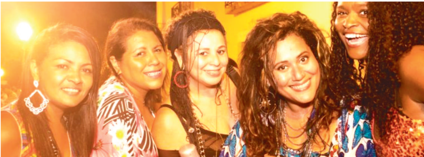
A TURMA DO SACO FARÁ UMA APRESENTAÇÃO NO DIA 24 DE FEVEREIRO (SEGUNDA-FEIRA DE CARNAVAL) HOMENAGEANDO O GRUPO

Ainda em 1992 o grupo conheceu Alcione, que quando soube que, a convite da então Escola Unidos da Ponte do Rio de Janeiro, As Brasileirinhas iriam fazer um show na quadra em Pavuna, imediatamente mandou o então amigo Chico Coimbra acompanhá-las ao Rio e assim incluiu as mesmas no seu show no Teatro Rival Cinelândia. O show fez tanto sucesso que o grupo ficou até o final da temporada.