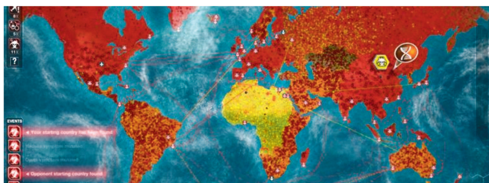
PLAGUE INC FOI UM DOS JOGOS MAIS BAIXADOS DOS ÚLTIMOS DIAS NO MUNDO

posicionar pois recebeu uma avalanche de mensagens e perguntas da imprensa e de usuários após o início do surto do novo coronavírus, que o texto classifica como “profundamente preocupante”.