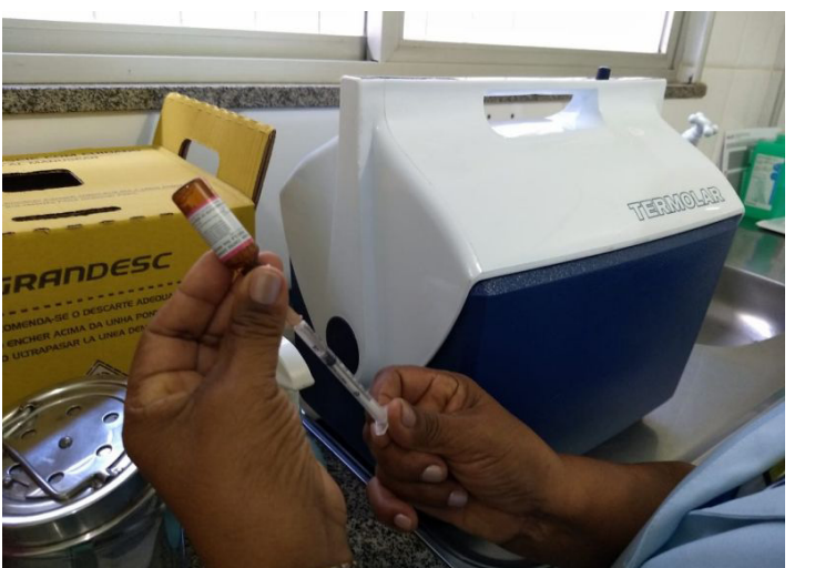
A campanha acontecerá em duas etapas em fevereiro a 03 de março

A Prefeitura de São Luís dará início, a partir de segunda-feira, dia 10 de fevereiro, às ações da campanha de vacinação contra o sarampo 2020. A proposta é intensificar a mobilização e conscientização sobre os riscos da doença e a importância da imunização, que é oferecida constantemente pela rede municipal de saúde, de forma gratuita. A iniciativa faz parte do trabalho da gestão do prefeito Eivaldo Holanda Junior para o fortalecimento da área da atenção básica, responsável por um conjunto de ações que abrangem a promoção e a proteção da saúde, a prevenção de agravos, diagnóstico, tratamento, reabilitação, redução de danos e a manutenção da saúde.