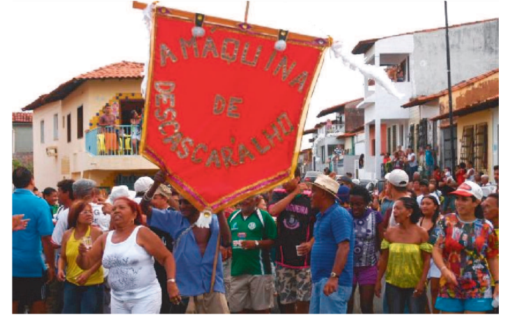
MÁQUINA DE DESCASCAR'ALHO DOMINA A MADRE DEUS

Grupo é anfitrião de projeto que fomenta a cultura carnavalesca da cidade com vários convidados de diferentes estilos