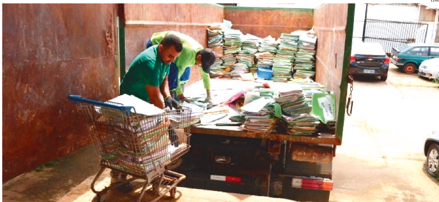
O MATERIAL CORRESPONDE A CERCA DE 255 MIL PROCESSOS FÍSICOS, PASSANDO PELOS MÉTODOS PARA REAPROVEITAR O MATERIAL

Unidades da Justiça de 1º Grau do Maranhão destinaram cerca de 80 toneladas de papel para a Cooperativa de Reciclagem de São Luís em 2019, por meio de Convênio firmado pelo Tribunal de Justiça. O material corresponde a quase 255 mil processos físicos, passando pelos métodos de trituração e centrifugação para reaproveitar o material, que retornará ao uso em forma de papel reciclado.