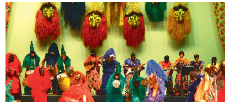
BICHO TERRA É UMA DAS ATRAÇÕES DO BLOCO AMANHÃ

Enquanto os quatro dias de carnaval não chegam, os bloquinhos é que vão ditando o ritmo da folia durante a temporada de pré-carnaval em São Luís. E com uma proposta inovadora, o bloco “Tu já Tá!?” faz sua estreia amanhã (9) no salão do Hotel Blue Tree, no Calhau. A festa começa às 17h.