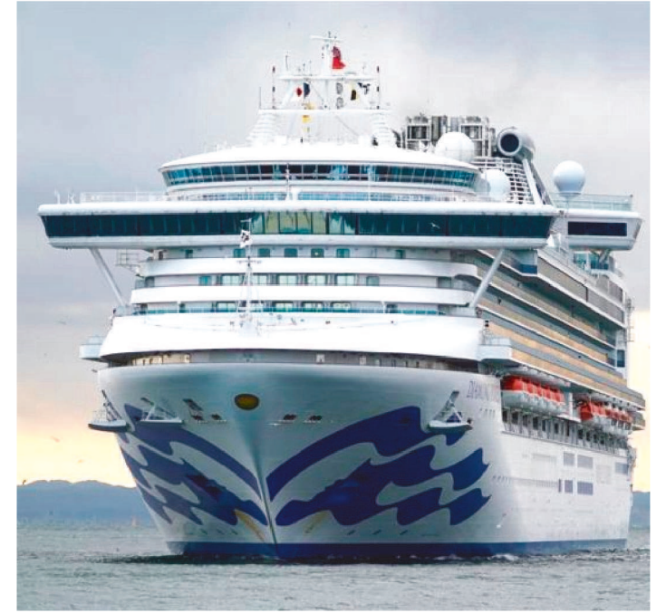
21 DOS 41 NOVOS CASOS CONFIRMADOS SÃO JAPONESES

O ministro da Saúde do Japão, Katsunobu Kato, informou, em conferência de imprensa, que 21 dos 41 novos casos confirmados são japoneses. Dentre os demais infectados estão oito norte-americanos, cinco australianos, cinco canadenses, além de um britânico e um argentino, que vem a ser o primeiro caso de infecção em nacionalidade latino-americana.