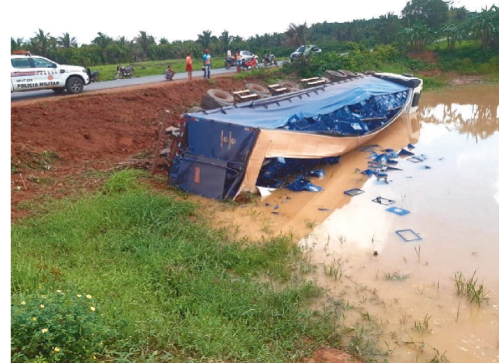
O ACIDENTE ACONTECEU NA CIDADE DE SÃO VICENTE FERRER

No fim da manhã desta sexta-feira (7), aconteceu um acidente nada comum: um caminhão de cerveja caiu em uma açude de criação de peixes, na cidade de São Vicente Ferrer. Não houve vítimas fatais.