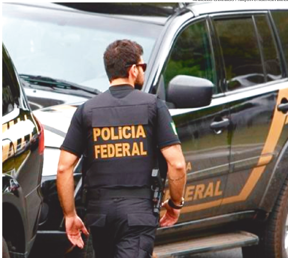
AÇÃO DA POLÍCIA FEDERAL ACONTECEU NA MANHÃ DE ONTEM, NA CIDADE OPERÁRIA

A ação faz parte da “Operação Nêmesis – Flashback”, continuação da “Operação Nêmesis”, de âmbito nacional, referente ao alvo localizado na cidade de São Luís.