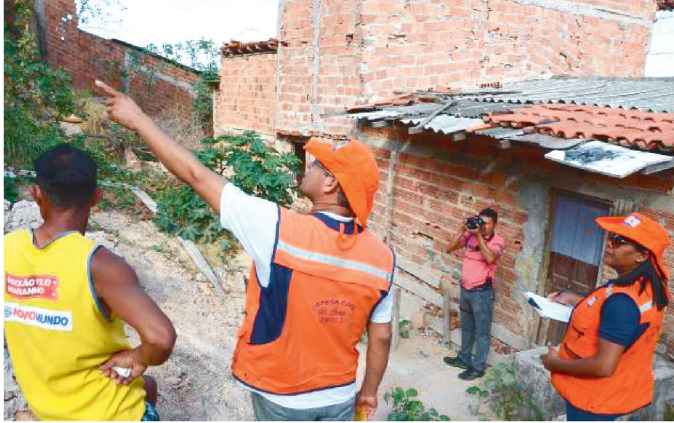
PREFEITURA MANTÉM MONITORAMENTO E AÇÕES DE PREVENÇÃO EM ÁREAS DE RISCO

Assim como no ano de 2019, a Defesa Civil de São Luís mantém monitoramento permanente em áreas de riscos mapeadas e visitadas constantemente pelas equipes do serviço. As localidades catalogadas apresentam situações semelhantes como a presença de encostas, declives, terrenos agravados pela ação humana, riscos de alagamentos e deslizamentos. Todas recebem visitas técnicas dos agentes da Prefeitura de São Luís.