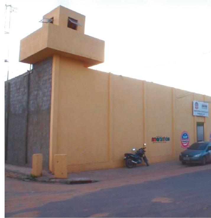
O SUSPEITO FOI ENCAMINHADO PARA A UPR DE IMPERATRIZ