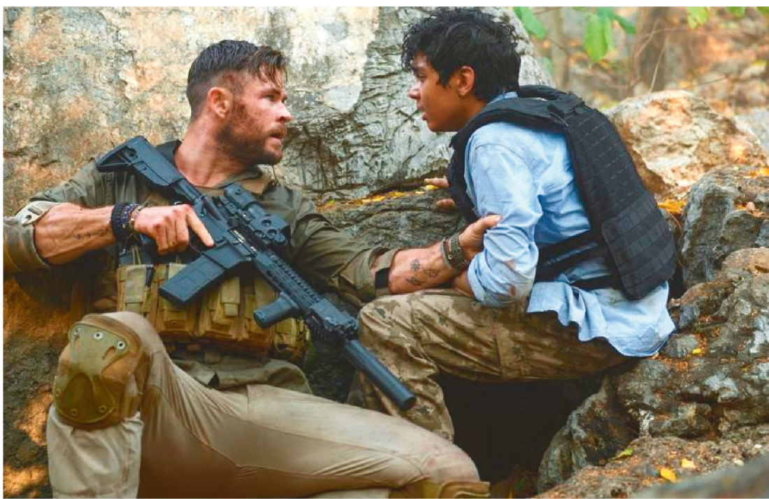
RESGATE É UM FILME DE AÇÃO COM CAMADAS DE DRAMA BEM INTERESSANTES

Chris Hemsworth, o Thor da Marvel, estará presente no novo filme baseado em quadrinhos da Netflix, intitulado Resgate. Baseado na HQ “Ciudad” de 2014, Resgate conta a história de Tyler Rake (Chris Hemsworth), um mercenário que recebe a missão de resgatar o filho de um criminoso internacional. Além de Chris Hemsworth, o elenco conta com David Harbour, que é o intérprete de Jim Hopper em Stranger Things. Além disso, o astro estará no MCU como o Guardião Vermelho, de Viúva Negra.