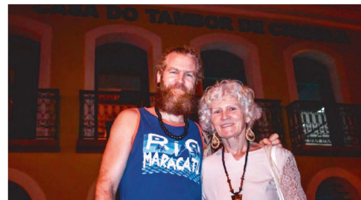
A OCUPAÇÃO HOTELEIRA FICOU EM 82% EM SÃO LUÍS