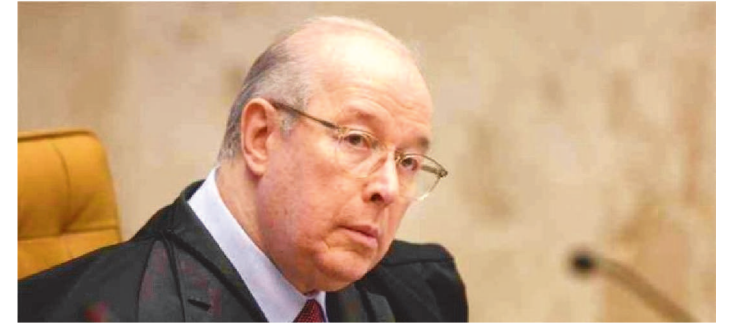
MINISTRO DO STF APONTA LIMITES PARA O PRESIDENTE

O decano do Supremo Tribunal Federal, ministro Celso de Mello, afirmou em nota que considera “gravíssima” a convocação de manifestações contra o Congresso Nacional e afirmou que caso revela a “face sombria de um presidente que desconhece o valor da ordem constitucional” e que não está “à altura do altíssimo cargo que exerce”. O decano frisou: “O presidente da República, embora possa muito, não pode tudo”.