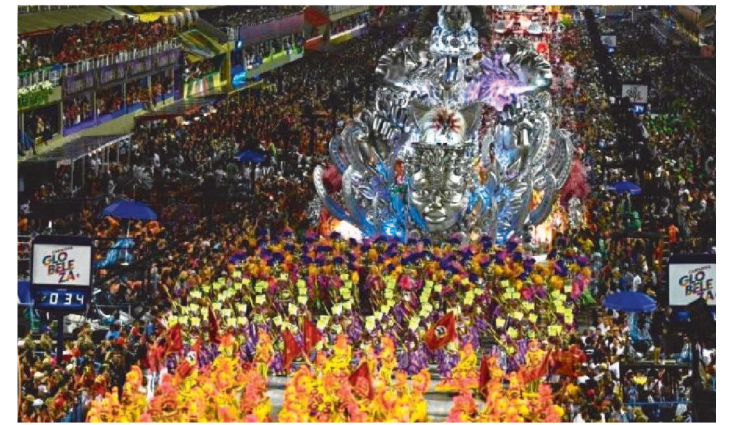
VIRADOURO CONQUISTA O TÍTULO PELA SEGUNDA VEZ

A Unidos do Viradouro é a grande campeã do Carnaval 2020 do Rio de Janeiro com o samba-enredo “Viradouro de alma lavada”. O tema falou das ganhadeiras de Itapoã, mulheres que trabalhavam lavando roupas. Cantando e conquistando seu ganho, elas compravam suas alforrias e a de seus parentes.