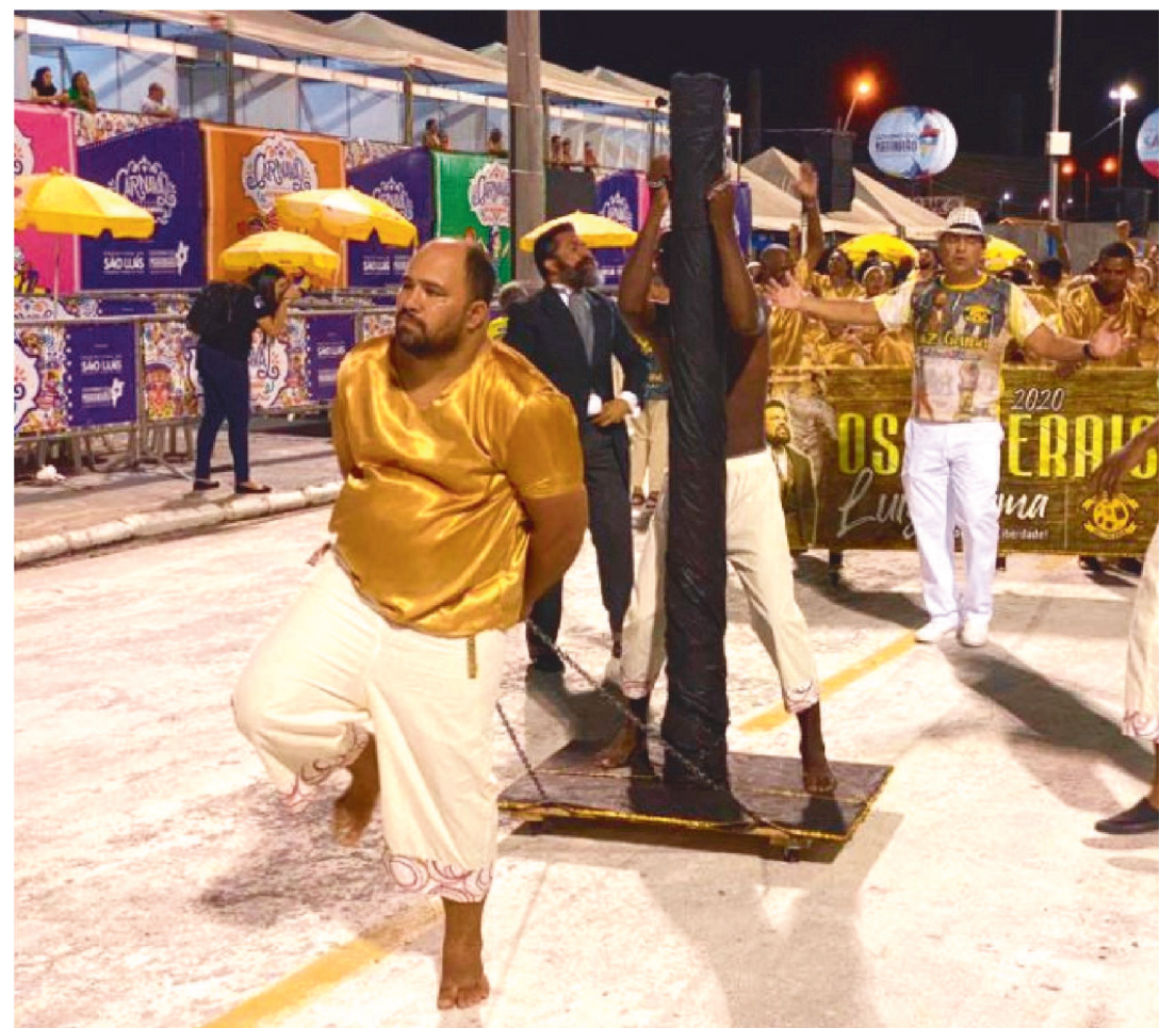
BLOCO OS LIBERAIS FOI UM DOS VENCEDORES DO CARNAVAL 2020

Em uma disputa acirrada, os três Blocos Organizados Dragões da Madre Deus, Turma do Saco e Os Liberais terminaram empatados em primeiro lugar e lavaram juntos o título do Carnaval 2020. A festa, promovida pela Prefeitura de São Luís e Governo do Maranhão, reuniu mais de 70 atrações na Passarela do Samba em cinco dias de folia.