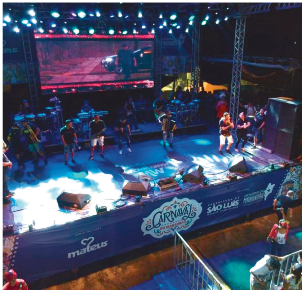
A FESTA MOVIMENTOU R$ 35 MILHÕES APENAS EM SÃO LUÍS

Para movimentar todo esse mercado, é preciso gente trabalhando. Por isso, é um período importante para a