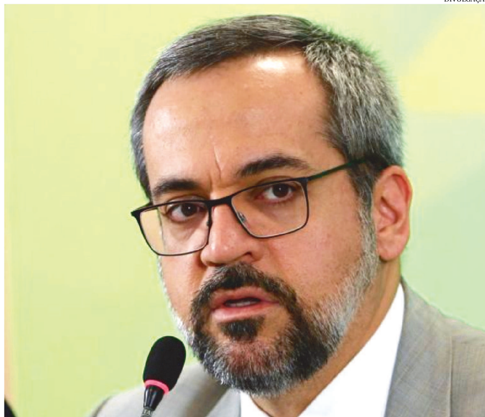
A DIVULGAÇÃO FOI FEITA NA TARDE DE HOJE (26), PELO TWITTER PESSOAL DO MINISTRO.

ram capacitados para trabalhar nas escolas. Na primeira rodada de capacitação, realizada em dezembro, em Brasília, o trabalho envolveu diretores e coordenadores de escolas, além de representantes de secretarias estaduais e municipais de Educação que vão atuar como multiplicadores. A segunda rodada ocorreu neste mês, em Porto Alegre (RS). Foram capacitados 54 oficiais da reserva e da ativa das polícias e bombeiros militares e 17 profissionais das secretarias de Educação.