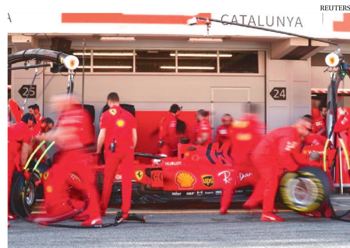
EQUIPE TENTA ACERTAR CARRO DA FERRARI NOS TREINOS

Os tempos medianos alcançados pela Ferrari na pré-temporada de Barcelona intrigam adversários, fãs e jornalistas: será que a equipe está escondendo o jogo ou o novo modelo SF1000 não “nasceu tão bem”? Charles Leclerc se mostrou cauteloso ao comentar o potencial da nova Ferrari, mas disse que pelo menos um problema a equipe resolveu em relação ao ano passado. “Estamos mais rápidos nas curvas e um pouco menos rápidos nas retas, o que era o objetivo no fim do ano passado. Foi nisso que trabalhamos, para ter mais performance. Ano passado achávamos que sabíamos onde estávamos em relação aos outros, mas na primeira corrida se viu uma figura diferente. Agora não sabemos onde estamos na comparação com outros”, disse Leclerc.