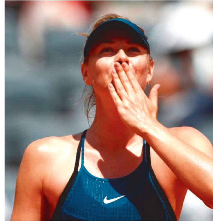
AS LESÕES ATRAPALHARAM A CARREIRA DA MUSA DO TÊNIS

Aos 32 anos, Maria Sharapova anunciou aposentadoria das quadras. Ela falou sobre a necessidade de encerrar a carreira após inúmeras lesões e batalhas contra o próprio corpo. A russa é ex-número 1 do mundo e dona de cinco títulos em Grand Slam. “Como você deixa para trás a única vida que você já conheceu? Como você se afasta das quadras em que treinou desde pequena, o jogo que você ama – um jogo que lhe trouxe lágrimas e alegrias incontáveis – um esporte em que você encontrou uma família, junto com fãs que se uniram por mais de 28 anos? Eu sou nova nisso, então por favor me perdoe. Tênis – estou me despedindo”, escreveu.