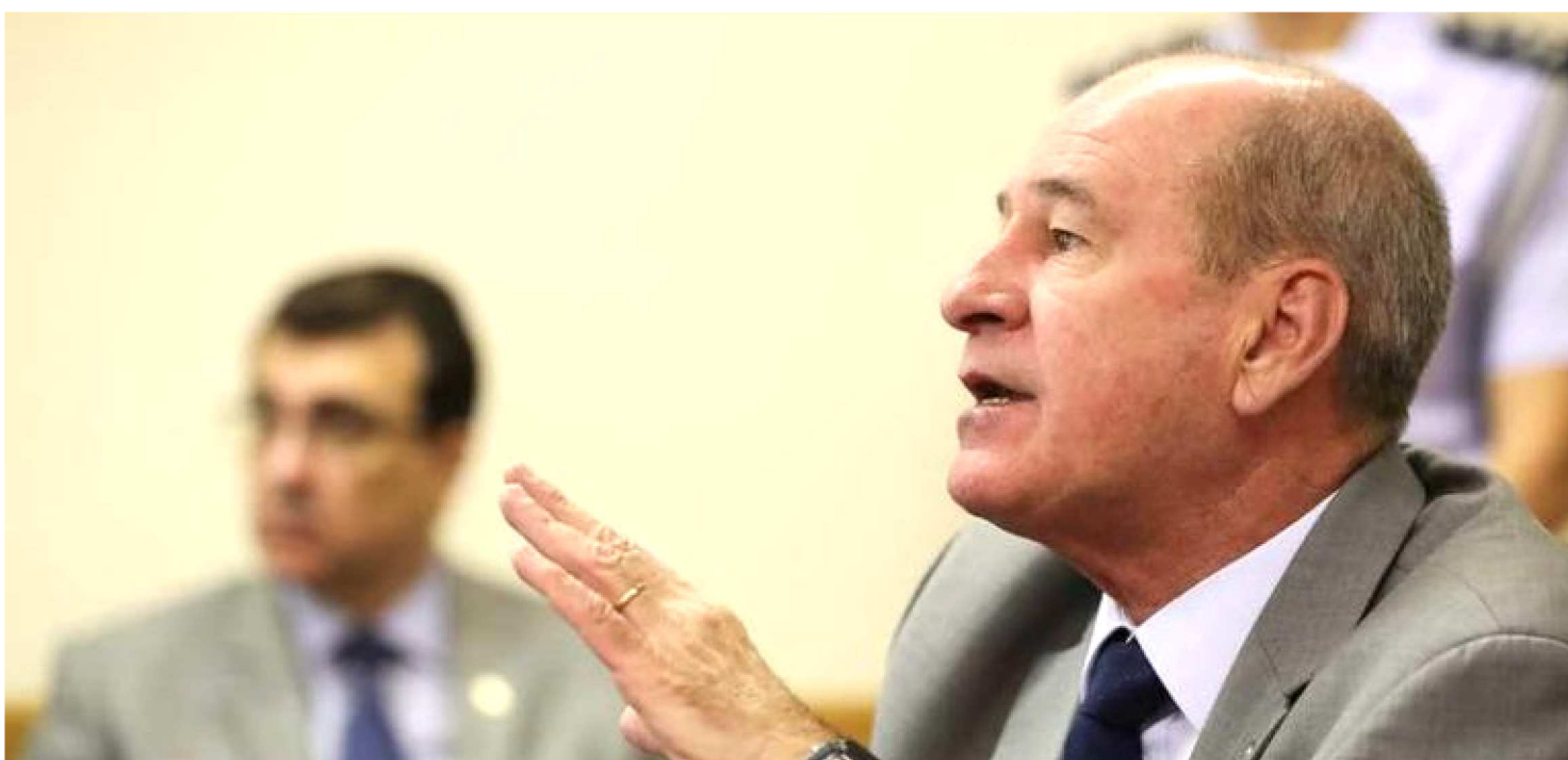
AZEVEDO E SILVA DISSE TAMBÉM QUE BOLSONARO AINDA NÃO DECIDIU SE PRORROGARÁ O PRAZO PARA O USO DAS FA NO CEARÁ

O ministro da Defesa, Fernando Azevedo e Silva, afirmou na manhã de ontem (27) que não existe a possibilidade de intervenção militar nos poderes Legislativo e Judiciário. Questionado sobre apoiadores do presidente Jair Bolsonaro que defendem a medida nas redes sociais, uma das pautas da manifestação do próximo dia 15 de março, ele foi categórico: “Não existe isso, não existe isso não”.