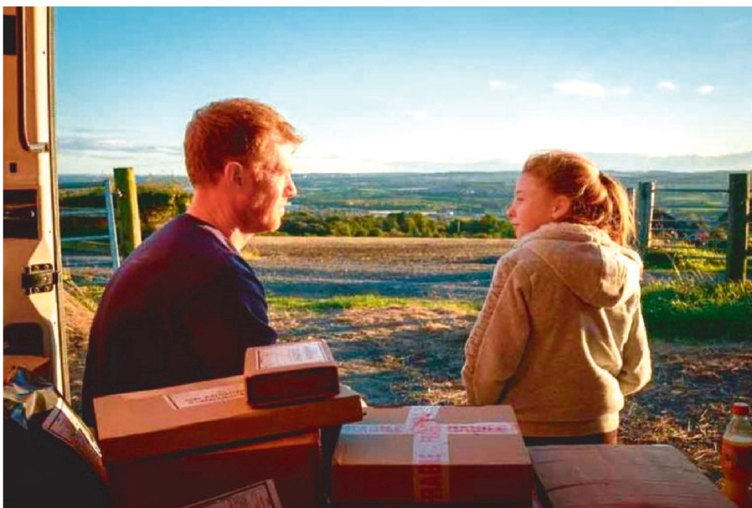
CENA DE "VOCÊ NÃO ESTAVA AQUI", DE KEN LOACH, MOSTRA OS ATORES PRINCIPAIS

Quando terminou a filmagem de Eu, Daniel Blake (2016), o cineasta Ken Loach, de 83 anos, acreditava que seria seu último trabalho. Seria o encerramento de uma rigorosa carreira, marcada essencialmente pela crítica social e simpatia pelos desvalidos.