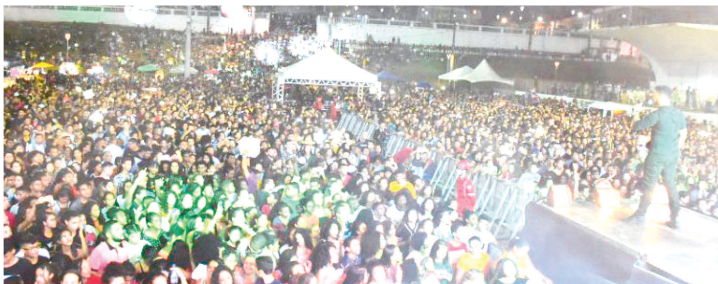
MULTIDÃO COMPARECEU NA MARIA ARAGÃO PARA ORAR POR MEIO DE RETIROS CULTURAIS PROMOVIDO PELA PREFEITURA

Ora São Luís e Retiros Culturais, promovido pela Prefeitura de São Luís e Governo do Estado, reúne multidão na Maria Aragão. Milhares de pessoas compareceram à Praça Maria Aragão, nesta Quarta-feira de Cinzas (26), para louvar e adorar a Deus no evento que já é considerado um dos maiores acontecimentos da música gospel no Maranhão: o Ora São Luís e Retiros Culturais, que é realizado pela Prefeitura e o Governo do Estado.