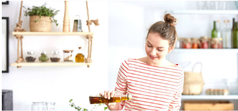
UMA SÉRIE DE DICAS PODE AJUDAR VOCÊ A COZINHAR BEM E MAIS RÁPIDO

As folhas verdes devem apenas passar por um branqueamento (colocar em água quente por 1 minuto e depois