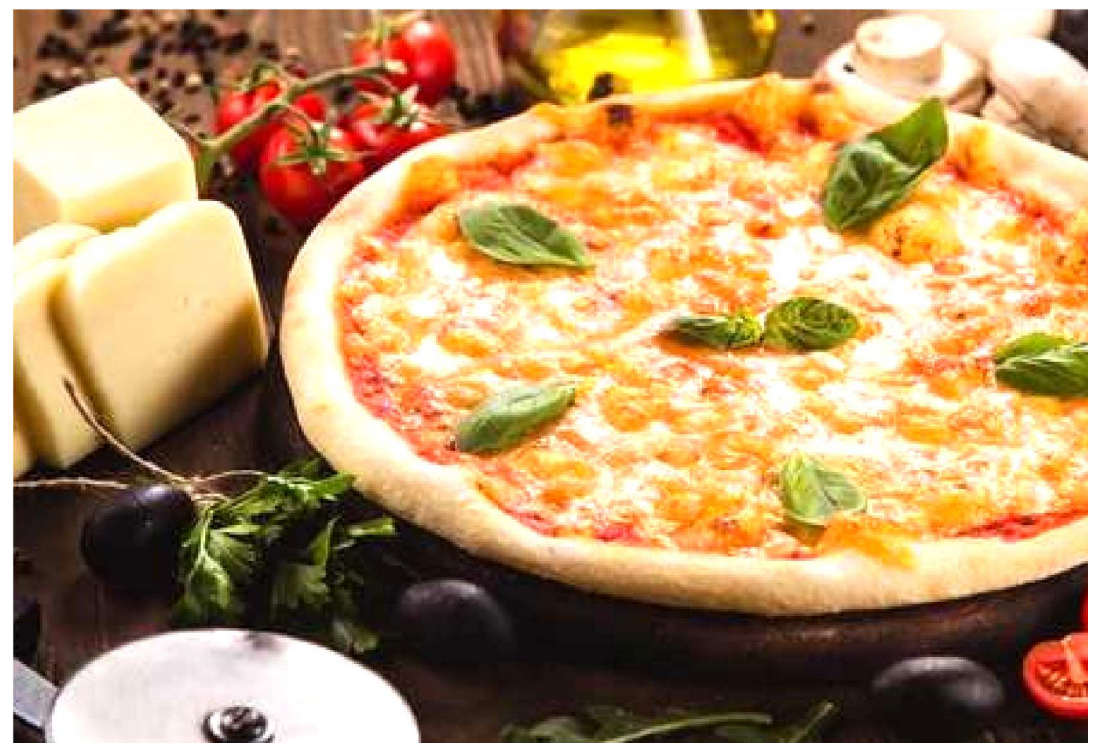
UM FORMA SIMPLES DE FAZER A PIZZA SEM GLÚTEN UTILIZANDO FARINHA DE ARROZ