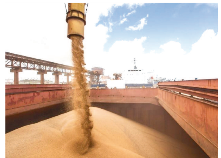
MOVIMENTO DE GRÃOS TEVE UM CRESCIMENTO DE 22,7%

Localizado na capital maranhense, o Porto do Itaqui tem se destacado na movimentação de grãos. Consolidado como o maior do Arco Norte, o porto enviou para os mercados internacionais 11,2 milhões de toneladas de grãos em 2019 e prepara uma ampliação de capacidade para este ano. A previsão da Empresa Maranhense de Administração Portuária (Emap) é de que a capacidade desse tipo de carga chegue a cerca de 18 milhões de toneladas em 2020.