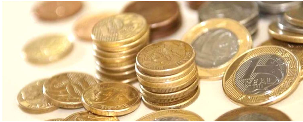
O TESOURO APRESENTOU ONTEM NOVAS PROJEÇÕES PARA A DÍVIDA PÚBLICA

De acordo com Mansueto, “não será possível ver uma estabilização da