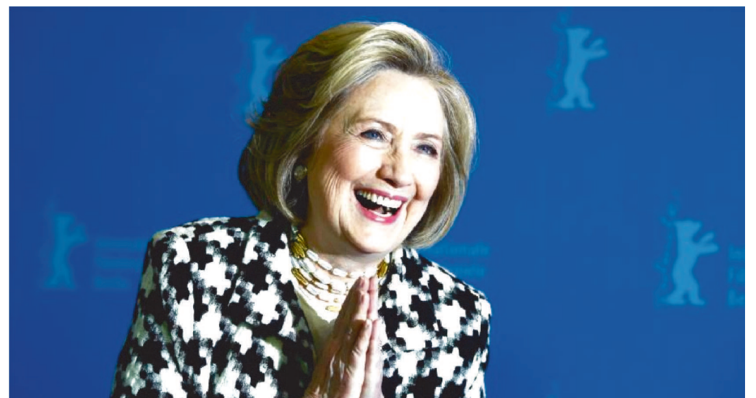
HILLARY CLINTON PERDEU AS ÚLTIMAS ELEIÇÕES DOS ESTADOS UNIDOS PARA DONALD TRUMP