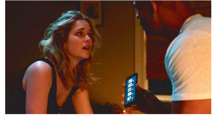
A ATRIZ ELIZABETH LAIL VIVE A ENFERMEIRA QUINN

Com funcionalidades diversas e cada vez mais otimizadas pela tecnologia, os aplicativos para telefones celulares se tornaram indispensáveis para muitas pessoas. Por outro lado, o excesso de novidades e o complexo compartilhamento de dados pessoais também criam um nível de temor sobre o uso deles.