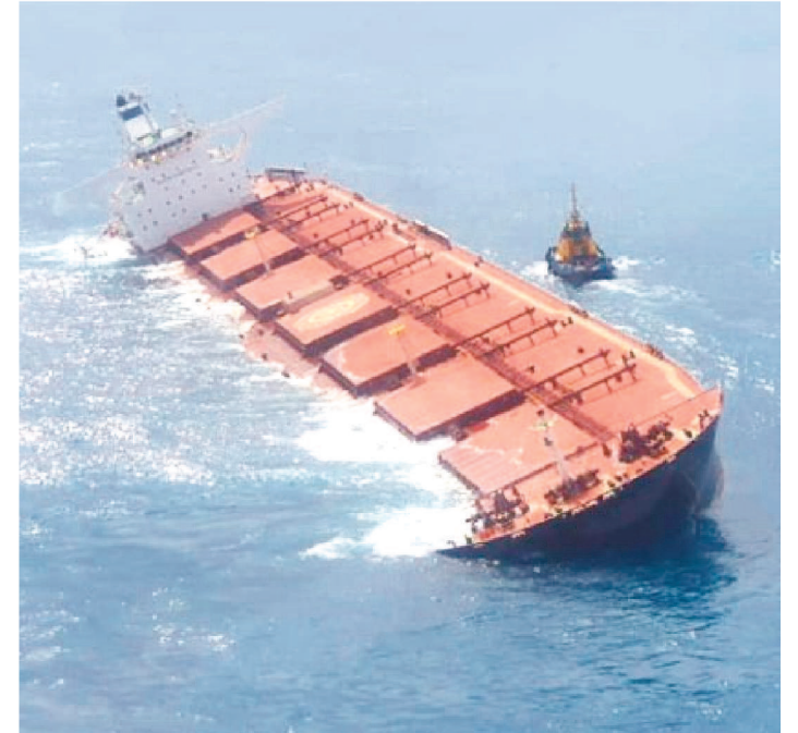
MV STELLAR BANNER ESTÁ ENCALHADO NA COSTA

A Polícia Federal abriu investigação para apurar as causas do acidente que levou o navio Stellar Banner, da empresa sul-coreana Polaris, a ficar a deriva no litoral do Maranhão. A embarcação carrega 290 mil toneladas de minério da empresa Vale. A Marinha identificou dois vazamentos no casco e o Ibama registrou óleo em um raio de 800 metros em torno do local onde houve o encalhe.