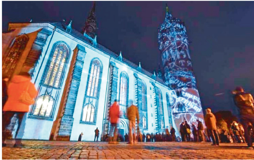
O CASTELO DE WITTENBERG RECEBEU ILUMINAÇÃO ESPECIAL

"A Reforma de Lutero rompeu definitivamente a unidade da Igreja Católica, e pode-se atribuir a ela até mesmo o início do processo de seculariza-