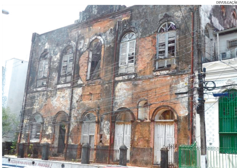
O IMÓVEL JÁ SOFREU DESABAMENTO PARCIAL E TEM RISCO DE RUIR COMPLETAMENTE

Segundo o MP, o imóvel que está fechado e abandonado, já sofreu desabamento parcial e apresenta risco de ruir completamente, de acordo com inspeção realizada pelo Ministério Público em 21 de janeiro. Ainda de acordo com a instituição, desde 2016, a Prefeitura de São Luís recebeu um projeto arquitetônico de restauração do prédio, mas não o executou. Questionada sobre os motivos de não ter efetivado as obras, a administração municipal nunca ofereceu resposta. “Em que pese a especial proteção recebida pelo imóvel integrante do Pa-