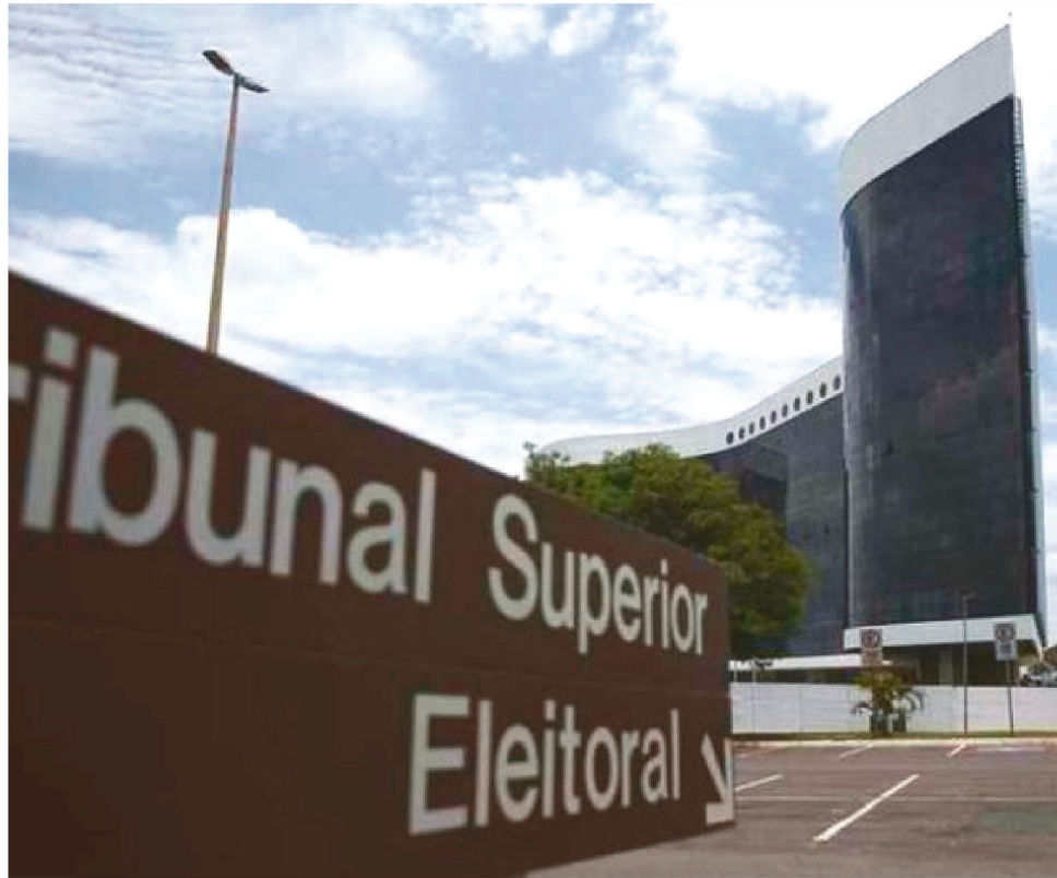
OS PARLAMENTARES BUSCAM MAIS RECURSOS E APOIO POLÍTICO PARA AS CAMPANHAS

No dia 16 de junho, a Corte deve divulgar o valor corrigido do Fundo Es-