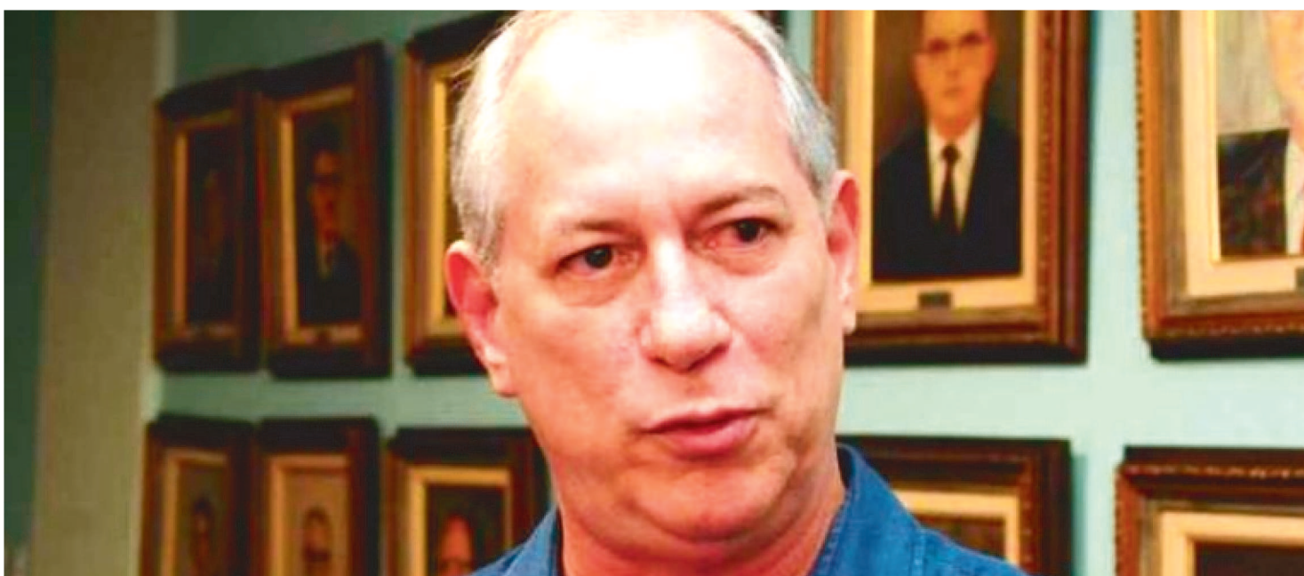
BRIGA PELO FIM DO MOTIM CONTINUOU APÓS CIRO GOMES PUBLICAR VÍDEO AFIRMANDO QUE SEU GOVERNO "TRIPlicOU O EFETIVO"

O ex-ministro Ciro Gomes (PDT) e o ministro da Justiça e Segurança Pública Sérgio Moro protagonizaram troca de farpas pelas redes sociais envolvendo o fim do motim de policiais militares no Ceará, determinado na noite de domingo, após acordo firmado entre os agentes e os três poderes do estado.