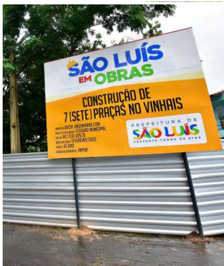
Ontem já foram iniciadas obras de sete praças no bairro do Vinhais