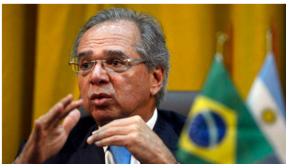
“Vamos lançar uma camada de proteção aos autônomos”, anunciou o ministro da Economia, Paulo Guedes

“Pessoas que estão desassistidas. Não estão no Cadastro Único, não estão no Bolsa Família, não recebem BPC. Uma turma valente que está sobrevivendo sem ajuda do estado e agora precisa de recurso”, afirmou Guedes, lembrando que essas atividades informais devem sofrer uma queda abrupta neste momento de contenção do Covid-19, já que as pessoas estão sendo