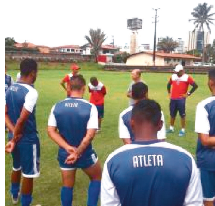
O MAC SUSPENDEU ATIVIDADES DOS PROFISSIONAIS E DA BASE

O Maranhão Atlético Clube decidiu, após reunião com a diretoria e comissão técnica, suspender todos os treinamentos da equipe profissional e das categorias de base por um período inicial de 15 dias.