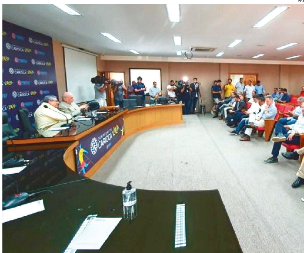
OS CLUBES SE REUNIRAM COM A FEDERAÇÃO CARIOCA, MAS NADA FOI RESOLVIDO

Entre os clubes com mais jogadores em fim de contrato estão: Madureira, com 19 atletas com contrato até 28 de abril, mais dois até 31 de março, Resende (12 até 30 de abril, mais nove até 31 de março), Macaé (20 até 29 de abril), e América, que disputa o grupo Z, para definir rebaixados e classificados em outro torneio da Ferj até a Seletiva do Carioca 2021.