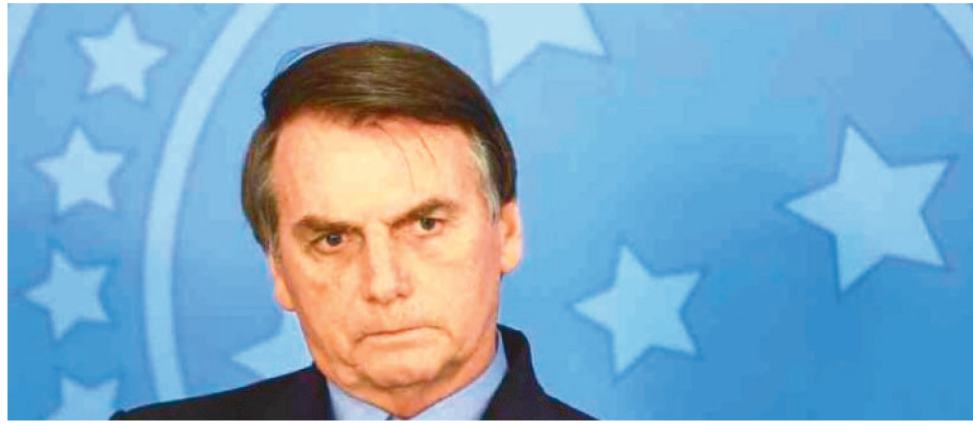
JAIR BOLSONARO PEDIU O RECONHECIMENTO ATÉ 31 DE DEZEMBRO DE 2020

"O choque adverso inicial nas perspectivas de crescimento do mundo esteve associado à desaceleração da China, que foi profundamente agravada pelo início da epidemia. Por concentrar quase um quinto do PIB mundial e ser destino de parcela substan-