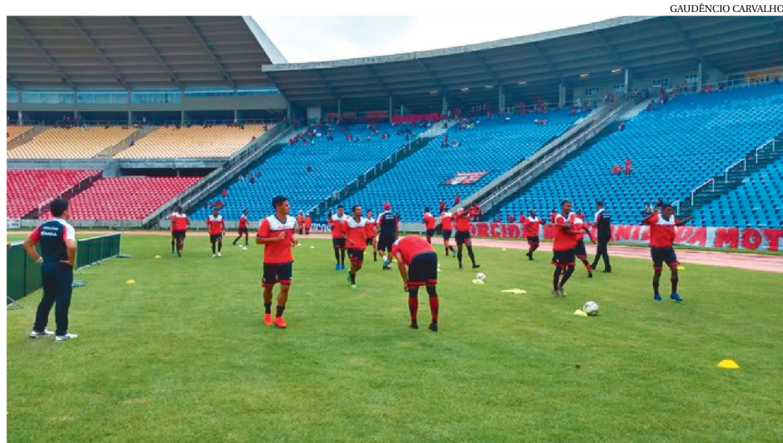
O TIME SE REAPRESENTOU NA MANHÃ DE ONTEM PARA DAR CONTINUIDADE AOS TREINAMENTOS

Após uma reunião geral no Moto Club, entre a diretoria e comissão técnica, ficou definida a manutenção das atividades do elenco profissional e a liberação dos atletas de base.