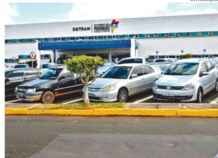
A NOVA ROTINA VALE PARA TODOS OS DETRANS DO PAÍS

O Departamento Estadual de Trânsito do Maranhão (Detran-MA) vai simplificar procedimentos para habilitação de condutores e prorrogar prazos durante a epidemia do novo coronavírus, o Covid-19.