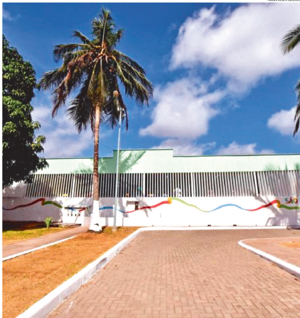
CENTRO DE SAÚDE CLODOMIR PINHEIRO COSTA, NO ANJO DA GUARDA, TERÁ VACINAÇÃO