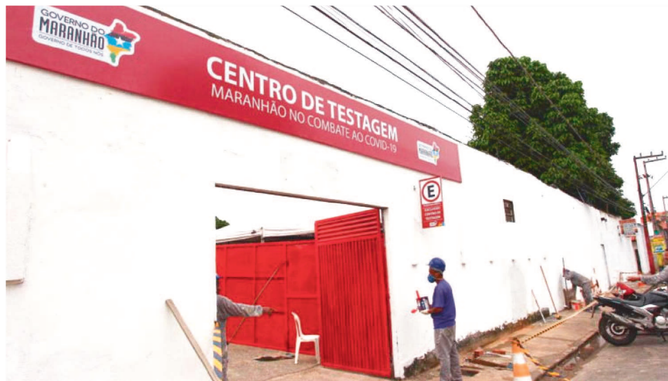
NOVO CENTRO DE TESTAGEM NA UNIDADE VIVA BEIRA MAR, NA ENTRADA DA LATERAL

“Estamos qualificando e ampliando a rede assistencial de saúde em todas as regiões do Maranhão. Reuni com diretorias das unidades regionais e macrorregionais e em todas estas re-