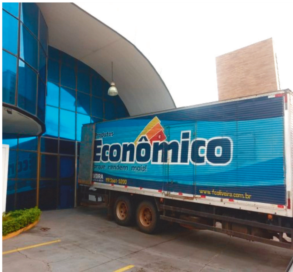
FAMEM DISTRIBUIRÁ ÁLCOOL EM GEL PARA MUNICÍPIOS MARANHENSES

Os critérios de distribuição do material estão sendo discutidos pelo comitê. Mas é consenso que todos municípios menores irão receber quantidades compatíveis com o público atendido. O álcool em gel, em falta no mercado brasileiro, vai abastecer unidades de saúde dos municípios e