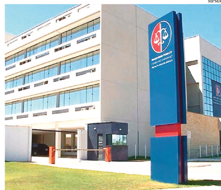
MEDIDA FOI ADOTADA PARA CONTER SURTO DO CORONAVÍRUS