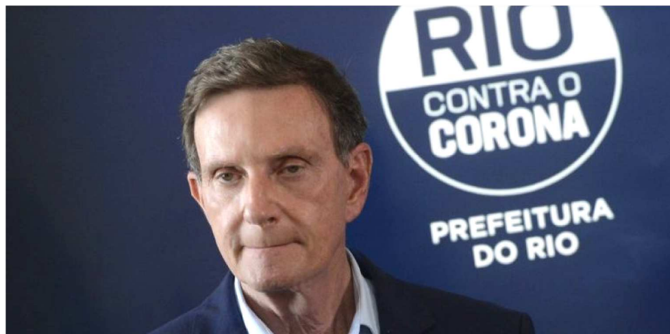
O OBJETIVO É DIMINUIR A EXPOSIÇÃO DOS IDOSOS AO RISCO DE CONTAMINAÇÃO

Moradores de rua Além disso, estão sendo preparados três abrigos para moradores de rua, um no Sambódromo, outro no Santo Cristo e um terceiro em Honório Gurgel. “É importante nesse momento que eles também tenham suas locomoções supervisionadas, para que a