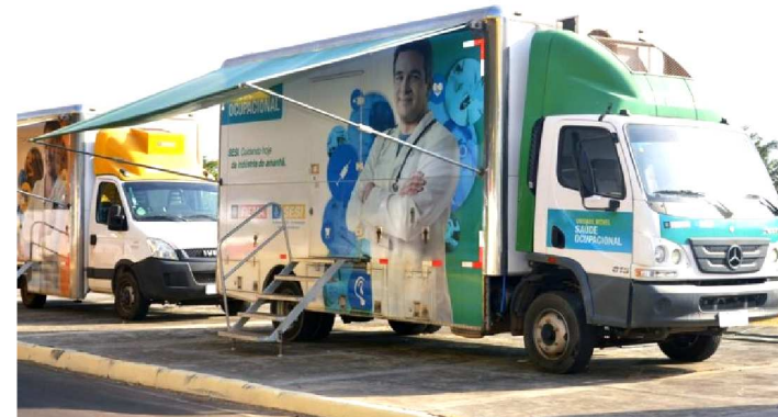
PARA USO NA VACINAÇÃO H1N1 E AÇÕES CONTRA O COVID-19