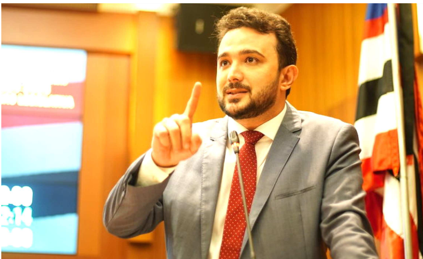
A MESMA SUGESTÃO FOI PROTOCOLADA PARA O PREFEITO DE SÃO LUÍS, EDIVALDO HOLANDA JR (PDT) E PARA A FAMEM

A linha de frente do combate ao novo coronavírus são os profissionais de saúde. Do porteiro das unidades de saúde aos médicos, os profissionais estão executando o Plano Estadual de Contingência para evitar um avanço agressivo do Covid-19 no Maranhão.