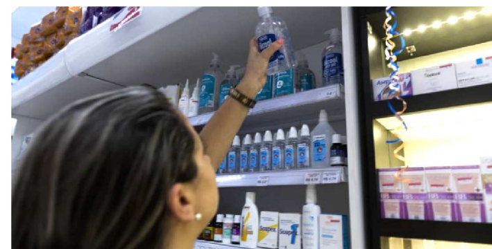
FAZER ÁLCOOL EM GEL EM CASA É INEFICAZ E PERIGOSO

Dois ingredientes, um custo muito menor e o mesmo resultado. Essa é a promessa de vídeos e tutoriais da internet sobre o álcool em gel caseiro que, na propaganda, seria tão eficaz quanto o industrial como método de prevenção ao coronavírus.