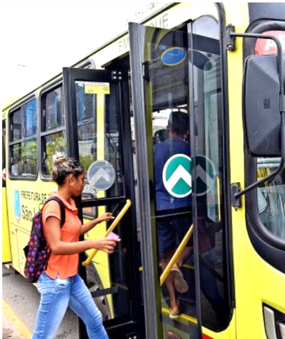
TRANSPORTE PÚBLICO É UM DOS PRINCIPAIS PROBLEMAS PARA CONTÁGIO DA DOENÇA

Ele disse ainda que na próxima segunda-feira será realizada uma reunião dos sindicatos patronal e de trabalhadores com gestores da Secretaria Municipal de Trânsito e Transporte, para debater a probabilidade da redução da frota dos ônibus que servem a população da capital, e na terça-feira a reunião será com a Agência de Mobilidade-MOB, quando será tratada a redução da frota que serve o transporte intermunicipal. Em ambas reuniões serão tratadas, também, formas de evitar a superlotação dos ônibus.