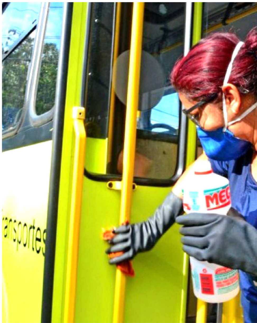
EMPRESAS ESTÃO ADOTANDO CUIDADOS DE HIGIENE NO TRANSPORTE COLETIVO

O motorista do aplicativo Uber, cuidam de adquirir o material de limpeza de seus carros e de sua proteção pessoal, porém, o motorista que apresentar sintomas relacionados à contaminação pelo vírus, deve comunicar à direção da empresa que bloqueia sua