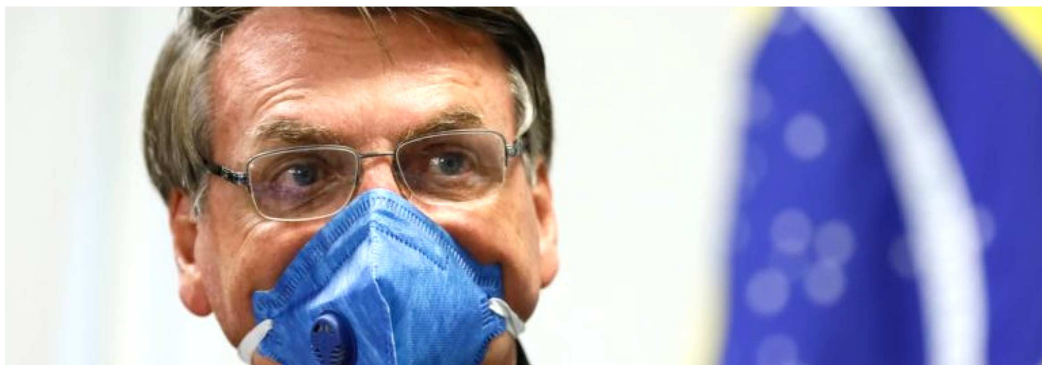
A MEDIDA PROVISÓRIA 926/2020 CRIA CONDIÇÕES PARA INTERRUPTÃO DE LOCOMOÇÃO INTERESTADUAL E INTERMUNICIPAL

O presidente Jair Bolsonaro editou um decreto e uma medida provisória que garantem ao Governo Federal a competência sobre serviços essenciais, entre os quais a circulação interestadual e intermunicipal. De acordo com o governo, os dispositivos têm como objetivo “harmonizar as ações de enfrentamento à pandemia do novo coronavírus”.