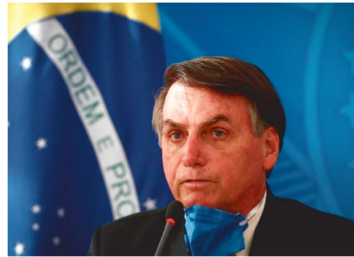
NA CRISE, GOVERNO CONTRATA EMPRESA DE MÍDIA DIGITAL

Em meio à crise do coronavírus, a Secom (Secretaria Especial de Comunicação Social) da Presidência da República contratou, por R$ 4,8 milhões e sem licitação, uma nova agência de comunicação para tocar as mídias sociais do governo.