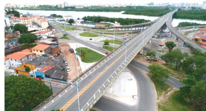
OBRA POSSUI ÁREA TOTAL DE 1.887 M² NA ÁREA DA CAMBOA

Já está disponível para a população um novo e seguro espaço para estacionar veículos nas proximidades do Hospital Universitário Presidente Dutra. Trata-se do Estacionamento Genivaldo Silva, obra do Governo do Maranhão, por meio da Agência Executiva Metropolitana (AGEM), em parceria com a Prefeitura de São Luís.