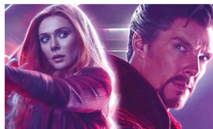
A CONTINUAÇÃO DO FILME DEVE ACONTECER EM JUNHO

"Doutor Estranho 2" não deve sofrer atrasos por causa da pandemia do novo coronavírus. Segundo a Variety, a continuação do filme da Marvel está "nos trilhos" para começar filmagens em junho, data planejada desde o começo da produção.