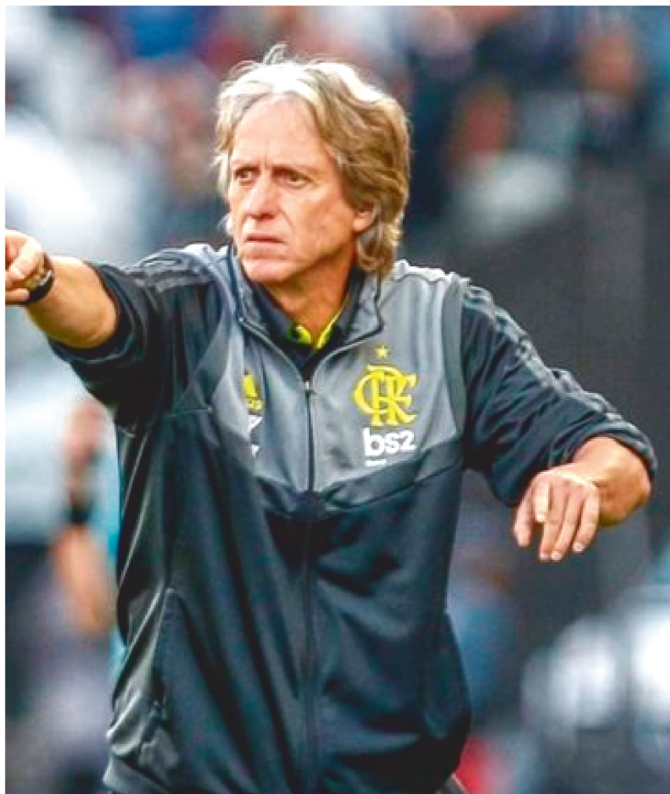
CORONAVÍRUS ATRAPALHOU NEGOCIAÇÕES DO TREINADOR COM O FLAMENGO

Com a paralisação do futebol, Jorge Jesus ficou sem um bom trunfo. O seu compromisso com o Flamengo se encerraria quase simultaneamente ao fim da temporada europeia, que devido à pandemia de coronavírus, obviamente não acabará neste momento. Com isso, não coincidirão o fim do contrato e o aquecimento do merca-