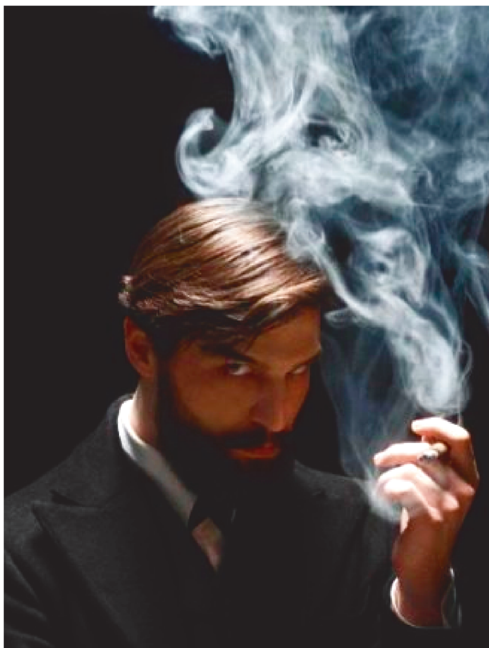
A SÉRIE "FREUD" FOI GRAVADA EM PRAGA, CAPITAL DA REPÚBLICA TCHECA