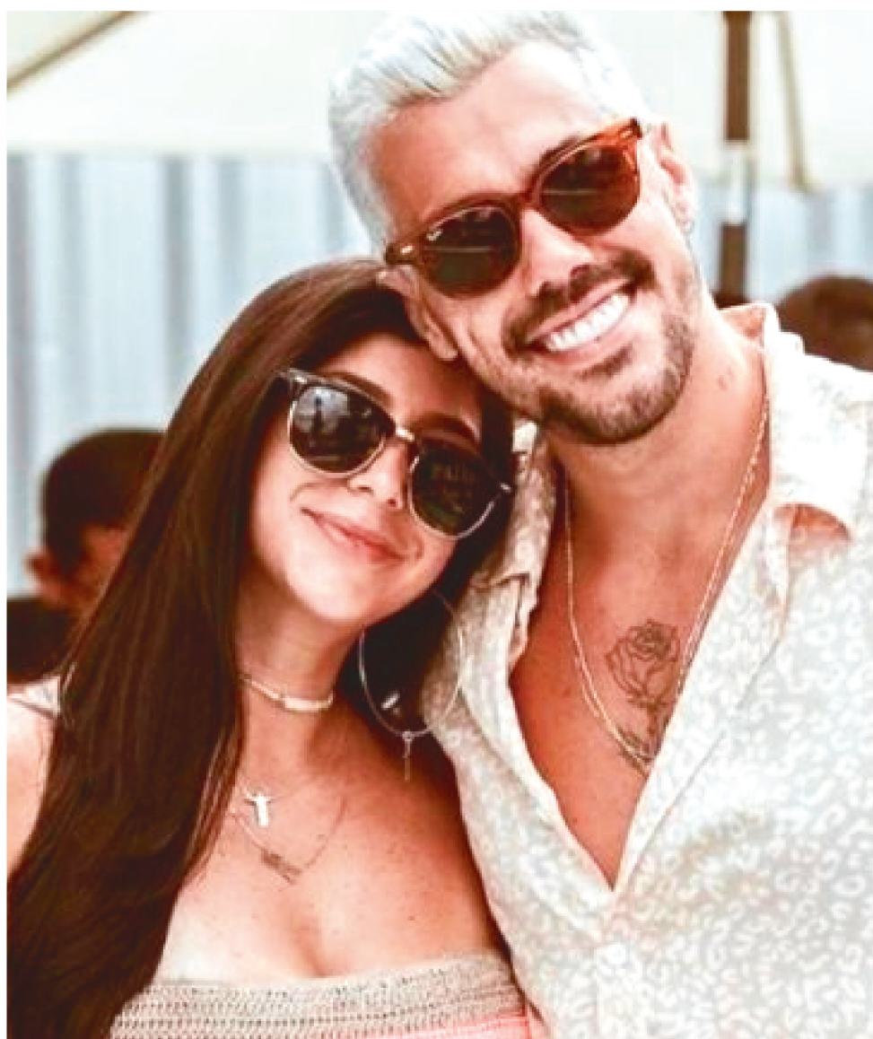
YÁ E LIPE FORAM PARTICIPANTES DO REALITY "DE FÉRIAS COM O EX"

Como o reality show é de confinamento, muitos dos participantes já tinham aberto mão ou adiantado alguns trabalhos para passar até três meses em Itaipericica da Serra, no in-