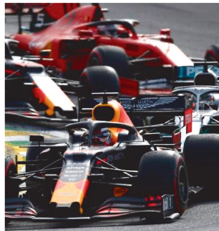
O MUNDIAL DE F-1 NÃO TEVE QUALQUER ETAPA EM 2020

Um grupo de sete equipes da Fórmula 1 que tem fábricas no Reino Unido, irão disponibilizar as instalações para a produção de equipamentos médicos, como respiradores, que podem ser utilizados no tratamento de pacientes diagnosticados com o novo coronavírus.