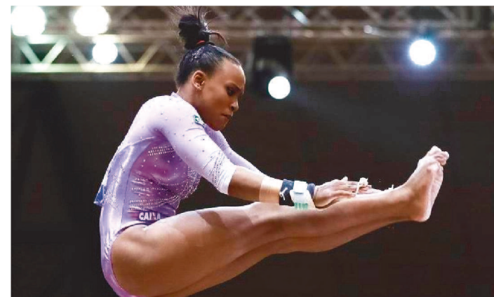
REBECA ANDRADE EM AÇÃO NO MUNDIAL DE GINÁSTICA

O adiamento dos Jogos Olímpicos de Tóquio, anunciado na terça-feira (24) pelo Comitê Olímpico Internacional (COI) e pelo governo japonês, foi recebido com alívio pelo COB (Comitê Olímpico do Brasil), que ainda espera a definição das novas datas para começar a redefinir o planejamento de olho no evento.