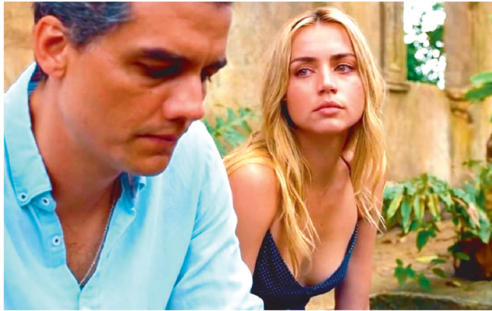
WAGNER MOURA E ANA DE ARMAS EM CENA DO FILME "SÉRGIO"