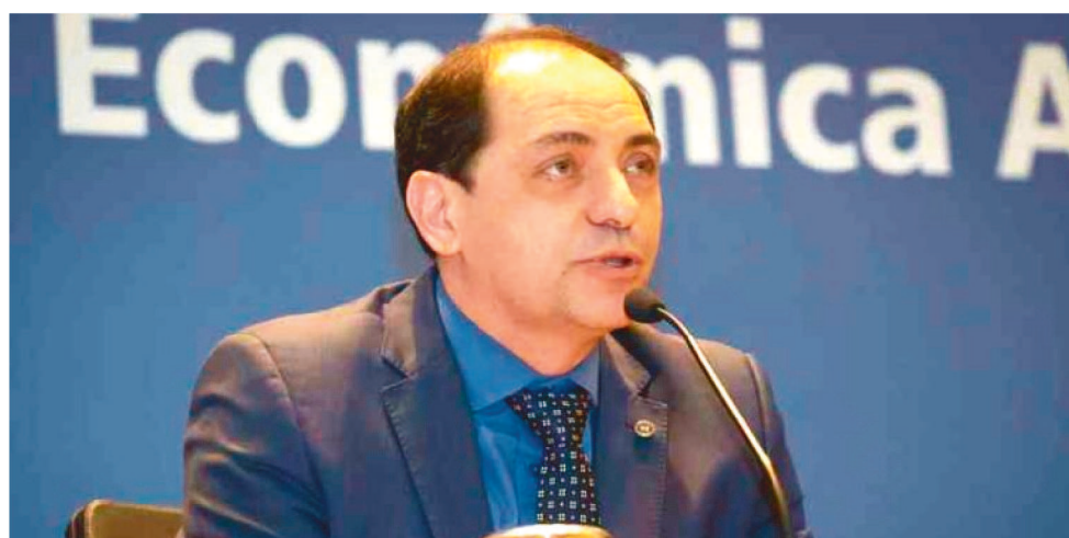
SECRETÁRIO DA FAZENDA DO MINISTÉRIO DA ECONOMIA, WALDERY RODRIGUES

O secretário-executivo do Ministério da Economia, Marcelo Guarany, acrescentou que “se dá recursos demais para os estados e municípios, além do necessário ao combate à doença, não vai ter recursos para dar à manutenção do emprego e ao amparo aos vulneráveis”. Diante da magnitude da crise, ele lembrou que todos vão ter prejuízos. “Todos vamos perder arrecadação. Não é possível que o povo pague todas as perdas depois”, afirmou Guarany.