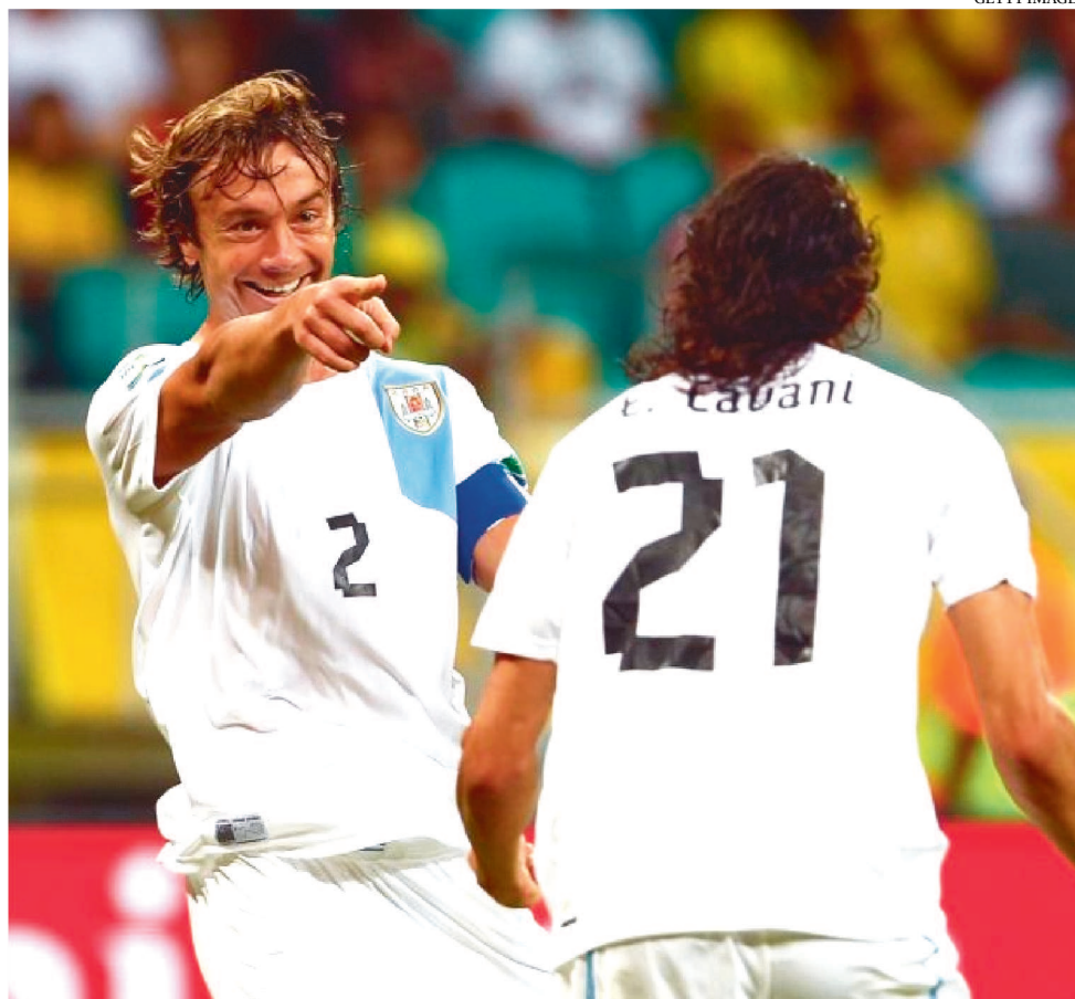
ATÉ HOJE CAVANI SE REFERE A LUGANO COMO "CAPITÃO" POR CONTA DA SELEÇÃO

Hoje não há condição financeira de o Tricolor bancar um investimento