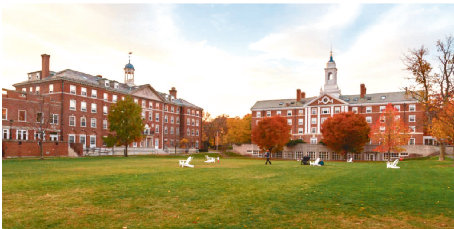
A UNIVERSIDADE HARVARD É UMA DAS INSTITUIÇÕES DE ENSINO MAIS CONHECIDAS

Um único período de confinamento não irá pôr fim à novela do novo coronavírus, e períodos repetidos de distanciamento social podem ser necessários até 2022, para evitar que os hospitais fiquem sobrecarregados, advertiram nesta terça-feira cientistas de Harvard que estudaram a trajetória da pandemia.