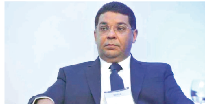
MANSUETO ALMEIDA É SECRETÁRIO DO TESOUREIRO NACIONAL

O secretário do Tesouro Nacional, Mansueto Almeida, defendeu, ontem (14), o congelamento de salários de servidores públicos por alguns anos. A medida, na opinião dele, é justificável em tempos de crise, como o vivido hoje devido à pandemia de coronavírus. Como não haverá corte na remuneração, ele acredita que o cenário é melhor do que o observado na iniciativa privada, que pode diminuir salários. Mansueto comentou o assunto em live promovida pelo Jota.