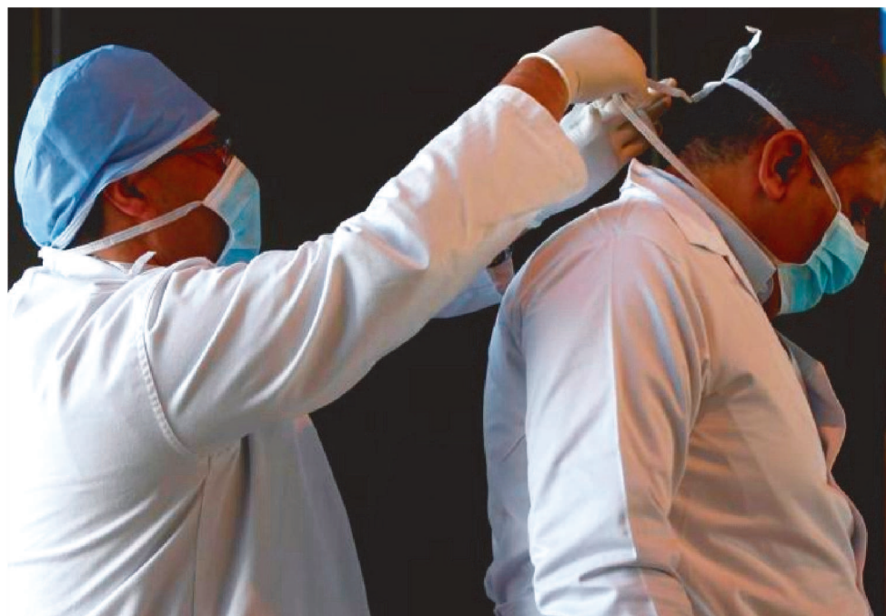
USO DE MÁSCARAS TEM CRESCIDO NO MARANHÃO E AUMENTOU A DEMANDA