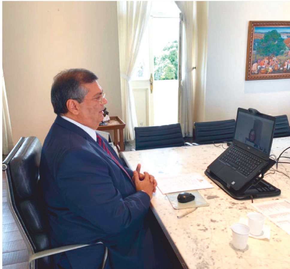
FLÁVIO DINO PEDE A UNIÃO DE ESTADOS, MUNICÍPIOS E GOVERNO FEDERAL

Para enfrentar a crise, o governador Flávio Dino pede a união de estados, municípios e Governo Federal, em torno de uma agenda de controle da pandemia, que garanta a aquisição de insumos, a efetividade das medidas sociais, proteção de empregos e em-