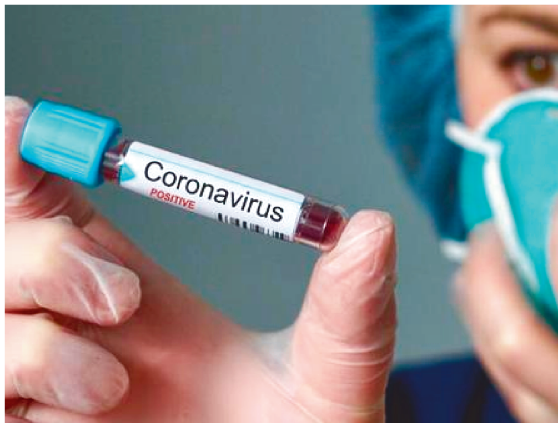
OS SERVIDORES DA SAÚDE ESTADUAIS E MUNICIPAIS TERÃO LOCAIS ESPECÍFICOS DE TESTAGEM