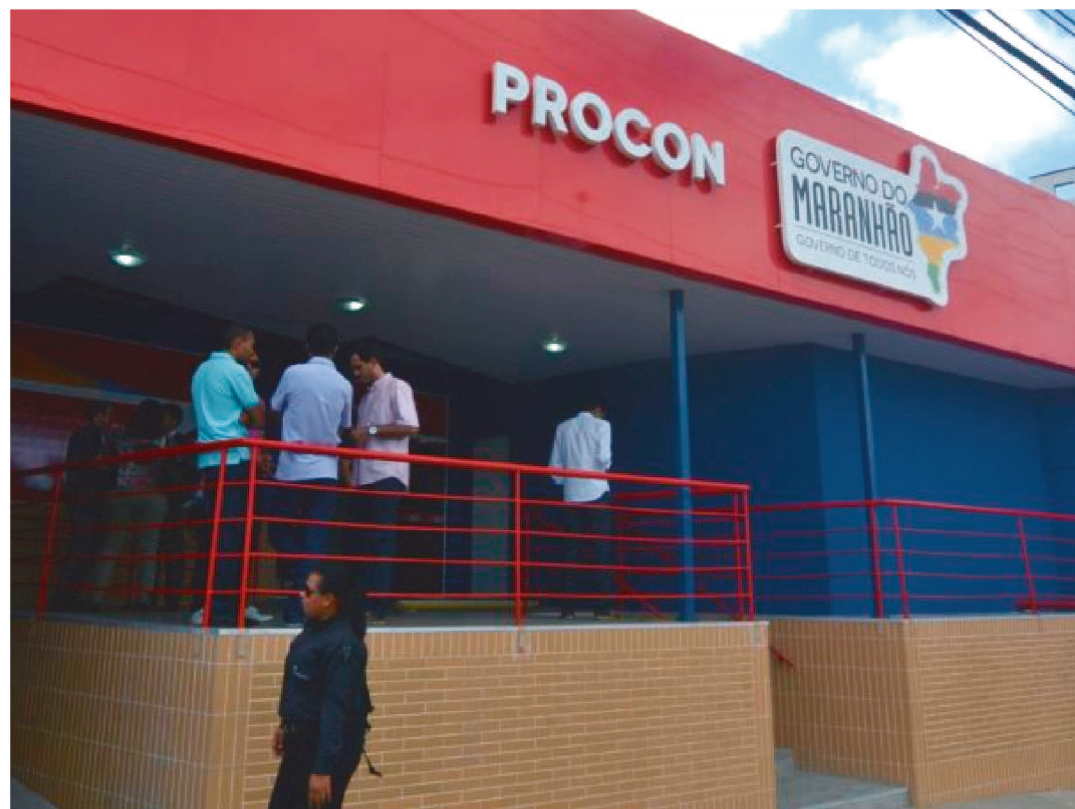
RECOMENDAÇÕES FEITAS PELO PROCON PARA OS COMERCIOS QUE ESTIVEREM ABERTOS

O Procon/MA recomendou, formalmente, as medidas que devem ser adotadas na prestação de serviço de estabelecimentos comerciais autorizados a funcionar durante o período de isolamento social em todo o estado. As medidas atendem às determinações dos Decretos Estaduais nº 35.677, de 21 de março, nº 35.714, de 03 de abril, e nº 35.731, de 11 de abril de 2020.